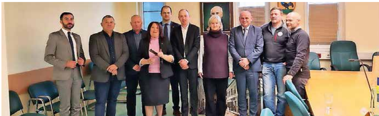
Prijazen sprejem bolgarskih gostov na sedežu Občine Kranjska Gora

ogled tekme za Pokal Vitranc, želeli pa so se seznaniti tudi s strategijo poletnega turizma v občini Kranjska Gora. Sogovorniki so se na srečanju dotaknili različnih tem, izmenjali so si predvsem informacije na področju turizma in gorskega reševanja v obeh državah. Kot so povedali, je, kljub temu da je tekma odpadla, obisk dosegel svoj namen.