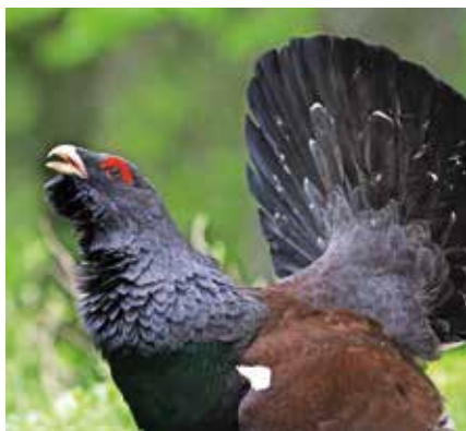
Divji petelin / Foto: Tomaž Mihelič

Kaj lahko obiskovalci naredimo za ohranitev divjega petelina na grebenu Vitranca? Greben Vitranca obiskujemo samo poleti ali jeseni. Hodimo in smučamo samo po označeni poti. Smo čim bolj tihi. Pse vodimo na povodcu. Petelin nam bo hvaležen!