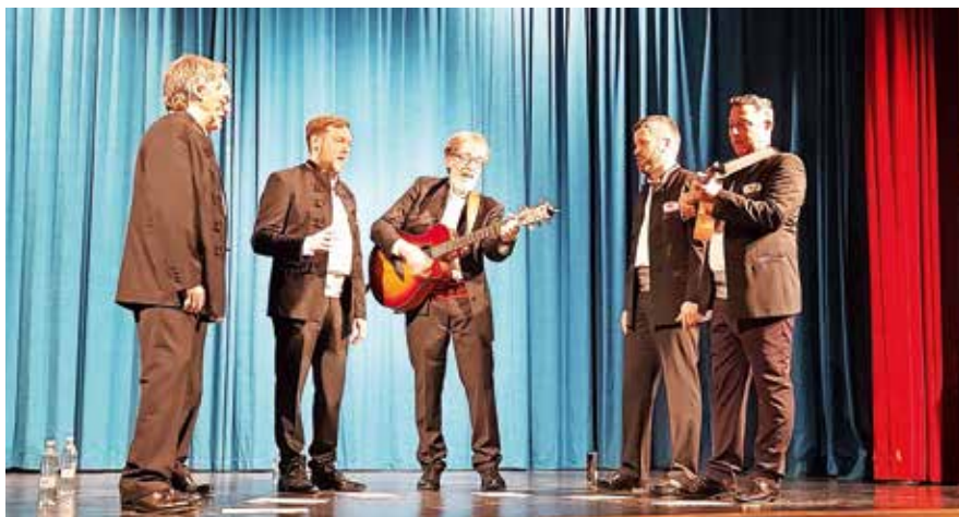
Člani klape Zvonimir z Baške na Krku

Turistično društvo Dovje - Mojstrana je tudi letos pripravilo dalmatinski večer. V goste so povabili prijatelje, člane klape Zvonimir iz Baške na Krku, ki so poskrbeli za to, da so misli zbranih v Aljaževem prosvetnem domu na Dovjem odtavale v toplejše kraje, proti morju in soncu. »Zdaj že tradicionalni glasbeni dogodek bogati kulturno delovanje našega kraja in društva. Turistično društvo si namreč prizadeva, da bi s svojim vsestranskim delovanjem in tradicionalnimi prireditvami negovalo in bogatilo našo kulturno dediščino, nas zblíževalo ter povezovalo v akcijah za razvoj kraja. Tako kot mi si tudi Baščani prizadevajo za ohranjanje tradicije in običajev. Dalmatinske, primorske in otoške klape skrbno ohranjajo starožitne melodije, v njih uživajo in jih podarjajo vsem tistim, ki jim je petje všeč,« so sporočili iz društva in dodali, da se zahvaljujejo družinam Kotnik in Višnar za nočitev in pogostitev. K. S.