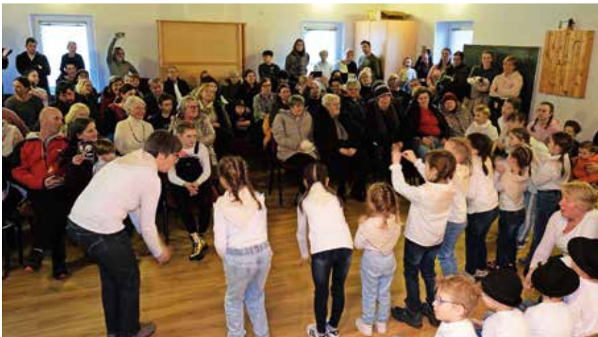
Prireditev je bila instrumentalno, pevsko in plesno obarvana.