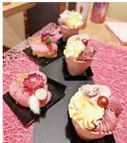
Gostjam so ponudili tudi sladke dobrote.

čeru so jim postregli še s samopostrežno večerjo, ki jo tudi sicer v Casinoku Larix organizirajo vsak petek. »Vsaki gostji igralnega salona smo na ta dan podarili tudi brezplačni igralni listič,« so še povedali gostitelji.