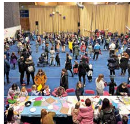
Veseli pust širokih ust v dvorani Vitranc