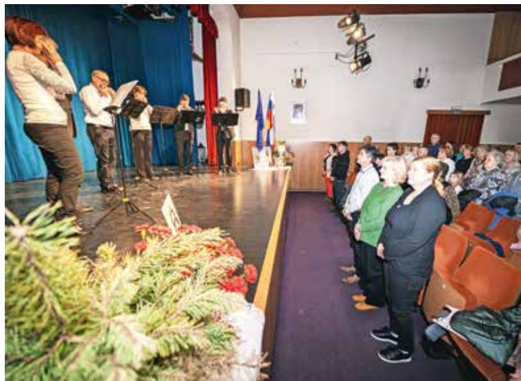
Zdravljica v izvedbi Sorških orgličarjev

Na odru se je razgrnilo več umetnosti, s katerimi si plemenitimo življenje. Ena teh je slikarstvo. Že Aljaž je v dvorani, ki jo je predelal iz Govočevega hleva, dal nasli-