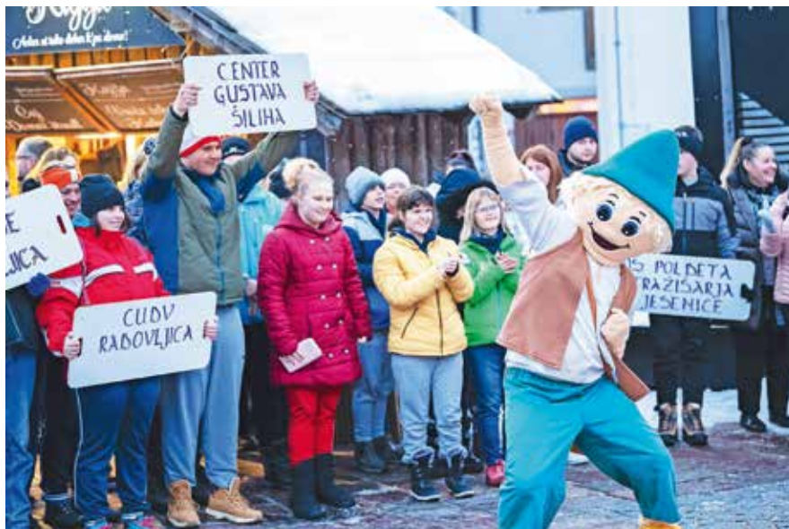
Kekec je poskrbel za zabavno vzdušje, saj je s svojimi vragolijami spravil v smeh tudi tiste, ki so svoje misli osredotočali na prihajajoče tekmovanje.