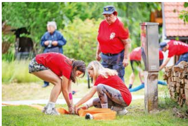
Gasilska mladina je izvedla tridelni napad v dveh smereh.