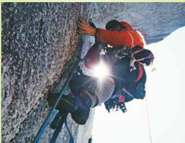
Pleza Miha Smolej

Si želite na Triglav, pa tega ne zmorete ali nimate prave opreme? Nič ne de, za vas imamo pripravljen virtualni vzpon na najvišjo slovensko goro in virtualni spust po jeklenici. Pristali boste prav pred našim muzejem.