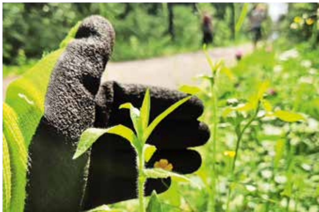
Akcija čiščenja ob kolesarski stezi na Belci

V občini Kranjska Gora so se akcije, kjer so odstranjevali invazivne tujerodne rastline ob kolesarski poti na območju Belce, udeležili štirje prostovoljci, koordinator in županja. Akciji so se pridružile Eko Rutaršce, ki so se lotile tujerodnih rastlin tudi v Rutah (več o tem pa v naslednjem Zgornjesavcu).