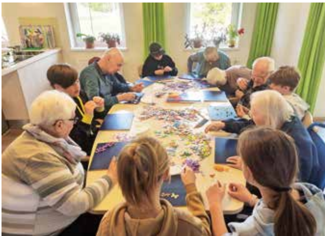
Letošnja tema je bila pomlad