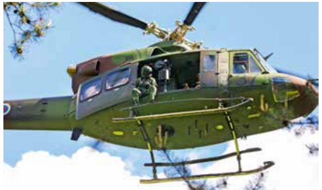
Prikaz reševanja je potekal v ferati Havadnik.

Na prvi petek in soboto v juniju so v kongresnem centru hotela Špik v Gozdu - Martuljku potekali 24. Ažmanovi dnevi, simpozij urgentne, gorske in družinske medicine, ki je potekal pod organizacijskim vodstvom Osnovnega zdravstva Gorenjske – OE Zdravstveni dom Trzič in Gorske reševalne zveze Slovenije (GRZS). Udeležili so se ga predvsem urgentni in družinski zdravniki ter člani njihovih timov (sestre, zdravstveniki, reševalci), zdravniki in drugi medicinci GRZS ter Helikopterske nujne medicinske pomoči (HNMP), ki so imeli na voljo številna predavanja o aktualnih zdravstvenih temah ter tudi temah, ki so na drugih strokovnih srečanjih pogosto v manjšini. Simpozij je bil namenjen tudi počastitvi dvajsetih let HNMP Slovenije. V ferati Havadnik so demonstrirali helikoptersko reševanje, v katerem sta sodelovala vojaški in policijski helikopter, prikazali pa so oskrbo osebe v anafilaktičnem šoku in osebe po padcu v steni. N. T.