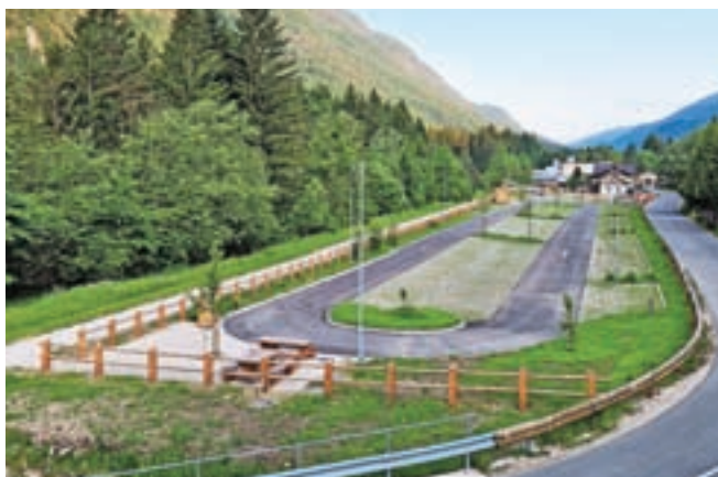
Na novem parkirišču v Mojstrani bo parkomat – tako kot na drugih plačljivih javnih parkiriščih v občini.