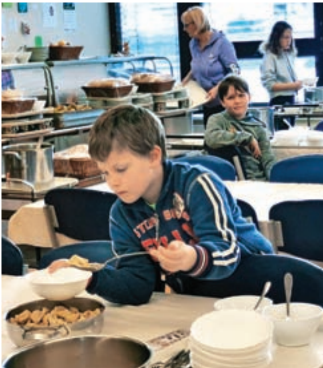
Učenci so z veseljem pokusili žlikrofe.

Dogajanje je obogatila razstava pred jedilnico, na kateri so prikazali, po čem je znana Idrija. Poleg žlikrofov so poudarili idrijsko čipko in rudnik živega srebra.