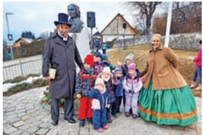
Pred Prešernovim spomenikom v Vrbi