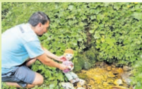
Le kaj nam jo bo tokrat hudomušnega zagodel Planinko, maskota Slovenskega planinskega muzeja

Počitnice se približujejo z neizmerno hitrostjo. Ker bi bili v Slovenskem planinskem muzeju tudi med njimi radi z vami, smo za vas pripravili pester petdnevni program planinskih dejavnosti sredi gorske narave. Če želite preživeti pet aktivnih dni sredi gora, pod vrhom Begunjščice in v bližini Zelenice, če vam je užitek spoznavanje, opazovanje in odkrivanje narave, vas vabimo v našo družbo.