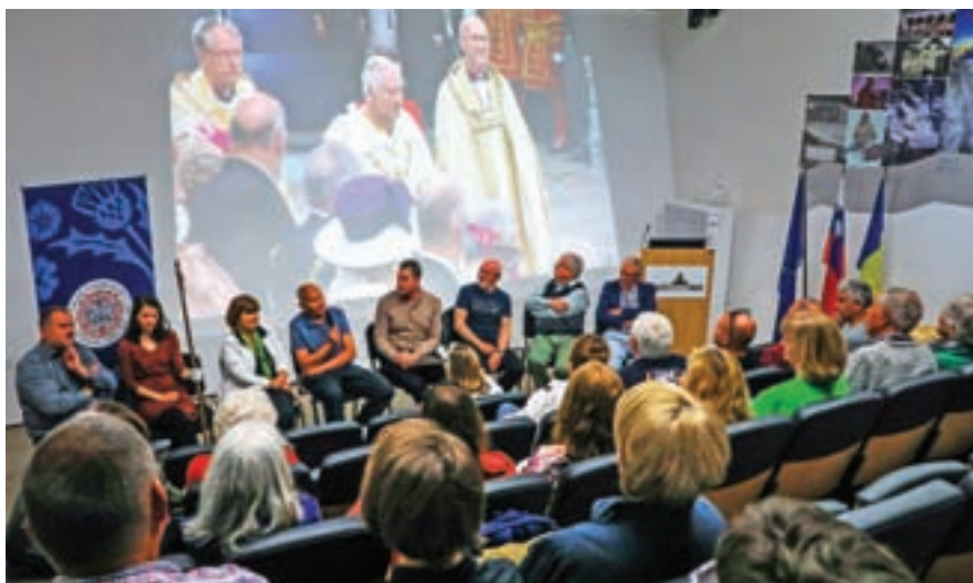
Sodelujoči na okrogli mizi so podelili spomine na obisk takratnega princa Charlesa.

Ob kronanju kralja Karla III. v soboto, 6. maja, sta britansko veleposlaništvo in Slovenski planinski muzej v Mojstrani pripravila dogodek, ki je obudil del poti takratnega princa Charlesa pred 25 leti. Ob tem so poudarili vrednote novega kralja, kot so skrb za skupnost, ekologija, trajnostni razvoj in prostovoljstvo; vezi, ki ga povezujejo s Slovenijo.