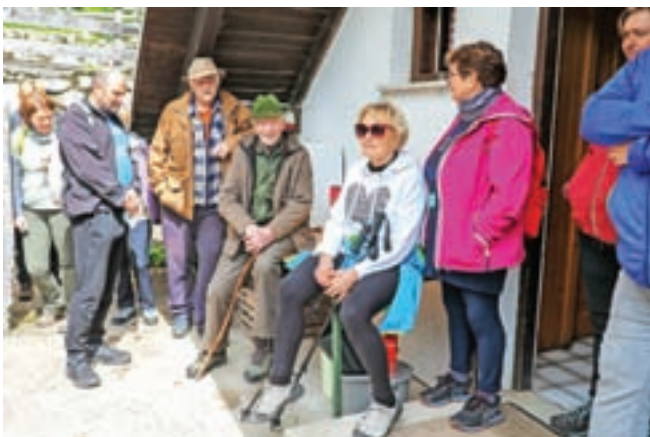
Druženje so sklenili v gasilskem domu v Srednjem Vrhu.