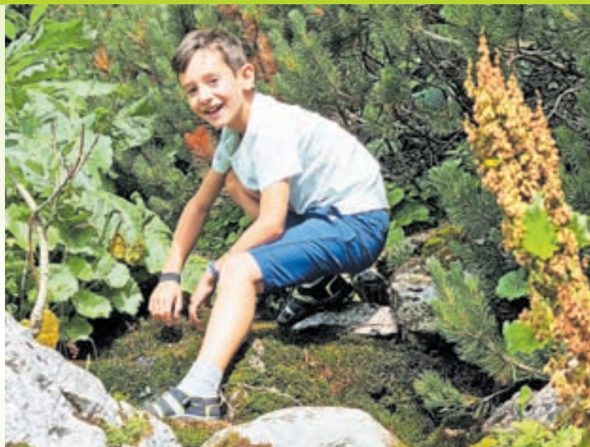
Priprave na osvežujočo pustolovščino na počitniškem taboru v koči pri izviru Završnice sredi neokrnjene narave

Izjemno bogat in raznolik program počitniškega tabora v koči pri izviru Završnice bo potekal od 3. do 7. julija in je namenjen otrokom od 10. do 14. leta starosti. Organizatorji smo se zares potrudili in pripravili pester nabor nepozabnih aktivnosti. Vsako jutro bomo ponosno začeli dan z dvigom zastave Slovenskega planinskega muzeja.