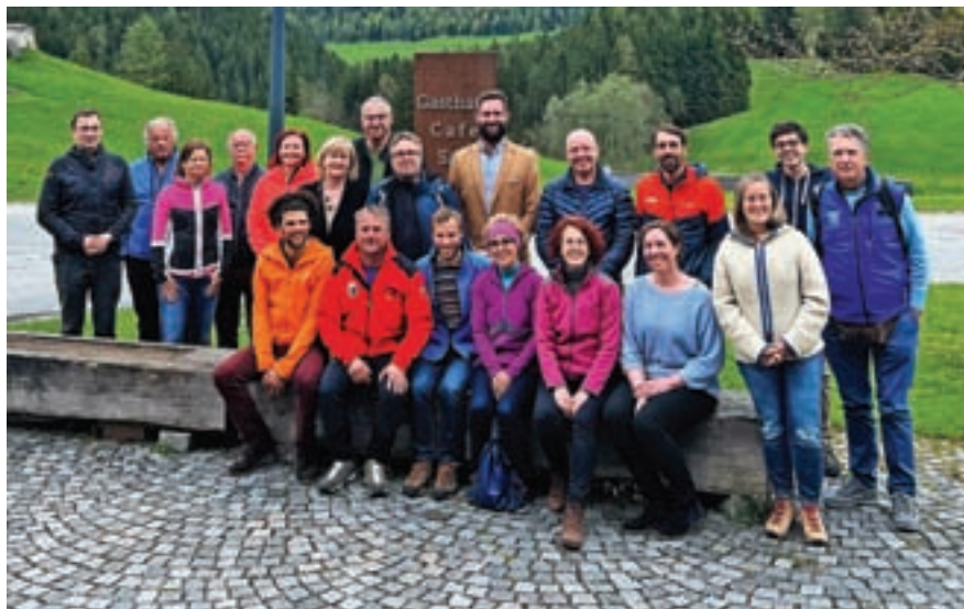
Na predstavitvi del delovne skupine iz Mojstrane skupaj s koordinatorji za Gorniške vasi