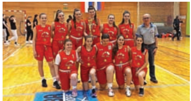
Košarkarska ekipa Kranjska Gora - Jesenice