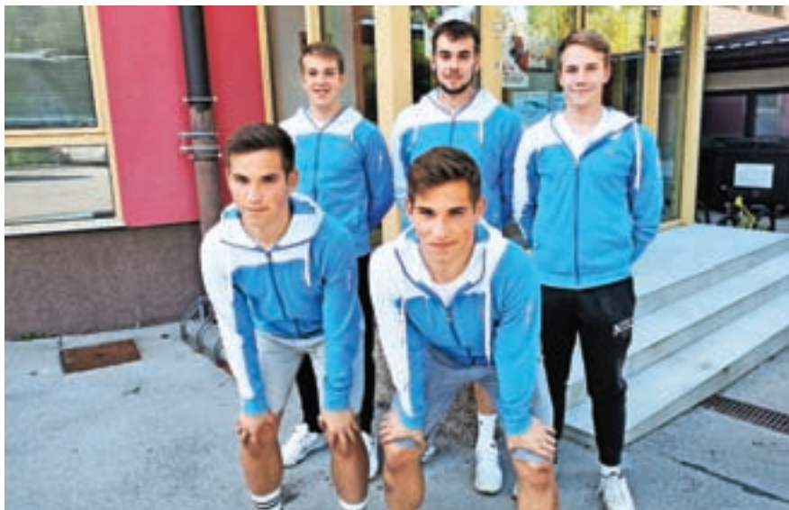
Povabljeni so bili v reprezentanco do 19 let, ki se je uvrstila na svetovno prvenstvo.