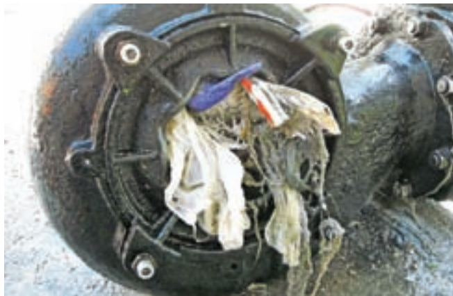
Črpalka, ki je prenehala delovati zaradi nepravilno odloženih odpadkov v fekalno kanalizacijo