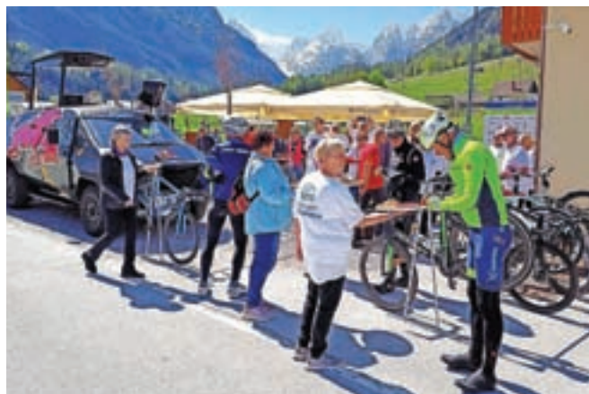
Na tretji etapi je bil sprejem kolesarjev v Kranjski Gori.