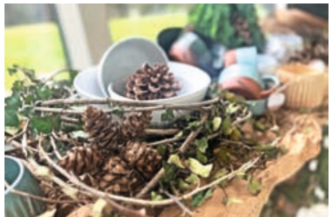
Adventna tržnica v Slovenskem planinskem muzeju

Dolino je že obiskal Miklavž. Njegov prihod vsako leto organizirajo pri KPD Josip Lavtižar Kranjska Gora. V dvorani Ljudskega doma je obiskal otroke, pred tem so imeli lutkovno predstavo Zimska pravljica v izvedbi Teatra za vse. Dvorana je bila zasedena do zadnjega kotička, Miklavž je otroke obdaroval z bonboni in čokoladami. Potem je s svojim spremstvom odšel po domovih in obiskal bolne in ostarele in jih razveselil s skromnimi darili. »Trudimo se ohranjati tradicijo. V vseh teh letih je Miklavž dobil tudi novo bolj bleščečo opravo. Ljudje so tudi obiska Miklavževega spremstva zelo veseli,« so povedali pri KPD Josip Lavtižar.