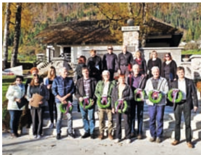
Na žalni slovesnosti na Dovjem