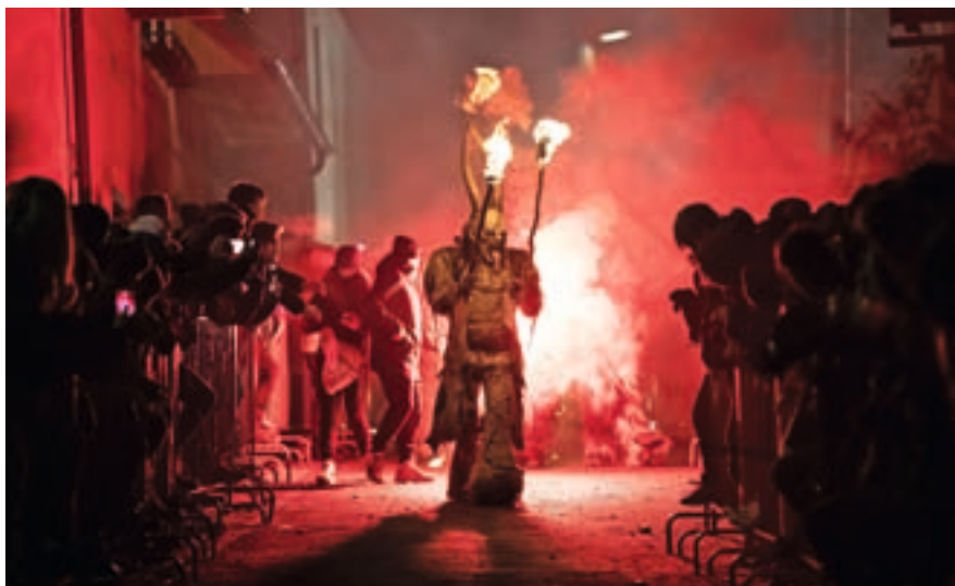
Parkeljni so mimohod opravili v velikem slogu, z baklami, ognjem, dimom in različnimi rekviziti, ki so poskrbeli za še bolj strašljivo vzdušje.

Vsako skupino peklenščkov je mogoče ločiti od druge, saj jih zaznamujejo posebnosti, povezane s kraji, iz katerih prihajajo. Podkorenski strahotneži se za razliko od drugih skupin ne