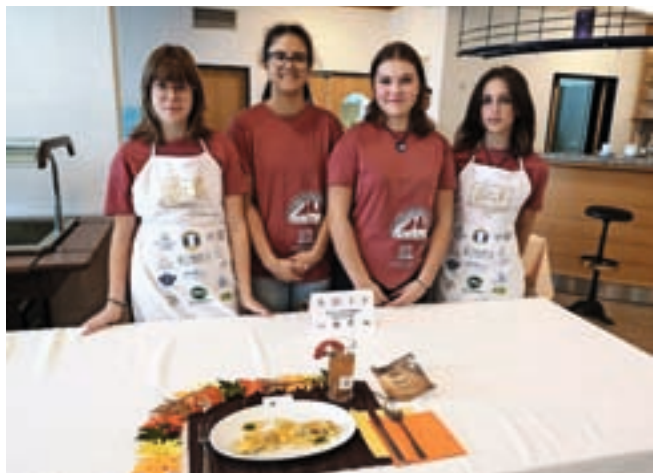
Osvojile so srebrno priznanje za zlato kuhalnico.

Turistična zveza Slovenije je letos skupaj s Turistično gostinsko zbornico Slovenije in Društvom kuharjev in slaščičarjev Slovenije že 13. organizirala tekmovanje za zla-