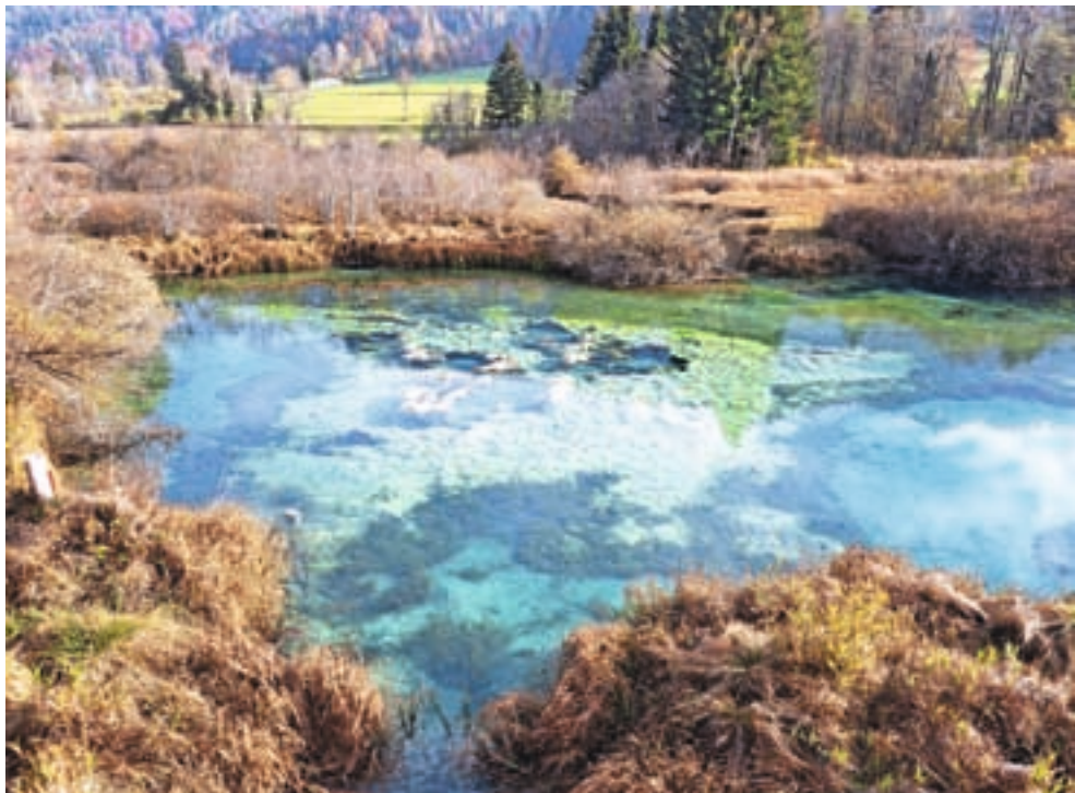
Zelenci letošnjega oktobra

Kot so še pojasnili na Zavodu RS za varstvo narave, velika večina vode v Zelence prihaja iz Planice oziroma doline Tamar. »Gre za prodno in morensko geološko podlago z veliko kapaciteto akumuliranja vode. Glede na to, da so bile pred letošnjo sušo močnejše in dolgotrajnejše padavine lani jeseni (kar je zelo dolgo obdobje za to območje), so verjetno zaloge vode v tej 'akumulaciji' pošle, Zelenci pa so ostali brez vode.« Polnjenje, kot so pojasnili, je odvisno od količine padavin, a vse skupaj lahko traja do konca pomladi prihodnje leto, pogoj pa je, da bo zima prinesla tudi sneg. Na Zavodu RS za varstvo narave upajo, da je bilo letošnje stanje enkrat ali vsaj zelo redek dogodek, a priča smo podnebnim spremembam, kjer so vsakršne napo-