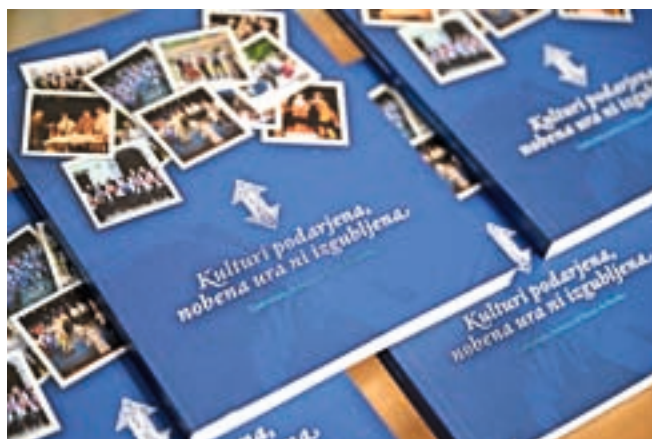
Na 172 straneh je objavljenih enaintrideset prispevkov o delovanju ljubiteljskih kulturnih društev, skupin in posameznikov.