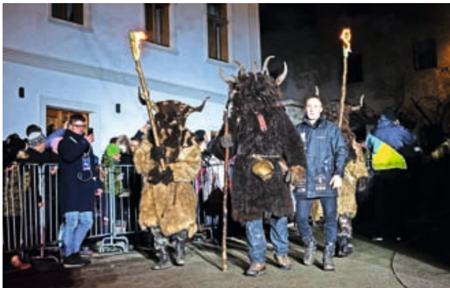
Podkorenski Trentar je prišel v spremstvu svojih peklenščkov in začel Ognjeni spektakel.