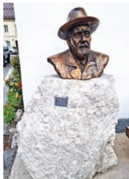
Kugyjev spomenik v Ovčji vasi