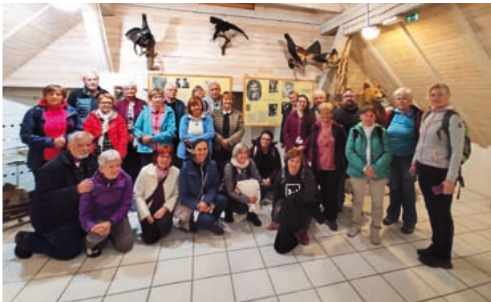
Obiskali so informacijsko izobraževalno središče TNP v Trenti.