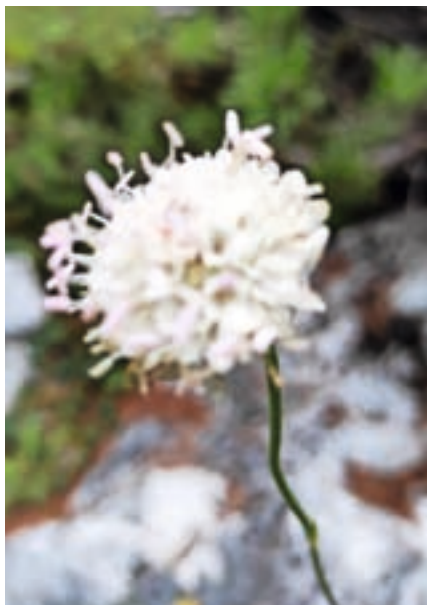
Bela obloglavka

sveta in izkušnje na lastnih planinskih izletih,« je pojasnila Štularjeva. Posameznega krožka se je udeležilo od pet do petnajst udeležencev in obiskali so kraje, ki jih Kugy opisuje v svojih delih. Junija so imeli tematski izlet »Kugyjevi gorski vodniki«, kjer so obiskali tudi rojstno vas Kugyjevega očeta Lipo na Koroškem, septembra pa »Kugy in tržaški kras«. »Znanje smo izpopolnili tudi z ogledi nadaljevanke o Kugyju, se poglobili v posamezne vsebine, problematiko, npr. ali je pravilno Prisojnik ali Prisank, obde-