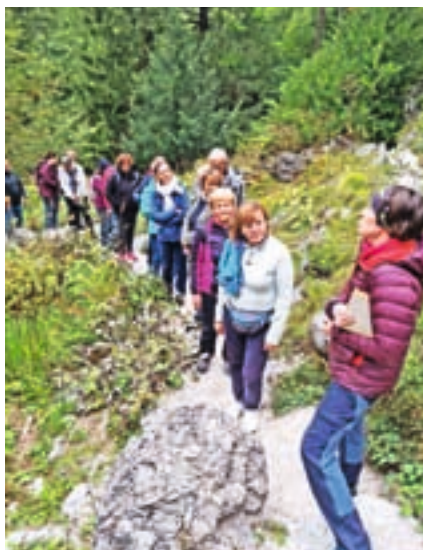
Ogled botaničnega vrta Juliana v Trenti

za našo notranjo uporabo, ampak želimo, da jo tudi naši obiskovalci večkrat obišejo.«