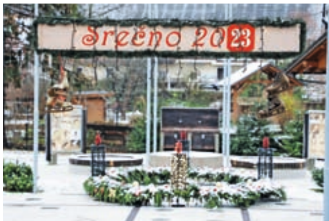
Lepo okrašen Trg olimpijcev in velik adventni venec v Mojstrani