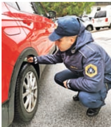
Pregled avta za zimo