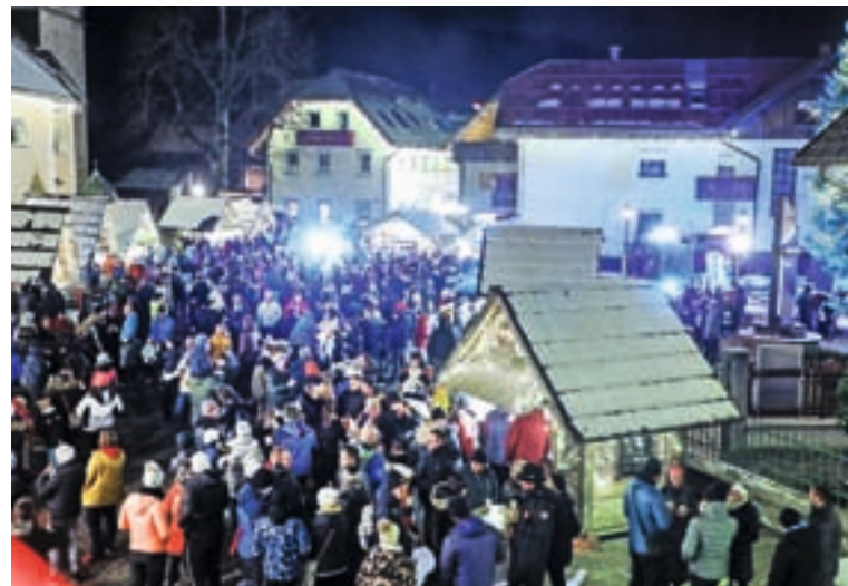
Po obdobju omejitev zaradi epidemije je prižig lučk znova potekal v družbi številnih obiskovalcev.