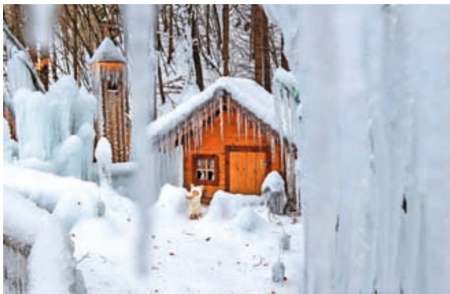
Spomin na lansko leto

Letošnje leto Ledeno kraljestvo vabi v svoj objem v novi preobleki. »Obiskovalce čakajo prenovljeni mlin, oboki, Sveta družina, tisočere prazničnih lučk, ki letos svetijo še svetleje, in prestol, s katerega lahko za trenutek zavladate Lednemu kraljestvu kot kralj(ica). Dodali smo nove fotokoti-