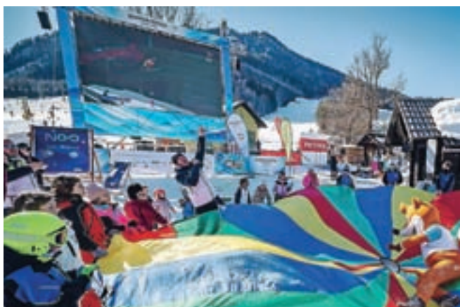
Tudi zabave ni manjkalo. Navijaško športno vzdušje je bilo prisotno ves čas, slovenski športniki so navduševali.