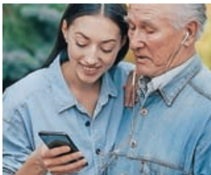
Slika je simbolična.

Zavod Dobra pot, ki ozavešča o naravni in kulturni dediščini ter skrbi za njuno ohranjanje, med 14. in 25. mar-