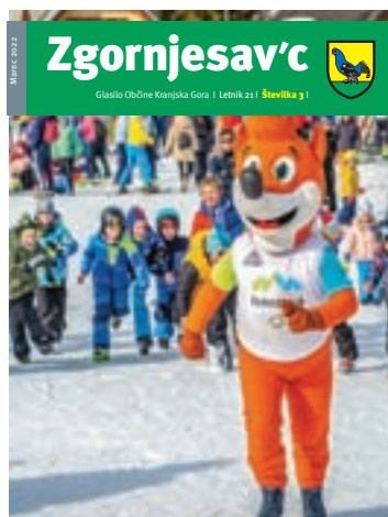
Športno-zabavno olimpijsko dogajanje na smučišču v Kranjski Gori