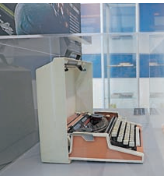
Pisalni stroj Nejca Zaplotnika