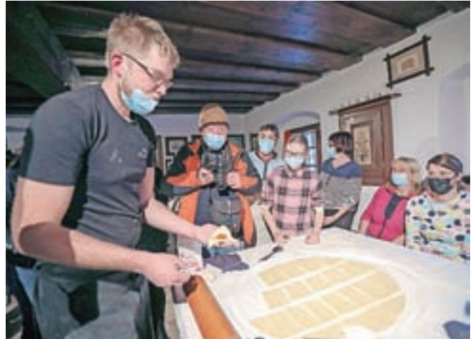
Nadevamo jih lahko z marmelado, orehi, čokolado, skuto, sadjem ...