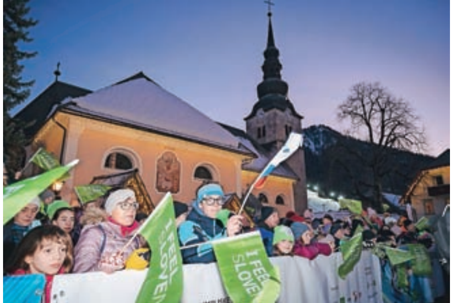
Zadnjega sprejema olimpijcev v torek, 22. februarja, so se ob sproščanju ukrepov udeležili tudi številni obiskovalci.