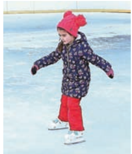
Na ledu so uživali predvsem najmlajši.

voljstvom razlaga Štravs. Zabeležili so sto prostovoljnih ur, sredstva za ureditev drsališča pa je prispevala tudi občina. Drsališče je bilo na voljo vsem, tako domačinom kot dnevnim obiskovalcem Doline in turistom, drsanje je bilo brezplačno. Obiska je bilo veliko, predvsem mladih, ki so prekrizali tudi hokejske palice, in družin z majhnimi otroki. »Ob tolikšnem zanimanju za drsanje v Martuljku je naša želja zdaj umetna zaledenitev terena in morda tudi pokritje drsališča s streho, kar pomeni, da bi bilo pozimi v Gozdu - Martuljku mogoče drsati najmanj štiri mesece,« sklene Štravs.