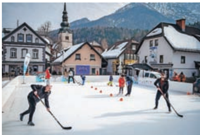
Kako se igra hokej, so obiskovalcem Borovške šajbe pokazali jeseniški hokejisti. / Tekst: Suzana P. Kovačič