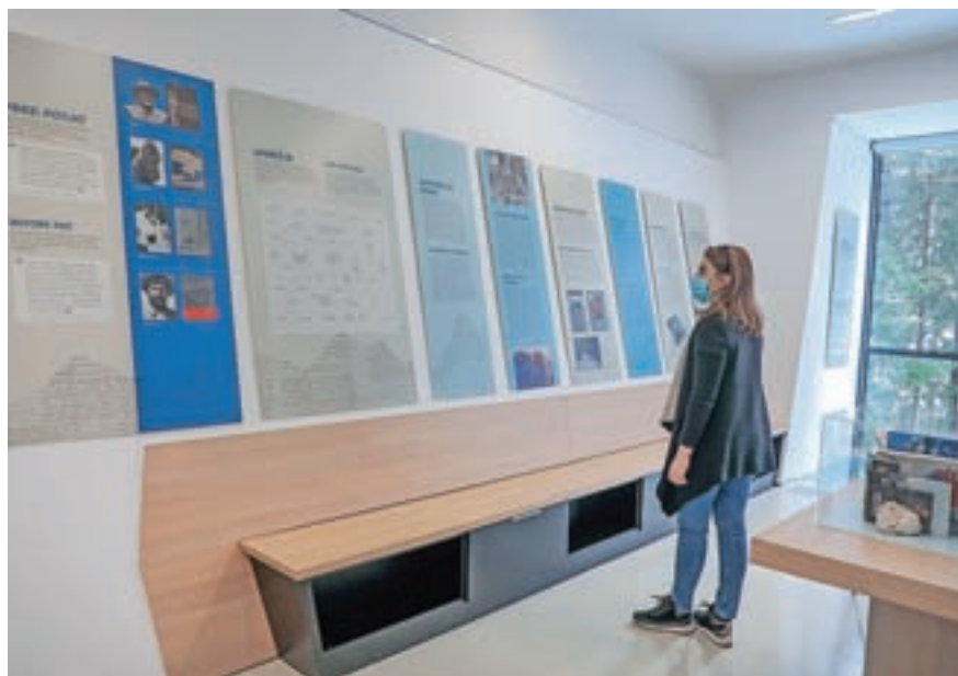
Razstava je nastala v okviru raziskovalnega projekta Alpinistična literatura (J6-1808).