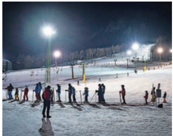
Nočna smuka v Kranjski Gori / Foto: Nik Bertonecelj

Na Turizmu Kranjska Gora so povedali, da so smučišča v Kranjski Gori med zimskimi šolskimi počitnicami odlično pripravljena. "Tudi na smučišču v Mojstrani se trudijo, da bi vsaj v prvem delu počitnic omogočili obiskovalcem kvalitetno smuko," so sporočili, o tem, kako je z zasedenostjo nastanitvev v Zgornjesavski dolini v tem času, pa pojasnili: "Obisk med počitnicami, zlasti tistih šolarjev iz zahodne slovenske regije, je bil pri nas vedno zelo dober, in to smo pričakovali tudi letos. Zasedenost namestitvenih kapacitet je bila v prvem delu počitnic okoli 90-odstotna in v drugem delu okoli 75-odstotna. Med gosti prevladujejo domači gostje, od tujih so pretežno hrvaški gostje, veliko je tudi ruskih in madžarskih gostov ter Italijanov." S. K.