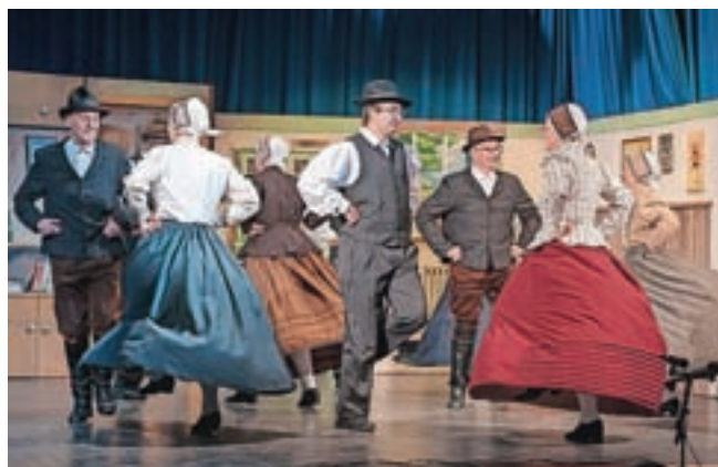
Folklorna skupina Juliana KŠD Hrušica z gorenjskim venčkom plesov. Oblečeni so v kostume, ki so jih nosili Jeseničani in okoličani na koncu 19. in na začetku 20. stoletja.