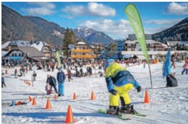
Morda pa se že kali bodoči vrhunski smučarski skakalec.

Na smučišču Kranjska Gora je bil ves čas olimpijskih iger neposredni prenos tekem na velikem zaslonu, poleg tega še športno-zabavni olimpijski program.