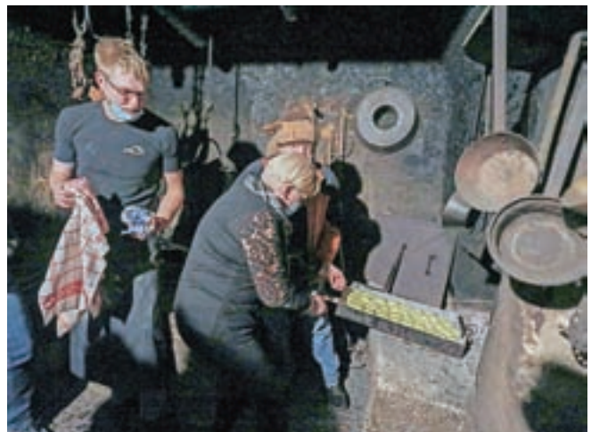
Spekli so jih v krušni peči na drva.

vaniljev sladkor, jajca, kvas, limonina lupina, rum in sol. "Ko testo vzhaja, ga razvaljamo in narežemo na kvadrate v velikosti približno osemkrat osem centimetrov. Na sredino vsakega kvadrata damo marmelado, lahko tudi orehe, čokolado, skuto, sadje. Robove nato povežemo čez nadev in jih dobro stisnemo skupaj ter oblikujemo bunko. Buhteljne položimo v pekač, jih premažemo z jajcem in pečemo približno eno uro na 140 stopinj Celzija," je postopek strnil Zima. "Peka v krušni peči je malce zahtevnejša, saj tu ne moremo uravnati temperature. Žerjavico moramo enakomerno razporediti okoli pekača in se ravnati po videzu jedi, ki je pečena tedaj, ko je skorja lepe rjave barve," je še dodal Zima.