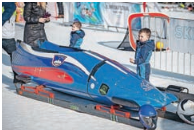
Na ogled je bil eden od dveh bobov, ki ju imamo v Sloveniji.