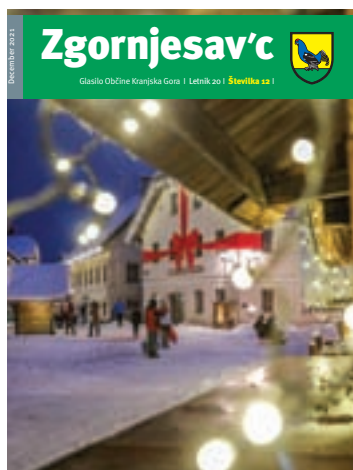
Foto na naslovnici: Praznično okrašena Kranjska Gora