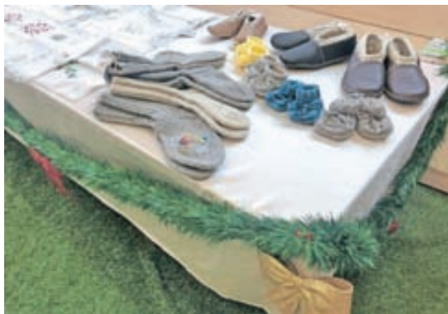
Nekaj izdelkov z Alpske adventne tržnice