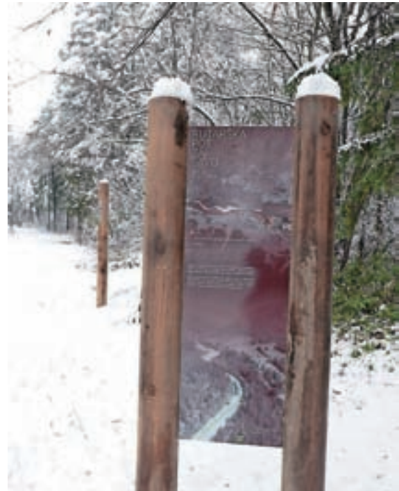
Pred prvo informativno tablo

V januarju 2019 so se lotile drugega projekta, ki so ga najprej predstavile na Občini Kranjska Gora. "Naša želja je bila, da obstoječa pot za Savo postane bolj zanimiva, sproščujoča, namenjena druženju, rekreaciji vseh generacij in v vseh letnih časih. Zaradi epidemije je projekt za nekaj časa zastal, takoj ko so razmere dopuščale, pa smo večkrat prehodile pot, imele sestanke na terenu s projektanti, predstavniki občine in izvajalcem. Dogovorjeni smo bili, da se pot uredi pred letošnjim poletjem, vendar so jo končali šele v drugi polovici novembra. Ampak vseeno: pot je dokončana, ob njej so lične klopi, in kjer so posebej lepi pogledi, se pojavijo razgledni stebriči z usmrejevalniki pogledov proti določenemu vrhu Martuljkove skupine, kjer je navedeno ime gore z višino. Na rednih intervalih so postavljene razgibalne postaje, kjer so na lesenih stebričkih prikazane enostavne gibalno-raztezne vaje z opisi in grafičnimi prikazi. Malo pred koncem poti je knjigobežnica, kjer je možna izposoja, zamenjava knjig in revij ter obenem nudi možnost branja v naravi."