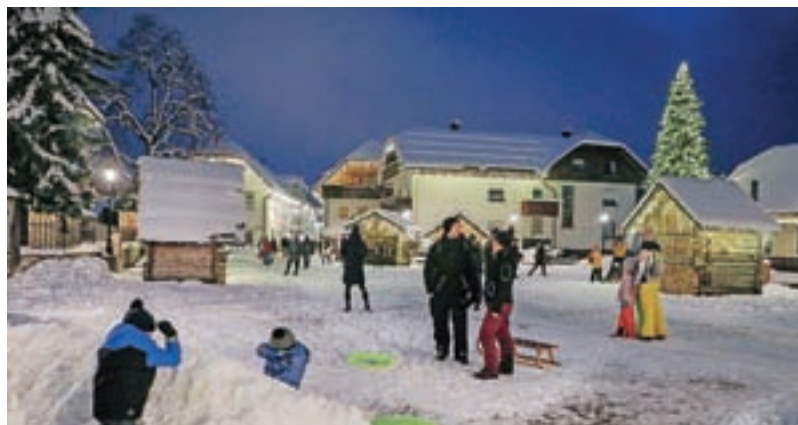
V pobeljeni Kranjski Gori so zažarele praznične luči, v Alpski vasici se lahko pogrejete ob vročih napitkih.

Silvestrovanje na prostem bo, če bodo koronarazmere in ukrepi to dopuščali, enako velja še za kakšen drug predviden praznično obarvan dogodek.