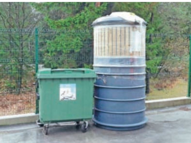
Primerjava starih in novih zabojnikov. Stari imajo prostornino tisoč litrov, novi tri tisoč litrov, vendar sta dve tretjini zabojnika vkopani v zemljo.

"Zaradi vsega navedenega bi izkoristil priložnosti in opozoril, da so se vsi povzročitelji komunalnih odpadkov (vsaka pravna ali fizična oseba, ki na območju občine stalno, začasno ali občasno povzroča odpadke) dolžni vključiti v sistem zbiranja komunalnih odpadkov, kar pomeni, da so si tako stalni kot začasni prebivalci dolžni nabaviti lasten tipiziran zabojnik in ga tudi dejansko uporabljati za odlaganje odpadkov. Uporaba eko otokov pa je namenjena izključno in samo zbiranju ločenih frakcij odpadkov. Pravne osebe in nosilci različnih dejavnosti si morajo odvajanje odpadkov urediti prek pooblaščenih organizacij, lahko tudi Komunale Kranjska Gora, nikakor pa ni dovoljeno, da odpadke iz dejavnosti odlagajo na eko otoke." Kot do-