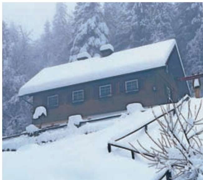
Mihov dom je odprt od petka do nedelje od 10. do 17. ure in po dogovoru.

Večina planinskih postojank, posebej v visokogorju, je v zimskih mesecih zaprtih. To morajo pred odhodom na ture upoštevati vsi, ki jih premami zimskih čar gora in se ne morejo upreti adrenalinskim izzivom. Bolj izkušene zamika vzpon na Triglav, za dosežek si marsikdo šteje že vzpon do Kredarice. Tam je Triglavski dom, ki je z 2515 metri najvišje ležeča planinska postojanka v Sloveniji, uradno zaprt, vendar meteorologi poskrbijo za zasilno prenočevanje. Druga najvišja pozimi odprta postojanka je Erjavčeva koča na Vršiču, ki je v oskrbi Planinskega društva Jesenice in stoji na nadmorski višini 1525 metrov. Nekaj postojank v sredogorju in nižje je stalno odprtih oziroma ob koncih tedna. Stalno je odprt dom v Tamarju. Ob koncih tedna so stalno odprte tri postojanke Planinskega društva Kranjska Gora – Dom v Krnici, Koča na Gozdu in Mihov dom na Vršiču. Veliko obiskovalcev se v zimskih mesecih mimo slapa Peričnik poda v Triglavsko dolino Vrata. Znani in priljubljen Aljažev dom je zaprt, zasilno prenočevanje je možno v nekaj sto metrov oddaljeni zimski sobi.