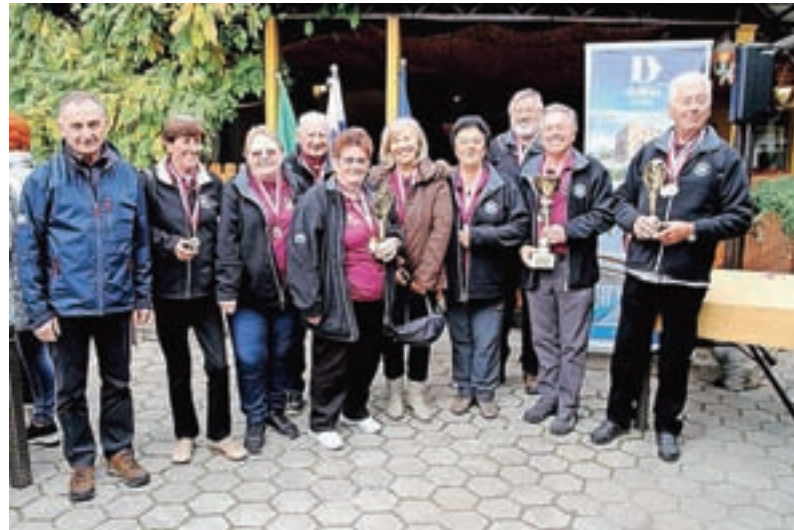
Ekipa DU Rateče - Planice je dobila prehodni pokal.