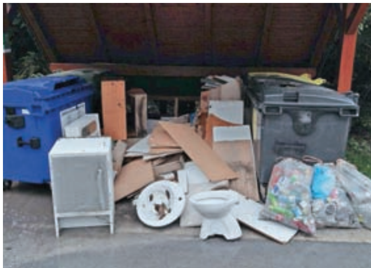
Prizor z eko otoka ob kolesarski stezi, ki ni v ponos.

MIR je v zvezi s problematiko nedovoljenega odlaganja odpadkov v občini Kranjska Gora 23. in 24. oktobra, 6. in 7. novembra ter 13. in 14. novembra opravil poostrene nadzore. To so bili dnevi ob koncih tedna. "Ti dnevi so se namreč zaradi povečanega obiska izkazali kot najbolj pereči. Nadzori so bili usmerjeni v ugotavljanje najpogostejših kršitev, in sicer v prvi vrsti neustrezno ločevanje odpadkov na eko otokih, kar je posledica malomarnosti posameznikov, večkrat tudi naletimo na posameznike, ki ob zaključku obiska ob koncu tedna svoje neločene odpadke enostavno, a nedovoljeno odvržejo na ali ob eko otok, namesto da bi jih kot ločen odpadke odvržli v lastne zabojnike. Prav tako