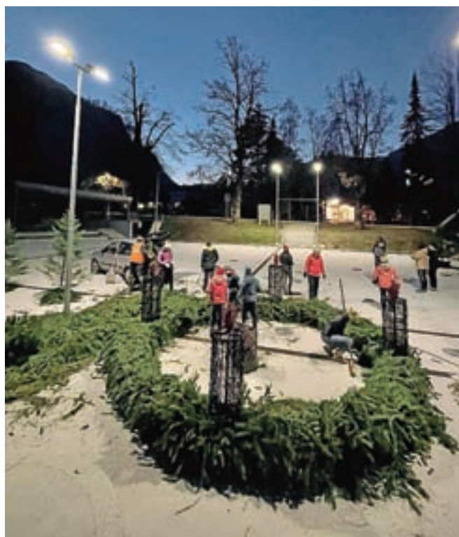
Trg olimpijcev v Mojstrani letos krasi velik adventni venček. Pri njegovi izdelavi so sodelovali člani TD Dovje - Mojstrana.