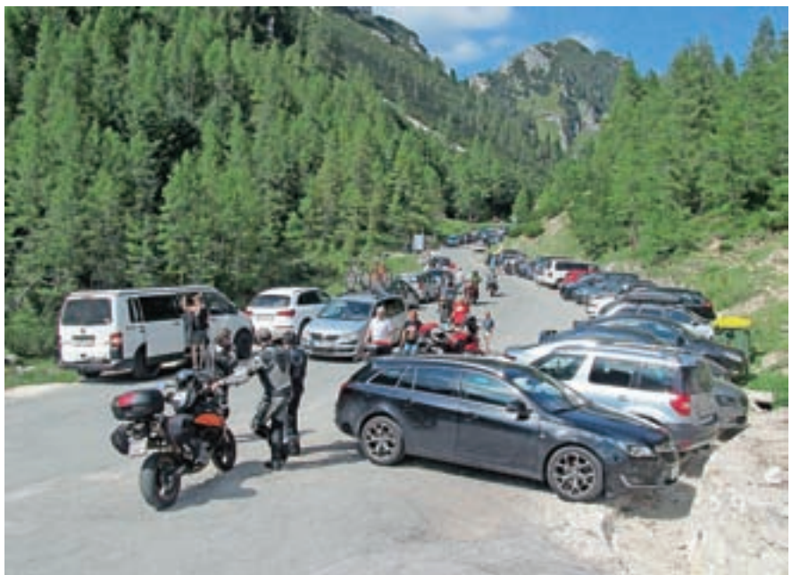
Ne narava ne ljudje si ne želijo več sedanjega (poletnega) kaosa na Vršiču.

Ministrstvo za infrastrukturo je med predloge gradiv za obravnavo na vladi vključilo rekonstrukcijo regionalne ceste Kranjska Gora–Vršič–Trenta–Bovec, znane pod imenom Vršiška cesta, kot prostorsko ureditev državnega pomena. »Zaradi pomembnosti Vršiške ceste in dolgotrajnih zapor je bilo v zadnjih nekaj desetletjih izdelanih več študij in projektov za celoletno prevoznost ceste na različnih ravneh. Edina rešitev sta izgradnja predora pod prelazom Vršič in protilavinskih objektov ter izvedba ostalih potrebnih zaščitnih ukrepov,« so prepričani na ministrstvu za infrastrukturo. »Izgradnja predora bi omogočila tudi lažje uravnavanje prehodnega in stoječega motornega prometa na vrhu prelaza Vršič v kopni sezoni, hkrati pa ustreza tudi smernicam trajnostnega razvoja, prioritetni strategiji razvoja na območju Triglavskega narodnega parka (TNP).« Predlagatelj ob tem poudarja, da ima cesta poleg turističnega tudi velik gospodarski pomen, ki pred-