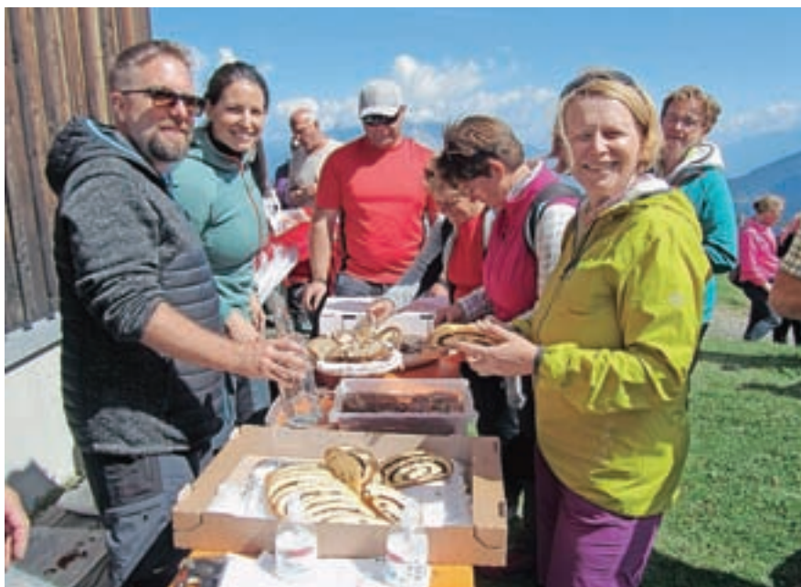
Pri kranjskogorski mizi so gostje uživali ob dobrotah Zgornjesavske doline.