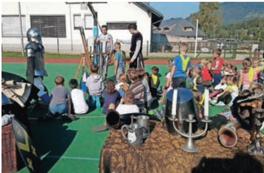
Srednjeveški dan na OŠ Josipa Vandota Kranjska Gora

Začetek šolskega leta se izvaja po modelu B, ki predvideva pouk v šoli, v primeru okužbe oziroma karantene učencev pa se s posameznimi učenci ali oddelki začasno vzpostavi učenje na daljavo. »V primeru take oblike pouka bomo posebno pozornost posvetili temu, da bodo vsi učenci imeli računalnike s kamero in programe, ki bodo omogočali učenje na daljavo. Še posebej pa se bomo posvetili učencem, ki manj znajo ali nimajo doma staršev, ki bi jim bili na voljo za pomoč pri učenju. Učenci od 7. do 9. razreda se enkrat tedensko doma prostovoljno testirajo na okužbo s koronavirusom. Zaposleni na šoli so se najprej samo-