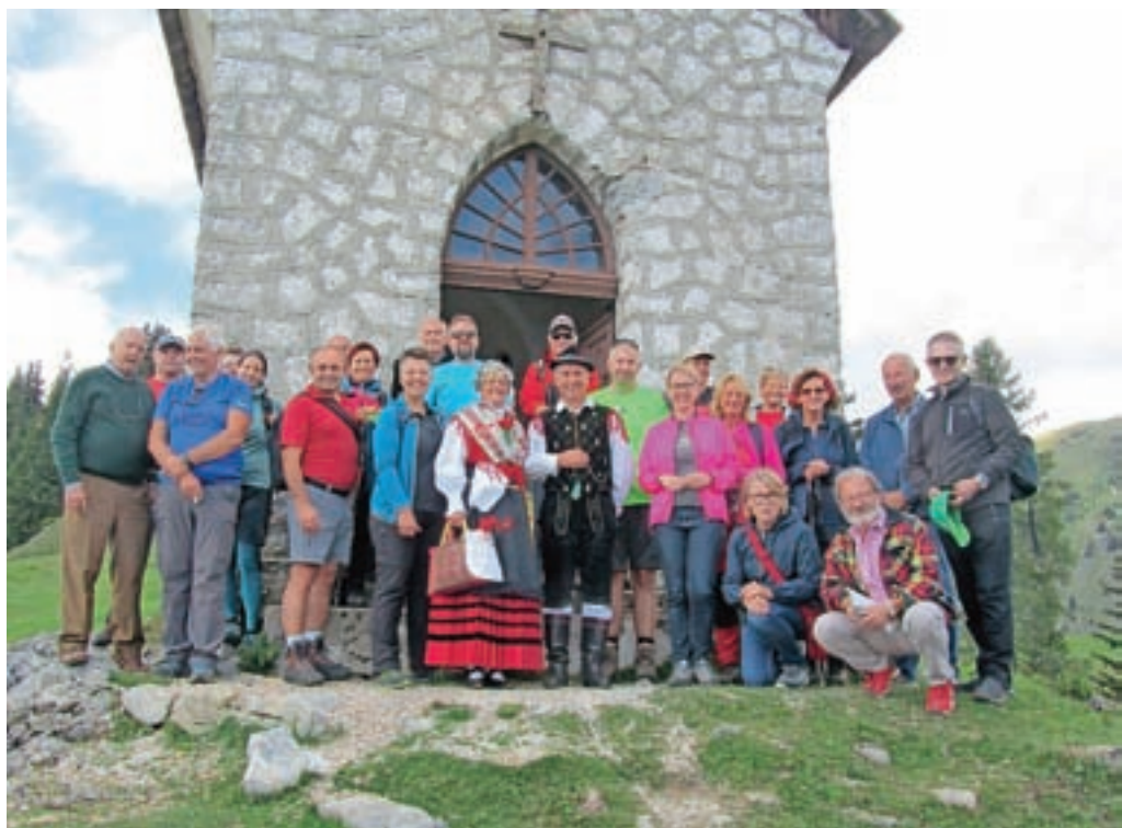
Organizatorji srečanja in gostje pred kapelico Marije Snežne v avstrijskem delu Bistriške planine

Po letu 2017, ko so pri slovenski cerkvi na Dobraču nad Ziljsko dolino prvič organizirali čezmejno srečanje sosedov iz Kanalske doline v Italiji, Koroške in iz Slovenije, je bilo letos srečanje prvič drugje. Organizatorji – Klub 99 iz Celovca, Slovensko planinsko društvo iz Celovca, Slovensko prosvetno društvo Dobrač in Slovensko prosvetno društvo Zila z Bistrice na Zilji – so srečanje sosedov in prijateljev