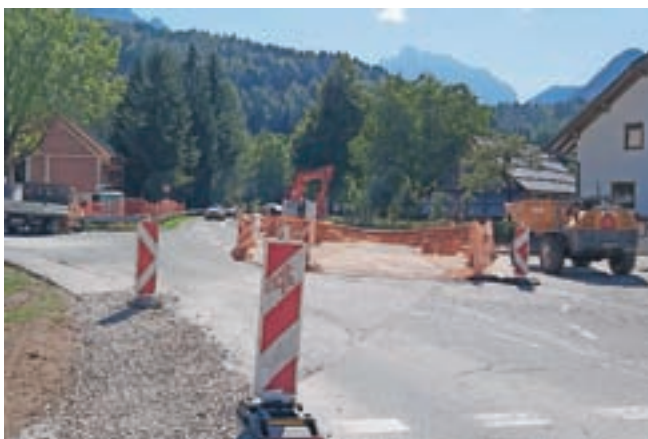
Po sanaciji kanalizacije je predvidena še preplastitev državne ceste.

Občina Kranjska Gora ima v proračunu za leto 2021 načrtovana sredstva za sanacijo fekalne kanalizacije po Vršiški cesti med Borovško cesto in mostom v Jasni. Sanacijo izvaja podjetje Teleg-m iz Ljubljane, strokovni nadzor pri izvajanju del kanalizacije izvaja podjetje T. Medved iz Zbilj. Dela bodo predvidoma zaključili konec oktobra, zatem je s strani Direkcije RS za infrastrukturo na tem mestu predvidena še preplastitev državne ceste. V času izvedbe del je urejena delna zapora, zato vas prosijo za razumevanje in potrpljenje. Dostop do hiš in intervencijske službe je omogočen. S. K.