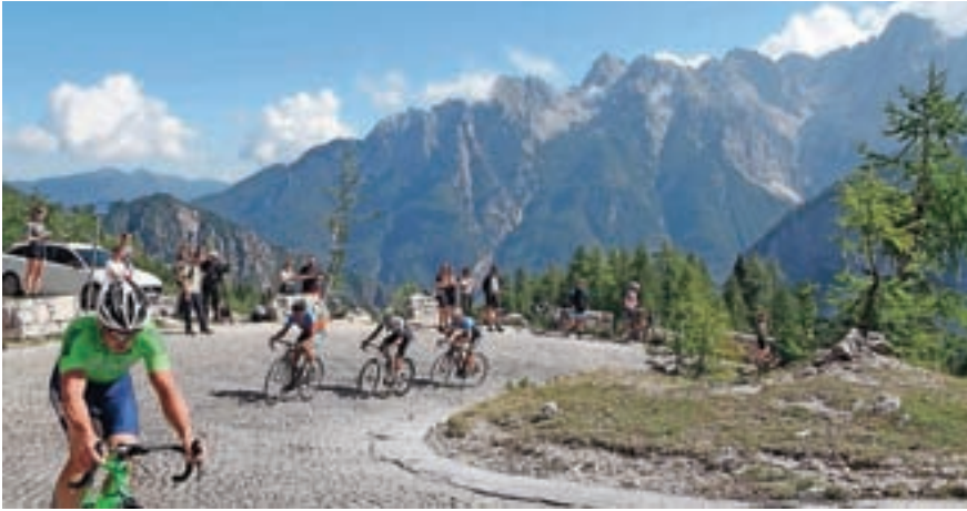
Kljub še vedno zahtevnim razmeram zaradi covid-19 je bilo na startu 242 kolesarjev.