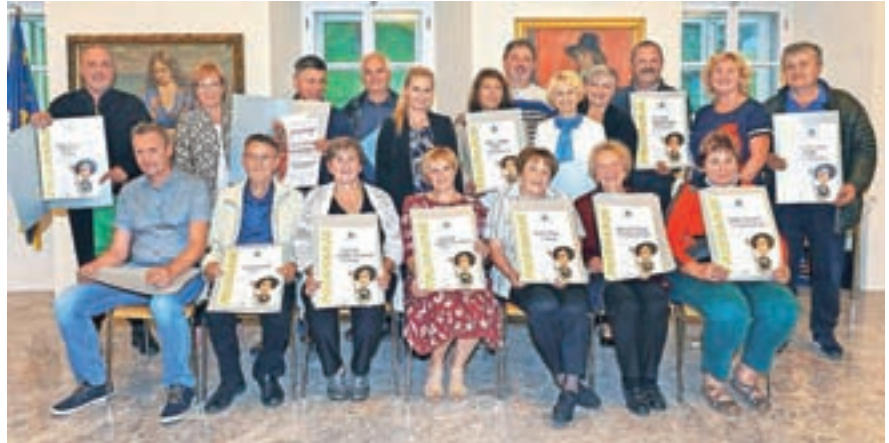
Letošnji prejemniki priznanj, med katerimi so tudi prizadevni člani Turističnega društva Gozd Martuljek.