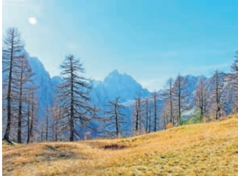
Ovčji hlev je bil nekoč tudi na planini Sleme na nadmorski višini 1780 metrov.

Nastanek vasi seže v rimsko dobo in je najstarejša vas v Zgornejavski dolini. Kmetje iz Rateč imajo planine v skupni lasti Agrarne skupnosti Rateče Planica. Planine so v dveh stranskih dolinah Julijskih Alp; v dolini pod Mangartom, kjer je obsežna planina Za jezera pri Velikem in Malem jezeru oziroma