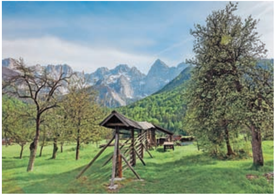
Pohodniška pot Juliana Trail, Martuljkova skupina

Po številnih domačih in mednarodnih priznanjih je daljinsko pohodniško pot Juliana Trail opazilo in nagradilo tudi Britansko združenje turističnih novinarjev, ki je 330 kilometrov dolgo pot izbralo za najbolj inovativen evropski turistični projekt v preteklem letu. Opisali so jo kot odlično novo pohodniško pot, ki vodi skozi Julijske Alpe in daje poudarek trajnostnemu turizmu. "Narejena je, da zmanjša število obiskovalcev Triglava, ki je preveč obiskana gora. Juliana pa obkroži ikoničen vrh, ne da bi