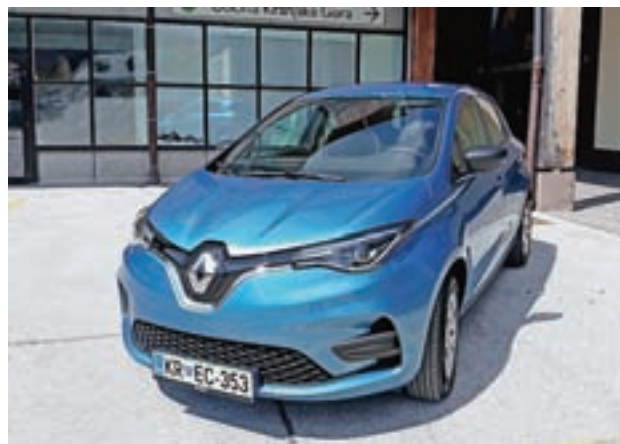
Renaultov električni model Zoe je namenjen izvajanju nalog programa Prostofer.

Občina Kranjska Gora je s soglasjem občinskih svetnikov kupila nov električni avto, v pretežni meri za izvajanje nalog programa Prostofer, ki povezuje starejše osebe, ki potrebujejo prevoz in ne zmorejo uporabljati javnih in plačljivih prevozov, s starejšimi aktivnimi vozniki, ki pa po drugi strani radi priskočijo na pomoč. Občina je imela prejšnje vozilo v uporabi od leta 2018, moč baterije je bila že razmeroma slaba in so bile daljše vožnje, na primer do Ljubljane, že vprašljive. Novi modeli avtomobilov imajo močnejšo baterijo in s tem daljši doseg, zato je občina avto zamenjala po sistemu staro za novo. Po prejeti ponudbi vrednost novega avta, Renaultovega modela Zoe, znaša nekaj čez 20.400 evrov, za starega pa so dobili 8.500 evrov. Občinski svetnik Izidor Podgornik se je za nakup novega električnega avta zahvalil in imenu izvajalcev projekta Prostofer, v katerem tudi sam sodeluje kot prostovoljni voznik. S. K.