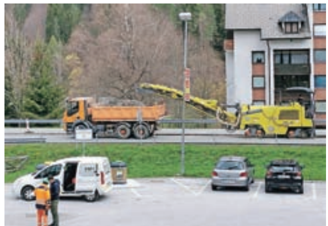
V času gradnje je urejen obvoz.

Občinski svetniki so sprejeli tudi zaključni račun proračuna Občine Kranjska Gora za leto 2020.