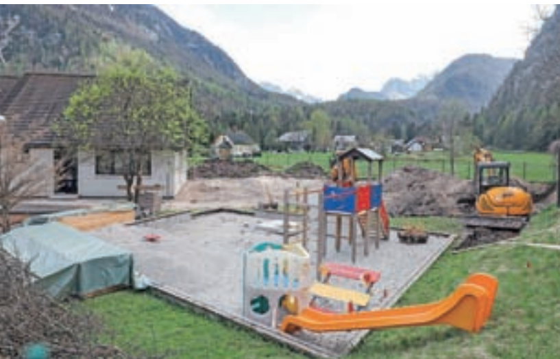
Izbrani izvajalec del je Kovinar Gradnje z Jesenic.