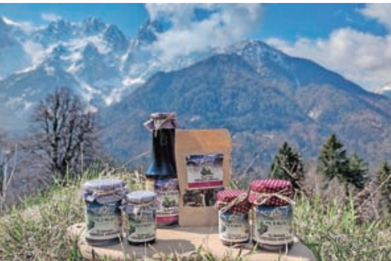
Njuni izdelki iz aronije

Aronijo obirata ročno v drugi polovici avgusta in na začetku septembra ob sončnem vremenu, ko so plodovi suhi. Vsebnost sladkorja v aroniji najprej preverita z refraktometrom. Pri obiranju jima pomagajo še drugi družinski člani. Predelavo imata za zdaj v domači kuhinji, a je, kot sta poudarila,