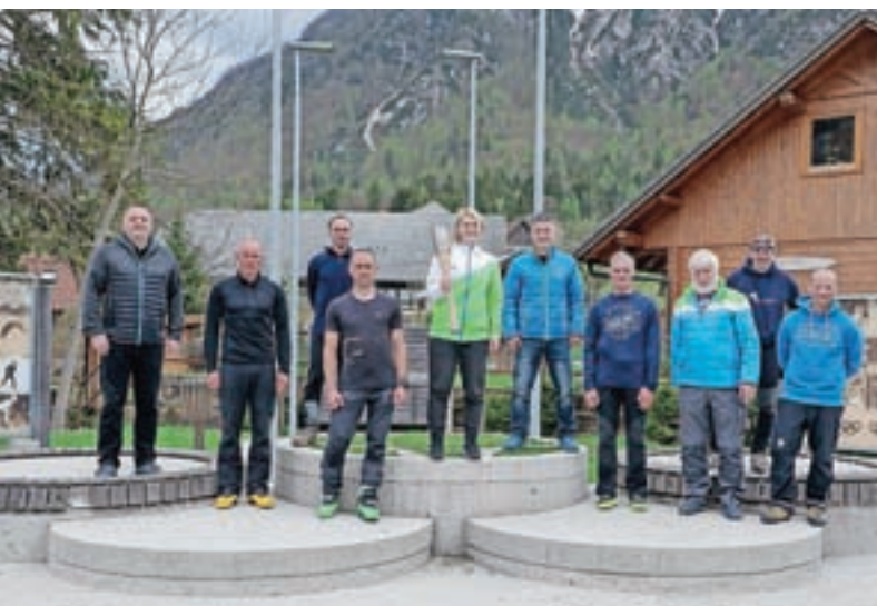
Postanek bakle na Trgu olimpijcev v Mojstrani, ponosnem kraju z največ olimpijci pri nas

Bakla se je nato odpravila proti Primorski, kjer je bil v ponedeljek v Bovcu uradni začetek njene poti po Sloveniji. V 81 dneh do slavnostnega odprtja olimpijskih iger 23. julija v Tokiu bo plamenica, ki simbolizira tako Triglav kot jekleno voljo naših vrhunskih športnikov, obiskala vseh 212 občin.