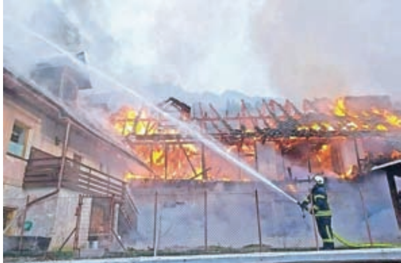
Požar na Dovjem

Javni zavod Triglavski narodni park (TNP) je objavil javni razpis za podelitev Belarjevega priznanja, poimenovanega po dr. Albinu Belarju, prvem pobudniku za ustanovitev narodnega parka v Dolini Triglavskih jezer. Priznanje je namenjeno posameznikom in pravnim osebam za njihovo uspešno delo, dosežke in pomoč pri poslanstvu, ozaveščanju in promociji narodnega parka, ohranjanju biotske raznovrstnosti in naravnih vrednot narodnega parka, ohranjanju kulturne dediščine v narodnem parku, urejanju in upravljanju narodnega parka ter upravljanju obiskovanja in urejanju infrastrukture na območju parka. Predloge za nagrajence z obrazložitvijo lahko posredujejo fizične in pravne osebe v Republiki Sloveniji do vključno 31. maja 2021 v zaprti ovojnici s pripisom "Za Belarjeva priznanja" na naslov Triglavski narodni park, Ljubljanska cesta 27, 4260 Bled. Predloge bo obravnavala posebna komisija, ki jo je imenoval svet TNP, podelitev pa bo na osrednji prireditvi TNP ob štirideseti obletnici zakonske ustanovitve TNP in šestdeseti obletnici razglasitve Doline Triglavskih jezer za narodni park septembra 2021. S. K.