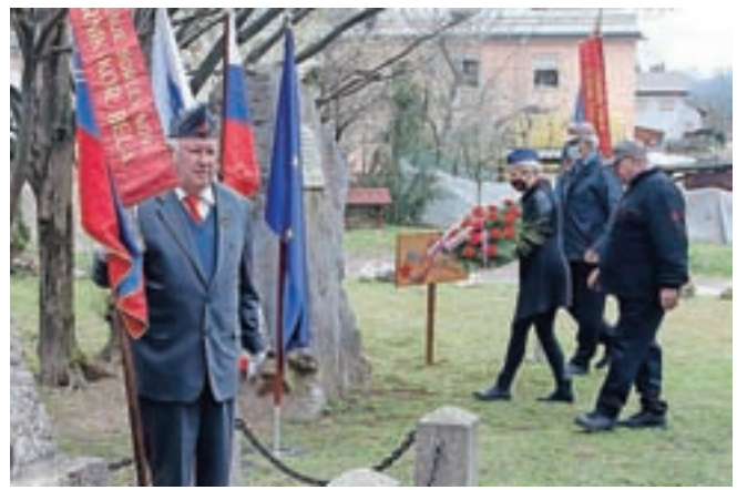
Polaganje vencev k spomeniku OF na Jesenicah