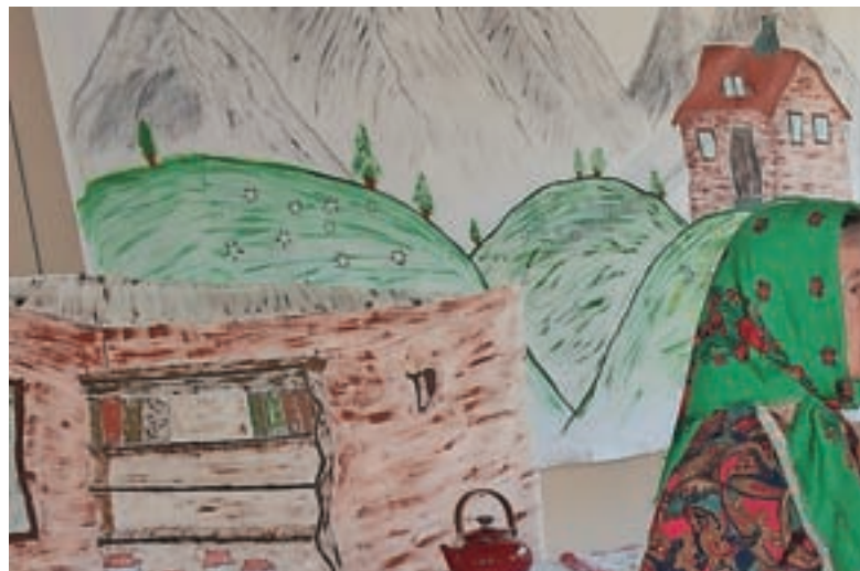
Obiskali sta jih "vaški klepetulji", ki sta prinesli aktualne novice iz Zgornjesavske doline.