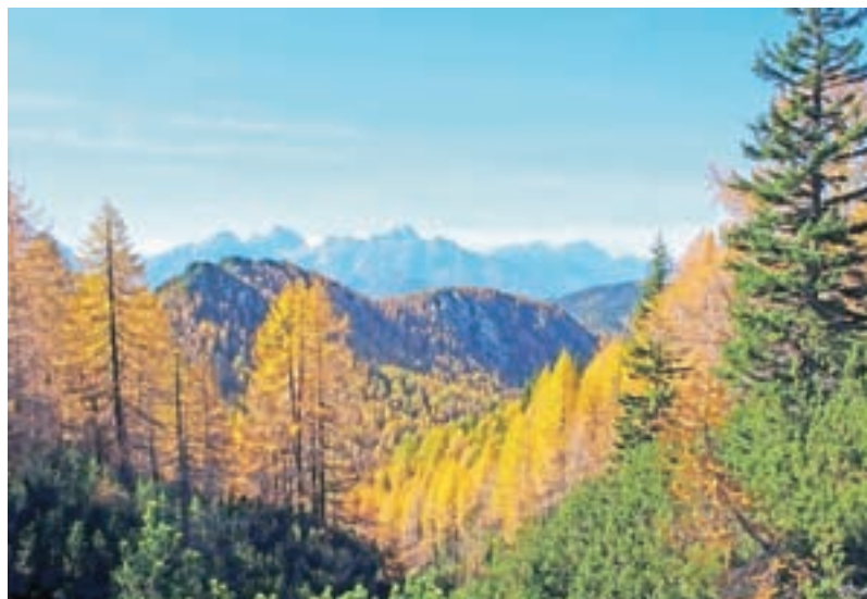
V zadnjih desetletjih so se zaradi drugačnega načina življenja nekatere planine opustile, vendar se kljub temu še na mnogih planinah pase živina.

pri Belopeških jezerih. Po zahodnem delu doline pa imajo pravico do paše kmetje iz Bele Peči. Ker so Rateče starejša vas od Bele Peči, rateški kmetje pasejo na boljših predelih planine. Po letu 1920 in drugi svetovni vojni zaradi državne meje nastanejo težave pri prehajanju meje z živino.