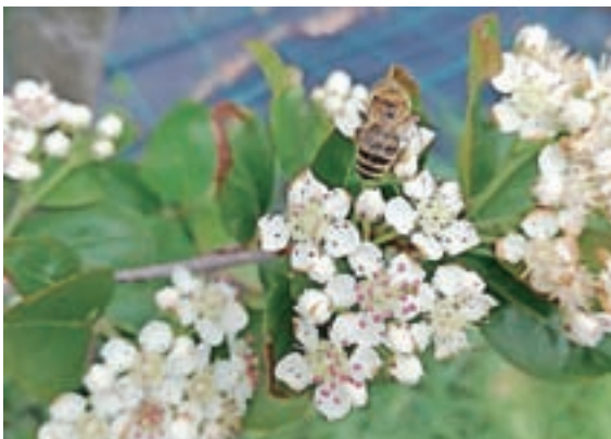
Cvetoča aronija