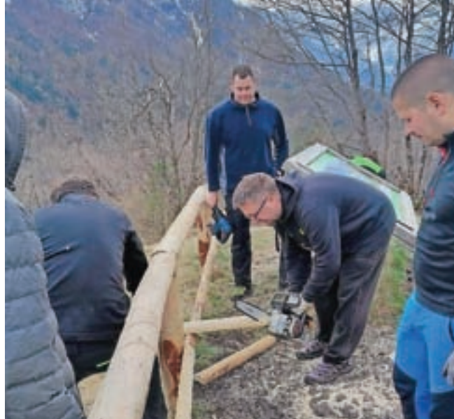
Popravilo ograje na Grančišču / Foto: Turizem Kranjska Gora