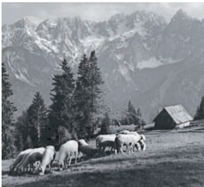
Ovce na planini

Večina planin je v lasti Agrarnih skupnosti, nekaj je tudi zasebnih. V Zgornjesavski dolini so agrarna skupnosti Rateče Planica, Podkoren, Kranjska Gora - Log, Gozd in Srednji Vrh ter Dovje - Mojstrana. Pregled planin predstavljam po krajih, ki so večinoma tudi identični z Agrarnimi skupnostmi.