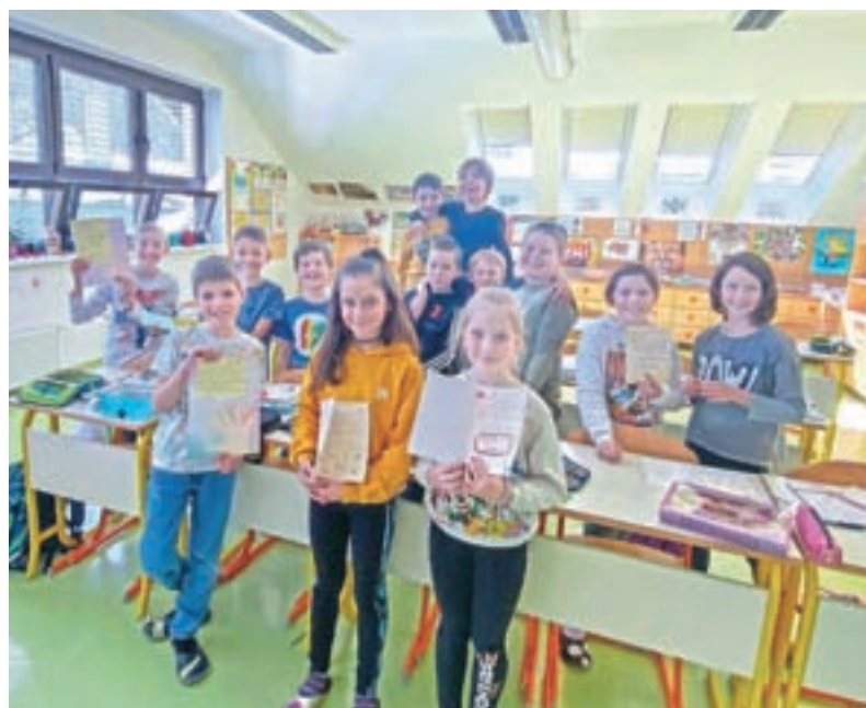
Učenci četrtega razreda z voščilnicami za mamic