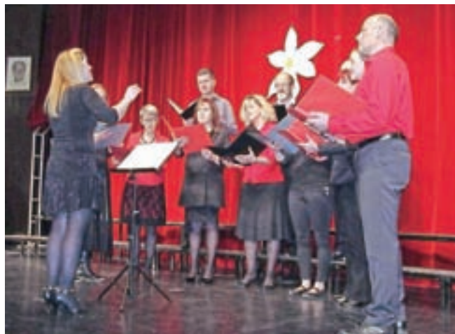
Pevci Triglavskih zvonov z Dovjega na lanskem nastopu odraslih pevskega zbora na Slovenskem Javorniku