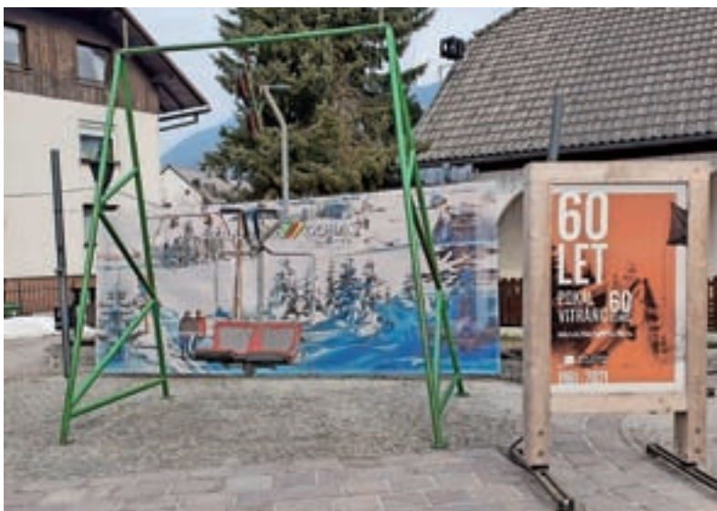
Retro točka v središču Kranjske Gore