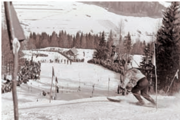
Pokal Vitranc je praznoval 60-letnico.