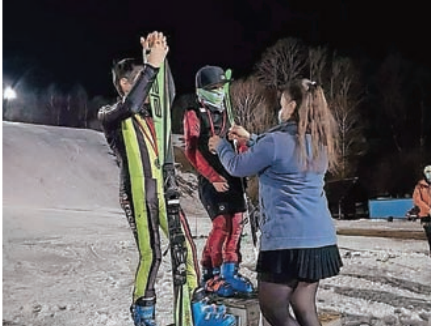
Podelitev kolajn na dobrodelnem smučarskem tekmovanju v Mojstrani

Z začetkom tega tedna so v Kranjski Gori sklenili smučarsko sezono 2020/21, v kateri so žičnice obratovala 86 dni. Vsem obiskovalcem se podjetje SKI Kranjska Gora najlepše zahvaljuje za obisk. Vljudno vabljeni, da jih obiščete tudi v prihajajoči poletni sezoni 2021. S. K.