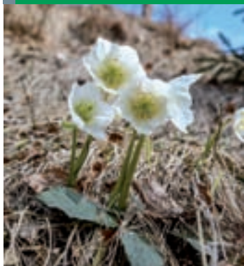
Pomladno prebujanje