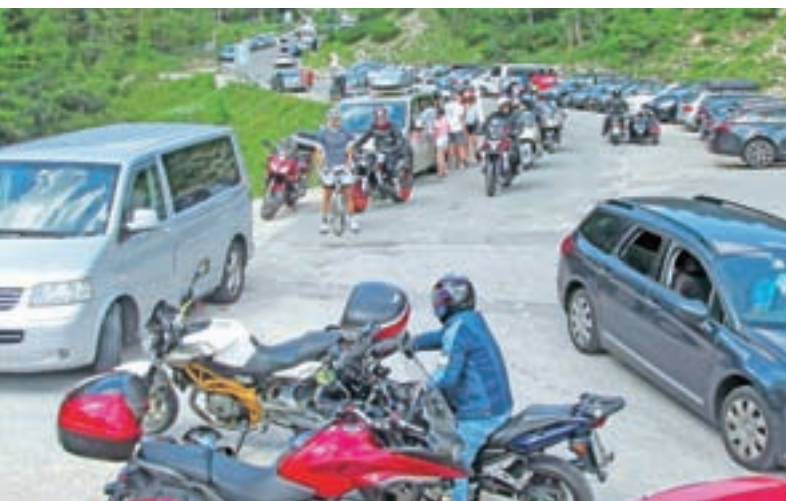
Podpore anketirancev ima tudi ukrep omejevanja dostopa na Vršič.