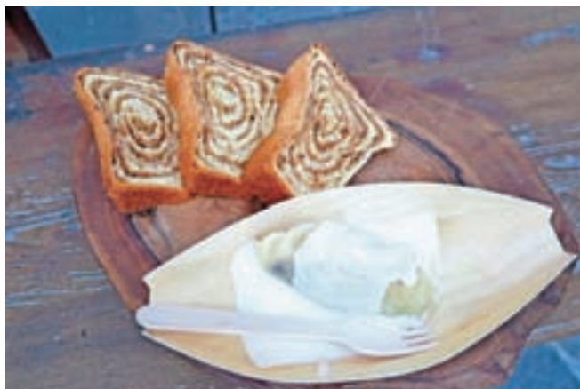
Od tepke do kôce, od rateških (kôcavih) krapov do Podbreške potice