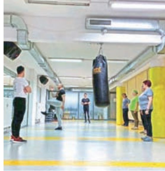
Na tednu odprtih vrat

treniranja kot začetnik ali kot izkušen športnik," je povedal Chorchyp, ki je na urnik postavil še vadbo za starejše, ki so jo poimenovali Zdravo gibanje in je namenjena vsem starejšim, ki še niso nikoli prav zares pravilno in kontrolirano izvajali treningov. "Na urniku imamo še vadbi Odkrij zver in Kickfit ter trikrat na teden Voden fitness, ki je namenjen vsem začetnikom, ki si želijo spoznati pravilno, kontrolirano in učinkovito izvajanje vaj v fitnesu." Chorchyp, ki živi v Podkorenu, je že zelo dolgo v trenerskih vodah, tako v borilnih veščinah kot v fitnesih. "Na tednu odprtih vrat v Fitnessu Vitranc so obiskovalci lahko ves teden brezplačno spoznavali naš fitnes in vse