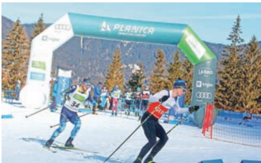
Posnetek iz drugega tekmovalnega dneva.

"Veseli nas, da nam je uspelo v niz tekmovalnih najvišjega nivoja, ki jih je že gostila Kranjska Gora, dodati še tek na smučeh in biatlon športnikov invalidov. Še enkrat smo pokazali, da s sodelovanjem in trudom, nujno potrebnimi izkušnjami in znanjem ter s kančkom gorenjske trme lahko dose-