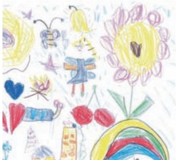
Tako kot je bil vesel prihod otrok nazaj v vrtec, so vesele tudi njihove risbice.