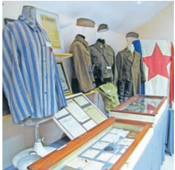
Obлека iz koncentracijskega taborišča in partizanske uniforme

Uroš Košir se z zbiranjem vojaških in civilnih predmetov, povezanih s prvo in drugo svetovno vojno ter obdobjem med obema vojnama, ukvarja že iz osnovnošolskih let, resneje pa zadnjih 18 let. Poleg predmetov, ki so povezani z ozemljem Slovenije, je osredotočen na predmete, fotografije in dokumente slovenskih mobilizirancev v nemško voj-