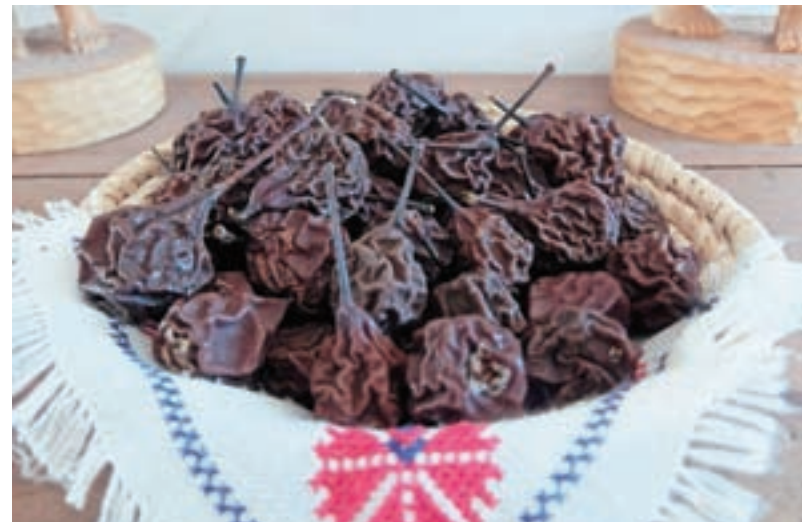
Suhe hruške