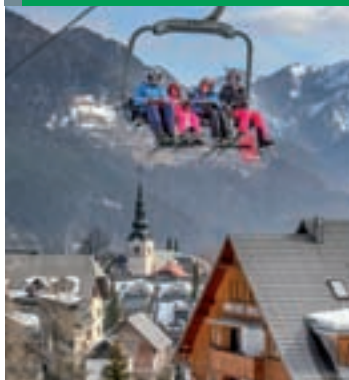
Na naslovnici: Na smučanju med zimskimi počitnicami v Kranjski Gori

ZGORNJESAV'c, ISSN 1580-7991 Ustanovitelj glasila: Občina Kranjska Gora, Kolodvorska 1b, 4280 Kranjska Gora