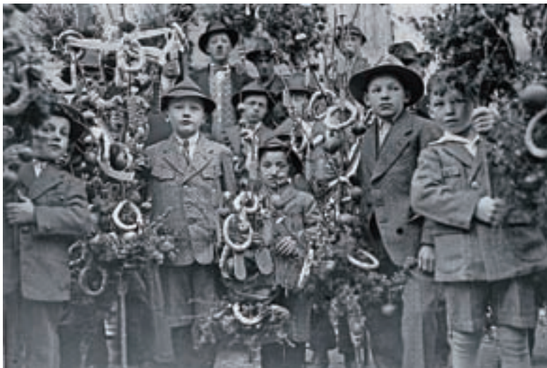
Slika otrok s prajkli