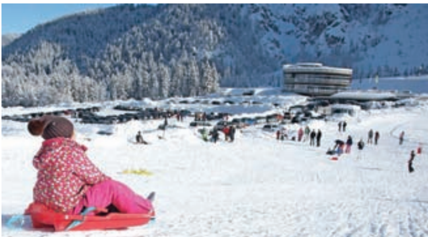
Letošnja zima je bila ena najbolj bogatih s snegom v zadnjih letih, a je turizem zaradi epidemije ni mogel izkoristiti.

Za poletno sezono pričakujejo, da bo podobna lanski, saj je vlada podaljšala veljavnost turističnih bonov do konca letošnjega leta, neizkoriščeni pa sta ostali še dve tretjini.