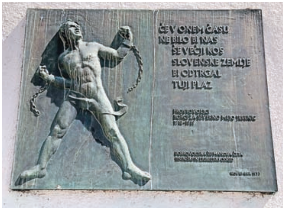
Spominska plošča v Podkorenu