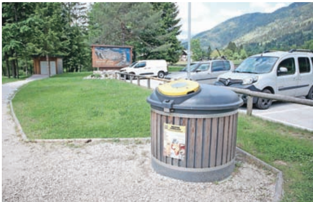
V preteklih letih je Komunala Kranjska Gora že vgradila štiri trikubične potopne zabojnike na počivališču Topolino v Mojstrani (na sliki) in pri jezeru Jasna.