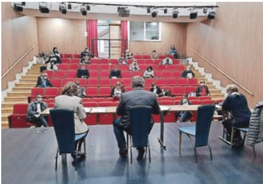
Seja občinskega sveta je bila v dvorani Ljudskega doma v Kranjski Gori.

Svetniki so potrdili subvencioniranje storitve obvezne občinske gospodarske javne službe (GJS) oskrbe s pitno vodo ter odvajanje in čiščenje komunalne in padavinske odpadne vode za maj in junij. Potreba po subvenciji se je ravno tako pojavila zaradi zagotavljanja pomoči pri odpravljanju posledic epidemije. Na področju oskrbe s pitno vodo se bo cena uporabnikom