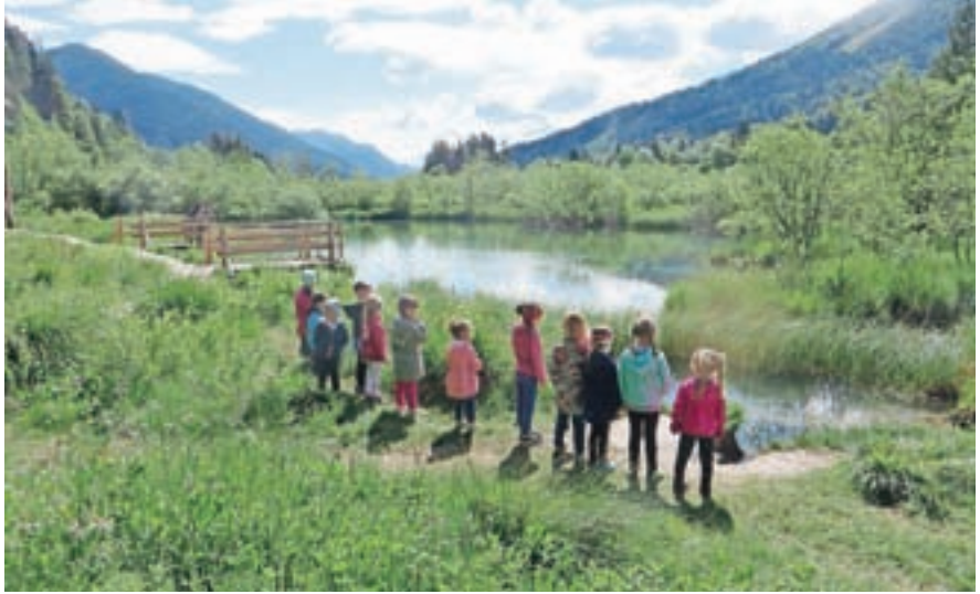
Otroci so šli v petek, 29. maja, na pohod do Zelencev.