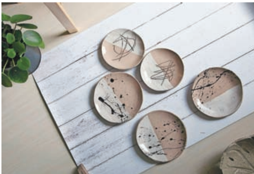
Dva krožnika iz kolekcije black interference (črna motnja) in trije iz black splash (črna packa).

Navdušen nad naravo, naravnimi materiali, tudi ko gnete glino, pozabi na čas, na svet okrog sebe. Gnetenje gline je odličen medij oziroma nova