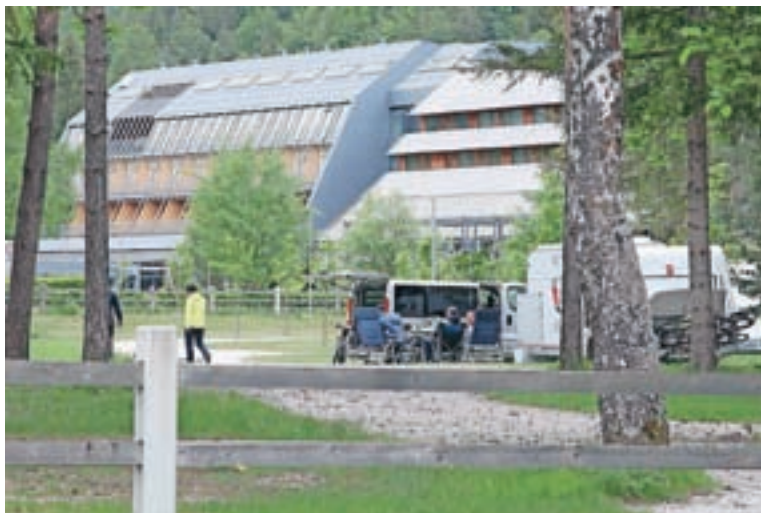
V kamp Špik v Gozdu - Martuljku so prvi gostje prišli takoj, ko so ga po koncu epidemije spet odprli.

Sicer pa Urevc še pravi, da glede sezone ni zgolj črnogled. Turisti, ki pridejo v kamp, so individualisti. Pridejo, ko je lepo vreme, in odidejo, če se vreme poslabša. "Podobno bodo po mojem mnenju reagirali tudi zdaj: ko se bodo odprle meje, bodo takoj odreagirali in odšli na pot, sploh tisti z bivalniki in prikolicami, tako da upamo, da bomo na koncu sezone nekje na polovici lanske realizacije."