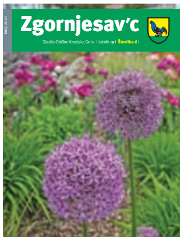
Pomladno prebujenje