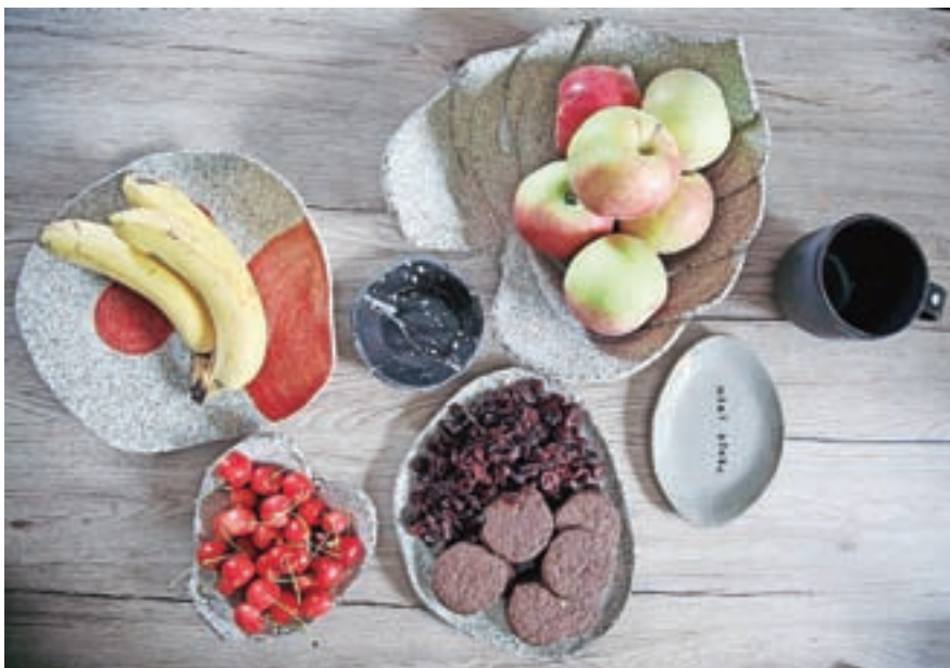
Simbioza unikatne keramike in hrane

Sodeluje med drugim z Nino Šiler, ki izdeluje bio veganske sojine sveče, Matic pa za sveče ročno oblikuje kamnite skodelice. Zelo pomembno mu je namreč povezovanje tudi lokalno; slovensko znanje, slovenski materiali (tudi embalaža, nalepke, še njegova peč za keramiko je plod slovenskega znanja ...). Njegove izdelke odlično interpretira tudi fotograf Uroš Abram iz Gozda - Martuljka.