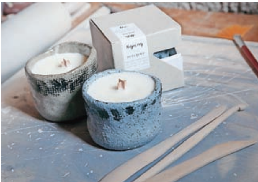
Sojina sveča, ko izgori, postane uporabna skodelica.