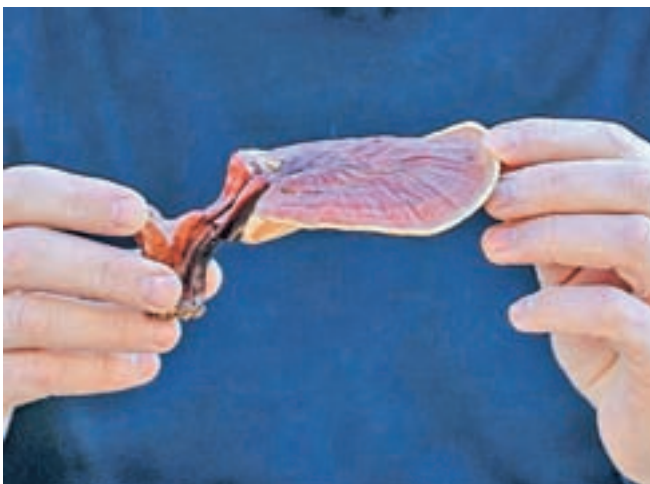
Svetlikava pološčenka ( Ganoderma lucidum )

»Severnoameriški Indijanci so uporabljali lekarniške macenovke, ki veljajo za prve zdravilne gobe, ki so se prodajale v lekarnah – za zdravljenje pljučnih obolenj, krepitev oziroma aktivacijo imunskega sistema, Grki so jih uporabljali proti tuberkulozi,« še navaja in doda, da tudi pri nas obstaja cela vrsta gob, ki jih lahko nabereimo, ko gremo v naravo, jih posušimo in uporabimo za čaj, na primer. »Res