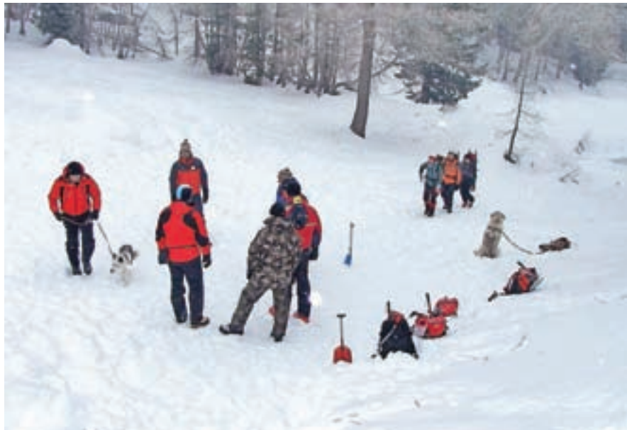
Vodniki z lavinskimi psi Gorske reševalne zveze Slovenije že po tradiciji prihajajo na zimska usposabljanja. Fotografija je z enega od prejšnjih usposabljanj.

Gorski reševalci znova in znova opozarjajo na nevarnosti v gorah, posebej tam, kjer se prave zimske razmere lahko zavlečejo krepko v poletje. V času epidemije odsvetujejo aktivnosti v hribih, posebej v visokogorju, kjer je večja možnost poškodb. Razmere so tam zahtevne in nevarne.