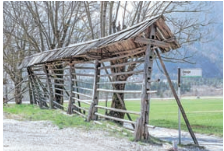
Kozolec na Dovjem, ki bo letos v okviru projekta Arhitektura gorenjskih vasi obnovljen, ob delih bo potekala tudi delavnica za zainteresirano javnost.