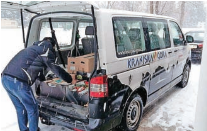
Letos se je nabralo približno štiristo kilogramov hrane.

Turistično društvo Kranjska Gora organizira predavanje in tečaj FFS za vrtničarje, ki bo 14. februarja ob 9.30 v prostorih Občine Kranjska Gora. Predavanje z naslovom Naravi prijazni načini zatiranja bolezni in škodljivcev ter varna uporaba sredstev za varstvo rastlin v vrtovih je namenjeno vrtničarjem in vsem drugim. Poleg predavanja bo organiziran tudi tečaj FFS za vrtničarje. K. S.