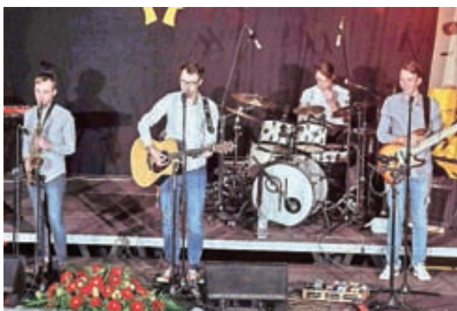
Člani skupine Gajst'n band