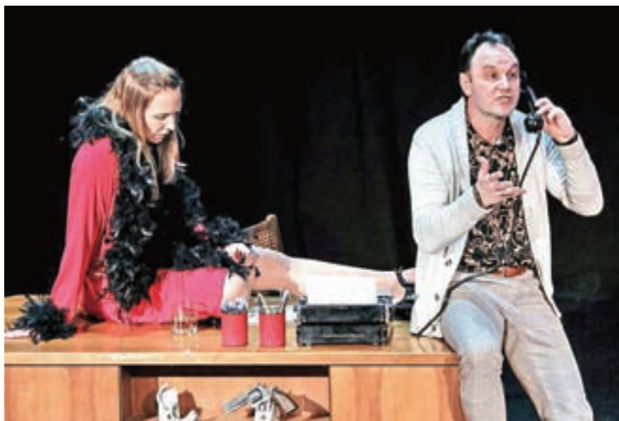
Dveurna predstava gledalca drži v napetosti vse do zadnjega dejanja ...

Premiera je uspela, igralci so bili prepričljivi v svojih vlogah. Ponovitvi sta bili 26. januarja in 1. februarja. Ta bol' teater že vrsto let uprizarja različna