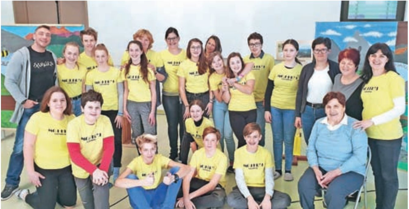
Skupinska fotografija po uspešno izpeljanem 1. festivalu Moj kr'j