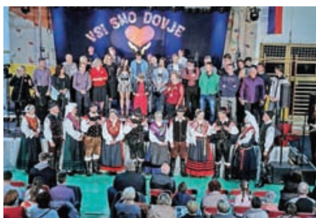
Na dobrodelnem koncertu so dokazali, da so resnično "vsi Dovje".