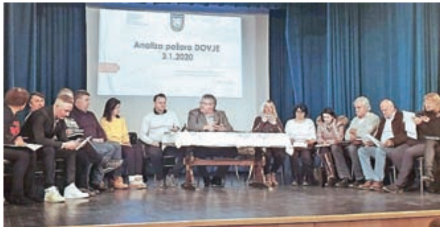
Izredna seja občinskega sveta je bila sredi januarja v prostorih kulturnega doma na Dovjem.