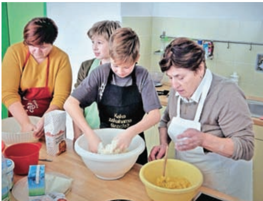
Na desetih medgeneracijskih delavnicah so pripravljali stare rateške jedi.

V knjigi so tudi recepti za 13 izbranih tradicionalnih rateških jedi, med njimi so usukani močnik, prežganka, čompavc, vlivanci, govnač, budlja, rateški krapi iz krompirjevega ali vlečenega testa, mavželjni in krhki flancati, ki jim v Ratečah rečejo hrepavci.