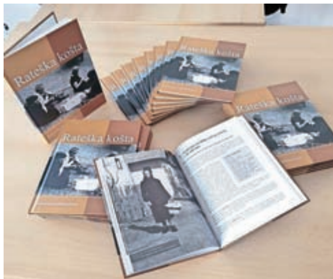
Ob koncu projekta so izdali knjigo z naslovom Prehranska dediščina Rateč.

Podnebni pogoji na skrajnem zahodu tipične alpske Zgornjesavske doline so ostri. Od rateškega kmeta in gospodinje so zahtevali izredno praktičnost, iznajdljivost, zlasti pa prilagodljivost, racionalnost in varčnost. Osnovni pridelki poljedelstva so bili zelje, repa in krompir, od živinoreje je prevladovala ovčereja, saj se je ovčje meso lahko hitro, pravzaprav takoj porabilo.