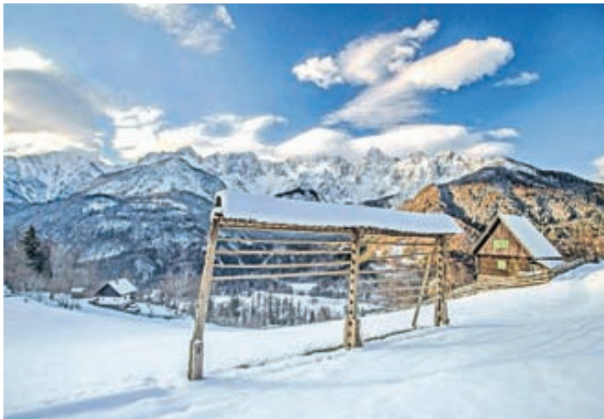
Pogled iz Srednjega Vrha na Martuljško skupino