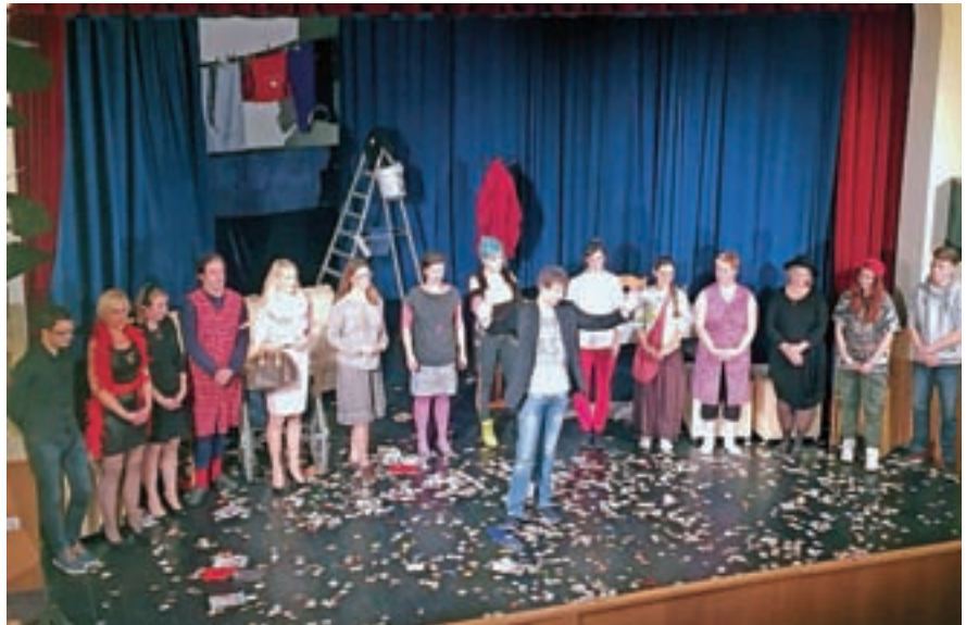
Dobrodelni muzikal Nore babe na dovškem odru 17. februarja