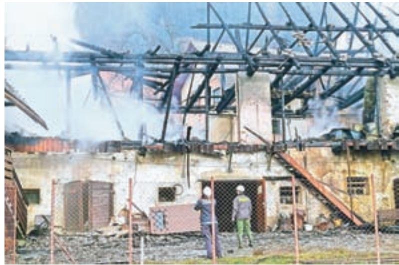
Kriminalisti so ugotovili, da je zagorelo zaradi samovžiga materiala v leseni lopi.

Gorenjski kriminalisti so ugotovili, da je zagorelo zaradi samovžiga materiala v leseni lopi. "Ogenj se je zaradi majhnega odmika od sosednjih objektov od tam najprej razširil na eno in potem še na drugo gospodarsko poslopje ter na dve stanovanjski hiši. V požaru so bili huje poškodovani trije objekti. Nastala je velika materialna škoda. Z ugotovitvami bodo kriminalisti seznanili pristojno državno tožilstvo," je sporočil Bojan Kos s Policijske uprave Kranj.