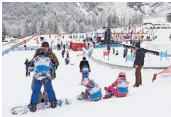
Takole je bilo lani na Svetovnem dnevu snega v Planici.