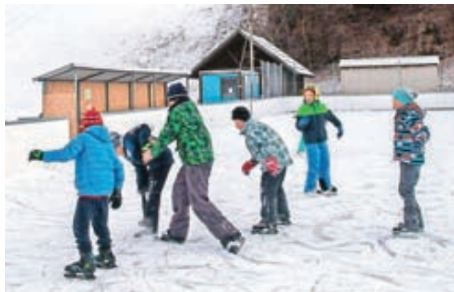
Drsanje pred nekaj dnevi v Mojstrani / Foto: Primož Pičulin

Na smučišču Kranjska Gora in v Podkorenu je minule dni obratovalo od 7 od 17 naprav, nočna smuka je bila možna na sedežnici Kekec. Več informacij o dnevnem obratovanju naprav dobite na telefonski številki 04 5809 400.