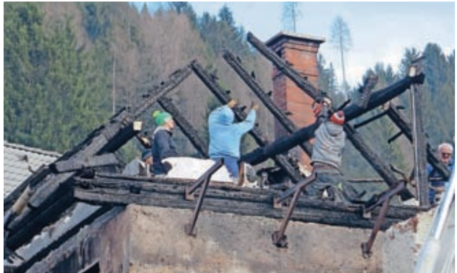
Krajani Dovjega so v soboto zjutraj takoj pristopili k čiščenju pogorišča.

V soboto, dan po požaru, se je v središču Dovjega zbrala domala celotna vas. Rohneli so traktorji in gradbeni stroji, s katerimi so vaščani hiteli odstranjevat ostanke petkovega razdejanja. Ob občinski stavbi pri Katr so postavili mize