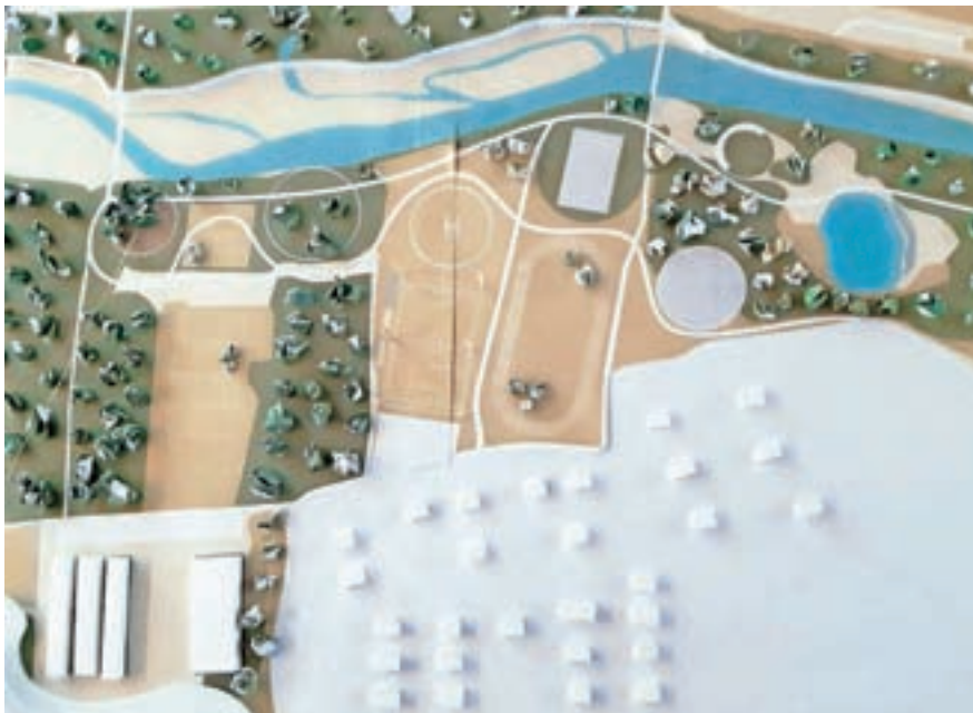
Ureditev območja Proda, prva različica

bre pogoje za dvoranske športe. Ureditev zunanjega športnega igrišča pri osnovni šoli v Kranjski Gori z atletsko stezo in igrišči za igre z žogo je korak v pravo smer. Športni park Ruteč v prihodnje čaka ureditev, ki bo zaokrožila ponudbo parka in omogočila osnovne pogoje, ki jih športniki potrebujejo. Letošnja investicija v igrišče za golf pa je dopolnila in dvignila prepoznavnost