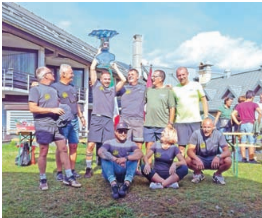
Prehodni pokal so letos v zrak ponosno dvignili Kranjskogorčani.