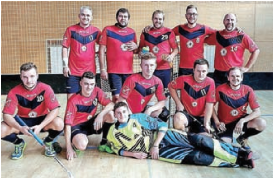
Člani so odigrali že dve tekmi.

V kategoriji U13 nastopata dve ekipi iz Zgornjesavske doline, Mojstrana in Kranjska Gora. Mojstrana je Insport ugnala s 7 : 0, Kranjska Gora pa s 6 : 5. Tudi v kategoriji U11 sta dve ekipi. Mojstrana je s 6 : 1 premagala Žiri. V medsebojnem obračunu med Mojstrano