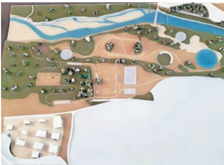
Ureditev območja Proda, druga različica

Mojstrana pripravlja ureditev območja Proda. "Gre za lokacijo, kjer je že sedaj nogometno igrišče, helidrom za po-