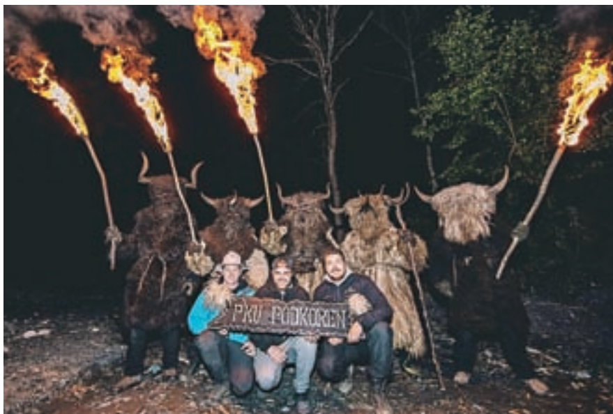
Ognjeni spektakel/Srečanje parkeljnov treh dežel

tarja, kot jo hranijo v Liznjekovi hiši v Kranjski Gori, je bila zelo težka, podprta z leseno desko, pritrjeno na njegov hrbet, pa še dva sta Trentarja pod roko