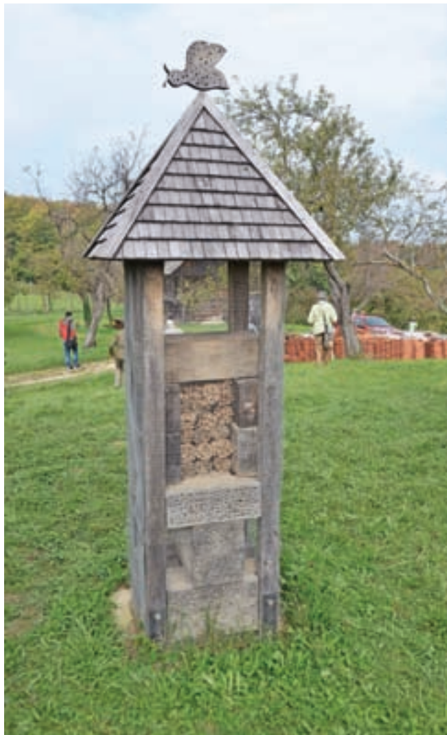
»Hotel« za čebele samotarke: v les so izvrtane številne luknjice, prerezana votla stebelca v notranjosti pa so (pred žolnami) zavarovana z mrežo.

Viroze so vse večji problem. Povzročajo jih različni virusi, ki ogrožajo čebele. Ena od razlag, zakaj so v porastu, je tudi