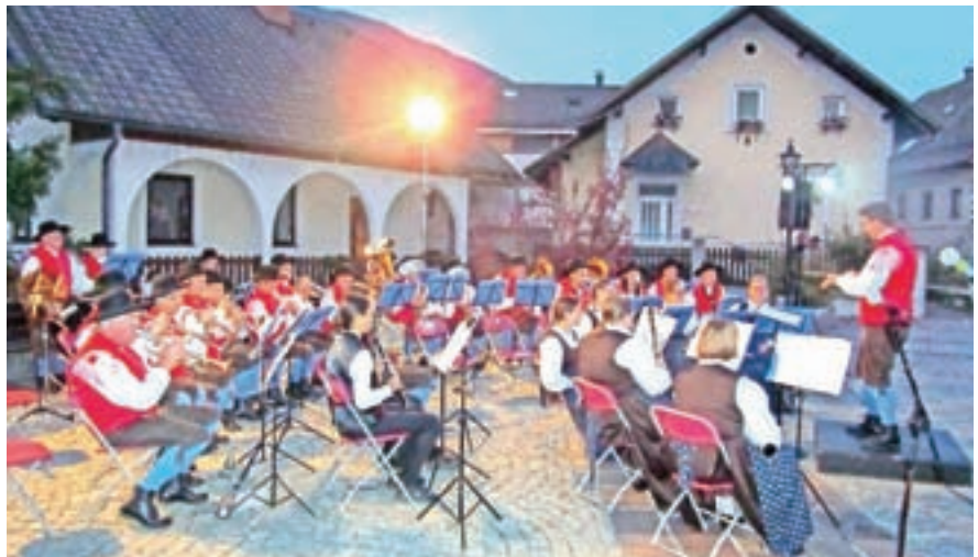
Gostitelji, pihalni orkester Jesenice - Kranjska Gora