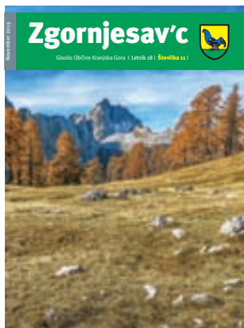
Na naslovnici: Pogled na Jalovec