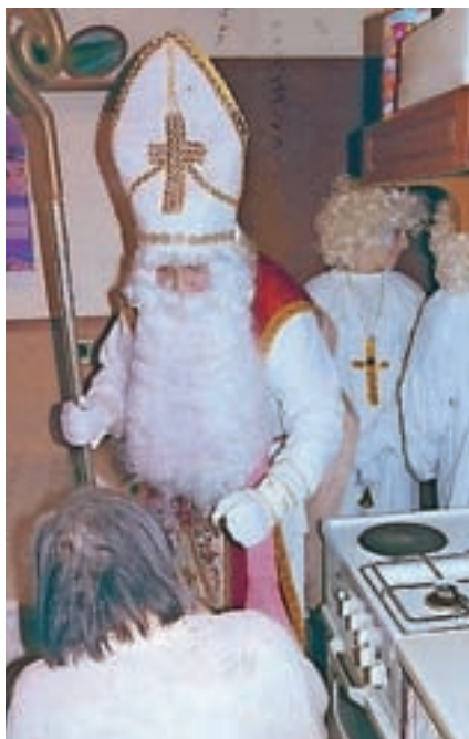
Prihod Miklavža kot običaj