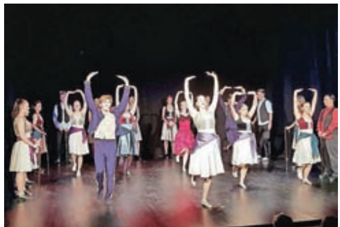
Plesna predstava Carmen v izvedbi Plesnega kluba Forma iz Ljubljane z gosti