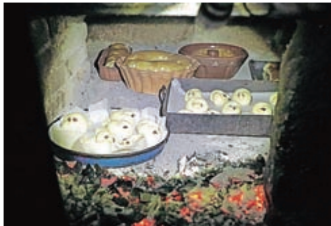
Potica se je v krušni peči pekla približno eno uro.