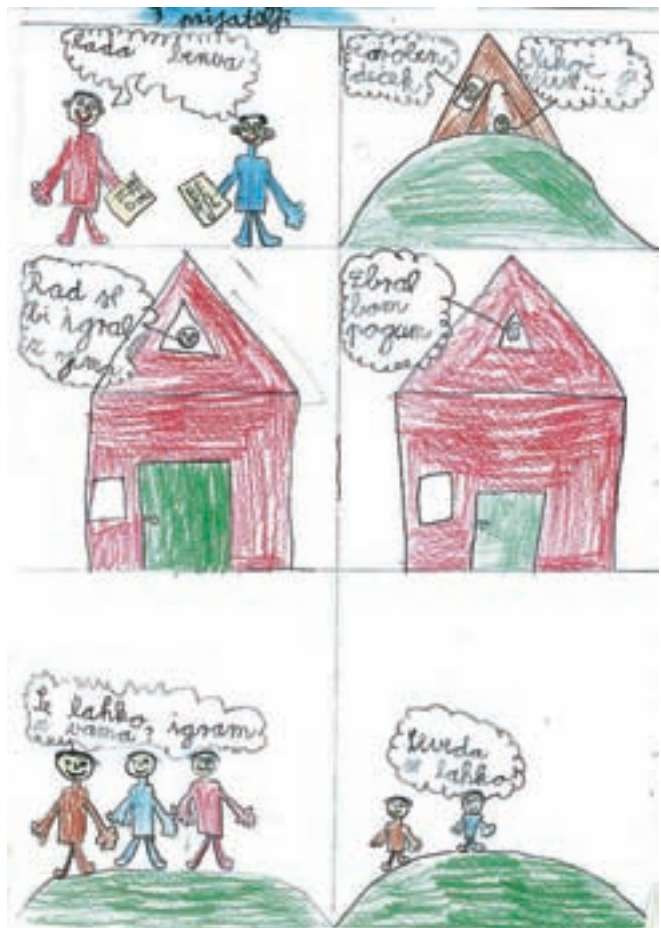
Trije prijatelji (prva triada OŠ Kranjska Gora)

Na obeh šolah so na koncu izbrali najbolj sporočilne izdelke, učenci pa bodo za nagrado dobili vstopnice za bazen v enem od kranjskogorskih hotelov.