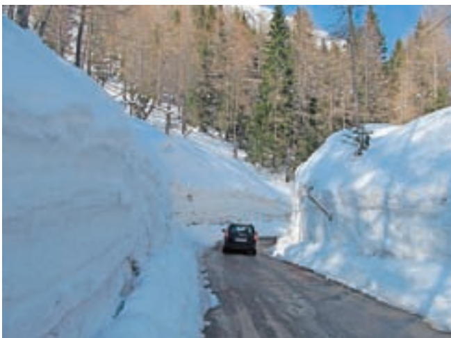
Zime visoko v hirbih še ni konec.

zimskimi razmerami. Vsi so delali predvsem na terenu, v kočici pa so imeli predavanja. Vsem, ki pozimi pridejo sem gor, nudiva osnovne informacije, koliko je snega, kakšno je vreme, kako je s cesto, ali je splužena in podobno. Za ostale zahtevnejše informacije o gorah pa svetujeva, da se že v dolini pozanimajo pri ustreznih službah.«