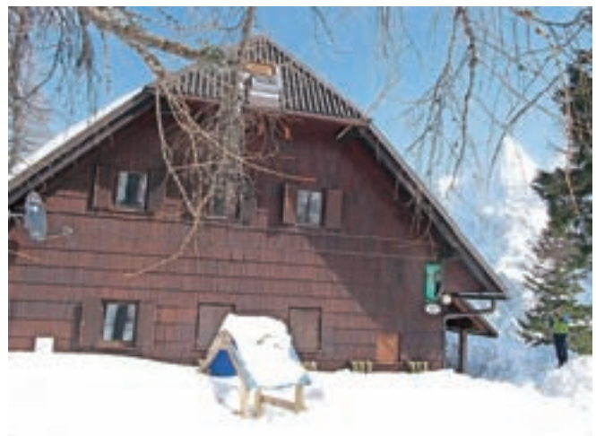
Po nekaj letih je bila tudi na Vršiču res prava zima.