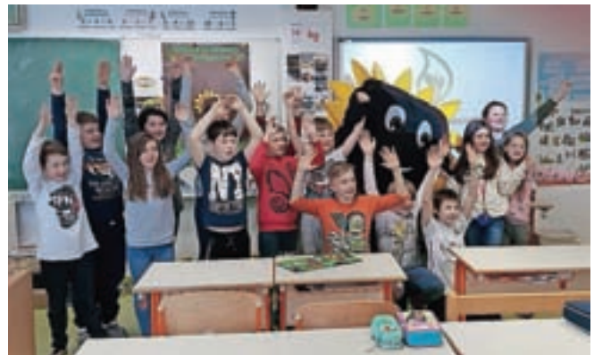
... in v Mojstrani.