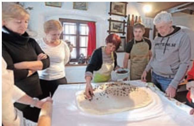
Prava velikonočna potica vsebuje orehe in rozine.

prvič zapojejo alelujo in se oglasijo zvonovi v spomin na to, da je Jezus vstal od mrtvih. V nedeljo zjutraj obiščemo vstajensko procesijo, na velikonočni ponedeljek se kristjani srečujejo in drug drugemu prinašajo blagoslov.