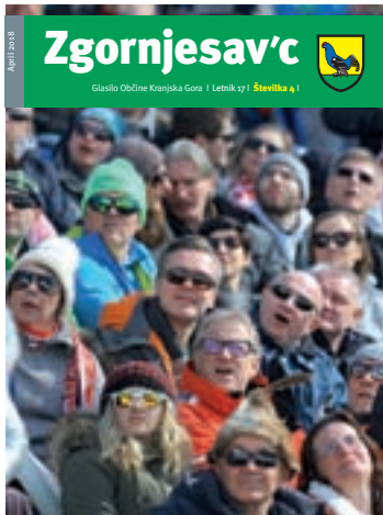
Na fotografiji: Planica 2018