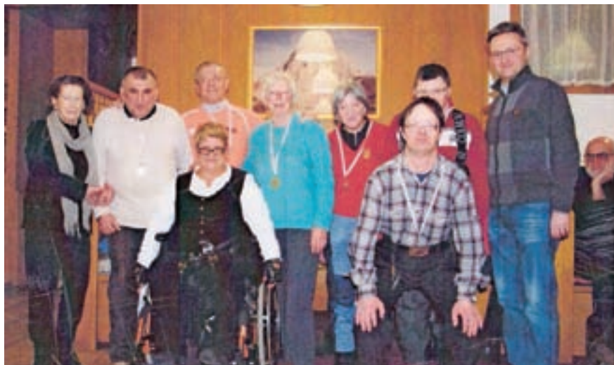
Čezmejnega športnega srečanja so se udeležili tudi invalidi iz kranjskogorskega društva.