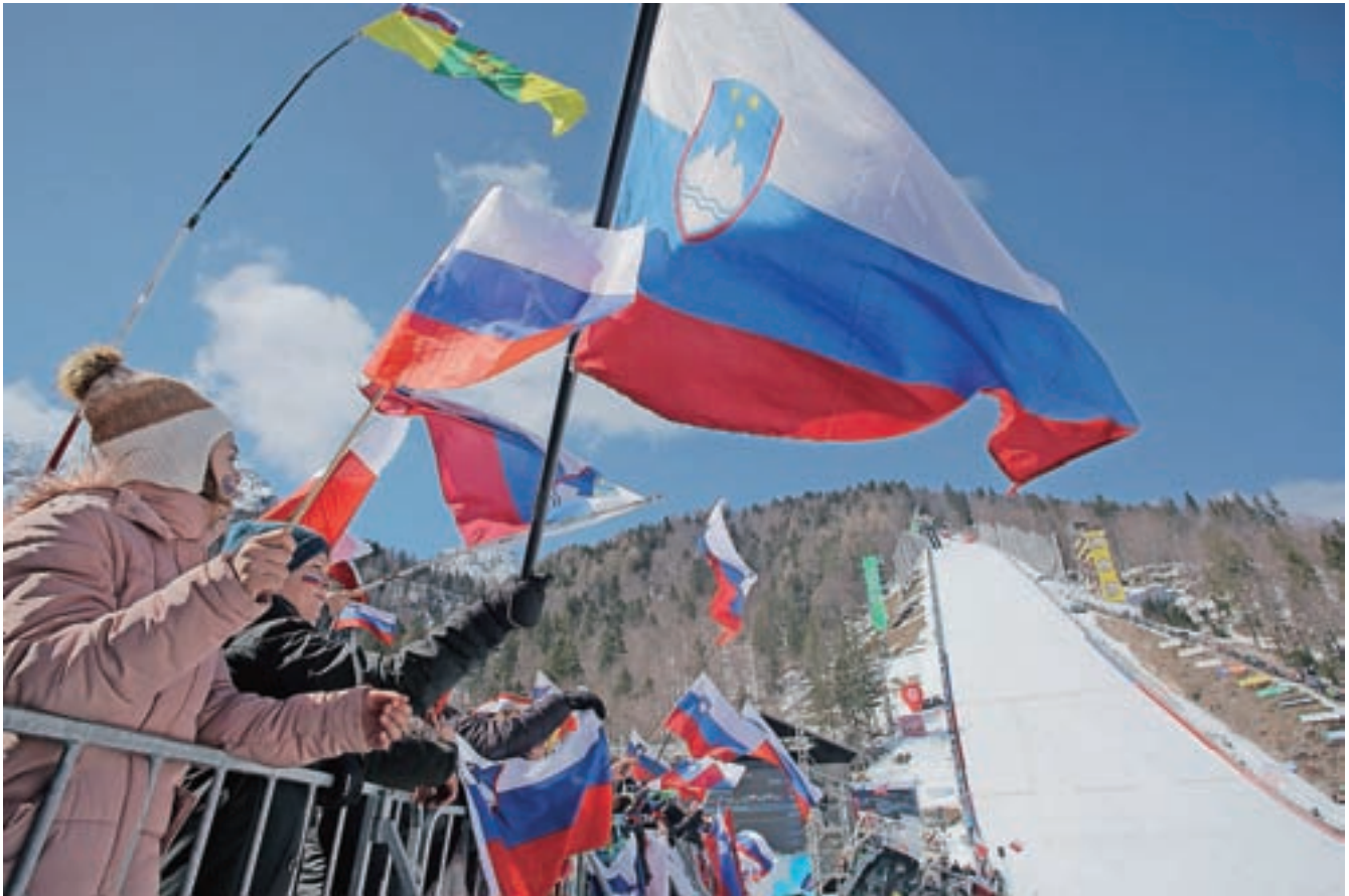
Najboljše letalce na svetu si je v štirih dneh ogledalo 58.400 gledalcev.