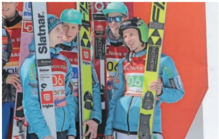
Četverica slovenskih skakalcev se je na ekipni tekmi razveselila tretjega mesta.

skokih je v Planici, Ratečah in Kranjski Gori poleg tekmovalnega potekal tudi pester spremljevalni program, vključno s slovesnostjo ob odprtju, ki je bila v Ratečah. Za celo Slovenijo, še posebej pa za občino Kranjska Gora, je to velik dogodek.