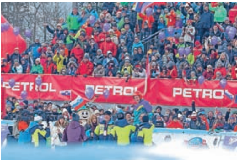
Poslovil se je na vitranški strmini, med zvestimi navijači.

»Meto poznam in spremljam že dalj časa. Je izjemna smučarka, ki bo še marsikaj dosegla. V tej sezoni se je ustalila v svetovnem pokalu ter že dosegla vrhunske rezultate, kljub temu da še ni dopolnila 20 let.«