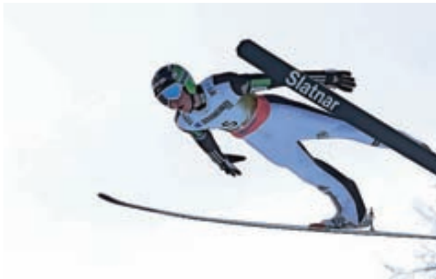
Bor Pavlovčič je na prvi posamični tekmi poletel do osemnajstega mesta.