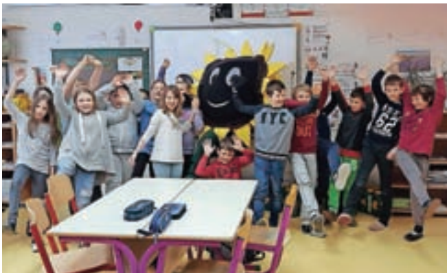
Šolarji, ki bodo olje zbirali v Kranjski Gori ...

je odpadek, za katerega praviloma ne pomislimo, da bi lahko bil škodljiv za naravo. Prav zaradi tega ga številna gospodinjstva v Sloveniji najpogosteje nepravilno odlagajo, in sicer tako, da ga prek kuhinjskega lijaka ali straniščne školjke zavržejo v javni kanalizacijski sistem. S tem ne tvegajo samo tega, da bi v svoj kanalizacijski sistem priklicali različne škodljivce ali tvegali njegovo zamašitev, temveč lahko povzročijo onesnaženje površinskih voda in podtalnice. Po strokovnih ocenah lahko liter odpadnega olja onesnaži kar tisoč litrov vode. To pa je količina vode, ki jo povprečen odrasel Evropejec porabi v petih dneh. Jedilno olje namreč na površju vode tvori tanko nepropustno plast, ki onemogoča kroženje kisika v vodo in iz nje. Prav zaradi tega močno škoduje vodni favni in flori. Zbrano odpadno jedilno olje predelajo v biodizel. Iz enega litra olja nastane 90 odstotkov biodizla, torej ekološkega goriva, ki ne onesnažuje okolja, ostanek je glicerin, ki se uporablja v farmacevtski industriji,« sporočajo organizatorji projekta, ki so za maskoto izbrali prisrčno sončnico.