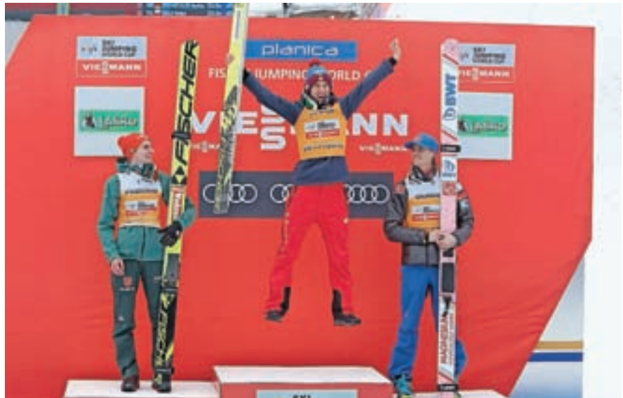
Junak Planice in celotne sezone je bil Poljak Kamil Stoch, ki je takole skočil na mesto za najboljšega v seštevku svetovnega pokala.