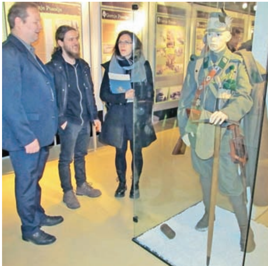
Razstava Naši gorski strelci v Slovenskem planinskem muzeju