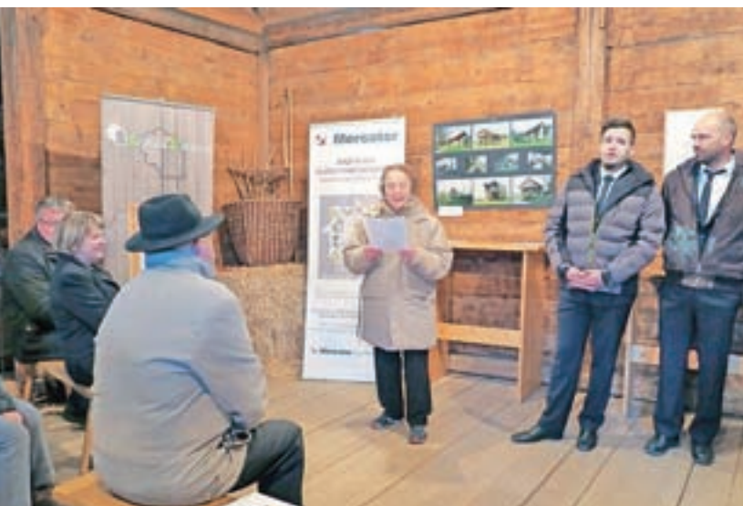
Kozolci na Liznjekovi domačiji