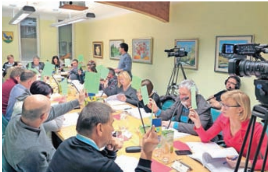
Svetniki so proračun za leto 2017 soglasno podprli.

Kot pravi, bodo tudi v prihajajočem letu nadaljevali z majhnimi, a učinkovitimi projekti po vsej občini. »Od Rateč, kjer bomo asfaltirali in uredili vaško jedro, do odkupov zemljišč za ureditev dodatnih kolesarskih povezav. Uredili bomo stari gasilski dom v Podkorenu in center Kranjske Gore, sanirali športno-pripravljalni center Ruteč, kjer želimo imeti kvalitetno nogometno igrišče s pripadajočo infrastrukturo. Uredili bomo vrh Vršiča, sanirali parkirišča, in če bo mogoče, uredili informacijsko točko s sanitarijami. V Martuljku sta v načrtih ureditev pločnika in preplastitev ceste, prav tako v Martuljku bi radi uredili še eno plezalno pot v soteski Hladnika, s parkirišči, seveda. Pred nami je še izgradnja vodohrana v Podkorenu, za kar bomo