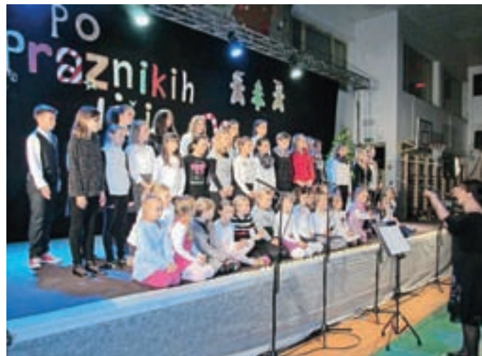
Ob prazniku so v telovadnici Osnovne šole 16. decembra Mojstrana pripravili prireditev z naslovom Po praznikih diši, ki so jo združili z Dnevom šole.