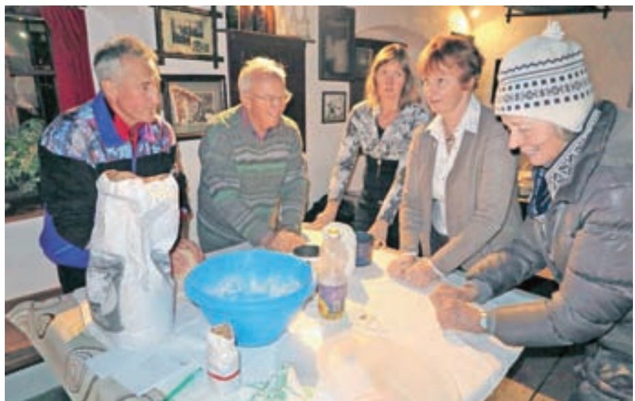
Testo za kruh je treba dobro pregnesti. Med delom je bilo obilo priložnosti za klepet in izmenjavo izkušenj.

za redno peko kruha sicer nima časa, se pa rada nauči kaj novega in preživi čas v prijetni družbi. »Pravzaprav sem si zaželela kruha, pa sem prišla,« je povedala z nasmehom.