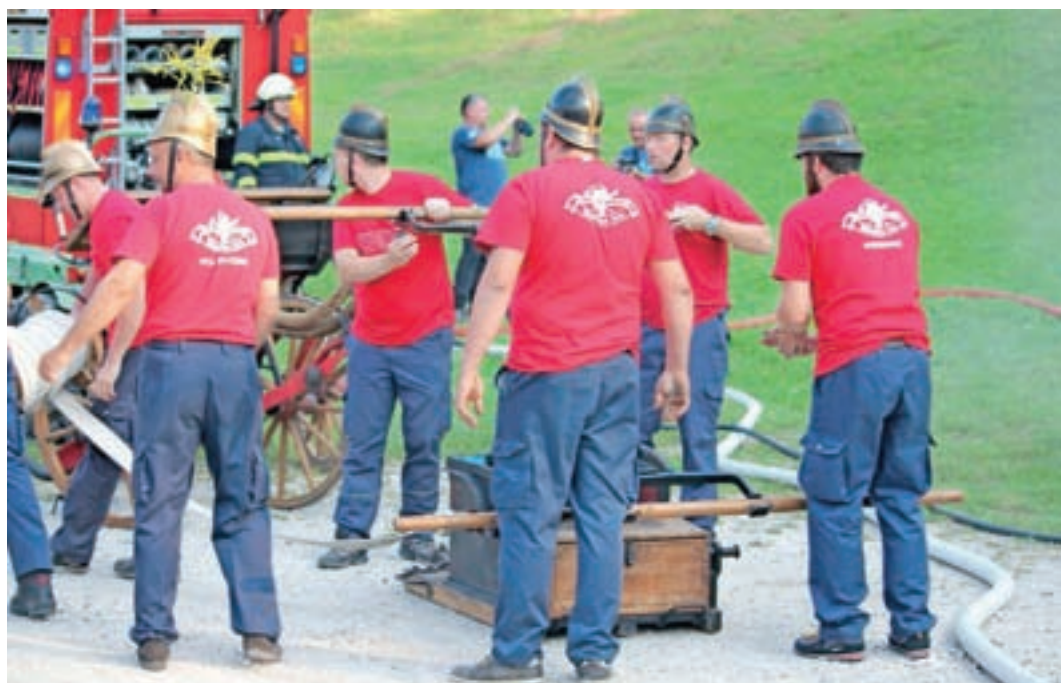
Dovški in mojstranški gasilci so se požara lotili s staro brizgalno, ki so jo uporabljali v času pred avtomobili.

Otroci so se na delavnicah lotili sajenja planika, ki letos – prav tako kot Kredarica – obeležuje 120 let, odkar je bil uvrščena med zaščitene rastline. Da so bile alpske rožice mile tudi slavnemu dovškemu župniku pa je potr-