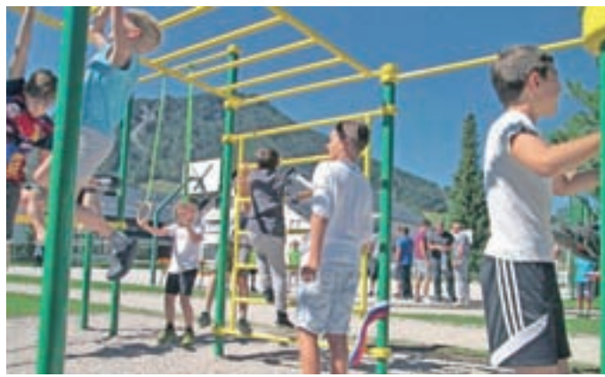
Ulična rodja omogočajo razgibavanje celega telesa.