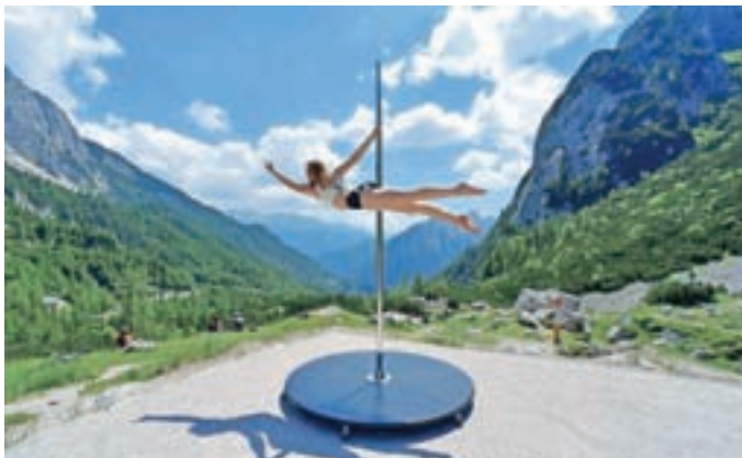
Na Vršiču so plesalke ob drogu prejele bučen aplavz.