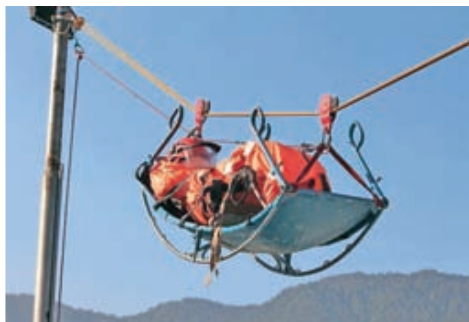
Obiskovalci Aljaževih dnevov so lahko opazovali, kako je GRS Mojstrana ponesrečenca v dolino spustila tudi s pomočjo škripca.