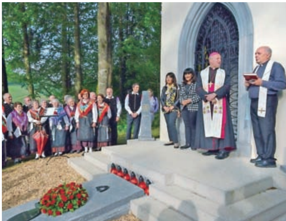
Maja so nastopali na zaključku Kongresa slovenskih zdravnikov na Visokem in sodelovali pri blagoslovu obnovljene kapelice v počastitev dr. Tavčarju.