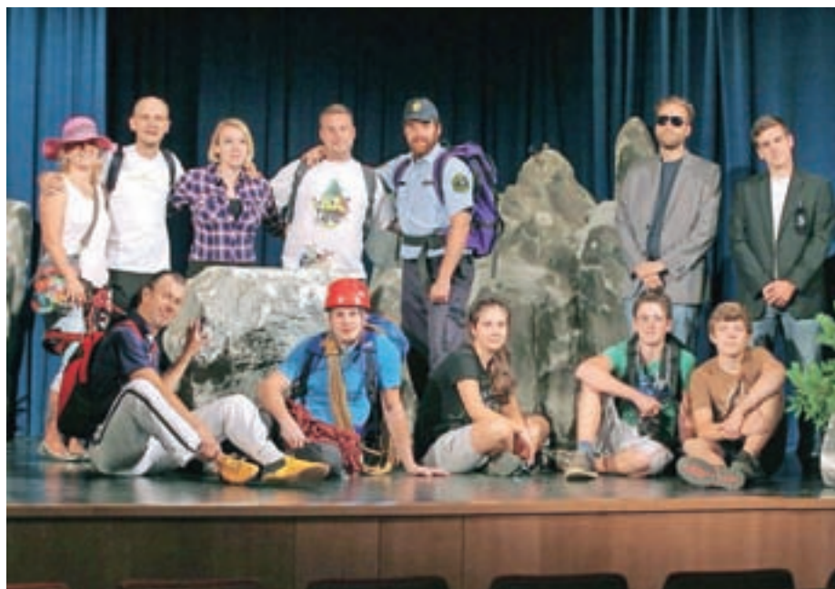
Igralska ekipa Doma na Kredarici

»Vesela sem bila povabila v predstavo, zanimivo se mi je zdelo, da sta me Marsel in Leona videla v vlogi fine Ljubljankane, saj sicer v Triglavskih pravljicah nastopam v vlogi