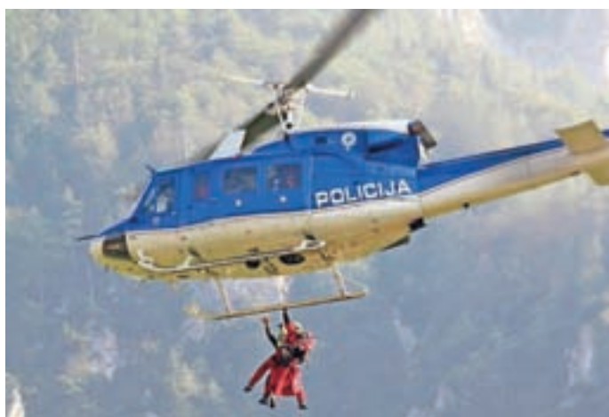
Mojstrana je v okviru 24. Aljaževih dnevov izvedla reševanje ponesrečenca, na pomoč pa jim je priskočil tudi helikopter Slovenske policije.

V nedeljo so se obiskovalci lahko brez znoja, brez prerivanja na gorskih poteh in v treh minutah odpravili na Triglav – pohod so organizirali s pomočjo 3D VR-očal. Zaključek dnevov pa je potekal v Vratih, kjer sta koncert Vox Carniola in sveta maša v kapeli sv. Cirila in Metoda kronala zelo aktiven konec tedna v Aljaževih najljubših krajih.