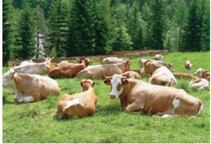
Na Gorenjskem je več priložnosti za živinorejo, kot za poljedelstvo.

Kot navaja Rezarjeva, kmetijstvo na Gorenjskem na približno 5 tisoč kmetijah predstavlja okoli dva