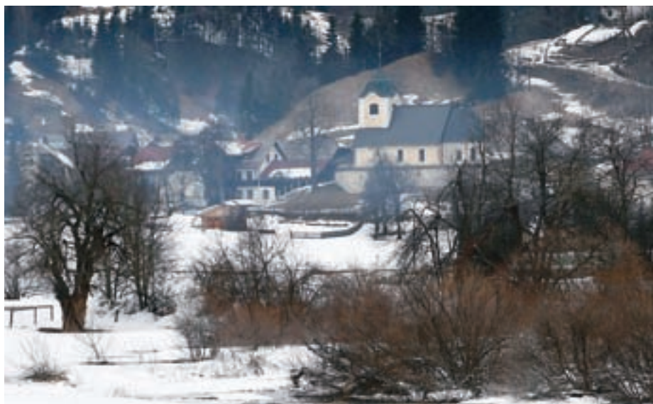
Mokrišče Ledine je Zavod za varstvo narave 2004 opredelil kot naravno vrednoto državnega pomena. Domačini se velikega pomena mokrišča ne zavedajo, so prepričani v Društvo Jalovec.