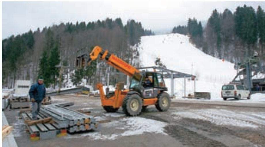
Dela v ciljni areni so se ta teden že začela, tekmovalno progo pa bodo dokončno pripravili v prihodnjih dneh.

Seveda tudi letos ne bo manjkalo spremljalnega programa in zabave, najbolj živahno