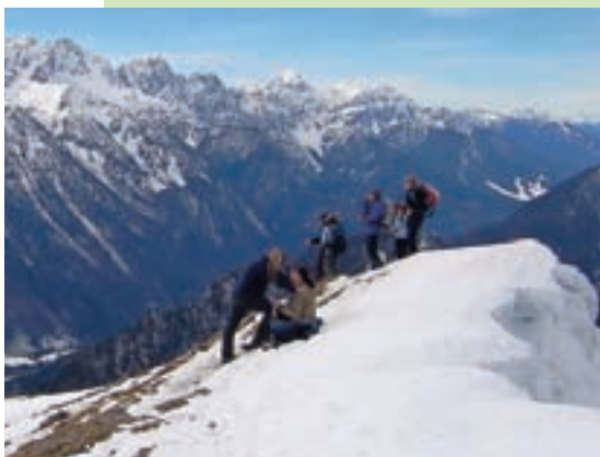
Februarski osvajalci Dovške Babe

Dovška Baba je 1891 metrov visoki vrh v Karavankah, med planinci izredno priljubljen v poletnih in zimskih mesecih. Dostop ni zahteven, posebej v poletnih mesecih. Več pasti skriva pozimi, posebej ob obilnem snegu obstaja velika nevarnost proženja plazov. Ob ugodnih razmerah se z vrha proti dolini radi spuščajo turni smučarji. Letos januarja in februarja je bilo snega manj za smuko, so pa drugi planinci izkoristili lepe sončne dneve za osvojitve vrha. Trud pri vzponu je bil poplačan s čudovitimi razgledi na vrhove Julijskih Alp in na sosednjo Koroško. J. R.