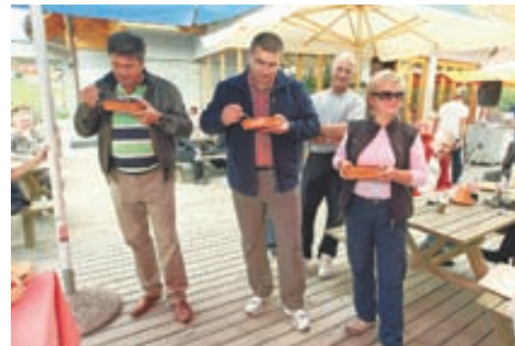
Komisija si je o golažu delila različna mnenja ...