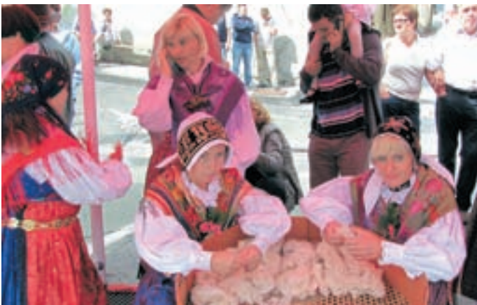
Obiskovalci so lahko spoznali, kako se izdelujejo izvorna rateška obuvala, imenovana žoki.