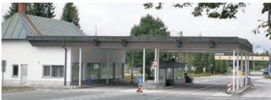
Na nekdanjem mejnem prehodu Rateče odstranjujejo nadstrešnice in objekte mejne kontrole. Ostale stavbe bi občina rada uporabila v turistično informacijske namene.

naj na občino brezplačno prenese objekte na obeh nekdanjih mejnih prehodih. "Izpraznjene prostore bi s pridom uporabili za izvajanje turistično informativne dejavnosti in promocijo turistične ponudbe. Medtem ko hotelska podjetja večinoma sama skrbijo za zasedenost lastnih kapacitet, pa je za individualne oddajalce sob to področje dokaj neurejeno in kliče po izboljšavah. Zato je zelo pomembno, da predvsem tuji turisti lahko dobijo celovito turistično informacijo takoj, ko vstopijo v Republiko Slovenijo. S pridobitvijo prostorov bi pridobila tudi lokalna turistična društva," so prepričani na občini, kjer pa na odgovor države še čakajo. Marjana Ahačič