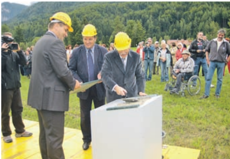
V začetku septembra so položili temeljni kamen in začeli graditi novi dom za starejše v Kranjski Gori.

V Kranjski Gori so v začetku meseca položili temeljni kamen za novi dom starejših občanov. Prvi stanovalci že prihodnjo zimo.