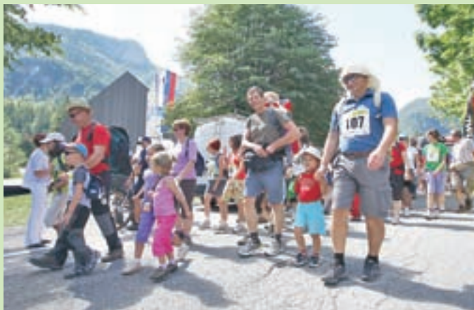
Družine so se odpravile po poteh Triglavskih pravljic.