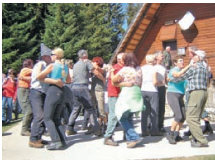
Na slovenski strani se je kot vedno tudi plesalo. Tokrat ob zvokih ansambla Katerman.