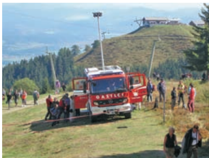
Novo gasilsko vozilo so na vrhu Peči na ogled postavili gasilci iz Rateč.