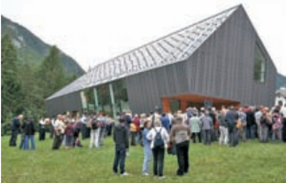
Na slovesnost ob odprtju Slovenskega planinskega muzeja, ki stoji v neposredni bližini nekdanje stavbe Triglavske muzejske zbirke ob vstopu v dolino Vrat, je prišlo več kot tisoč planincev iz vseh koncev Slovenije.