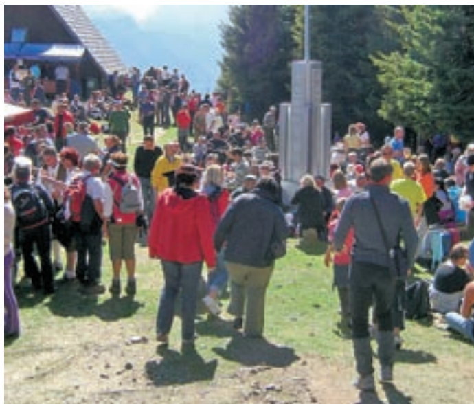
Planinke in planinci so na Tromejo prišli s slovenske, italijanske in avstrijske smeri.

Na Tromeji nad Ratečami se je zbralo več kot deset tisoč planink in planincev. Nekaj utrinkov s tradicionalnega srečanja treh dežel smo ujeli v fotografski objektiv.