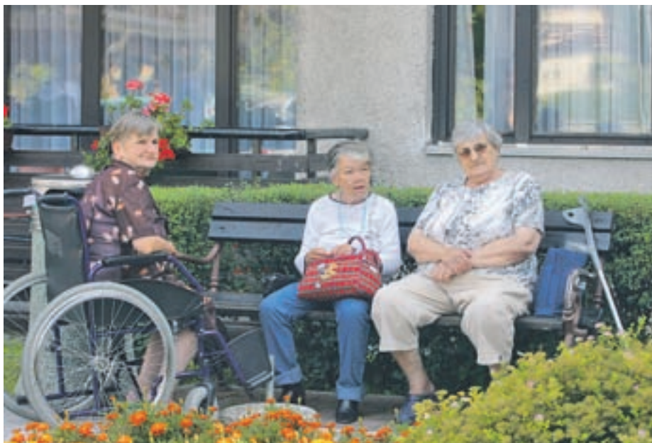
Večina starejših si starost želi preživeti doma, v svojih lastnih stanovanjih oziroma gospodinjstvih.