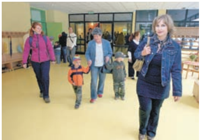
Med počitnicami so šolo temeljito obnovili, tako da so na prvi šolski dan otroci prišli v svetle in prijazne nove prostore.