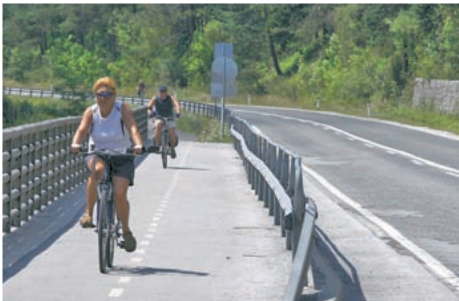
Posebej dobro obiskana je bila letos poletni kolesarska steza, ki vodi skozi občino.

Letos so turistični delavci zabeležili nekaj manjši obisk domačih gostov, nekaj manj je bilo tudi gostov iz Nemčije, zadovoljni pa so s porastom na italijanskem trgu ter z dejstvom, da so več nočitev realizirali tudi na trgu Velike Britanije. "Odlično obiskana je naša kolesarska steza, dober obisk beleži tudi kolesarski park, obiskovalcev poletnega sankališča pa je bilo manj, kot smo pričakovali. So se pa številni gostje in obiskovalci udeležili različnih prireditev, ki smo jih preteklo poletje pripravljali v Kranjski Gori. A kljub temu da je bila destinacija dobro obiskana, ocenjujemo, da je bila potrošnja naših gostov manjša kot v preteklih letih."