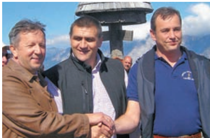
Zbrane so pozdravili župani treh sosednjih občin: Kranjske Gore, Trbiža in Podkloštra.