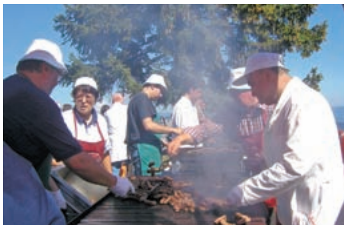
Na slovenski strani ni šlo brez čevapčičev, ki Ratečanom prinesejo največ zaslужka.