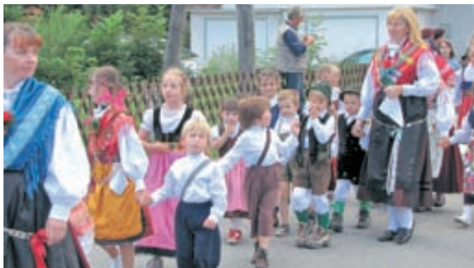
Nastopili so zbori, folklorne skupine, otroci iz vrtca, citrarka in harmonikar.