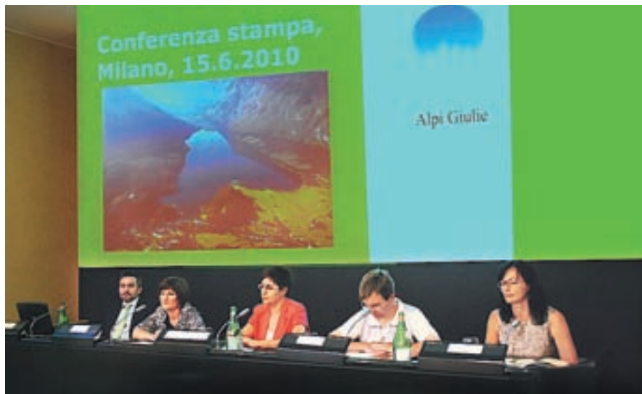
Direktorji zavodov za turizem so v Milanu predstavili svoje destinacije, njihove značilnosti in posebnosti.

Konferenco je v glavni poslovni stavbi druge največje italijanske banke Intesa Sanpaolo