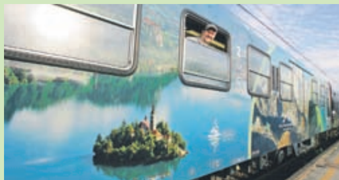
Vlak Julijske Alpe so poslikali s podobami Bleda, Bohinja, Kranjske Gore, doline Soče in Triglava.