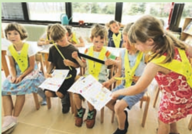
Rumene rutke za varno pot v šolo in iz nje

Kranjska Gora, Mojstrana - Da bo pot v šolo in nazaj varna, morajo poskrbeti vsi udeleženci v prometu. Tako vozniki, ki naj bi bili takrat, ko vozijo po šolskih poteh, še posebej previdni in pozorni, kot tudi šolarji. Starši, učitelji in policisti jih vsako leto ob začetku šolskega leta opozarjajo na previdnost na cesti, najmlajše pa opremijo še z rumenimi rutkami, s pomočjo katerih so v prometu bolj vidni, vse druge pa spomnijo, kdo so najranljivejši udeleženci v prometu.