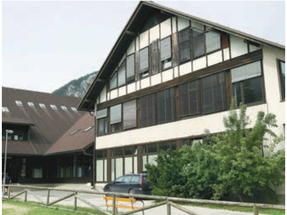
Z investicijsko-vzdrževalnimi deli bodo obnovili predvsem vse instalacije, zamenjali streho, toplotno izolirali fasado in opravili druga notranja dela v stavbi.

Mojstrana - V Mojstrani so konec maja zaključili z gradnjo novega mosta čez reko Bistrico. Investitor je bila Direkcija republike Slovenije za ceste, vrednost del pa 300 tisoč evrov. Star most je bil dotrajan, preozek in na njem ni bilo pločnikov. Izvajalci so kljub neugodnim vremenskih razmeram dela zaključili v petih mesecih. J. R.