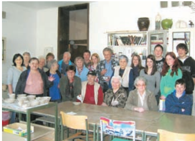
Na srečanju v OŠ Kranjska Gora