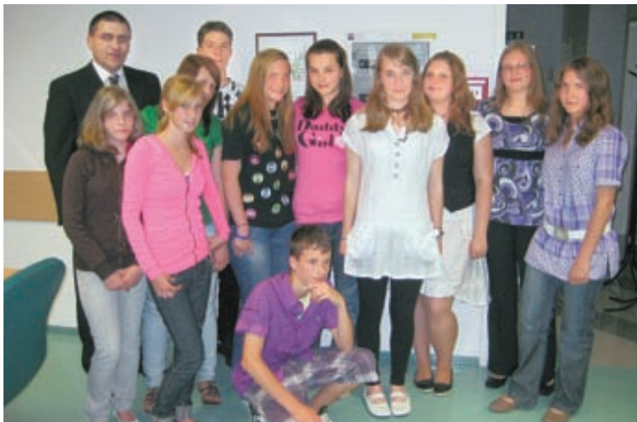
Najboljši iz generacije, ki je letos končala osnovno šolo, so se ob koncu šolskega leta zbrali pri županu.

Kot je še dejal župan, si seveda vsi želijo, da bi čim več mladih tudi po koncu šolanja ostalo