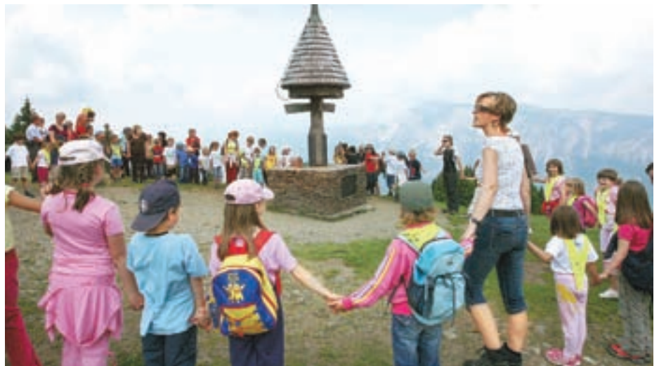
Prijateljstvo v treh jezikih: na Tromeji so se v začetku junija srečali prvošolci iz Kranjske Gore, Trbiža in Čajne. Ravnateljice so podpisale pogodbe o nadaljnjem sodelovanju.

katerem so se doslej učiteljice iz Italije, Avstrije in Slovenije dvakrat na teden izmenjavale pri učenju otrok v vrtcu in prvem razredu.