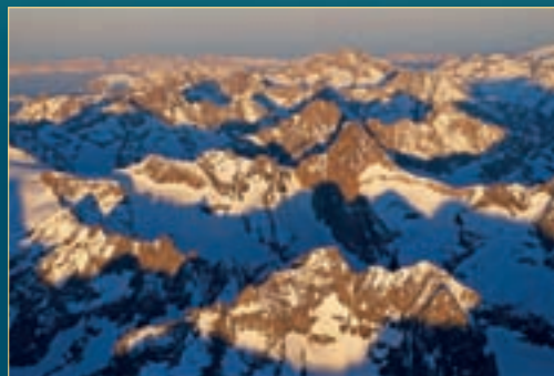
Pogorje des Ecrins (Francija)

»ALPE – kot jih vidijo ptice« je mednarodni projekt , s katerim predstavljamo celotno verigo Alp, kot izjemen in enkratni geološki, geografski, biotski, kulturni ter gospodarski prostor. Projekt pokriva celotne Alpe in zajema države: Monako, Francijo, Italijo, Švico, Liechtenstein, Nemčijo, Avstrijo in Slovenijo.