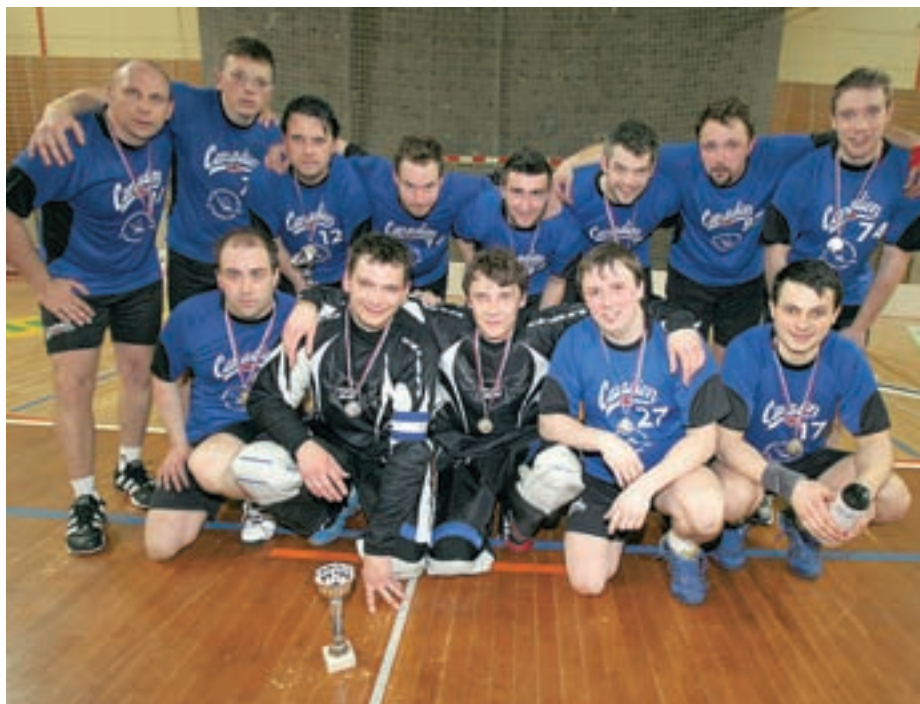
Ekipa ŠD Zelencev Kranjska Gora je v finalu morala priznati premoč ekipi InSporta, kljub temu pa so se po zadnji tekmi v dvorani Poden v Škofji Loki veselili drugega mesta.