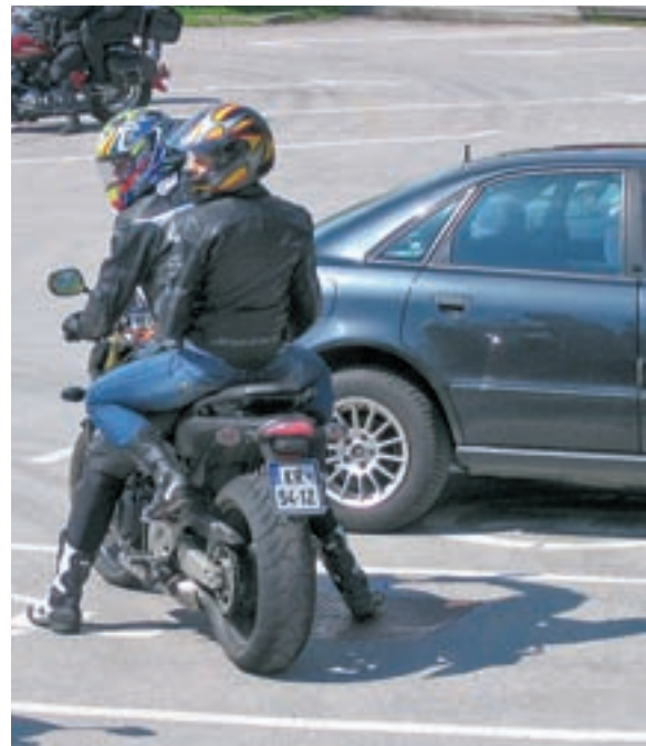
Policisti svetujejo posebno previdnost predvsem v prvih vožnjah v sezoni.

- Če vaše motorno kolo nima zavornega sistema ABS, v dežju ali na spolzkem vozišču ne zavirajte na talnih označbah.