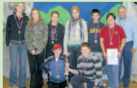
Udeleženci državnega tekmovanja društva Mladi gasilec z mentorji

Vsi udeleženci smo po srečanju dobili medaljo, ki nas bo spominjala na srečanje in druženje. Iskreno se zahvaljujemo vsem, ki ste nam priskočili na pomoč in sicer pri učenju prve pomoči, pri izbranih darilih za naše gostitelje in za varen prevoz v Semič in nazaj. Še enkrat iskrene čestitke mladim gasilecem. T. S., M. L.