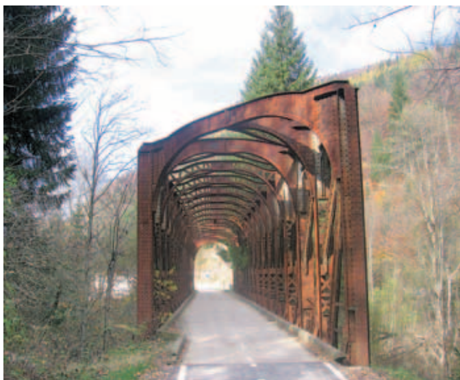
Železniški most na Tabrah danes služi kolesarjem.