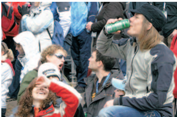
Na letošnji planiški tekmi ni bilo pretirano opitih gledalcev, novi ukrepi pa so se izkazali kot dobri.