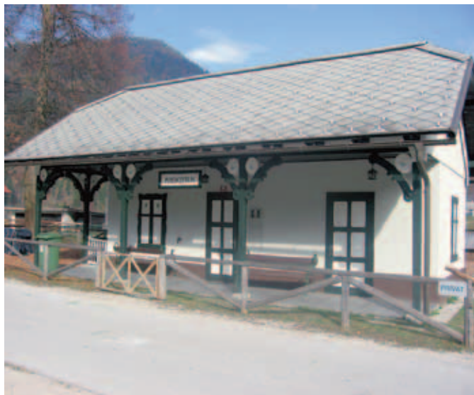
Nekdanja železniška postaja v Podkorenu

Zgornjesavska dolina je izjemno bogata z naravno in kulturno dediščino. Ta najboljši košček sveta na vsakem koraku skriva čudovite biserne, ki nemo hranijo svoje zgodbe. Bralcem Zgornjesavca želimo omogočiti, da bi bolje spoznali svoj dom in se spomnili zgodb, ki so jih morda že slišali od svojih staršev, starih staršev ali drugih ljudi, ki živijo ali so živeli v tem skrajno severozahodnem delu Slovenije.