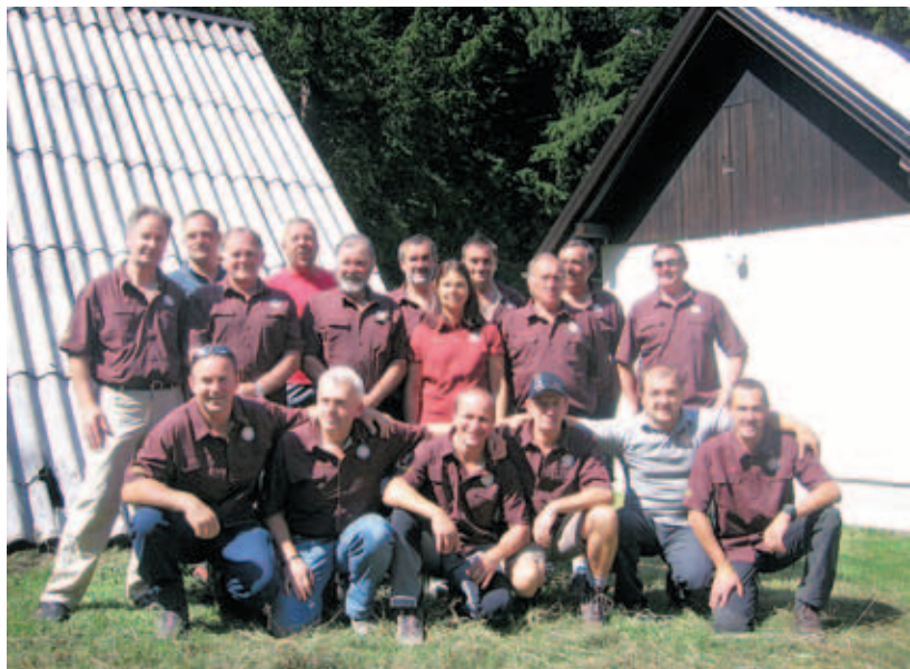
Ekipa izkušenih gorskih reševalcev v Ratečah.