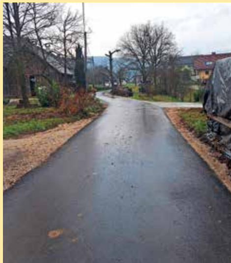
Obnovljena cesta z vodovodom in drugo infrastrukturo na Trati

Tudi ostalih večjih in manjših projektov je bilo veliko, in sicer sta bila preplaščena dva cestna odseka v Podrovniku in en odsek Na Vidmu, postavljena je bila nova krajevna tabla Na Vidmu, na vseh avtobusnih postajah so bile za udobnejše čakanje montirane klopi, prebarvani sta bili dve avtobusni postaji, po opozorilu KS je bila letos končno izrisana sredinska črta na glavni cesti, na strehi gasilskega doma je bila nameščena sončna elektrarna, skupaj s KS Podblica smo oddali pobudo za preplastitev ceste Zgornja Besnica–Nemilje, obnovljen je bil