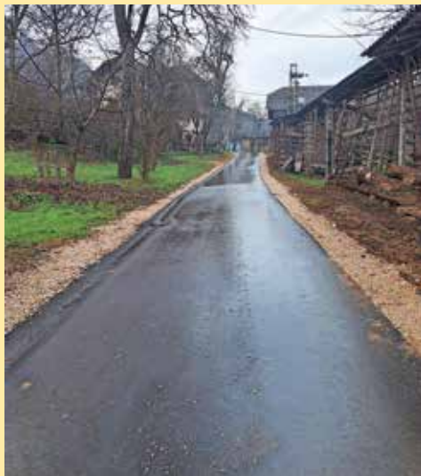
Obnovljena cesta z odvodnjavanjem v Podrovniku

kom, je bila letos popolnoma obnovljena cesta v Podrovniku in urejeno odvodnjavanje. Za leto 2024 je bil za našo krajevno skupnost podan le en predlog, ki je bil nato seveda tudi potrjen. To je priprava projekta za izgradnjo pločnika od Pešnice do gasilskega doma ter delna izvedba. Krajanе vabimo, da razmislijo o predlogih za leto 2025 in jih, ko bo s strani Mestne občine Kranj (MOK) objavljen poziv, tudi oddajo. Krajanе pozivamo tudi, da svoje predloge za MOK oddajo na naslovu https://www.krpovej.si/ , saj je odgovor s strani MOK tam pogosto hitrejši, kot nam ga uspe pridobiti v KS.