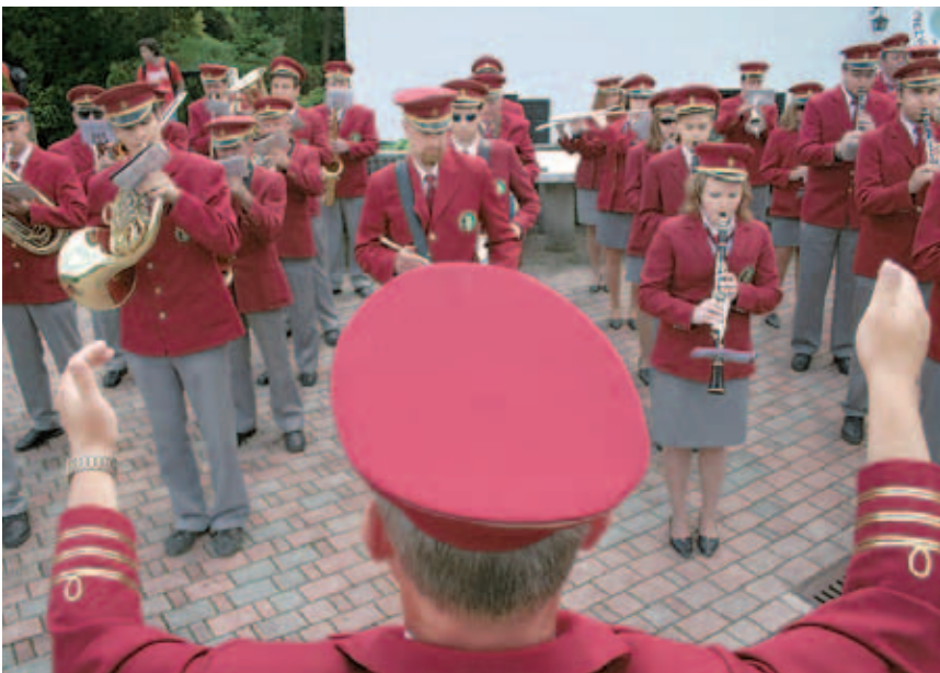
Poleg folklornih skupin so nastopili tudi godbeniki.