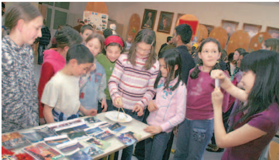
Prizor s prireditve Globalna vas.