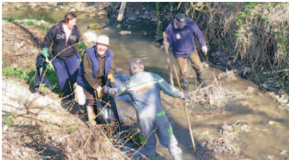
Več občanov je čistilo strugo potoka Suha.