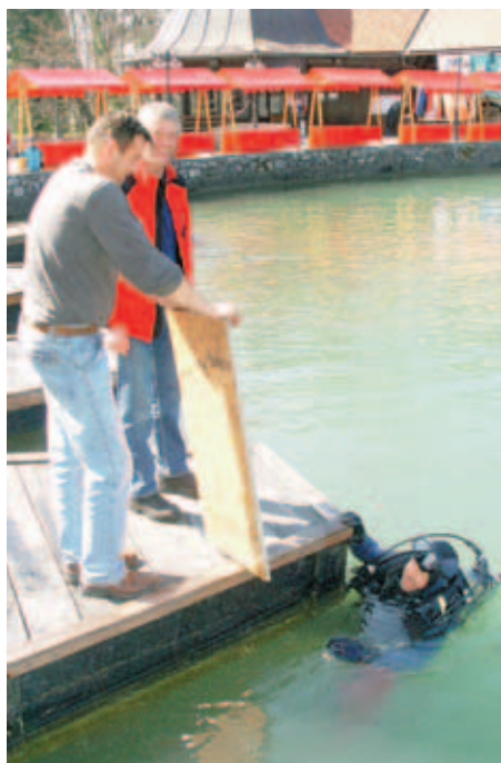
Iz jezera Črnava so potapljači potegnili marsikatero zanimivo najdbo, med drugim tudi tole polico.