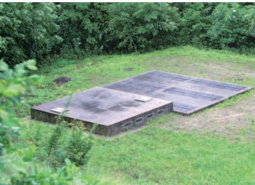
Čistilna naprava v Bašlju