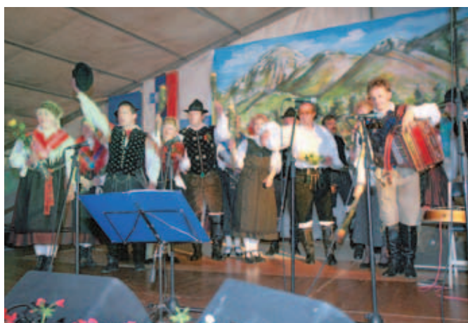
Preddvorsko občinstvo je zelo ponosno na domače muzikante, na koncert pa so prišli tudi mnogi od drugod.