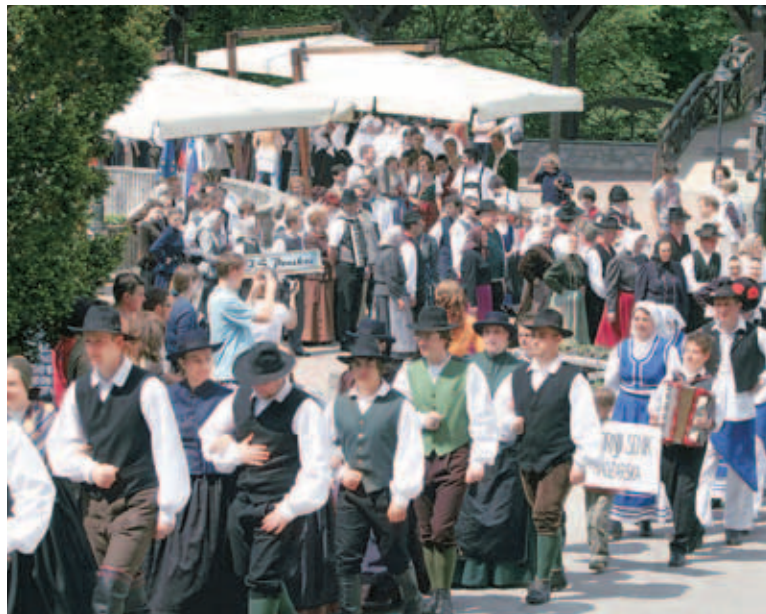
Sprevod sodelujočih folklornih skupin na mednarodnem folklornem festivalu