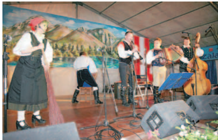
Pred tremi desetletji je nastal ansambel Gašperji. Na koncertu ob obletnici so zaigrali "stari" Gašperji, sestava izpred 30 let.