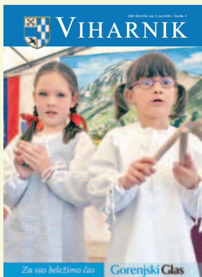
Na naslovnici: Udeleženci folklornega festivala v Predvoru, foto: Matic Zorman

”Ministrstvo za okolje in prostor nas je pozvalo, da damo pripombe k odloku o regijskem parku, da bi ga na vladi lahko sprejeli. Občinski svet odločitve še ni sprejel, opredelil se bo, ko bodo razgrnjeni projekti in ko bodo znani tudi rezultati javne razprave. Na programskem svetu smo župani občin, ki bi bile vključene v omenjeni regijski park, ministrstvo opozorili, da s tem ne gre hiteti. Mnenja ljudi so namreč zelo razdeljena, in sicer zaradi slabih izkušenj, ki jih imajo zaradi omejitev v okviru Nature 2000. Krajevni odbor Bašelj je do njega zavzel negativno stališče. V Kokri pa je predsednik krajevnega odbora kljub poprejšnjemu dogovoru z menoj, da razpravo umaknemo do obiska ministra v Kokri, sklical krajevni odbor. Na njem je enostransko poročal in dobil sem vtis, da je bilo vse skupaj predstavljeno tako, da želijo z regijskim parkom preprečiti dostop iz Kokre proti Krvavcu. Menim, da sta dve opciji, ki ju je dal na glasovanje, nekorektni. Moral bi dati še tretjo in vprašati navzoče, ali so krajanji proti regijskemu parku in proti žičnični povezavi na Krvavec. V interesu občin, ki naj bi sodile v regijski park, je, da o tem še razpravljamo.”