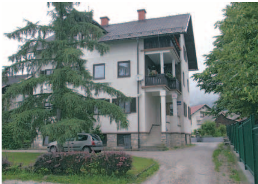
V Valičevi vili bi bil lahko zdravstveni dom.