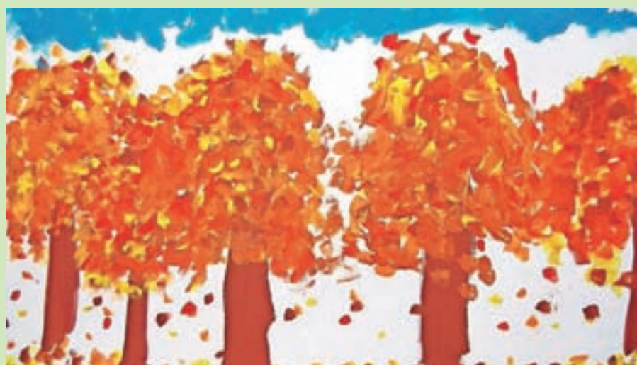
Dejavnost knjižnice se lepo dopolnjuje s šolo. Slika Mance Gorjanc iz tretjega razreda OŠ Predoslje.