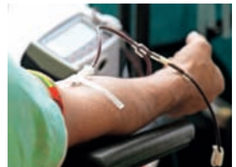
Vsako leto v septembru imamo krvodajalsko akcijo.

V prihajajočem letu 2024 želimo vsem krajanom Kokrice zdravja, veliko pozitivne energije in medsebojnega razumevanja.