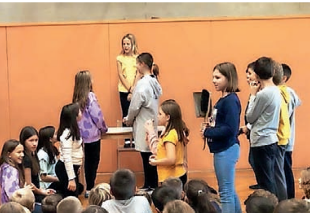
Petošolci so se izkazali s predstavo o Sneguljčici in sedmih palčkih.

je odgovorila na vprašanja, ki so jih zastavili učenci, ki obiskujejo novinarski krožek.