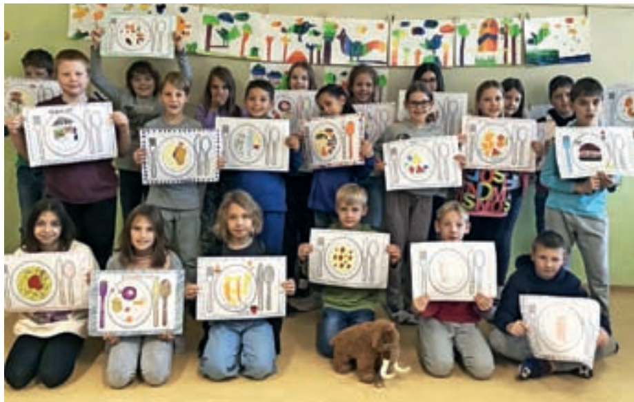
V okviru projekta so petošolci likovno ustvarjali tradicionalne jedi.

Otroci bodo svoje kuharske podvige delili s finskimi sovrstniki po elektronski pošti. Zapisali bodo recepte, posebnosti slovenskih jedi in delili utrinke iz kuhinje, tako domače kot šolske. Pri ustvarjanju in okušanju tradicionalnih jedi, obogatjenih z zgodovino in lokalnimi okusi, jih bo spremljala tudi razredna šolska