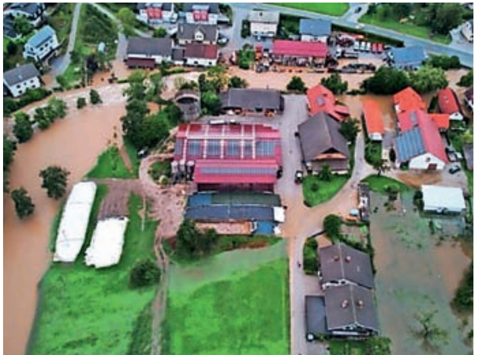
Poplavljeni Kokrica

smo tudi tradicionalno tekmovanje na Kokrici – Memorial ustanovnih članov. Vse naše ekipe so dosegle zadovoljive uvrstitve, tako da smo lahko ponosni nanje in na čas, ki ga vložijo v treninge.