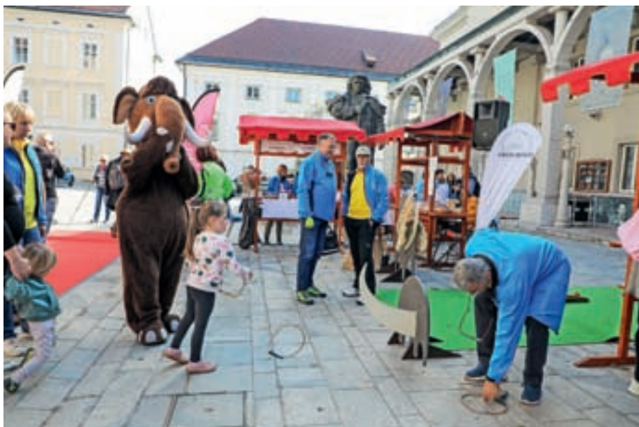
Sodelovali smo tudi na prvem Dnevu krajevnih skupnosti v Mestni občini Kranj.

aktivnosti društva pa bomo zaključili 26. decembra z domovinskim pohodom z baklami po ulicah Kokrice in Mlake.