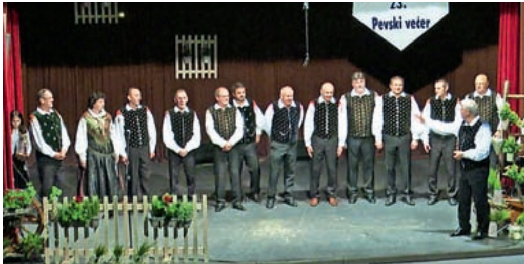
Pevski večer