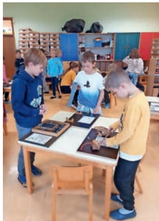
Učenci med izvajanjem eksperimentov

Kljub zelo natrpanemu urniku si je za obisk šole vzela čas tudi naša nekdanja učenka, uspešna športna plezalka Mia Krامل. Z veseljem