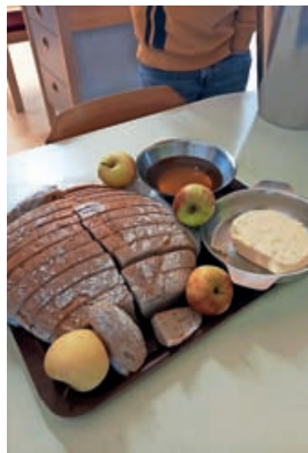
Tradicionalni slovenski zajtrk

Sodelovanje v takšnih projektih pripomore k oblikovanju odprtega in strpno naravnane družbenega okolja ter spodbuja trajno mednarodno povezovanje med mladimi.