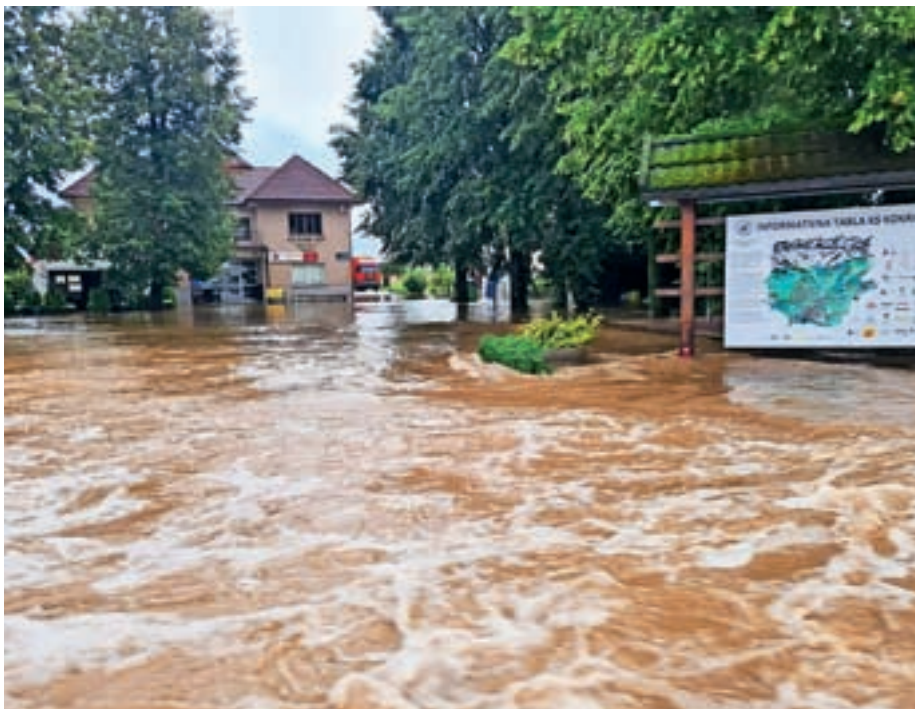
V avgustovskih poplavah je bil poplavljen tudi Kulturni dom Kokrica.

V avgustovskih poplavah je bil poplavljen tudi Kulturni dom. Kurilnico v kleti je voda zalila do stropa, uničene so bile plinska peč, razsvetljava in električna napeljava. Poleg tega je voda zalila tudi nedavno prenovljeno kletno sejno sobo, ki je tako potrebna ponovne prenove, v samo enem letu. Sanacija sejne sobe je še v teku, saj zaradi konstantnih padavin in veliko vlage izsuševanje sten ni tako učinkovito, kot smo sprva pričakovali. Prav tako smo že zamenjali peč in uredili elektroinštalacije v kurilnici, da bodo dogodki v dvorani lahko potekali nemoteno tudi ob nizkih zunanjih temperaturah.