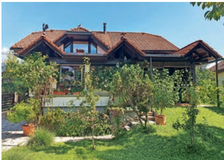
Ponovno smo ocenjevali najlepše urejene hiše in vrtove.