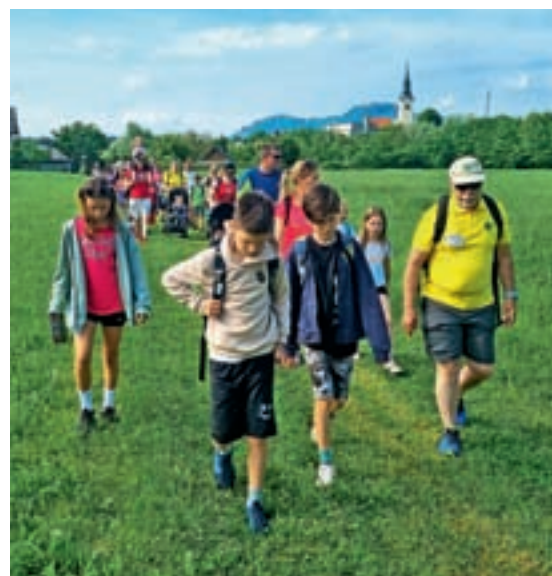
Pohod po mamutovi deželi smo nadgradili s tri kilometre dolgim pohodom za otroke.

In že je tu december, ko bo 5. decembra ob 17. uri predšolske otroke naše KS obiskal Miklavž, 10. decembra vabimo na božično-novoletni koncert z ansamblom Slovenski zvoki,