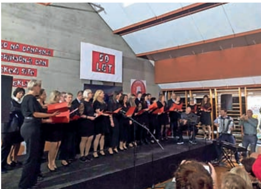
Skupaj s predstavniki društev smo se udeležili zaključne proslave ob praznovanju 50-letnice Podružnične šole Kokrica.