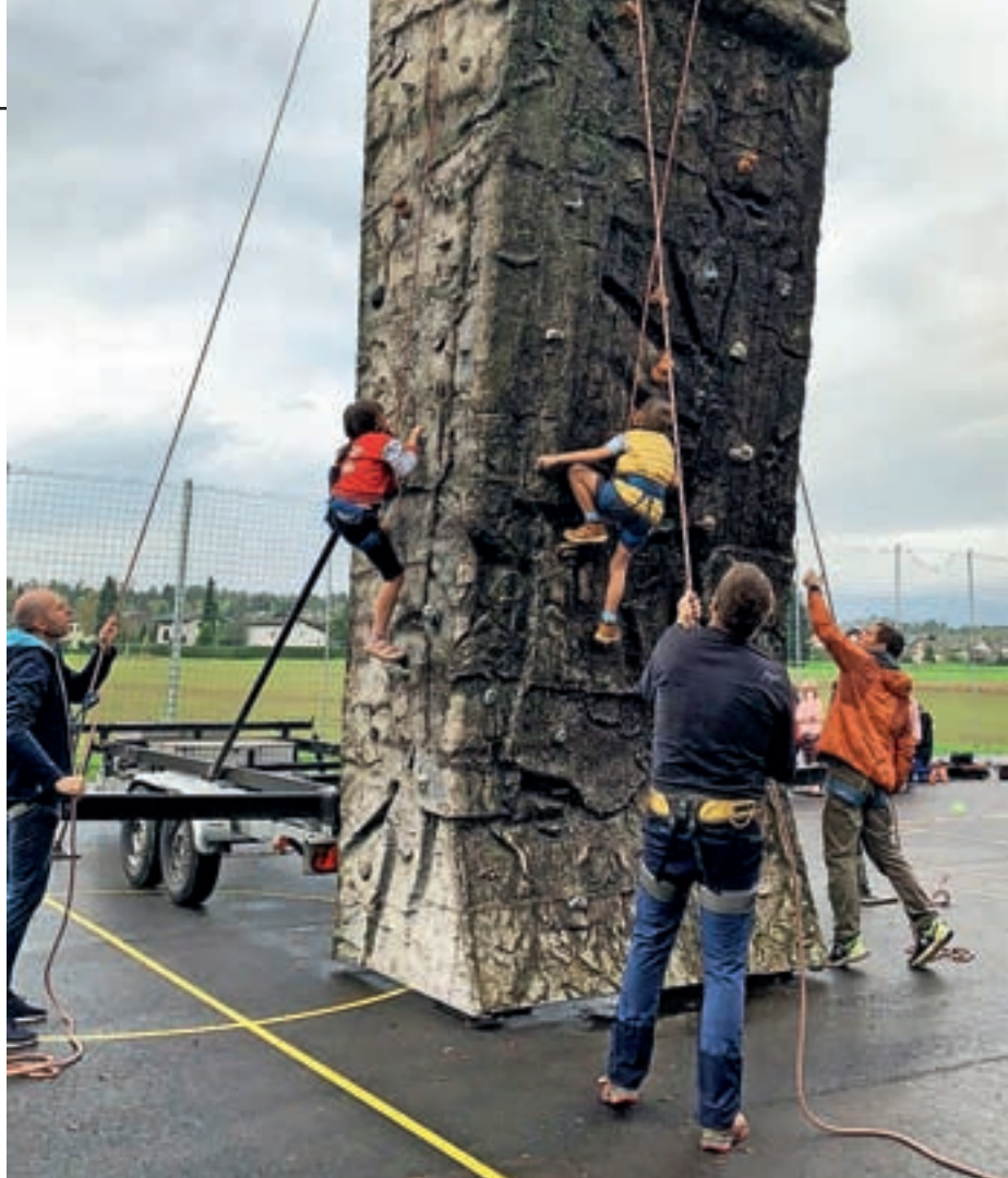
Plezalna stena je bila na športnem dnevu izziv za marsikaterega učenca.

Ujete utrinke si lahko ogledate na spletni strani šole in na Facebooku. Petdesetletnica šole pa bo tudi osrednja tema letošnjega bazarja in šolskega glasila.