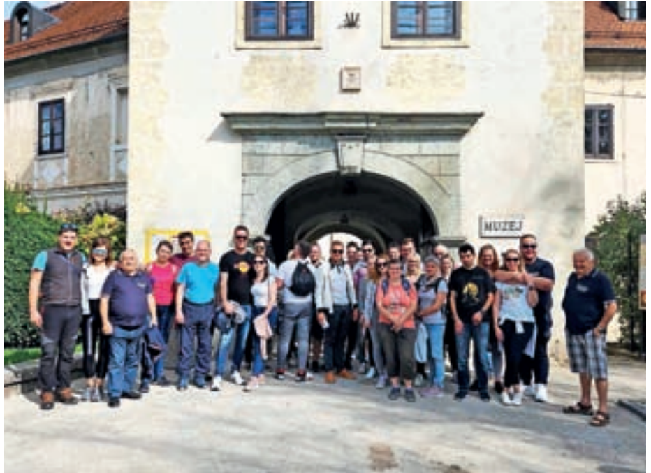
Na izletu

Poleg intervencij smo kokriški gasilci tudi aktivno sodelovali v družabnem, športnem in kulturnem življenju svoje skupnosti. Organizirali smo tradicionalno gasilsko zabavo na Kokrici, ki je privabila veliko obiskovalcev in jim ponudila zabavo, glasbo in dobro hrano. Vse leto so naše ekipe vseh starosti tekmovali na gasilsko-športnih tekmovanjih, organizirali pa