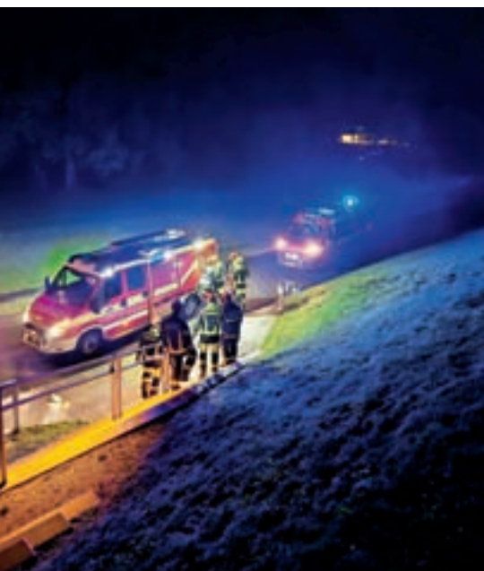
Med intervencijo ob poplavah

Gasilsko društvo Kokrica se zahvaljuje tudi vsem občanom, ki so nam izkazali svojo podporo in zaupanje. Zahvaljuje se vsem sponzorjem, donatorjem, partnerjem in prijateljem, ki so nam pomagali pri našem delovanju in razvoju. V društvu bomo še naprej opravljali svoje poslanstvo in skrbeli za varnost in blaginjo ljudi.