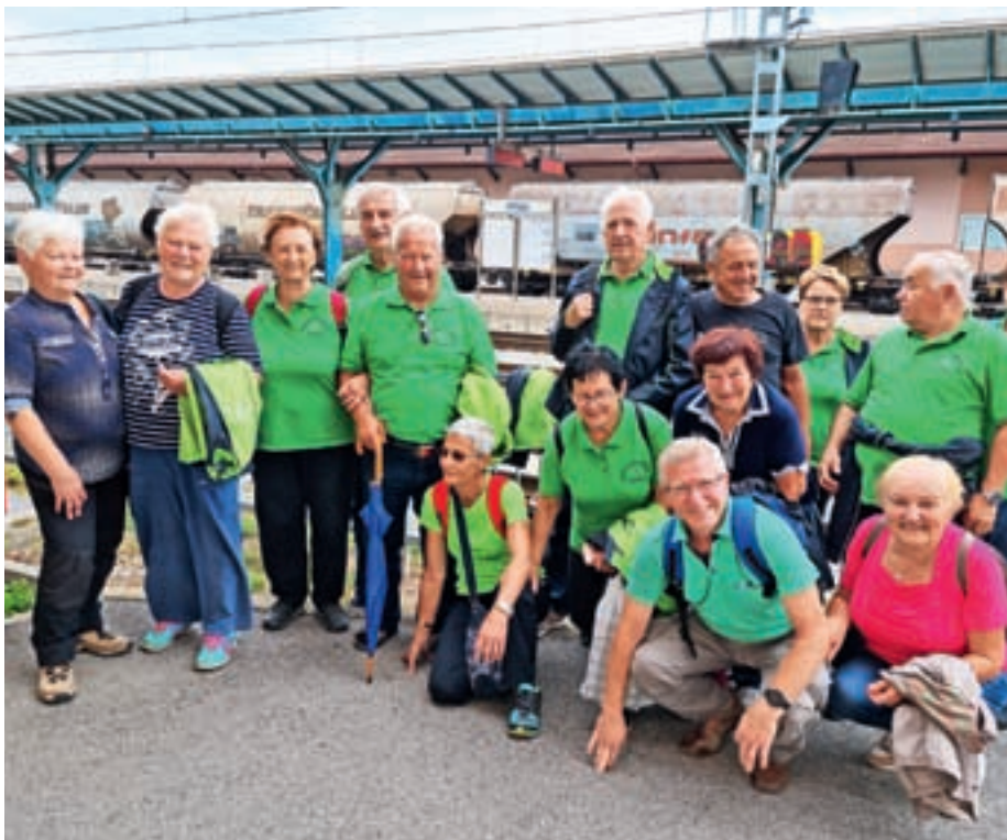
Na železniški postaji na Ptuj

večina nosila zelene društvene majice, smo se počutili kar malo nelagodno, saj v Mariboru prevladuje vijolična barva. Časa nismo imeli veliko, hitro je sledila vrnitev nazaj proti Ljubljani, kamor smo prispeli v večernih urah, od tam pa smo do Kranja izkoristili še brezplačno vožnjo z avtobusom. Vsi smo si bili enotni, da je bila