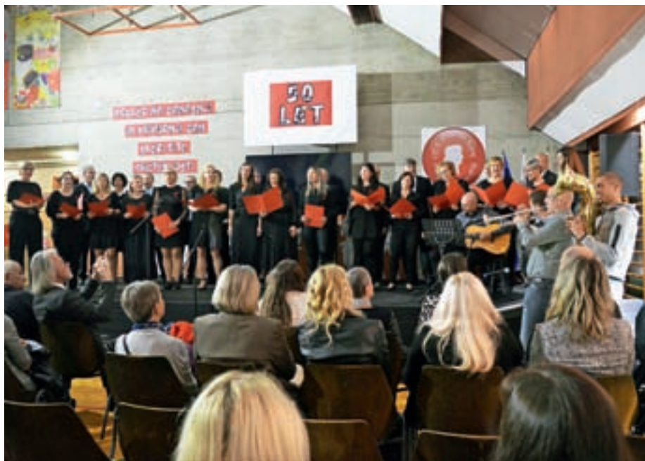
Zaključna glasbena točka na slavnostni prireditvi