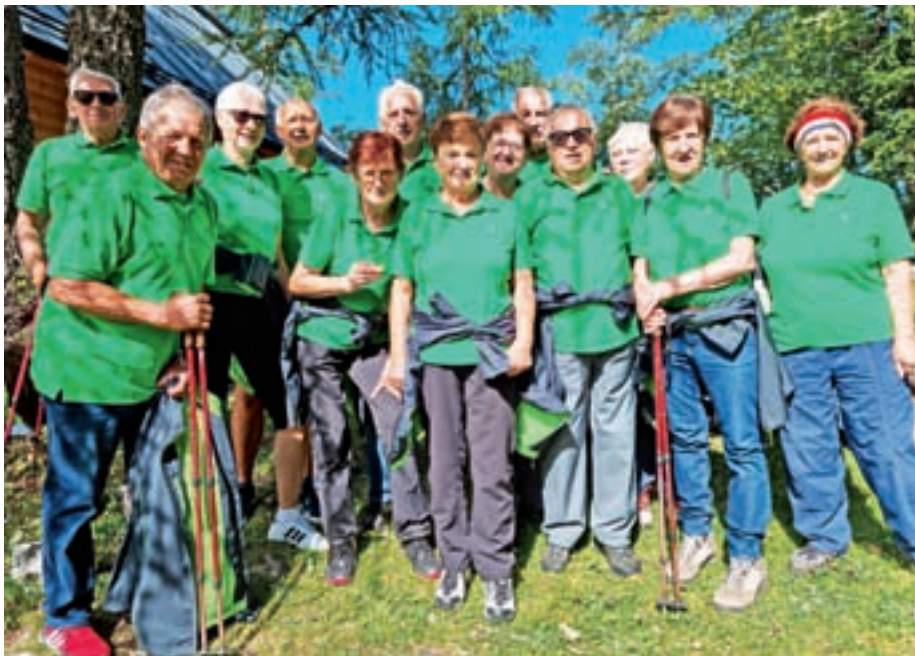
Pohod na Krvavec

Na Ptuj smo prispeli z zamudo, zato smo si vzeli čas samo za kavo in kratek sprehod po mestu. Na železniški postaji nam je uslužbenka svetovala, naj se zapeljemo v Maribor, od tam pa nazaj v Ljubljano z direktnim vlakom. Tako smo prispeli v Maribor, ki je bil naš prvotni cilj. Posedli smo se v bližnjem lokal, ker pa nas je