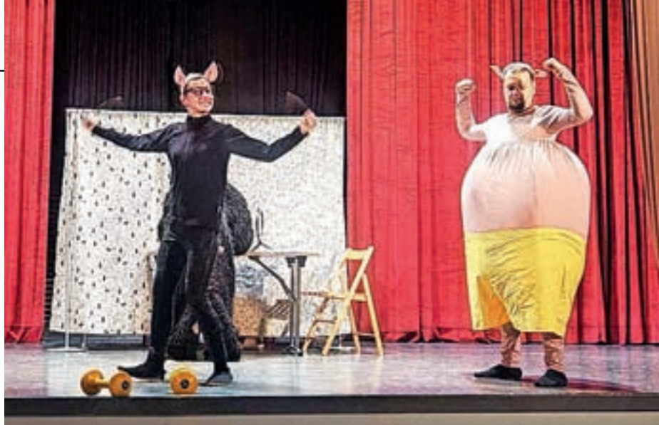
Z vaje za predstavo Trije prašičji prašički