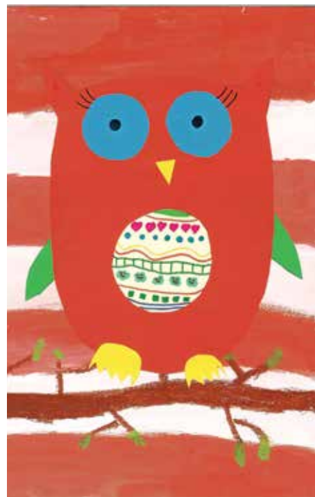
Pisana sova, Tajda, 1. č