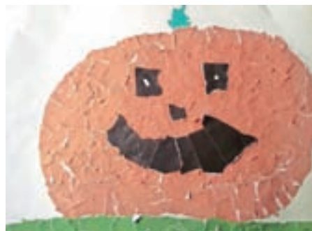
Monika, 1. č