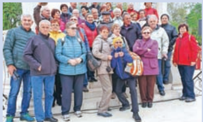
Na prvem letošnjem izletu smo obiskali hrvaško mesto Bjelovar.

Da ne bi vsega našteval, naj omenim, da nam je letošnji piknik društva, kljub temu da brez dežja ni šlo, zelo uspel. Tudi na srečanju starejših nad 80 let, ki smo jih gostili v brunarici Štern na Kokrici,