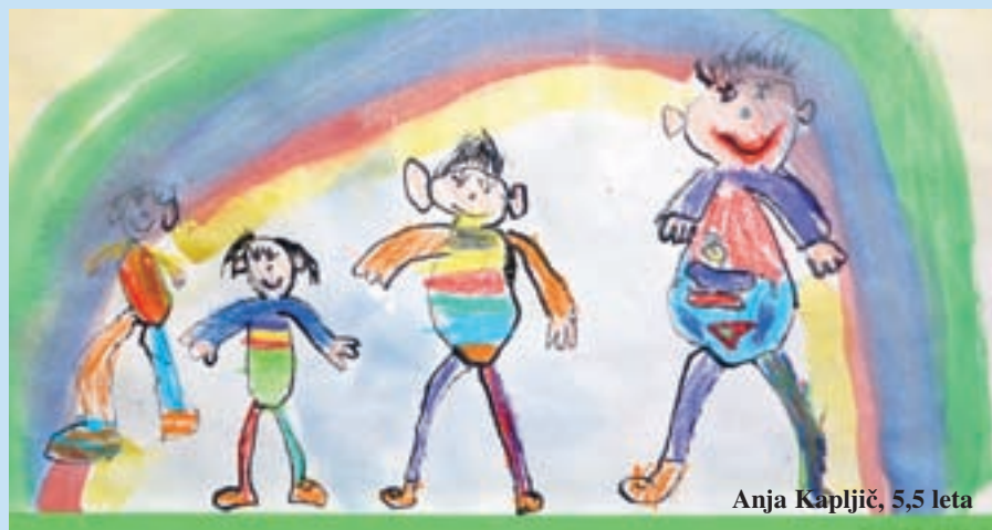
Anja Kapljič, 5,5 leta