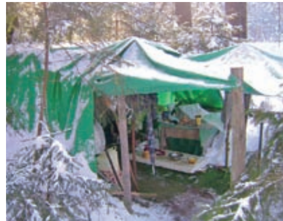
V takšnih razmerah živi naš sokrajan.

Pozivam vse krajane, ki bi omenjenima krajanoma lahko na kakršen koli način pomagali, da priskočijo na pomoč. Seveda bi najbolj potrebovala streho nad glavo, kjer bi imela svoj