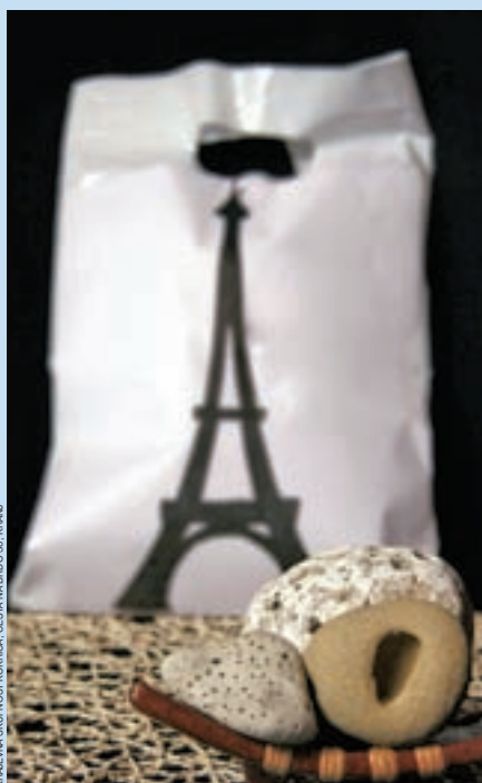
KRAJEVNA SKUPNOST KOKRICA, CESTA NA BRDO 30, KRANJ