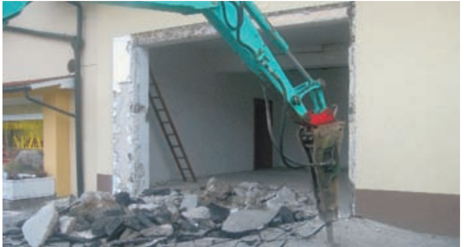
"Garažo bomo poglobili, uredili odvodnjavanje, uredili elektroinstalacijo, ogrevanje, zamenjali vrata in postavili garderobne omarice za hranjenje zaščitnih oblek."

Druga še pomembnejša naloga, ki je pred nami, vključuje tudi vas, drage vaščanke in vaščani, saj je brez vaše pomoči ne bomo mogli izpeljati tako, kot smo si jo zastavili v načrtih za letošnje leto. Decembra, ko so naši člani s koledarjem v roki trkali na vrata in pobirali članarino, ste poleg koledarja prejeli tudi manjše obvestilo, da bomo letos kupili novo gasilsko vozilo za prevoz moštva GVM-1 in da bomo v ta namen pobirali tudi prostovoljne prispevke. Vozilo, ki ga sedaj uporabljamo za prevoz moštva, bo leta 2011 (ob devetdesetletnici delovanja našega gasilskega društva) staro že štirinajst let, in ne zagotavlja varne vožnje, poleg tega tudi ne zadostuje več novim predpisom o varnosti v cestnem prometu. Vozilo potrebujemo za pre-