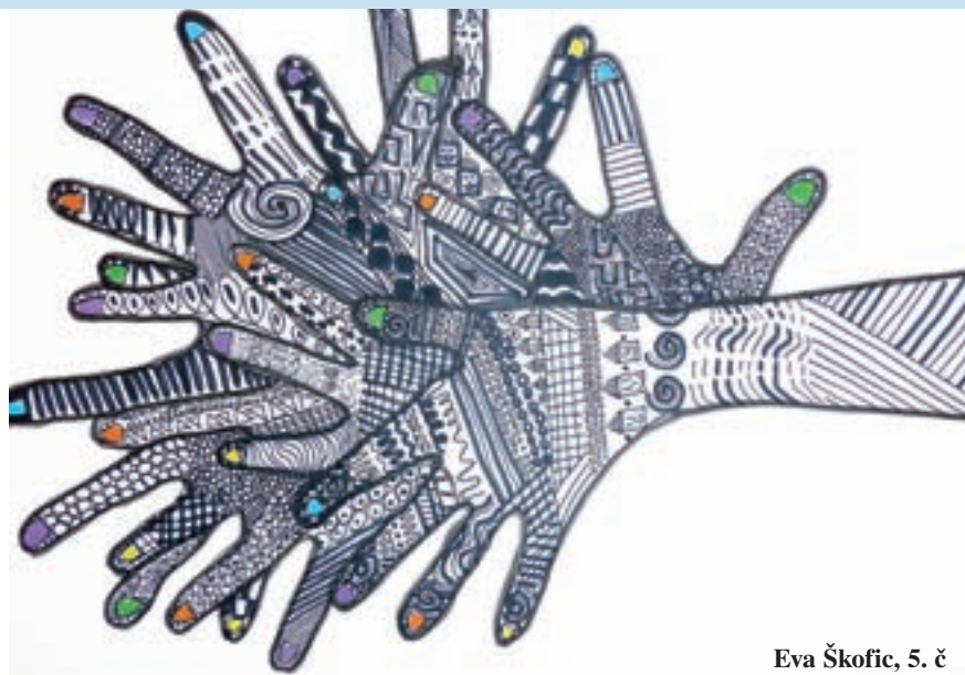
Eva Škofic, 5. č