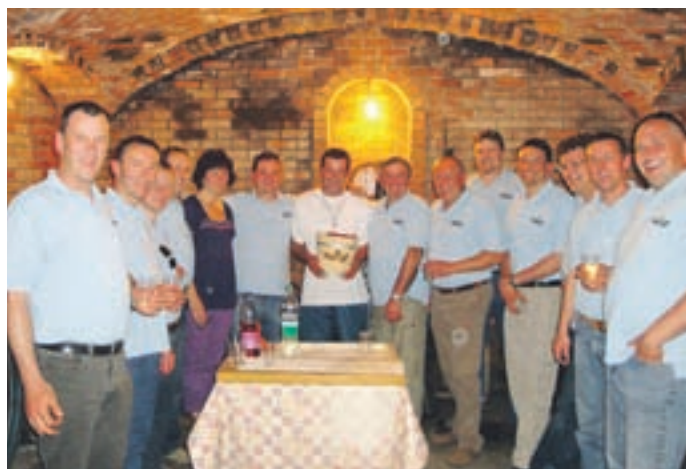
Po nastopu v cerkvi Žalostne Matere Božje maja v Jeruzalemu in ob blagoslovu kapelice smo gostitelju zapeli tudi v njegovi vinski kleti.

Nudimo okusno domačo in vedno svežo hrano