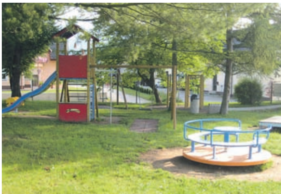
Otroško igrišče ob gasilskem domu bo odprto tudi med počitnicami.