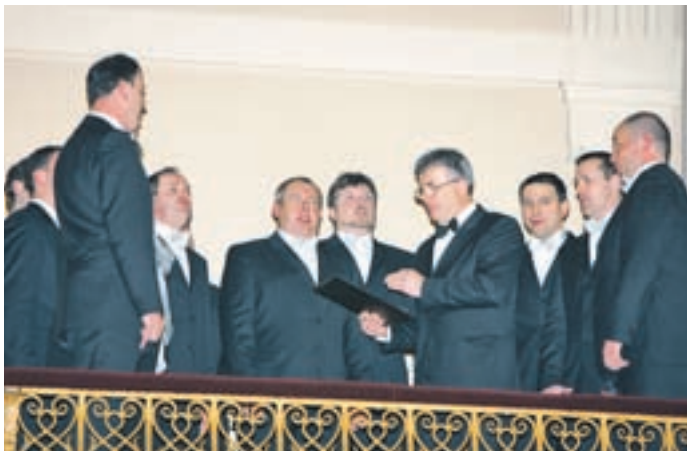
Nastop na Ljubljanski univerzi ob slavnosti podelitvi doktoratov

Vokalna skupina Kokr'čan ima za seboj pestro pevsko sezono, ki so jo obeležili tudi s petnajstletnico delovanja skupine.