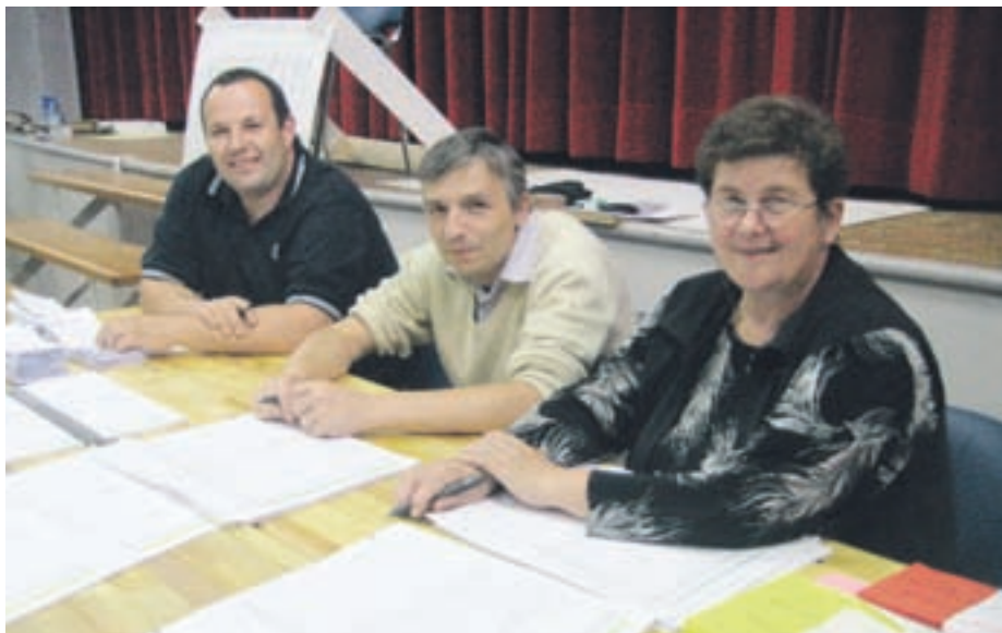
Sedež volišča za izvedbo posvetovalnega referenduma v Krajevni skupnosti Kokrica je bil v tamkajšnjem kulturnem domu.

Poglejmo še volilni rezultat v šestih naseljih: na Kokrici je bilo 466 veljavnih glasov, od tega jih je bilo 78 za (16,74 odstotka), proti pa 388, kar je 83,26 odstotka. Na Mlaki je bilo 528 veljavnih glasov, od tega jih je bilo 328 za (62,12 odstotka), proti pa 200, kar je 37,88 odstotka. V Srakovljah je bilo 30 veljavnih glasov, od tega so bili 4 za (13,33 odstotka), proti pa 26 (86,67 odstotka). V Tatincu je bilo 12 veljavnih glasov, od tega 1 za (8,33 odstotka), 11 pa pro-