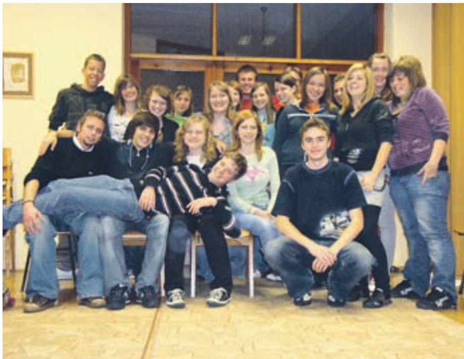
Animatorji se že veselijo oratorija.