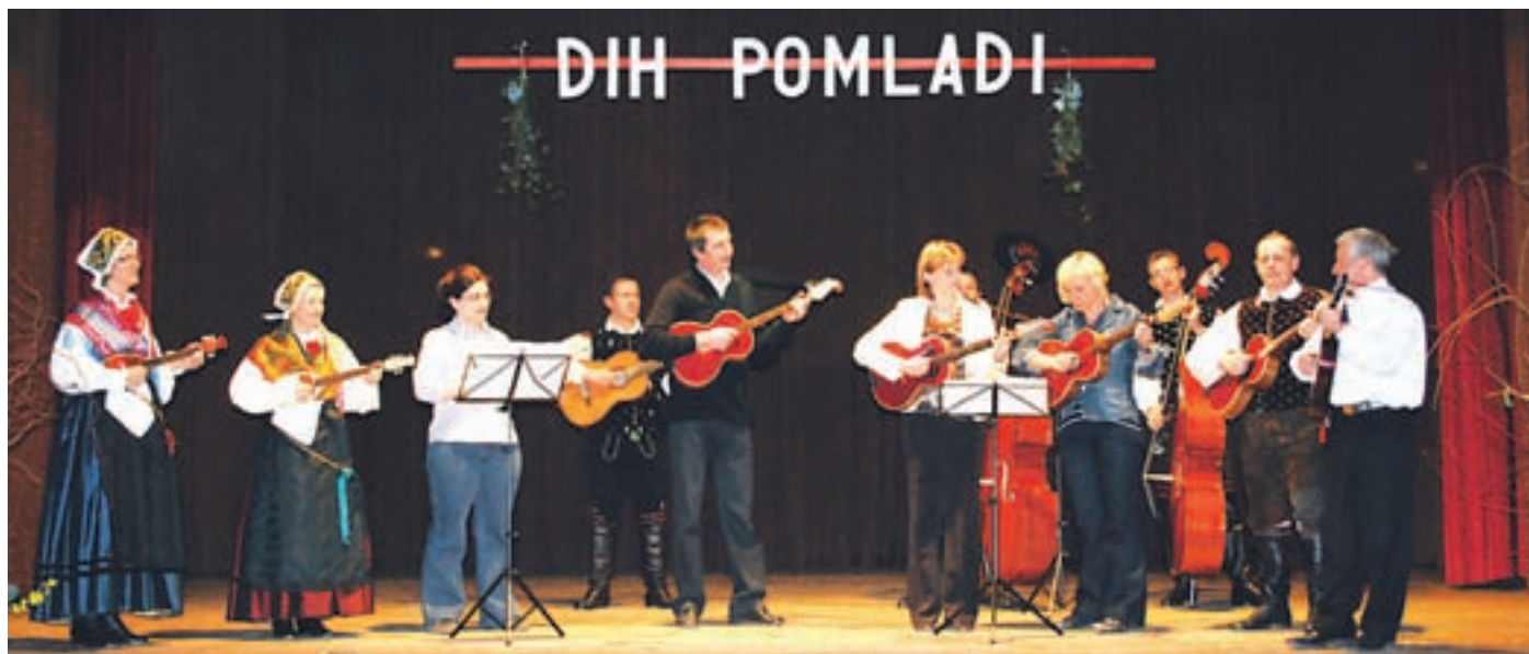
Foto utrinka iz prireditve Dih pomladi, ki je namenjena predvsem predstavitvi mladih izvajalcev (glasbenikov, pevcev).