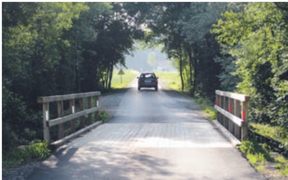
Obnovljeni most med Mlako in Bobovkom

tev, bo Svet KS poskrbel, da se bodo začrtani projekti na območju Mlake normalno izvajali.