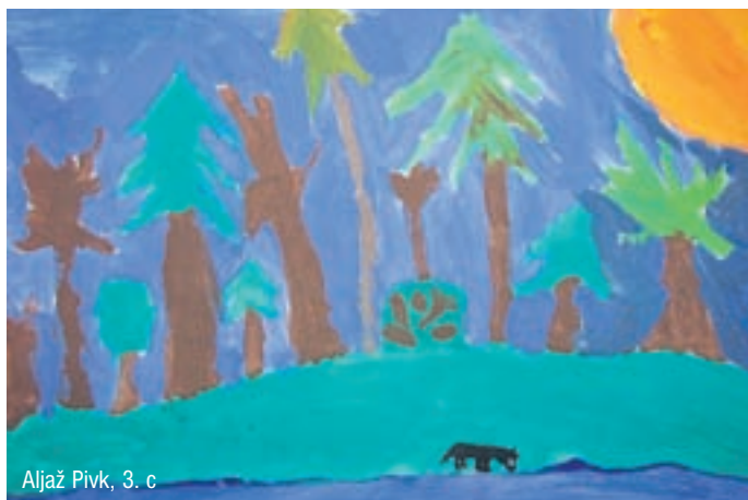
Aljaž Pivk, 3. c