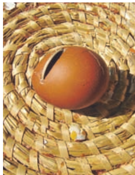
Tradicionalna prireditev na velikonočni ponedeljek Sekanje pirhov, kjer je bilo kar živahno. Mladež je veselo valicala pirhe ali z metom palice skušala zadeti pirhe. Starejši pa so z veliko natančnostjo skušali zadeti pihv v peharju. Najboljši so bili nagradjeni z dobrotami iz Mercatorja.