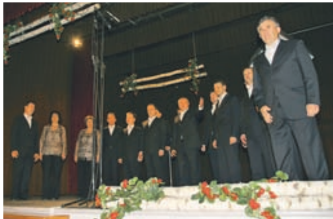
14. tradicionalni pevski večer na Kokrici

Mešanega zbora Dobra iz Naklega, Nonet Brda iz Goriških Brd, Moški pevski zbor Bizeljsko iz Bizeljskega in Moški pevski zbor Fran Berneker iz Starega trga. Največ napora v obliki pevskih vaj je bilo v tej sezoni name-