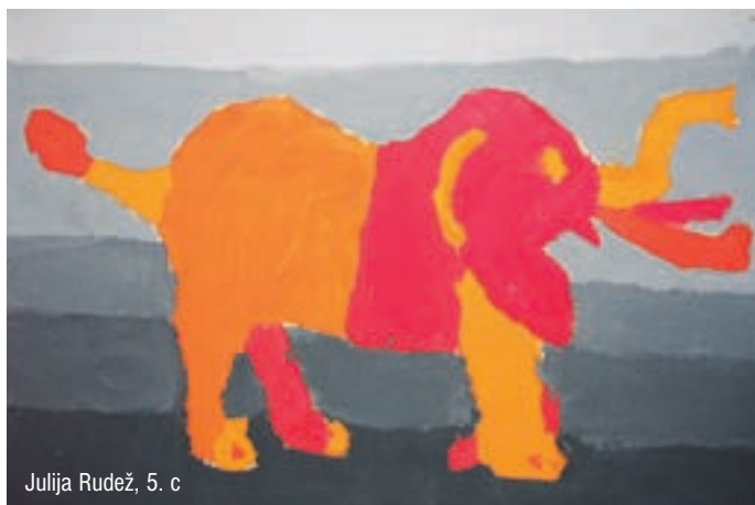
Julija Rudež, 5. c