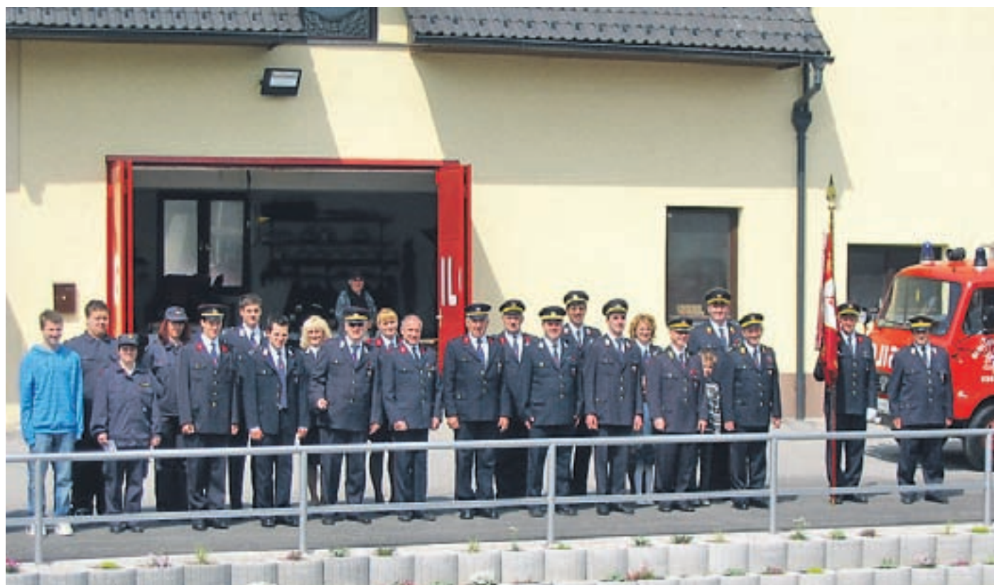
Fotografija je nastala po Florjanovi maši pred obnovljenim gasilskim domom na Kokrici.

Po naporni tekmovalni sezoni bo čas tudi za sprostitve, zato bomo gasilci tako kot vsako leto organizirali dvodnevno vrtno veselico. Vabimo vas, da se v petek, 26., in soboto, 27. junija, od 20. ure dalje na parkirišču nakupovalnega centra Mercator skupaj z nami zavrtite in povesebite. Že sedaj pa vas vabimo vse tiste, ki seveda to lahko storite, da prispevate kaj za srečelov in nam s tem zmanjšate finančno breme. Z gasilskim pozdravom NA POMOČ! Andraž Šifrer