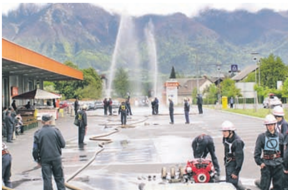
Tekmovanje za memorial ustanovnih članov PGD Kokrica

Poleg obnove in izobraževanja so naši člani skupaj z Gasilsko reševalno službo Kranj sodelovali pri čistilni akciji v Kranju, kjer smo poskrbeli za logistično podporo vsem organizacijam in društvom čistilne akcije. Ravno