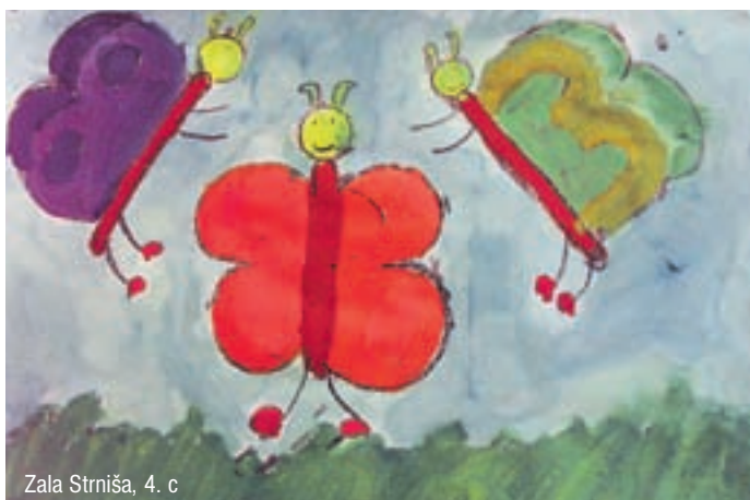
Zala Strniša, 4. c