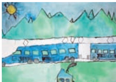
Irenej Hvastil, 3. c.