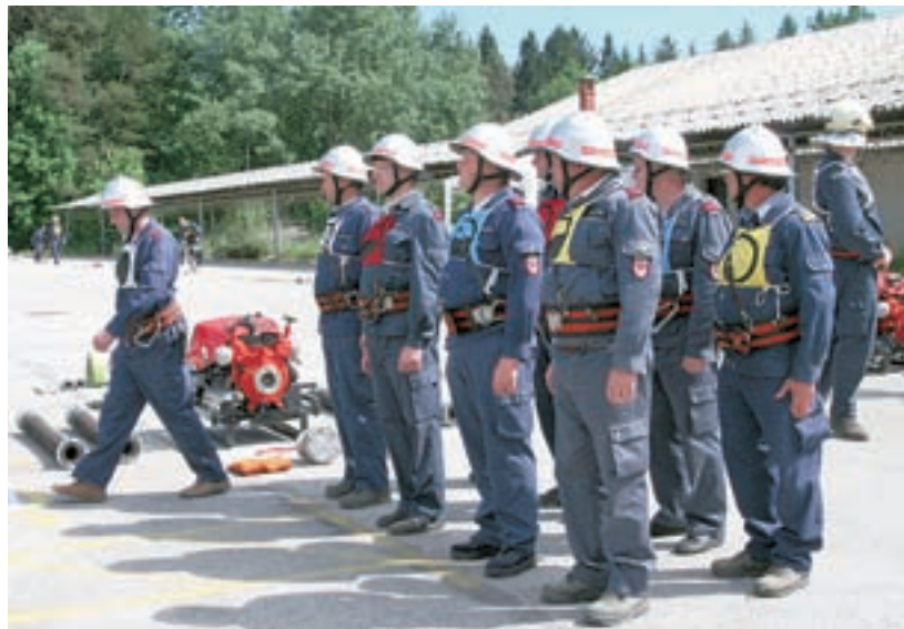
Člani B PGD Kokrica na tekmovanju

Vse naše člane veseli dejstvo, da se počasi zaključujejo tudi dolgoletna pogajanja za pridobitev lastništva v delu stavbe, kjer imamo svoje prostore in garažo. V tem mesecu pričakujemo zadnjo razpravo na sodišču, ki bo uredila vse zadeve okoli lastništva.