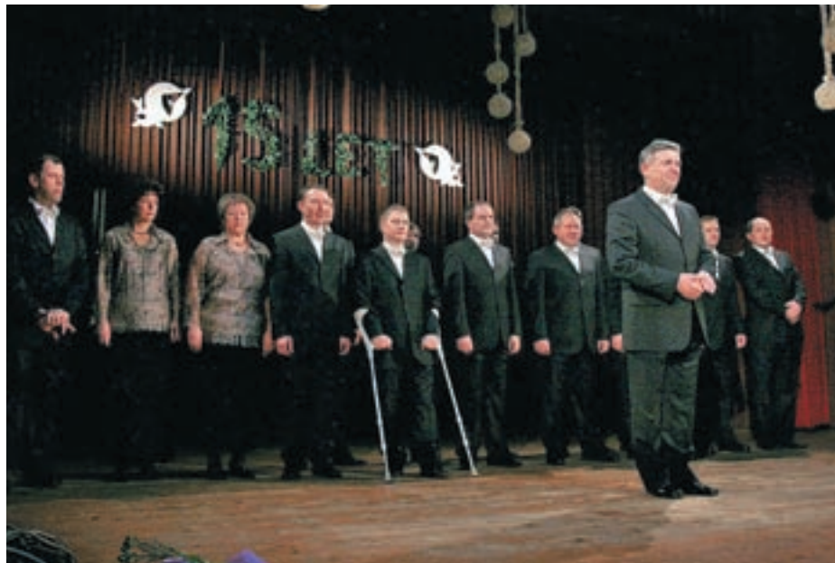
Petnajsto leto delovanja so Kokr'čani praznovali 31. januarja v polni dvorani Kulturnega doma na Kokrici.

Repertoar, ki se je z leti obogatil s približno sto petdesetimi pesmimi, temelji predvsem na slovenski narodni pesmi z namenom zbujanja zanimanja zanjo za mlajše generacije in obujanje spominov preostalim zvestim poslušalcem, dviganjem narodne zavesti, slednje nam kot narodu kronično primanjkuje. Ker pa smo se trudili in nam je tudi uspelo znova obuditi podoknice, smo dodali še nekaj pesmi, s katerimi