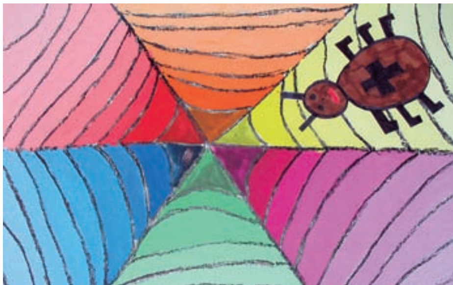
Maša Škrjanc, 2. c