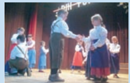
Otroška folklorna skupina

22. marca je bila v kulturnem domu na Kokrici prireditve Dih pomladi v organizaciji Turističnega društva Kokrica. S. K.