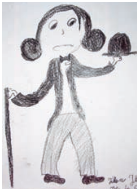
Tilen Jelenc, 4. c