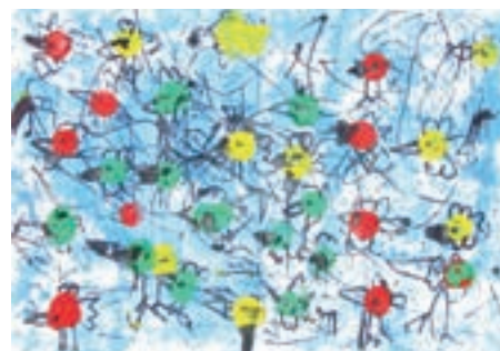
Živa Kovačič, skupina Sončki (5 let)