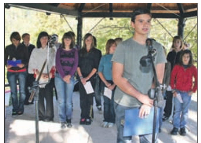
Mladi so z besedo in pesmijo obudili junaško preteklost.