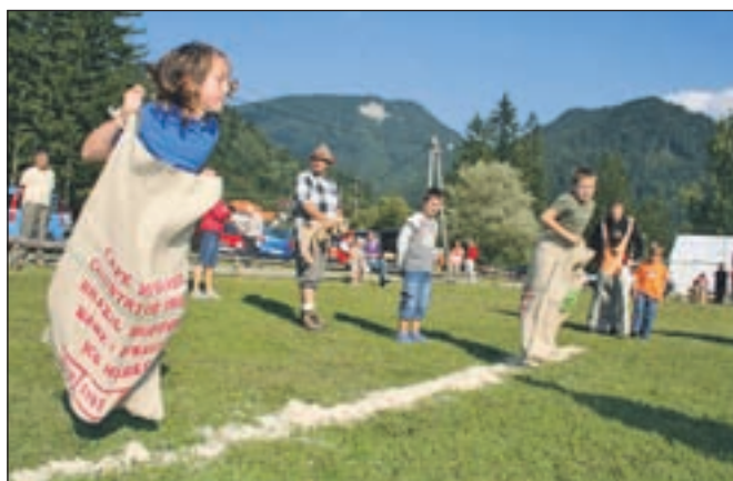
Otroci uživajo v pastirskih igrah, zlasti ob skakanju v vrečah.