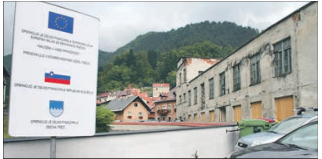
Obnovljene ulice v starem delu Tržiča - plod sodelovanja občine, države in EU.

"Obnova Čevljarske, Usnjarske, Fužinske in Muzejske ulice ter ulic Prehod in Za Mošenikom je bila nujna zaradi dotrajane komunalne infrastrukture, ki ni več zagotavljala pogojev za normalno bivanje v tem delu mesta. Tam so obnovili 645 metrov vodovoda in 370 metrov kanalizacije ter uredili 10.670 kvadratnih metrov prometnih površin, 41 novih parkirišč in javno razsvetljavo. Še pred začetkom teh del so porušili tri propadajoče stavbe ob Mošeniku. Smeti in igel v opuščeni prostorih ni več, tudi makadam je pre-