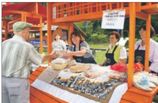
Domače dobrote podeželskih žena so zamikale marsikoga.