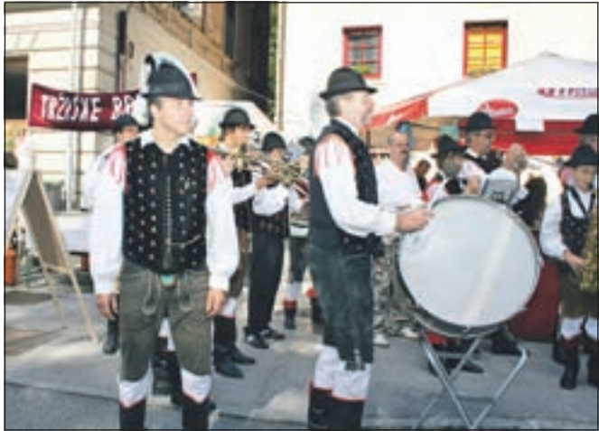
Godbeniki so postavili svojo stojnico, ob kateri so ponujali obiskovalcem tudi tržiške bržole.

Tržič - Pihalni orkester Tržič, ki v mestu že vrsto desetletij ohranja kulturno tradicijo, je prisoten na vseh večjih prireditvah doma in tudi drugod. Letos je ponovno popestril s svojo glasbo dogajanja ob Šuštarški nedelji.