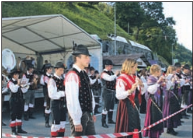
Pihalni orkester Tržič na glavnem prireditvenem prostoru ob tržiški avtobusni postaji.

prek petdeset glasbenikov, med katerimi je veliko mladih. Žal so njihova glasbila dokaj stara, zato jih postopno zamenjujejo. Druga šibka točka je glasbena dvorana ob tržiški tržnici, iz katere se bo moral orkester izseliti. Zato upajo na ureditev prostorov v novem tržiškem kulturnem centru.