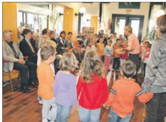
Nastop otrok iz vrtca Deteljica je potrdil povezanost generacije s starejšimi.