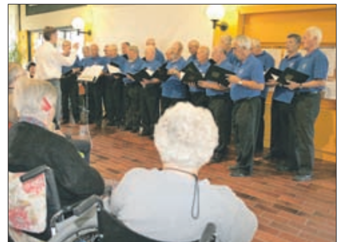
Stanovalce je razvedril s petjem tudi moški pevski zbor društva upokojencev.