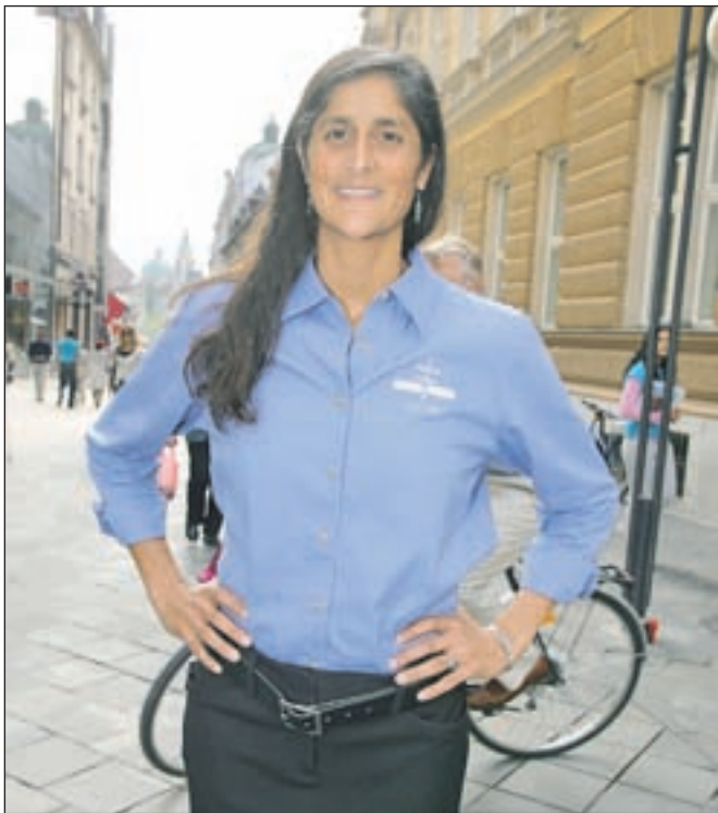
Sunita Williams

nje med bivanjem na vesoljski postaji, pa tudi obiske različnih dežel. Obenem vadiamo za vesoljske sprehode, učimo se upravljati z robotsko roko ... Ker pri tem sodelujemo s tujimi partnerji, je del usposabljanja še učenje tujih jezikov, tako da spo-