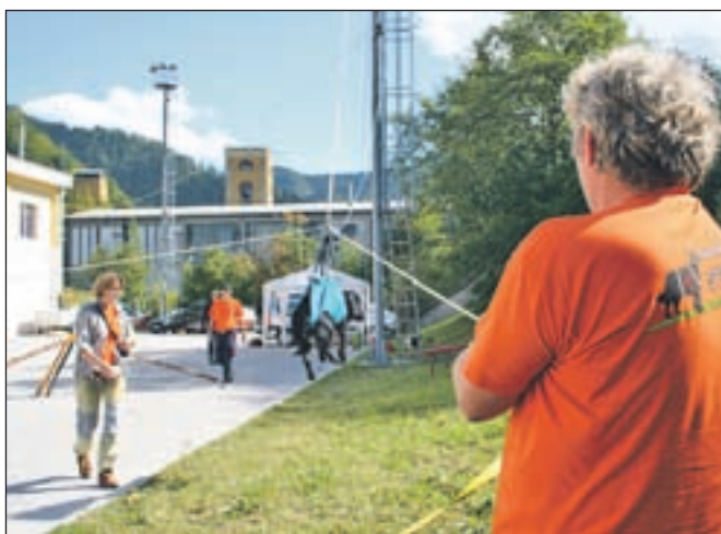
Spust psa z visokega stolpa s pomočjo sidrišča in vrvi zahteva urjenje.

Zelo zanimiv je bil tudi prikaz vodenja šolanih psov prek raznih ovir. Gledalci so se prepričali, da lahko človek nauči psa marsičesa. Živali so poslušno sledile vodnikom čez most, gugalnico in plezalno oviro ter se spretno gibale skozi togi tunel. Seveda še več znajo psi, s katerimi lastniki tekmujejo v disciplini agility. Tam premagujejo tudi višinske in plezalne ovire, tečejo v slalomu med količki in skačejo v daljavo ter skozi gumijast obroč.