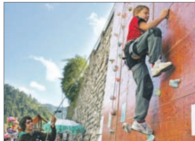
Ob predstavvah na Šušarskih nedeljah športni plezalci vabijo v svoje vrste zlasti domačo mladino.