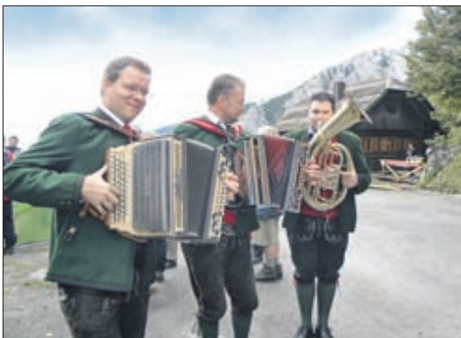
Godbeniki iz avstrijske Koroške so kljub mrazu vztrajno igrali, ples pa ni nikogar zamikal.

Hladno vreme ni bilo najbolj primerno za ples in petje, ki se ponavadi začne po odprtju sode s pivom. Tokrat je bolj teknilo kaj močnega in vročega, kar so ponujali gostinci iz našega Podljubelja in iz avstrijskih vasi Podena ter Ljubelj.