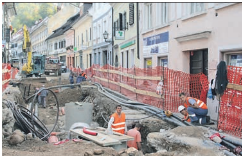
Trenutno potekajo obnovitvena dela na spodnjem delu Trga svobode v Trzinu.