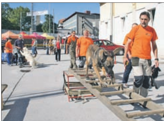
Tržiški kinologi so prikazali tudi vodenje šolanih psov prek raznih ovir.