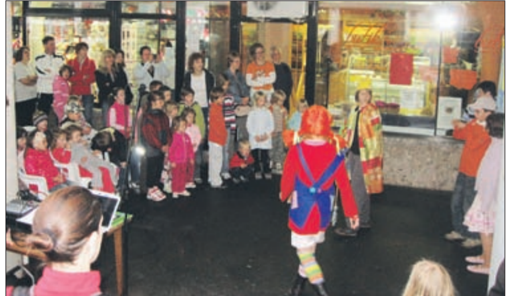
Podhod Občine Tržič je bil premajhen za vse ljubitelje prigrad Pike Nogavičke, ki jih je odlično predstavila Dramska skupina razredne stopnje OŠ Tržič.