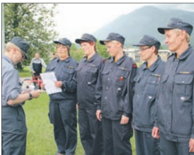
Ena od treh ekip PGD Križe sprejema navodila sodnice.