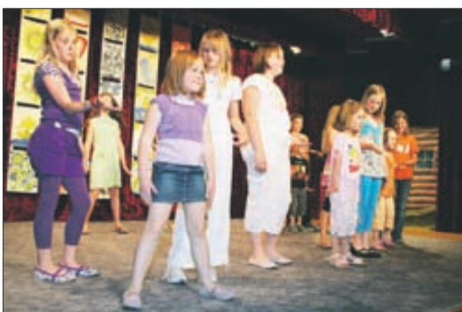
Učenci petega razreda so ob plesu predstavili bodoče šolarje.