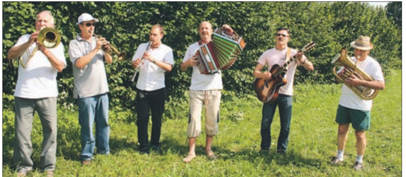
Člani Vaške godbe igrajo narodnozabavno glasbo, predvsem skladbe legendarnih Avsenikov, Štirih kovačev, Alpskega kvinteta ...

zovala in da bi s svojimi nastopi čim dlje razveseljevali ljubitelje narodnozabavne glasbe.