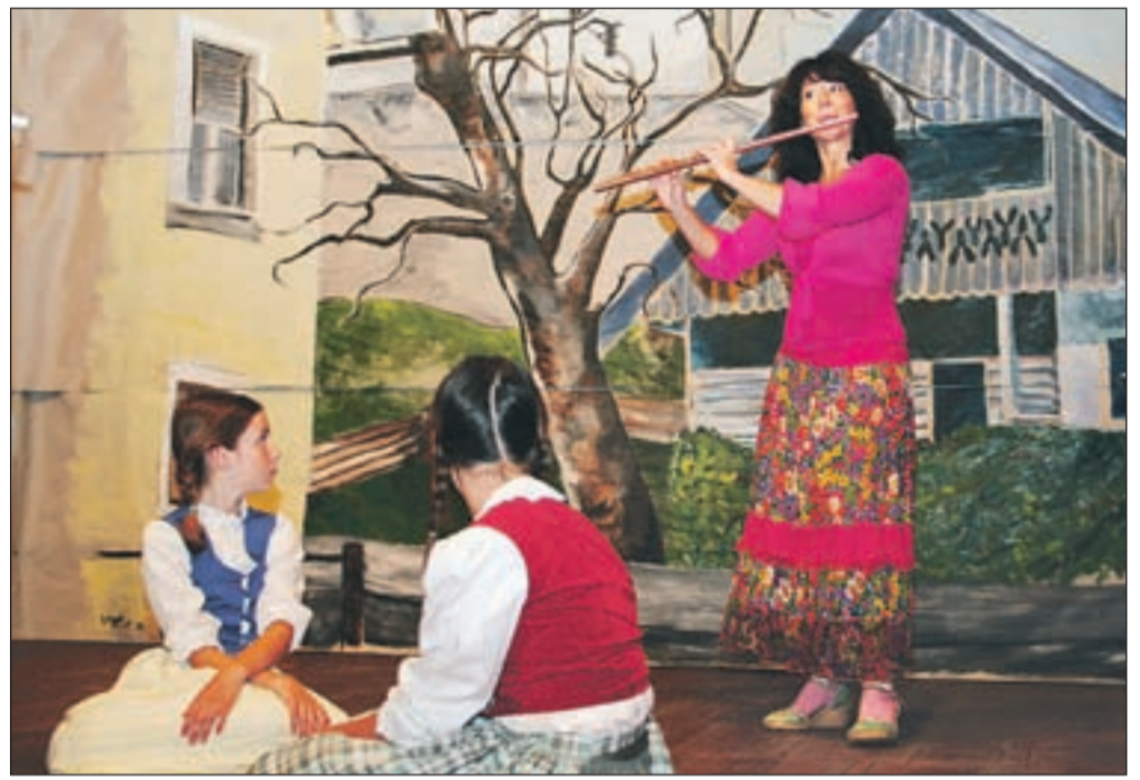
Deklica, ki je želela biti glasbenica, je danes slavna flavtistka Irena Grafenauer.