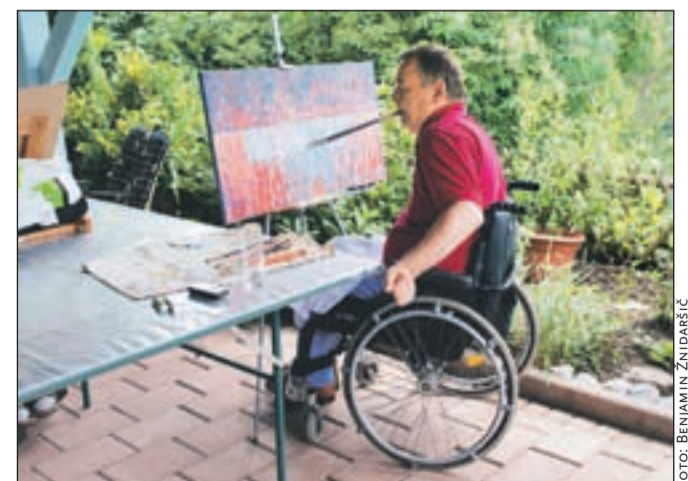
Nekateri slikarji zaradi svoje invalidnosti slikajo z usti.

Likovnike je med delom obiskal član uprave Mercatorja