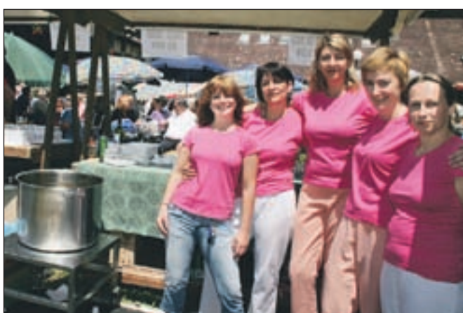
Kuharska ekipa je imela polne roke dela s pripravo hrane.