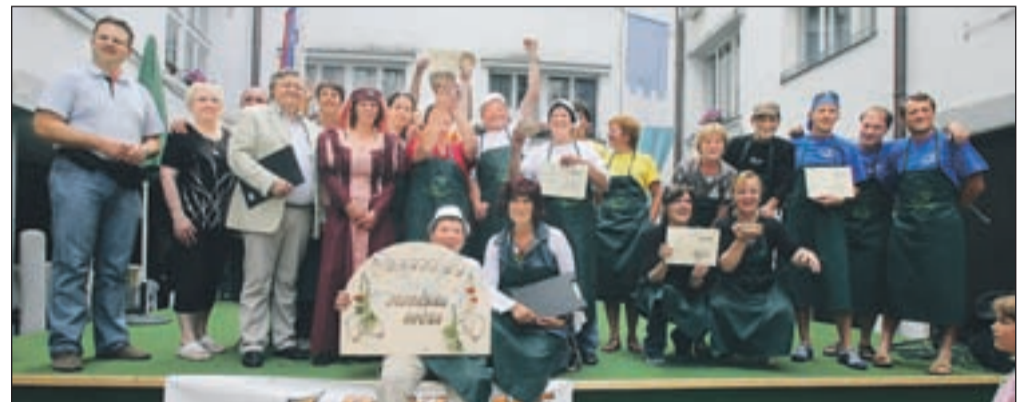
V kuhanju tržiških bržol se je pomerilo pet ekip.