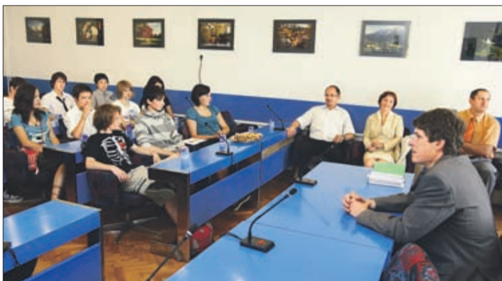
Del odličnjakov in ravnatelji na sprejemu pri tržiškem županu