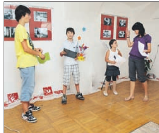
Mladi so sami pripravili tudi kulturni program.