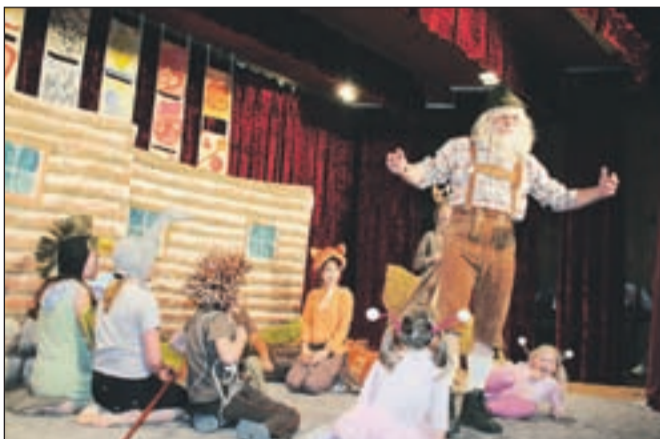
Igra o Gozdnem dedku, ki je zbolel, je razvedrila obiskovalce.