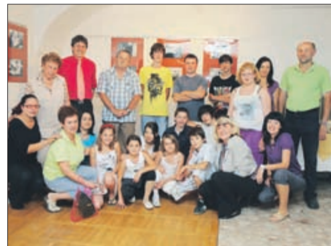
Ustvarjalci iz Mladinskega centra Tržič z obiskovalci