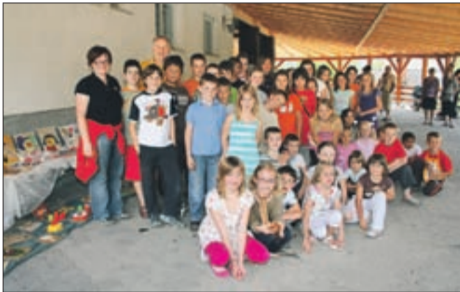
Udeleženci letošnje likovne kolonije v Lomu ob razstavi izdelkov.