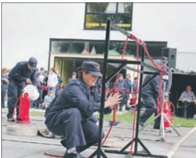
O uvrstitvi na tekmovanju odločata pravilnost dela in hitrost.

tudi test z vprašanji, ki so dijo v okvir tekmovanj za memorial Matevža Haceta. Še bolj zahteven je bil praktični del tekmovanja. Ena od tekmovalk je morala pravilno izbrati med tremi ročnimi gasilnimi aparati glede na vrsto požara. Druga je bila zadolžena za gašenje z vedrovko. Tretja je spajala cevi s trojakom. Četrta je navezovala gasilsko sekiro na vrh. Peta je metala zvito cev v določeni smeri in razdalji. K uspešnosti ekipe je poleg pravilnosti dela pripomogla tudi hitrost izvedbe vaje. Po tekmovanju so razglasili rezultate in podelili pokale najboljšim ekipam. Na prva tri mesta so se uvrstile tekmovalke prvih ekip iz PGD Hrušica, PGD Kranjska Gora in PGD Prebačovo-Hrastje. Na četrtem mestu je bila prva ekipa PGD Brezje pri Tržiču. Prva ekipa PGD Leše je zasedla 14. mesto, Kovor 23. mesto, Križe I 25. mesto, Jelendol-Dolina II 30. mesto, Lom pod Storžičem I 35. mesto, Brezje pri Tržiču II 43. mesto, Leše II 59. mesto, Križe II 61. mesto, Jelendol-Dolina I 66. mesto, Lom pod Storžičem II 74. mesto in Križe III 77. mesto.