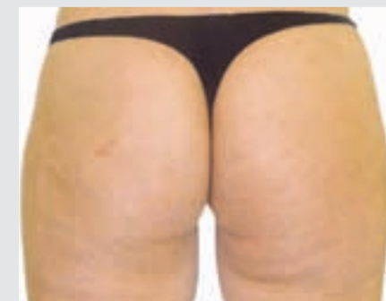
Po štirih tretmajih