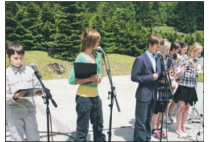
V kulturnem programu so sodelovali tudi učenci iz OŠ Bistrica.