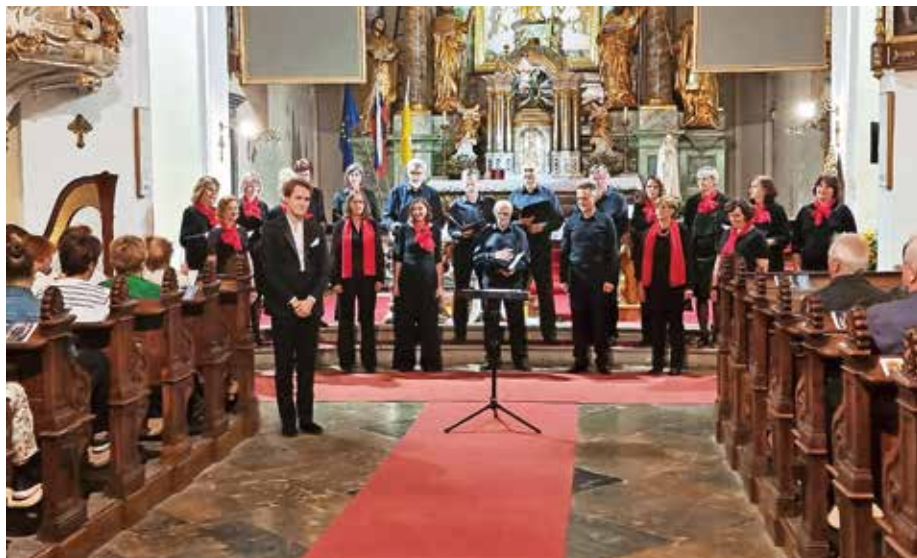
Koncert Povežimo bregove v Stražišču

violinist so bili za uvod v enourni koncert slovenskih pesmi, ki se jih kar niso hoteli naposlušati. Ko smo zaključili še s škotsko pesmijo Loch Lomond in dodali še njihovo tradicionalno Auld lang syne, je bila dvorana na nogah. Naslednji koncert je bil v katedrali manjšega obmorskega mesta Dornoch. Že samo prizorišče tamkajšnjega koncerta je bilo veličastno, poslušalci so bili sicer bolj zadržani, kot se za prireditveni prostor tudi spodobi, pa vendar nič manj prisrčni in ravno tako veseli naše pesmi. Zadnji koncert je bil v prireditve-