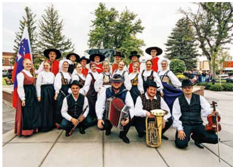
Ozarčani na gostovanju v ZDA, dekleti na levi sta bili njihovi vodički.

Ozarčani smo v tem času že začeli sezono, v kateri snujemo kup novih projektov, pogledi pa nam uhajajo na zemljevid, saj že iščemo destinacijo za novo poletno dogodivščino.