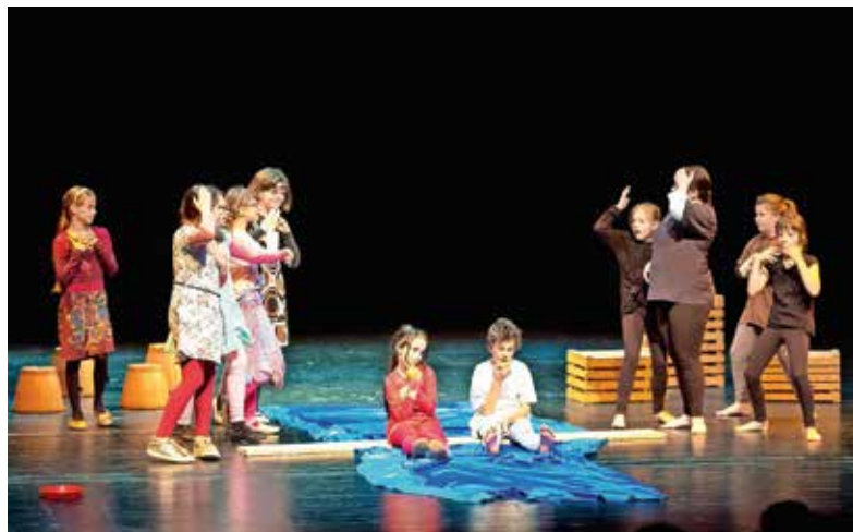
Iz zgodovine, KOZE – nagrajena gledališka predstava