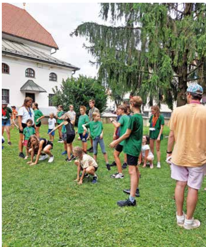
Otroci so že obljubili, da se avgusta prihodnje leto spet srečamo.