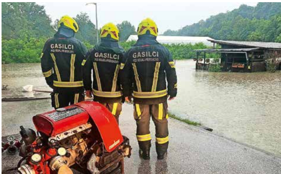
Samo letos smo do sredine septembra aktivno sodelovali že na 23 intervencijah.

Vašo podporo si štejem v čast in seveda kot dodatno spodbudo za naše prostovoljno delo. Z gasilskim pozdravom na pomoč!