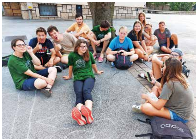
Kar 13 animatorjev je aktivno sodelovalo od zgodnjega jutra do večera.

Program smo popestrili z obiskom čarodeja Jana, izletom v Arboretum Volčji Potok, obiskom članov Lokostrelskega kluba Kranj, pomerili smo se na gasilskem poligonu, ki so ga za nas pripravili mladi člani PGD Kranj Primskovo. Veliko veselja je povzročila tudi vodna prha, s katero so nas navdušili gasilci. Z organizacijo dogodka se prostovoljci ukvarjamo že več mesecev prej. Potrebnih je veliko priprav, odločitev o programu, učenje vlog za igro in še mnogo majhnih zadev, ki na koncu povežejo vse niti v odličen dogodek. Letošnja posebnost? Zagotovo veliko mladih animatorjev – večinoma devetošol-