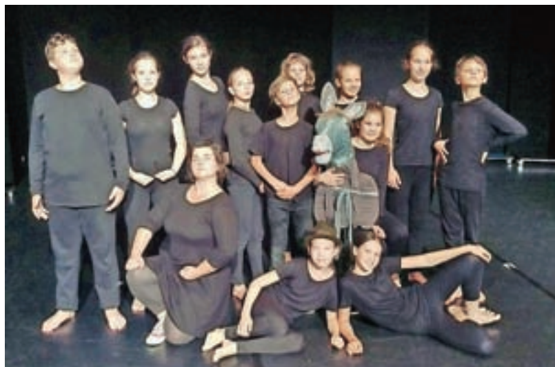
Predstava Mala in modra

V preteklih letih je društvo Apél začelo sodelovati s sorodno organizacijo, Centrom prostega časa LUŽANKY iz Brna, ki se prav tako na profesionalnem nivoju ukvarja z dramsko vzgojo in gledališko pedagogiko ter številnimi drugimi izobraževalnimi dejavnostmi za otroke. »Letno se v omenjeno organizacijo v