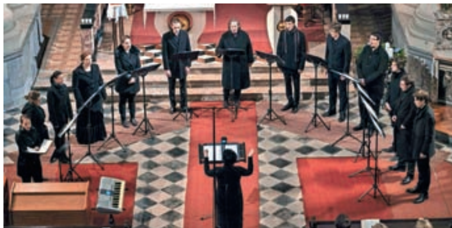
Koncert Komornega zbora De profundis Kranj v uršulinski cerkvi Svete Trojice v Ljubljani