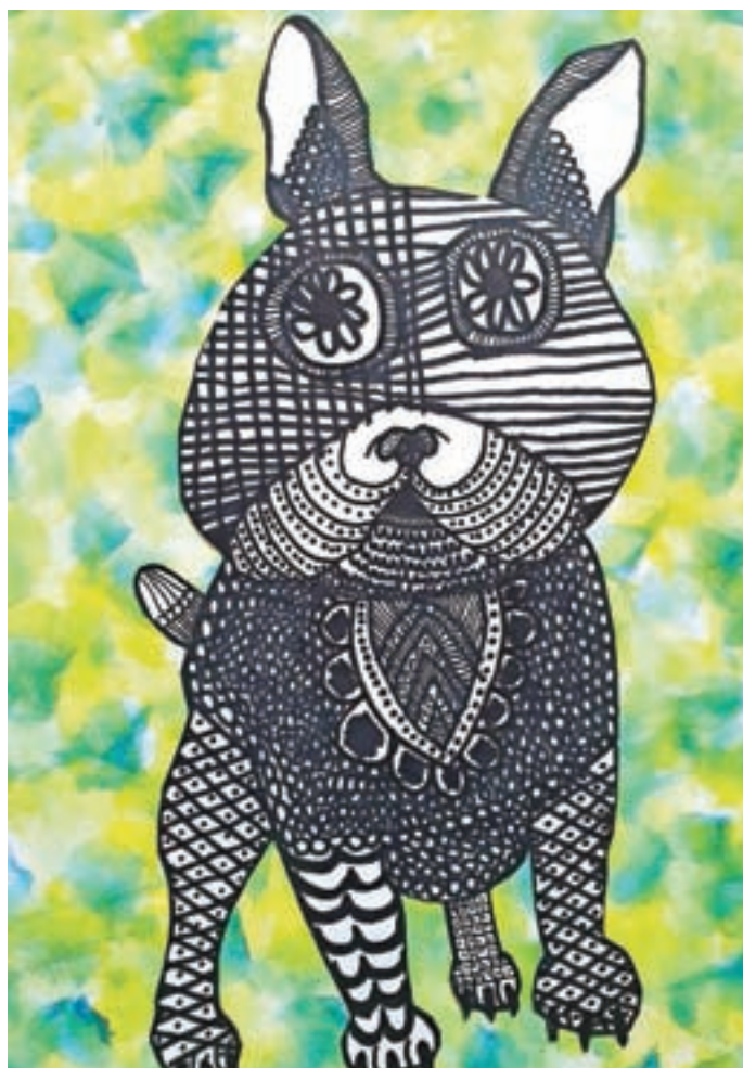
Pes / Narisala: Anita Bežek