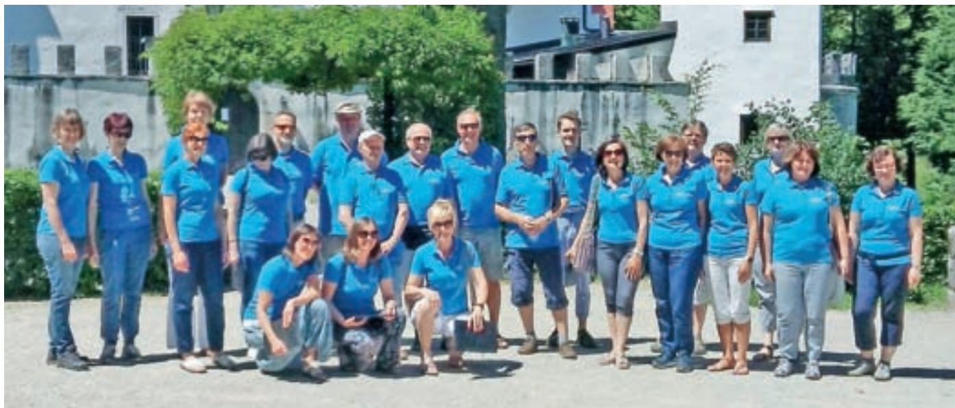
Potujoči koncert Me PZ Musica Viva Primskovo

Naslednji nastop smo imeli v čudovitem parku pred gradom Snežnik. Najprej smo zapeli načrtovani program, z nekaj dodatki seveda, potem si je pol zbora ogledalo grad, druga polovica pa se je sprehodila po grajskem parku, uživala v naravi in v strokovnih razlagah naše vodičke. Potem sta se skupini zamenjali in na koncu je sledil še drugi del koncerta, ki so ga naključni obiskovalci gradu Snežnik ponovno pospremili z navdušenim aplavzom. Tretji nastop smo imeli pa praktično na kopališču, saj smo se ustavili še ob Bloškem jezeru, ki je bilo tisto toplo, sončno nedeljo oblegano s kopalci in sprehajalci. Ker je bila jezerska obala polno zasedena, nam je bilo kar malo neprijetno, da bi se še mi pomešali med obiskovalce – razdalja in vse, kar sodi zraven ... vendar smo na koncu našli precej prazen travnik, kjer smo se postavili in zapeli. Najprej nam je bilo malo neprijetno, da takole vdiramo v uživanje ljudi v nedeljskem popoldnevu, da jih ne bi motili, ko pa