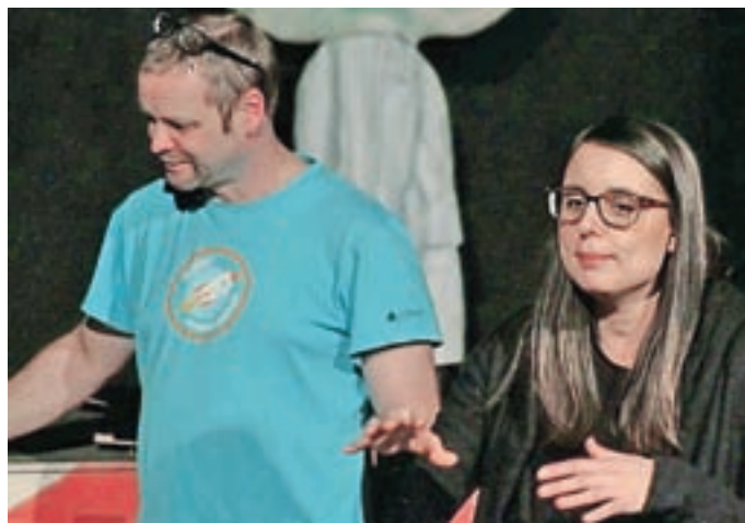
Izkustvena delavnica – SVČ LUŽANKY in Apél