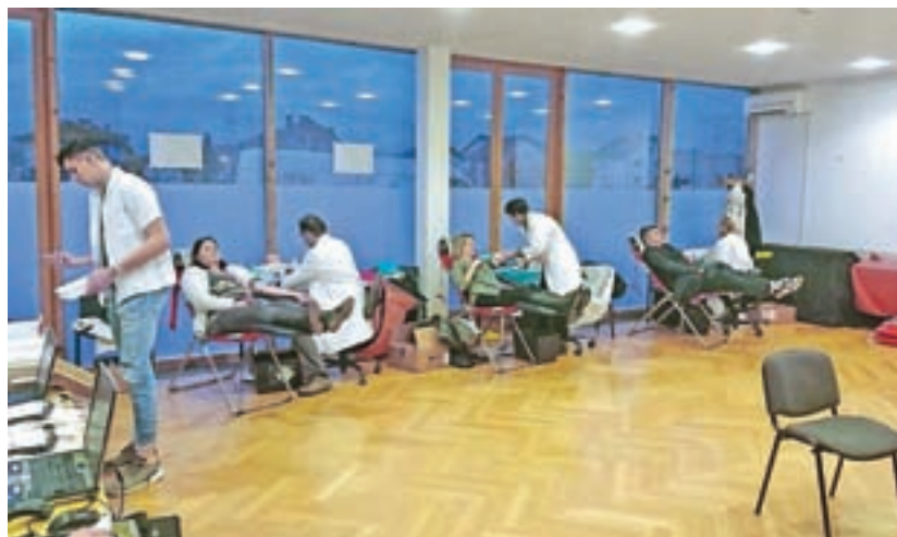
Terenska krvodajalska akcija meseca februarja v Domu krajanov Primskovo

V decembru želimo obiskati naše krajanje, ki so starejši od 80 let ali pa so hudo bolni. Želimo jih razveseliti s skromnim darilom in obiskom (upamo, da bo to glede na aktualne razmere izvedljivo). Vse vas prosimo, da nam pomagata ažurirati sezname, saj drugače do teh podatkov ne moremo priti. Toplo vabljeni vsi, ki bi želeli pomagati, da poklonite svoj čas za še aktivnejše delovanje naše Krajevne organizacije RK na