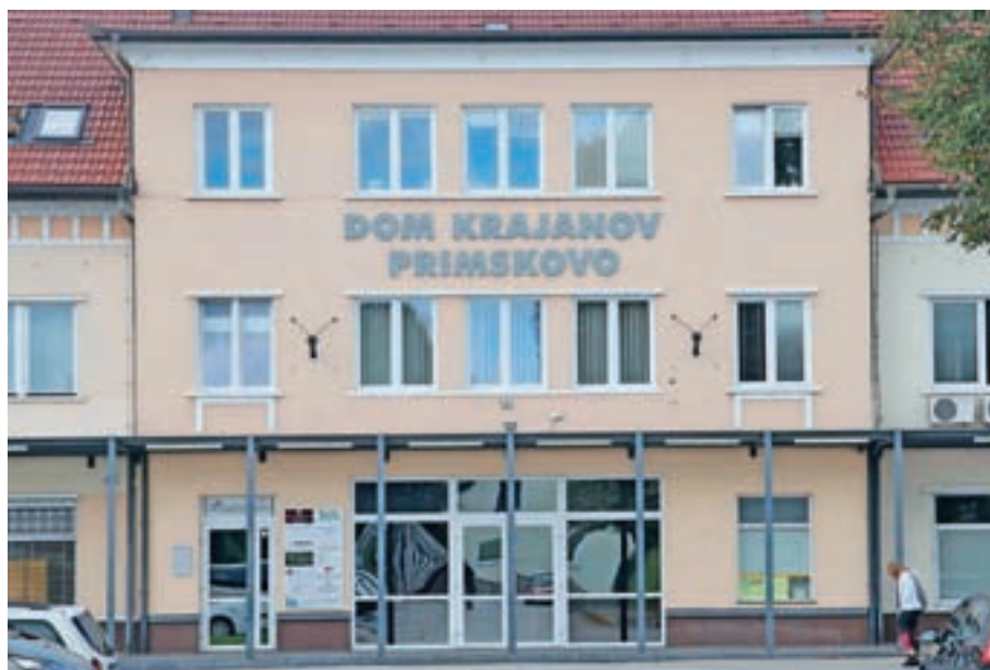
Na podlagi javnega razpisa je Dom krajanov Primskovo letos spomladi dobil upravnika.

Za stik krajanov s člani Sveta Krajevne skupnosti Primskovo je na voljo več kontaktov: e-pošta: ksprimskovokr@gmail.com, tajništvo na telefonski številki 040 837 049, za rezervacijo dvorane pokličite na 040 837 049, hišnikova številka pa je 064 177 161.