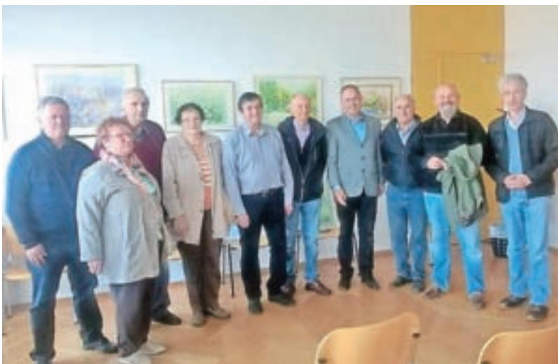
Člani KD likovnikov Kranj

razstave prirejamo v Domu krajanov Primskovo, z vključitvijo krajevnih glasbenih in folklornih skupin. Letos bomo za krajevni praznik v ponedeljek, 12. oktobra, postavili že četrto razstavo društva z naslovom Jesen je tu. Te jesenske razstave so rezultat likovne delavnice, ki jo običajno organiziramo na območju reke Kokre in njenega kanjona skozi Kranj. Tudi letos bomo imeli v petek, 9. oktobra, likovno srečanje na sotočju Rupovščice in Kokre, pod Vočanom in v gozdičku pod Kurirsko potjo. V društvu je 19 različnih ustvarjalcev, ki slikajo v akvarelni, akrilni in oljni tehniki. Imamo grafike, ki delajo v visokem in globokem tisku (lesorez, linorez, jedkaničica in suha igla), in priznane umetniške fotografe.