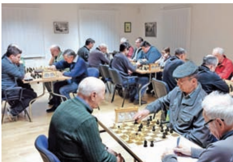
Utrinki s prvega letošnjega šahovskega turnirja v januarju

Vabljeni, da se nam pridružite pri igranju šaha ob sredah ter na preostalih naših šahovskih turnirjih.