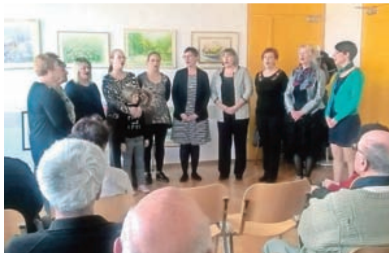
Nastop ženskega pevskega zbora Bodeče neže