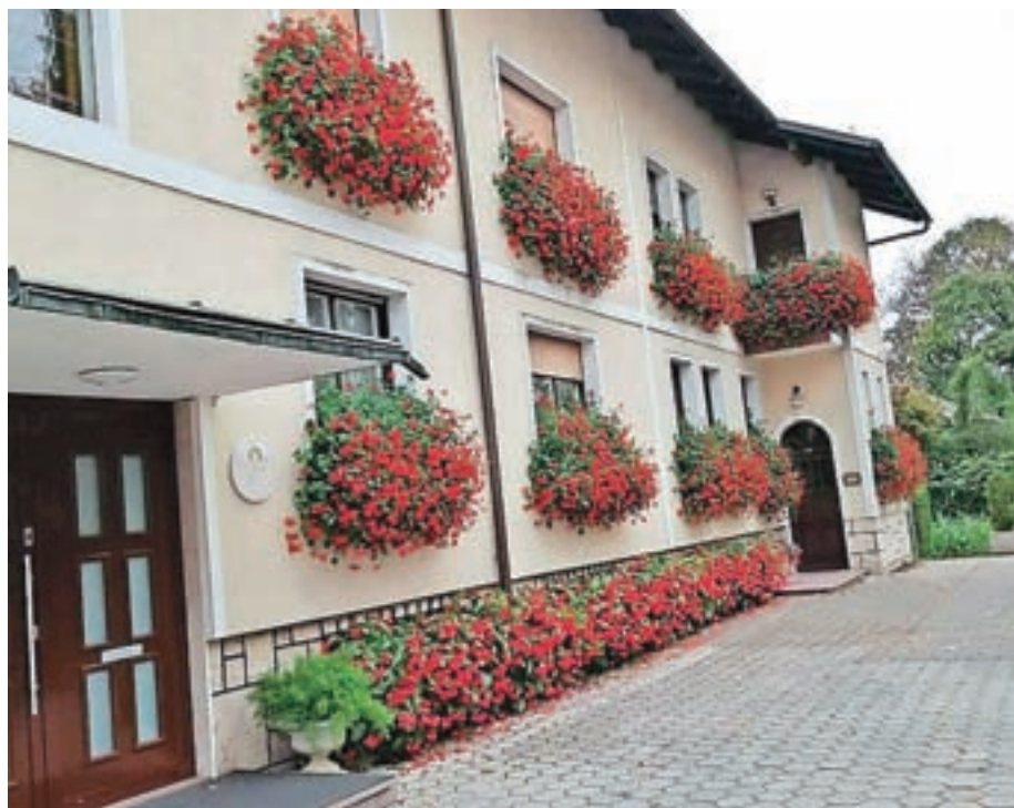
Čudovito cvetje krasi okolico cerkve in župnišča.

Župnijski praznik Marijinega vnebovzeta ali veliki šmaren je bil tudi letos pri nas nadvse slovesen. Počaščeni smo, da so se slovesnosti udeležili in na njej sodelovali pomembni gostje. Zvečer pred praznikom je maševal ljubljanski pomožni škof dr. Franc Šuštar. Na sam praznik popoldne je bil glavni maše-