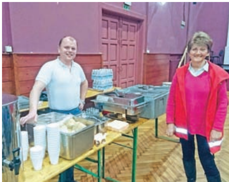
Po februarjski krvodajalski akciji so krvodajalcem pripravili pogostitev.

Ko vas zasrbijo prsti, pri Vidi je vse v vrsti