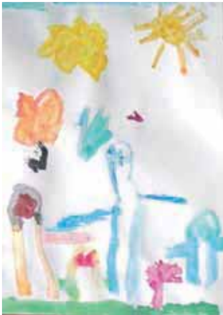
Risbica na temo pomladi. Otroško iskriava in doživeta.

Danes, na veliki petek, v vrtcu barvajo pirhe, čisto naravno, s čebulnimi olupki. Pečejo tudi ptičke iz testa. »Za materinski dan so otroci za darilo mamicam naslikali travnik. Za valentinovo smo vsi skupaj v vrtcu pekli vafle – srčke in povabili na obisk vrtec pri matični Osnovni šoli Simona Jenka Kranj. Jedli smo srčke, se družili, plesali ...« je strnila Valjavčeva. S. K.