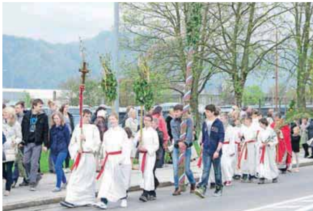
Cvetna nedelja na Primskovem

Na veliko noč bo v vseh župnijah v kranjski dekaniji napoved MISIJONA, ki bo prihodnje leto