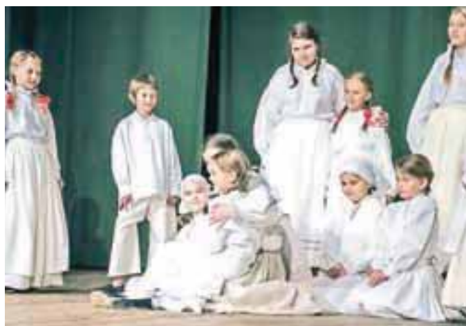
Z belokranjskim plesom so navdušili plesalci Otroške folklorne skupine Pastirček.