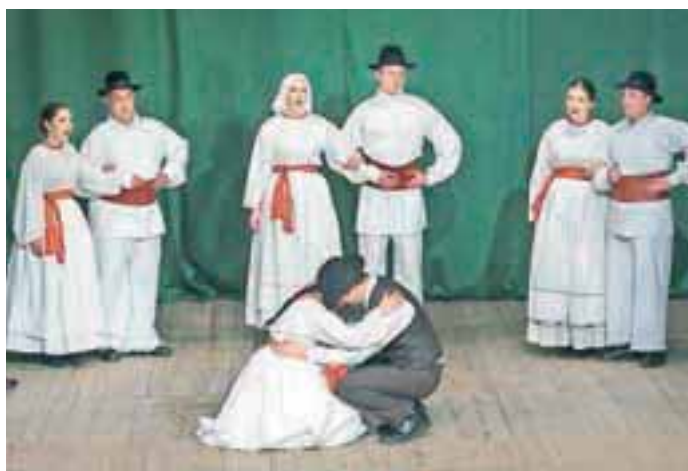
Življenjska ljubezenska zgodba, izpovedana skozi folklorni spektakel: AFS Ozara

Akademška folklorna skupina Ozara, ki šteje prek devetdeset aktivnih članov, je tako ponovno pripravila veličasten dogodek in pri svojih koreografijah ostala zvesta visokim standardom na področju slovenskega ljudskega, plesnega, pevskega in glasbenega izročila, pa tudi pri ohranjanju šeg in navad. Samo Lesjak