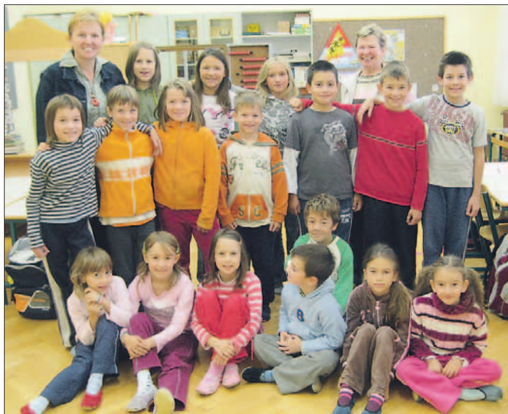
Učenci Podružnične šole Dražgoše v družbi učiteljic