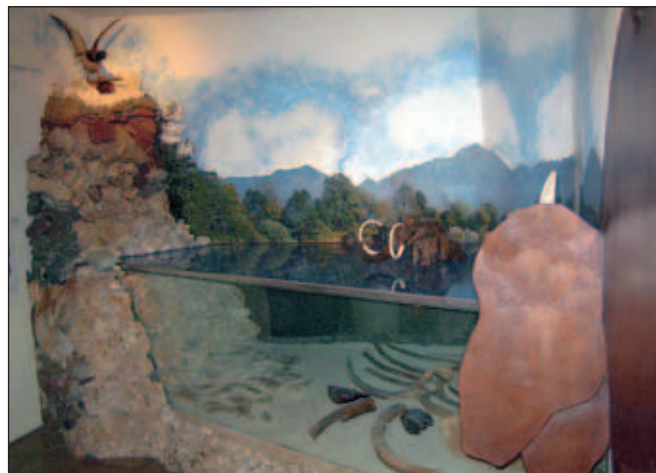
Ambient dela postavitve stalne arheološke razstave Železna nit

V petek, 21. novembra, ob 17. uri bo v Knjižnici Blaža Kumerdeja na Bledu pravljica za otroke Muzej na obisku in ustvarjalna delavnica za otroke Vrnitev v kameno dobo.