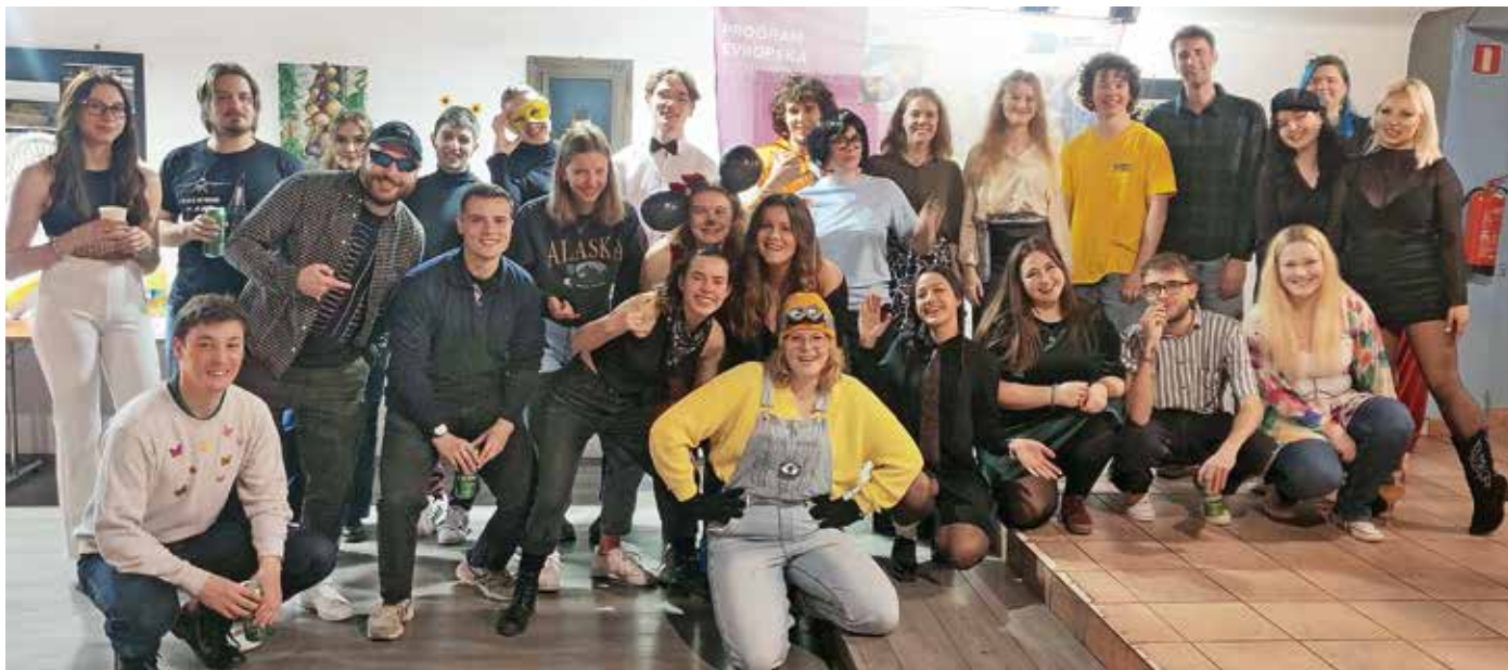
Sproščen večer aktivnih prostovoljcev v Klubu Jedro

V Mladinskem centru Klub Jedro je potekal družabni spoznavni večer prostovoljcev Evropske solidarnostne enote, ki v tem letu izvajajo projekte v Sloveniji. Prostovoljci so predstavili svoje aktivnosti ter kulturo in kulinariko držav, iz katerih prihajajo.