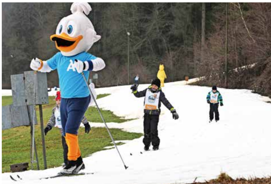
Šolarje so pri teku na smučeh spodbujale tudi maskote.