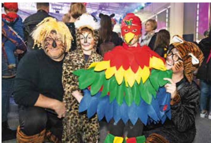
Džungla iz Vaš na pustovanju v Medvodah