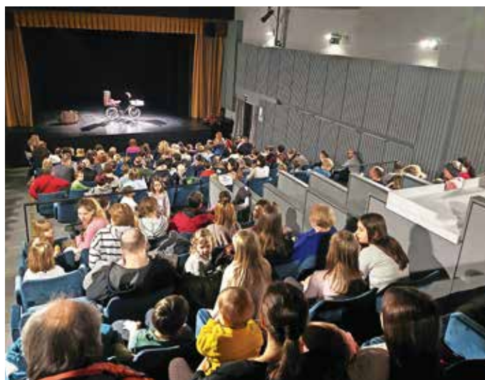
Na ogled je bila predstava Potujoči cirkus nerodne Avguštnine.