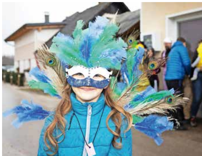
Strokovna komisija je v Mošah za najlepšo izbrala masko, ki je predstavljala pava.