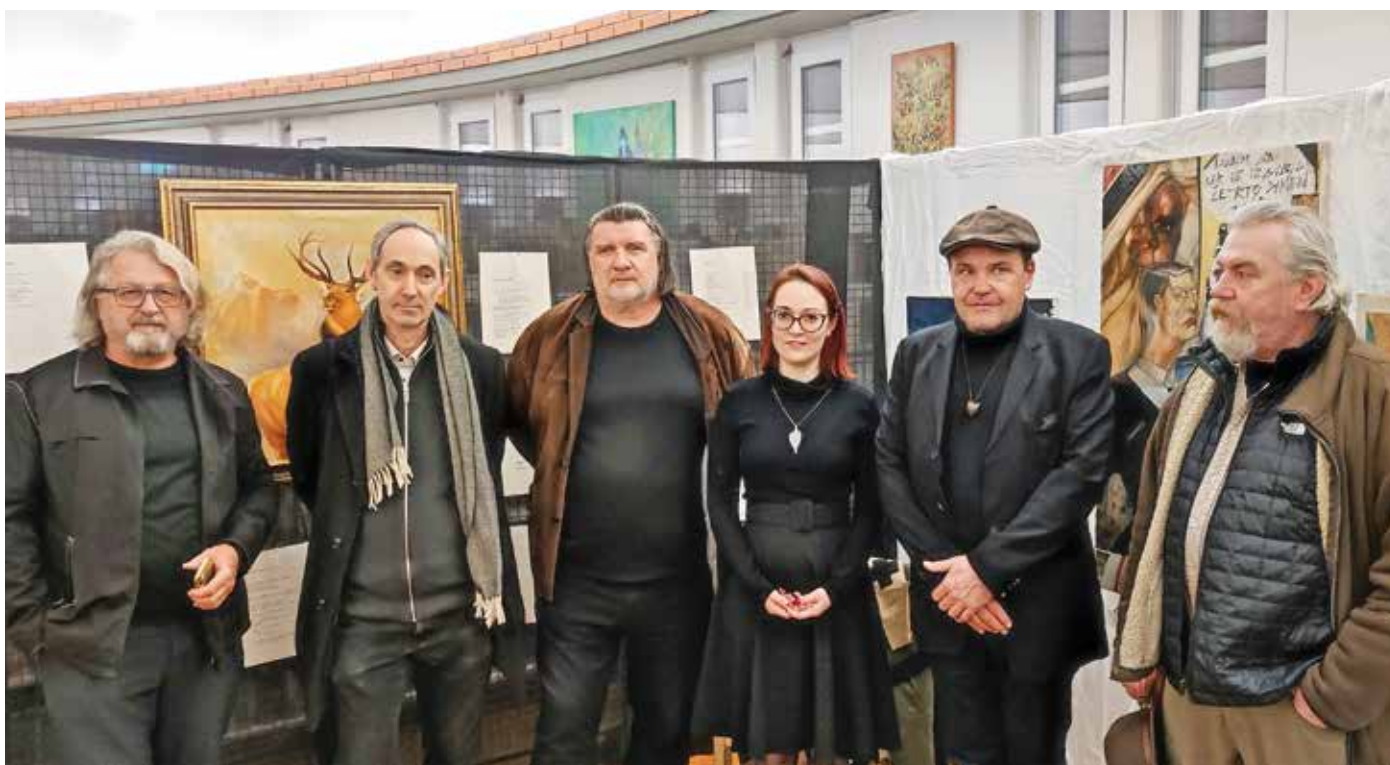
Odprtja razstave se je v Knjižnici Medvode udeležilo tudi mnogo znanih ustvarjalcev, ki so obujali spomine ob razstavljenih Tomaževih mojstrovinah.

stvene razstave ter opozoril na dokumentarni film o zasedbi Laibach (Glasba je časovna umetnost, 2017), v katerem je skozi spomine očeta Marjana predstavljena tudi Tomaževa pot, ki jo na večplasten način ujame tudi razstava v ustvarjalčevem rojstnem kraju.