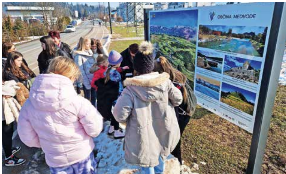
Učenci turističnega krožka ob novi informacijski tabli v bližini šole.

Občine Medvode, Vodice, Mengeš in Trzin so nadgradile sodelovanje v okviru Lokalne akcije skupine (LAS) Za mesto in vas. Pred štirimi leti so skupaj s Komendo in Domžalami vzpostavile spletni portal odmestadovasi.si , ki seznanja o prepoznavnih točkah v posameznih občinah (znamenitostih, kulturni dediščini, razglednih točkah ...), sledila je izdelava mobilne aplikacije, v okviru projekta Table Panorama App, ki so ga partnerske občine skupaj s Turistično zvezo Medvode izvajale v zadnjem letu, pa so nastale table s panoramskimi zemljevidi, na katerih so označene kolesarske in pohodniške poti, naravne in kulturne znamenitosti, gostišča, prenočišča, ponudniki domačih proizvodov in druge zanimive lokacije. Dodani so krajši opisi in slike nekaterih znamenitosti, posebnost pa je, da so na tablah tudi QR kode, ki vodijo do dodatnih informacij in vsebin, poleg tega je na hrbtni strani informacijskih tabel prikazano celotno območje LAS Za mesto in vas. S sofinanciranjem iz Evropskega kmetijskega sklada za razvoj podeželja je bilo postavljenih 19 tabel, od tega devet v občini Vodice, pet v Mengešu, tri v Trzinu in dve v Medvodah – na Svetju in Golem Brdu.