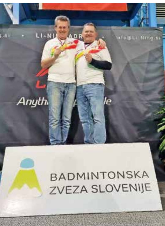
Državna prvaka v kategoriji moških dvojic nad 55 let