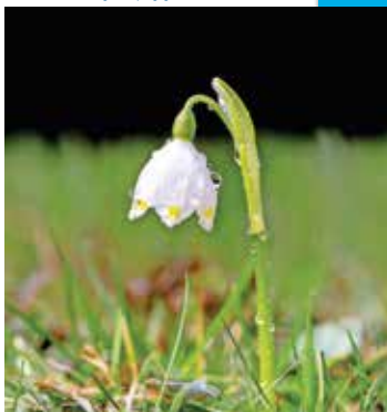
Po dežju