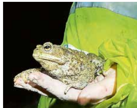
Lokacije za pomoč žabicam so objavljene na spletni strani www.pomagajmo-zabicam.si .

Mokrišča za nas in vsa živa bitja »zbirajo« pitno vodo. So med najhitreje izginjajočimi, a najpomembnejšimi ekosistemi. Vodotoki potrebujejo poplavne ravnice. Meandriranje je v naravi nižinskih rek in obraščena je tisočletja imela svoj smisel. To so bile privlačne krajine.