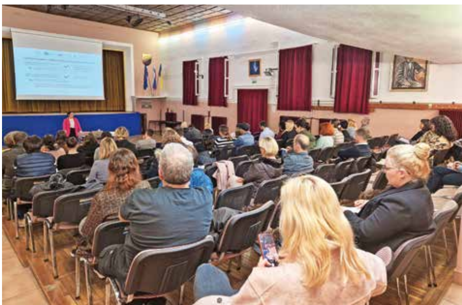
Na delavnici je bilo približno 40 udeležencev.

Teden dni po zaključku zbiranja prijav na javnih razpisih s področja družbenih dejavnosti je bil objavljen sklep o izboru vlog, ki so bile oddane za sofinanciranje otroških in mladinskih programov v občini Medvode v letu 2024. Sredstva so bila razpisana v višini 15.000 evrov, vrednost prejetih vlog pa je znašala 24.000 evrov, je razvidno iz objave sklepa. Pristojna komisija je pregledala in v skladu s pravilnikom o sofinanciranju otroških in mladinskih programov ocenila osem vlog s skupaj 17 prijavljenimi programi, in sicer 14 projekti ter tremi poslovanji. Zavzela je mnenje, da se za programe poslovanja nameni točno deset odstotkov vseh razpisanih sredstev, kar je skladno z 12. členom pravilnika, ter da se ta sredstva namenijo le mladinskim organizacijam. Za programe projektov je bilo dodeljenih 90 odstotkov razpisanih sredstev.