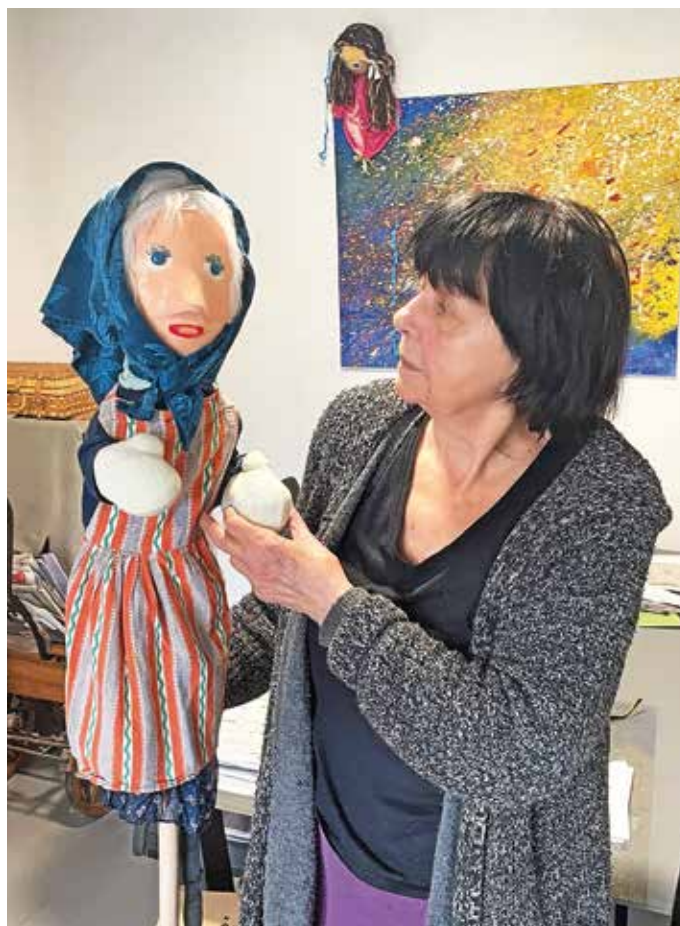
Breda s še eno izmed svojih lutk

Na delo z begunci sem posebej ponosna. Ker smo veliko ustvarili. Ker je bilo to zelo zahtevno obdobje. Zavestno sem se odločila za ta korak. Rekla sem si, vem, da bo vzelo veliko časa in še brez denarja bom. Ampak izhajala sem iz svojega razmišljanja, če sosedova hiša gori – takrat smo bili v skupni državi –, ne moreš pogledati stran. V Trbojeh, kjer sem bila takrat zaposlena, sta k meni prišla dva učenca in nato še mama, če lahko prideta v šolo. Ponudila sem pomoč in tako se je začelo. Med drugim smo naredili predstavo Povo-