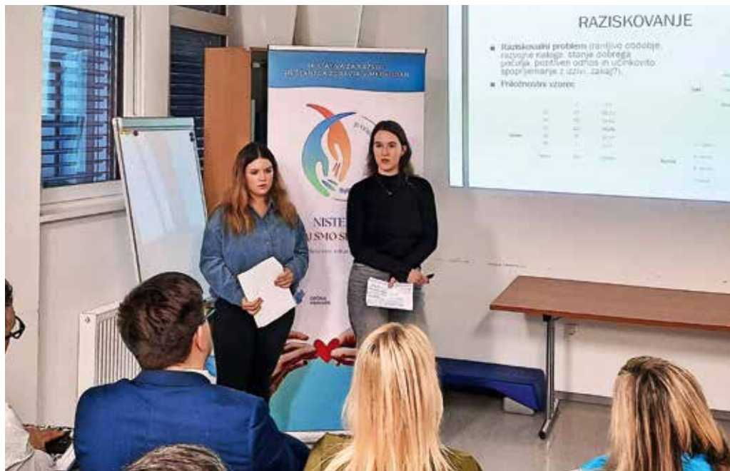
Avtorici magistrske naloge na temo duševnega zdravja osnovnošolcev na predstavitvi rezultatov raziskave

Na področju tveganih vedenj sta med drugim ugotovili, da tisti mladostniki,