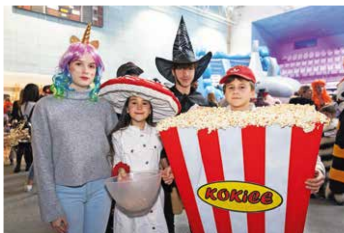
Skupino maškar iz Zbilj so sestavljali samorog, mušnica, čarovnik in kokice.