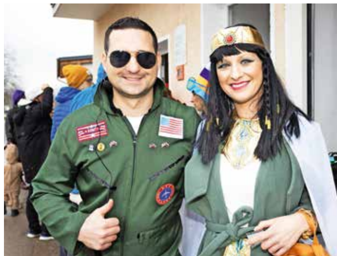
V Mošah sta se pomešala sedanost in preteklost – Top Gun in Kleopatra.