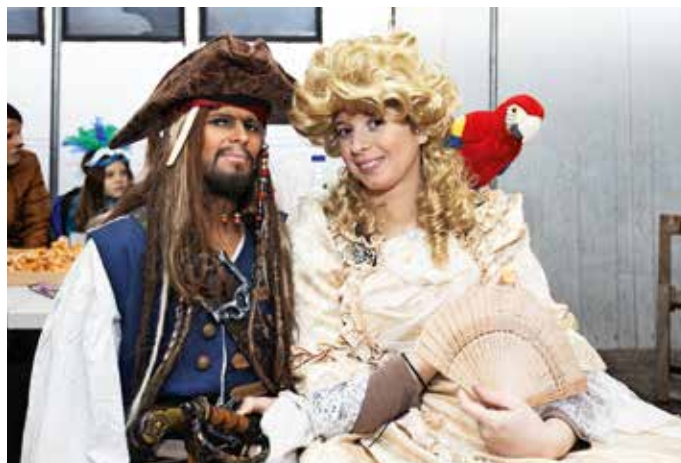
Veliko pozornosti sta vzbudila tudi pirata s Karibov.