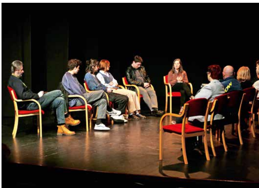
Literarni večer je potekal ob interpretiranju del različnih avtorjev.

da se položaj umetnika od Prešernovih časov do danes ni prav nič spremenil, zato verz iz njegove znamenite pesmi