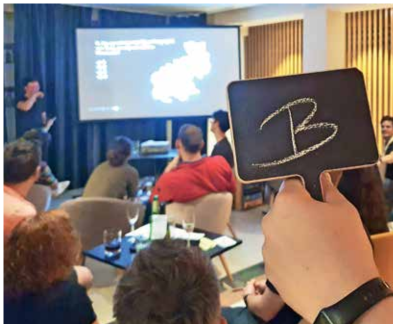
Barski kviz je priložnost za drugačen način zabavnega druženja.

Če vas barski kviz zanima, spremljajte objave na strani Bara kulture na Facebooku. Znana sta že datuma nasled-