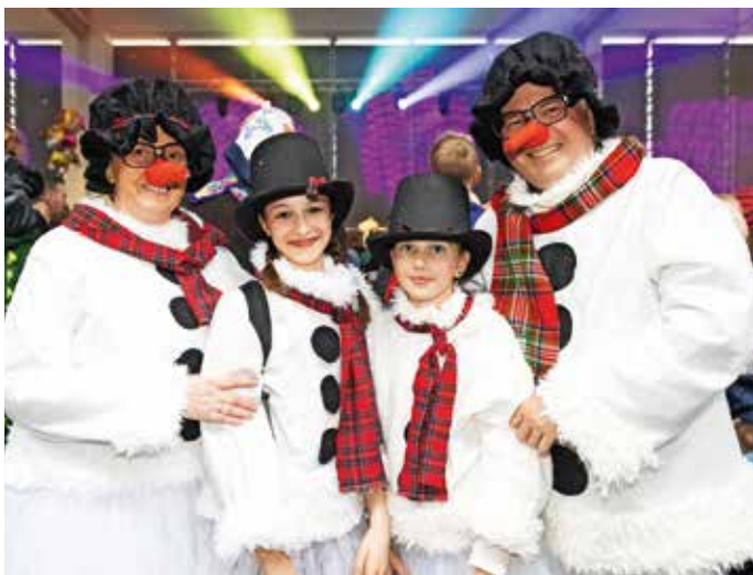
Družina snežakov na pustovanju v medvoški športni dvorani