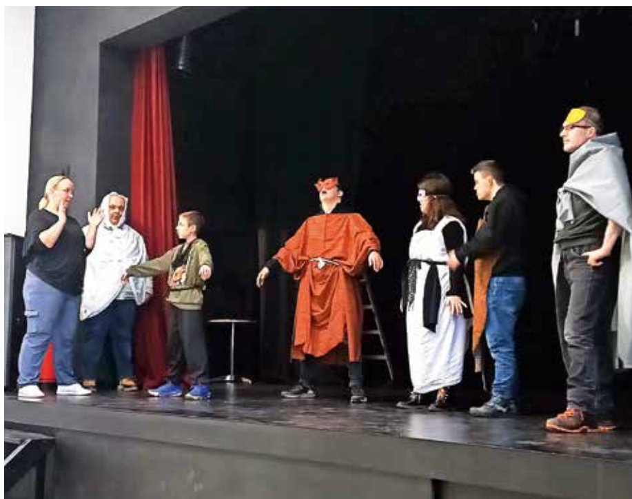
Gledališka pustolovščina

Na delavnicah, ki sta potekali v kulturnem domu v Trzinu, so udeleženci iz društva Barka, VIZ Smlednik, Zavoda Zmoremo in drugi ustvarili unikatne maske in kostume ter se na odrskih deskah odpravili na doživeto gledališko pustolovščino.