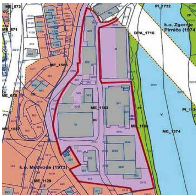
Prikaz območja lokacijske preveritve

Kontaktne osebe za dodatne informacije sta Sonja Rifel (01 361 95 43, rifel@medvode.si ) in Teja Zajec (01 361 95 41, teja.zajec@medvode.si ).