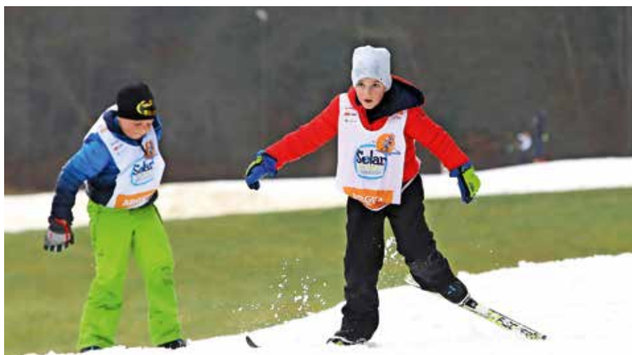
Nove izkušnje je v Bonovcu pridobilo 229 tretješolcev.

S koncem akcije Šolar na smuči se je v Bonovcu zaključila tudi letošnja obratovalna sezona, ki je uradno trajala 30 dni. »Tekachi so imeli možnost uporabe poligona 36 dni. Sezono ocenjujemo kot sicer kratko, vendar zelo intenzivno. Po zaslugi obilne pošiljke naravnega snega in posledično odlično pripravljenih smučin smo ob nekaterih koncih tedna našli tudi po več kot 500 tekačev dnevno. Ocenjujemo, da je preške smučine v minuli sezoni obiskalo skupno več kot 6000 tekačev. Med obiskovalci so prevladovali rekreativni tekači vseh generacij, tekmovalci ter člani 13 športnih društev in podjetij iz osrednjeslovenske regije. Na poligonu je bilo izvedenih sedem tečajev teka na smučeh z 42 tečajniki, 11 športnih dni z medvoškimi, ljubljanskimi, kranjskimi in škofje-loškimi osnovnimi šolami, eno državno pokalno tekmovanje v nordijski kombinaciji ter petdnevna vseslovenska akcija Šolar na smuči,« je pojasnila Ines Iskra.