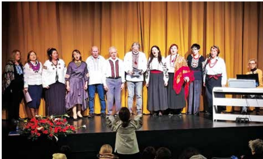
Pesmi, ki povezujejo: ukrajinski pevski zbor Drevo svobode