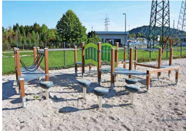
Med že izvedenimi projekti participativnega proračuna v novem ciklu je tudi dopolnitev igral na otroškem igrišču pri Športni dvorani Medvode.

hiša, naša mladost (Sv. Marjeta), Ureditev okolice pri taboriški hiški Rodu dveh rek Medvode, Povečanje varnosti udeležencev v prometu (Seničica–Golo Brdo), Dopolnitev igral na otroškem igrišču Sniček (KS Senica) in Rekonstrukcija poškodovane asfaltne prevleke (Tehovec). V letu 2024 so načrtovani