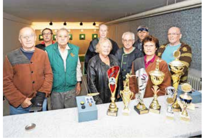
Člani strelske sekcije DU Medvode se lahko pohvalijo že s številnimi uspehi. Trenirajo na strelišču pod kegljiščem pri hidroelektrarni Medvode.