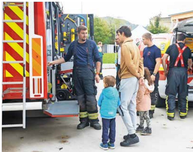
Na preventivnem dnevu PGD Preska - Medvode občani lahko od bližje spoznajo gasilce in njihovo opremo.