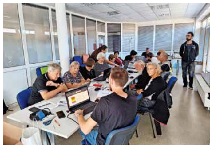
Člani DU Pirniče se računalniško izobražujejo.

V Društvu upokoencev Pirniče nadaljujejo izobraževanje svojih članov na področju uporabe računalnika. V treh terminih so ga v septembru in v začetku oktobra izvedli trije sodelavci podjetja Neutron. Pirniškim upokoencem so predali obilo znanja in jim predstavili več kot le osnove. »Imeli smo dovolj priložnosti, da smo dobili odgovore na vprašanja, tudi glede posameznih primerov in težav pri delu z računalnikom in uporabi mobilnega telefona. Prejeli smo tudi obsežno knjižno gradivo z vsemi postopki in razlagami za delo. Gradivo je pregledno, kakovostno in uporabno,« so zapisali v Društvu upokoencev Pirniče. V novembru nadaljujejo računalniško opismenjevanje s skupino Simbioza. M. B.