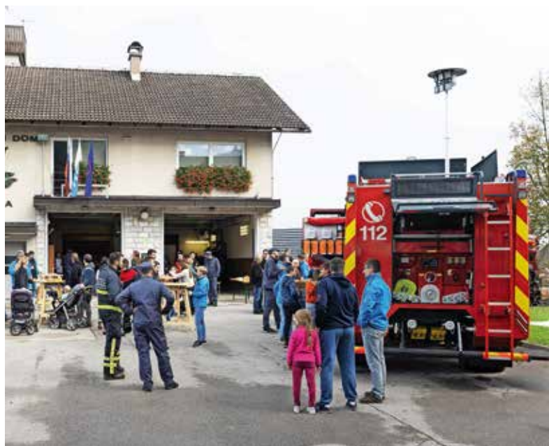
Dnevi odprtih vrat so namenjeni tudi druženju. Na fotografiji je dogajanje pred gasilskim domom v Sori.