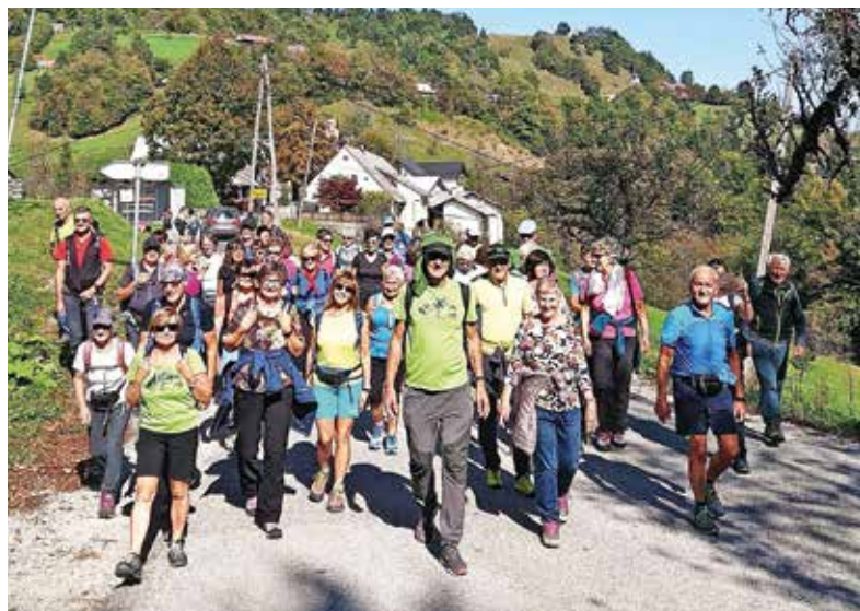
Planinci iz Južne Tirolske so v Polhograjskih preživeli lepo popoldne.

Za člani PD Medvode je sicer pestro poletje. Avgustovsko deževje je na planinskih poteh v Polhograjskih povzročilo precej škode. »Pot od Rusa proti Osolniku po Mavškem grabnu je uničena. Trenutno je zaprta in bo taka tudi ostala, ker je od brvi do doline Ločnice vse uničeno. Pot je zasuta, ogromno je naplavin in skal,« pravi Šturm in dodaja, da je erozija poškodovala tudi nekaj drugih poti, ki jih bo v prihodnje treba popraviti.