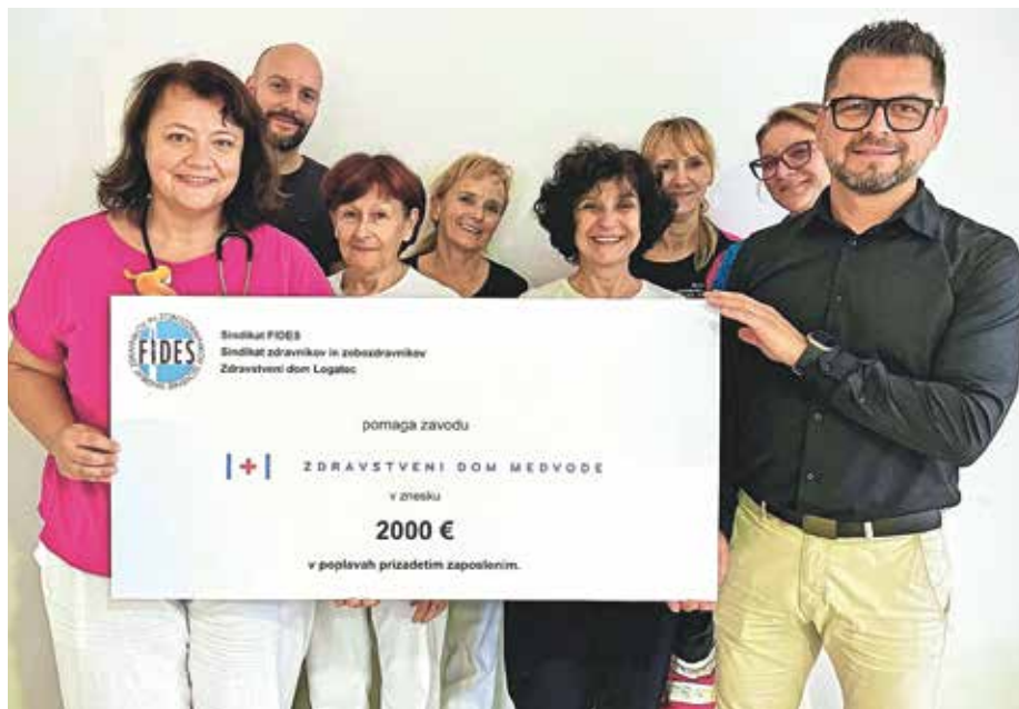
Predaja bona Zdravstvenega doma Logatec Zdravstvenemu domu Medvode – za njihove zaposlene, ki so utrpeli škodo v poplavah

V Zdravstvenem domu Medvode so se pred kratkim razveselili tudi informacije, da je projekt gradnje prizidka pripravljen za oddajo za pridobitev