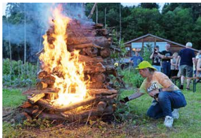
Marjanca iz skupnosti Barka je bila ena od treh sprejetih oseb, ki so prižgale kres.

Kresni dan so barkači začeli že popoldne v zbiljski cerkvi sv. Janeza Krstnika. Nadaljevali so s piknikom v Barkinih delavnicah in zaključili s prižigom kresa, kulturnim programom in druženjem ob ognju. Kresovanje pripravljajo skupaj z društvom Sorško polje, ki skrbi za skupnostni vrt za Barkinimi delavnicami. »Kres je verjetno najstarejša tradicija v naših krajih. Zanimivo je, da ob raziskovanju starih obredov, ki so se dogajali na tem prostoru, je ogenj bil vedno osrednji del teh obredov. Včeraj je bil solsticij, jutri bo kresna noč, v teh treh dneh sonce doseže najvišjo točko na nebu in miruje. To bi moral biti čas za ustavitev, pogled vase in za ponovni zagon