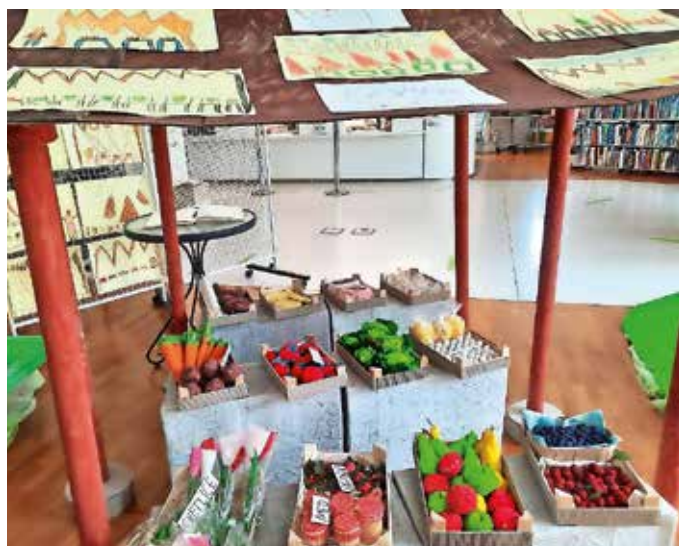
Utrinek z razstave Medvode – moj kraj / Foto: arhiv Knjižnice Medvode

Do 11. avgusta pa je v knjižnici na ogled že nova razstava, ki prikazuje ustvarjalnost otrok. Pripravila jo je Založba Malinc, njen naslov pa je Leo, leo v Sloveniji in Španiji. Razstavljeni so nekateri od izdelkov, ki so nastali v okviru projekta Pokrajine evropske književne raznolikosti. Ob izdelkih slovenskih otrok, ki so jih ustvarili ob besedilih iz španskega govornega območja, obiskovalci razstave lahko pokukajo tudi v ustvarjalne dosežke španskih otrok, ki so ustvarjali ob v španščino prevedenih besedilih slovenskih avtorjev.