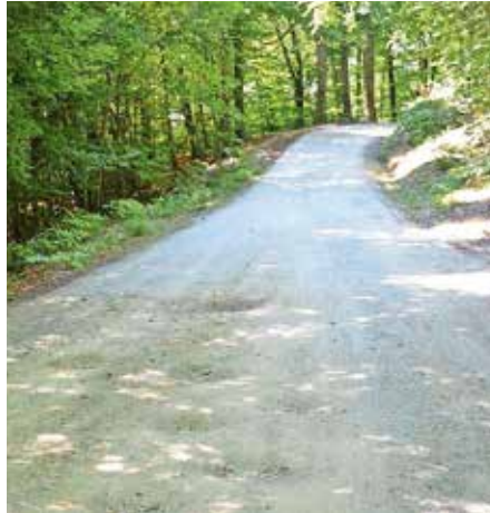
Asfaltirali bodo še dobrega pol kilometra ceste.

Gre za eno izmed prioritetenih investicij, ki jih je predlagala Krajevna skupnost Sora. »Na Občini Medvode si prizadevamo, da skladno s finančnimi zmožnostmi asfaltiramo čim več makadamskih cest na območju Polhograjcev, saj se s tem izboljša kvaliteta bivanja in hkrati znižajo stroški vzdrževanja cest. Na odseku Sora–Osolnik bo po zaključku del ostal le še en neasfaltiran odsek, ki ga bomo asfaltirali takoj, ko bodo zagoto-