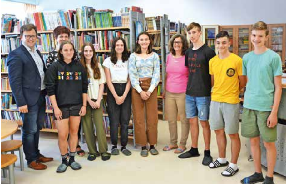
... OŠ Medvode