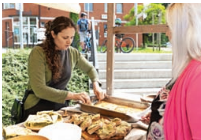
Dišalo je po srednjeveški hrani.

sionalci. Gre za sklop projektov in dogodkov, ki predstavljajo potencial za razvoj kulture tako v lokalnem okolju kot tudi širše, za raziskovanje, snovanje in opazovanje novih programov ter nadgradnjo starih, za povezavo kulturne dediščine z bolj popularnimi, zabavnimi vsebinami za otroke in odrasle. Festival sledi strategiji razvoja kulture v občini Medvode, ki je bila sprejeta pred dvema letoma,« je pojasnila Sabina Spanjol, koordinatorka in organizatorka kulturnega programa v Javnem zavodu Sotočje, pod okriljem katerega je festival potekal. Trajanje in obseg festivala sta se skozi leta spreminjala. Letos je trajal osem dni, kar je manj kot lani, program pa je bil zato še bolj strnjen. Sodelovalo je 28 organizacij in kar nekaj profesionalcev in prostovoljcev. Z več različnih zornih kotov so obravnavali legende.