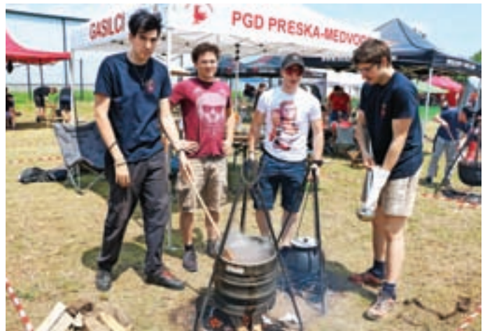
Letos so pred domom PGD Trata v Škofji Loki že tretjič organizirali Golažijado. V pripravi najboljšega golaža se je pomerilo 21 ekip. Kuhala je tudi ekipa PGD Preska - Medvode. A. B.