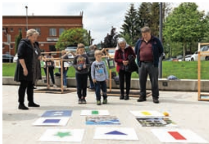
Festival je namenjen vsem generacijam.