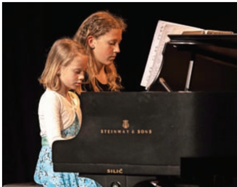
Na predstavitvenem nastopu so nastopili uspešni učenci medvoške podružnice Glasbene šole Franca Šturma.