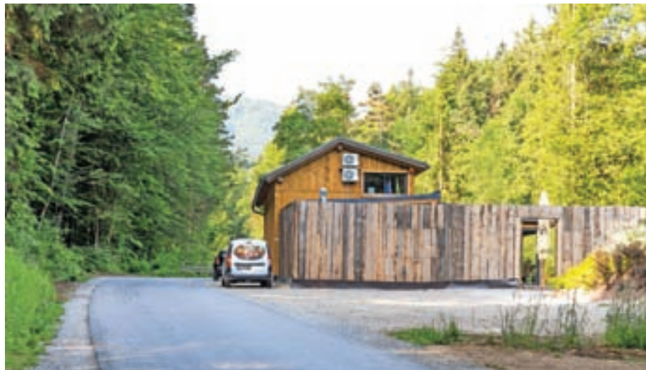
Ranč Maček je tik ob cesti med Presko in Studenčicami.

In kaj pravijo pristojne inšpekcijske službe? Z Inšpektorata Republike Slovenije za naravne vire in prostor smo 31. maja na naša vprašanja prejeli naslednji odgovor: »Gradbeni inšpektor je v inšpekcijskem postopku ugotovil, da investitor objekta na zemljišču s parc. št. 680/2, k. o. Preska,