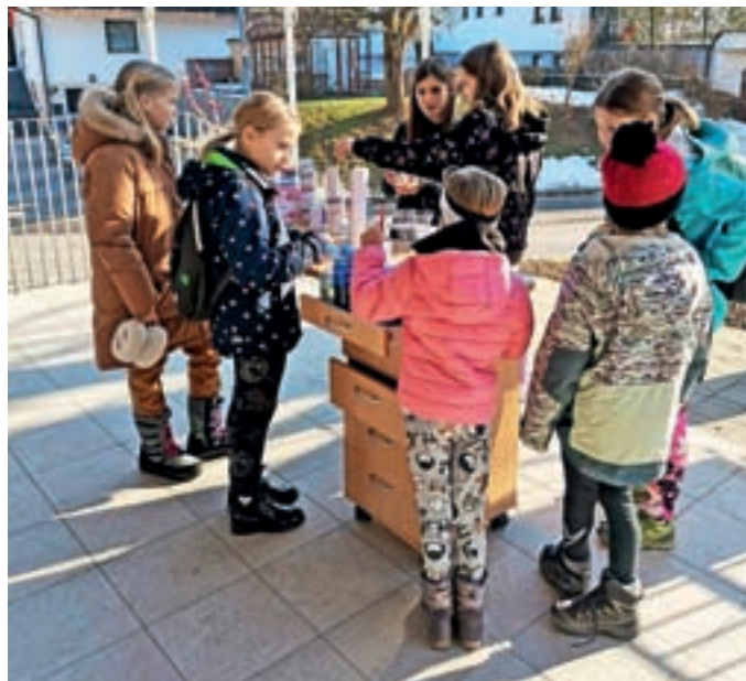
V Bivaku ni dolgčas, tudi v Sori ne.

Dnevni center za otroke in mladostnike je socialnovarstveni preventivni program, ki je namenjen otrokom in mladostnikom iz občine Medvode. Poteka pod okriljem Javnega zavoda Sotočje. Enote dnevnega centra so že na štirih lokacijah: v Sori v prostorih KUD Sora se srečujejo ob ponedeljkih in četrtek med 13. in 17. uro, v Smlednik v prostorih KUD Smlednik ob sredah med 13. in 16. uro, v Preski v taborniški hiški pod Čerenom ob torkih med 13. in 17. uro, na Topolu, kjer je dnevni center na prostem, pa vsak četrtek od 13.30 do 17. ure. Na zadnje je Bivak zaživel v Preski, kjer so jim vrata odprli medvoški taborniki. »Bivak je namenjen otrokom in mladostnikom za zanimivo in kakovostno preživljanje popoldanskega prostega časa, je prostor, ki je za mlade varen in se v njem dobro počutijo, si med seboj izmenjujejo znanja, počnejo stvari, ki jih zanimajo, imajo čas zase ... V Bivaku ni dolgčas, pestre vsebine se izbirajo skupaj z udeleženci. To so ustvarjalne, športne, literarne, glasbene, umetniške, naravoslovne ... dejavnosti, pogovori, dru-