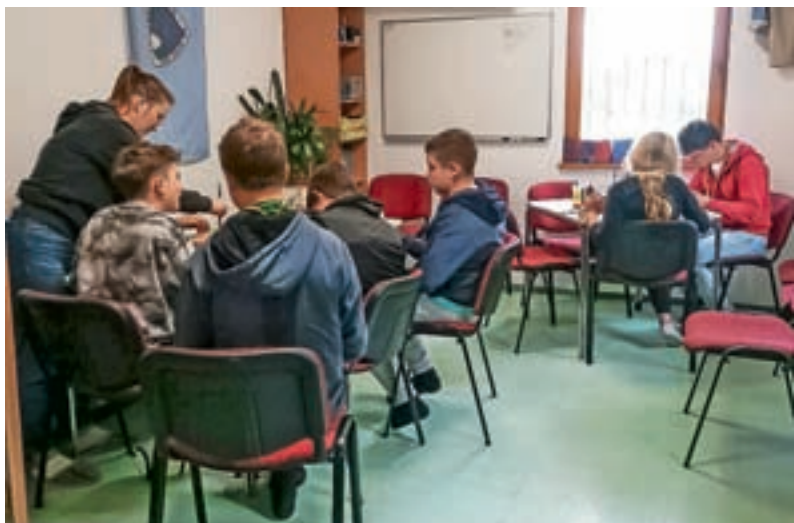
Zadnje enote dnevnih centrov so odprli v Preski.

Za poletno počitniško varstvo v organizaciji Javnega zavoda Sotočje je veliko zanimanja. Tako je bilo tudi letos, saj so bila mesta za vse termine zapolnjena v manj kot 24 urah. Preostale prijavitelje so dali v čakalno vrsto v primeru kakšne odpovedi. So pa še na voljo termini v Poletnih gozdnih delavnicah, ki bodo v Sori potekale v organizaciji društva V gozdu smo. Otroško gozdno igrišče V gozdu smo bo polno otroškega vrveža med 26. junijem in 21. julijem ter med 14. avgustom in 25. avgustom. Pripravljajo številne dejavnosti in igre. Prijave sprejemajo na mismogozdnidetektiv@gmail.com . M. B.