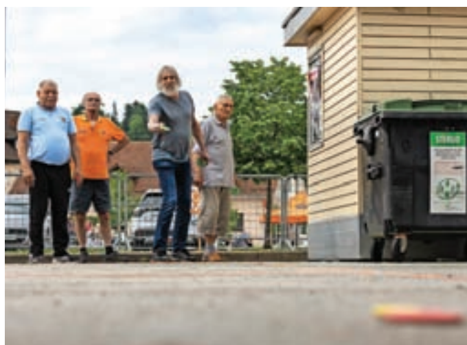
Udeleženci so se lahko preskusili v različnih športih, tudi v prstometu.