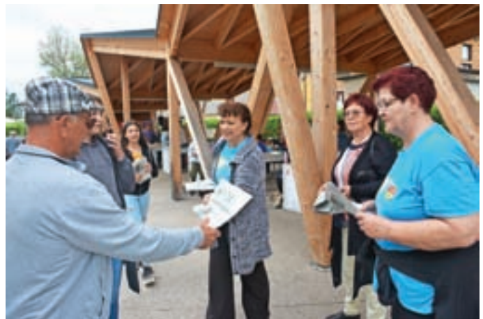
Medvoški prostovoljci so na Tržnici Medvode ob zaznamovanju Veselega dne prostovoljstva delili izvode časopisa Slovenske filantropije Skozinsko filantrop. Tovrstna akcija je potekala v 55 slovenskih krajih. M. B.