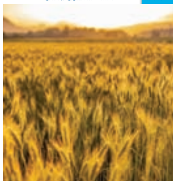
Sorško polje ob zlati uri