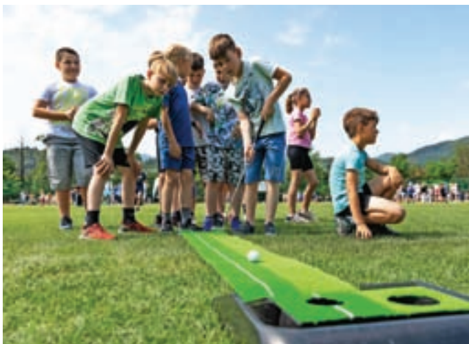
Uvod je bila Miniolimpijada, na kateri se je s 34 različnimi gibalnimi izzivi spopadlo 720 otrok.