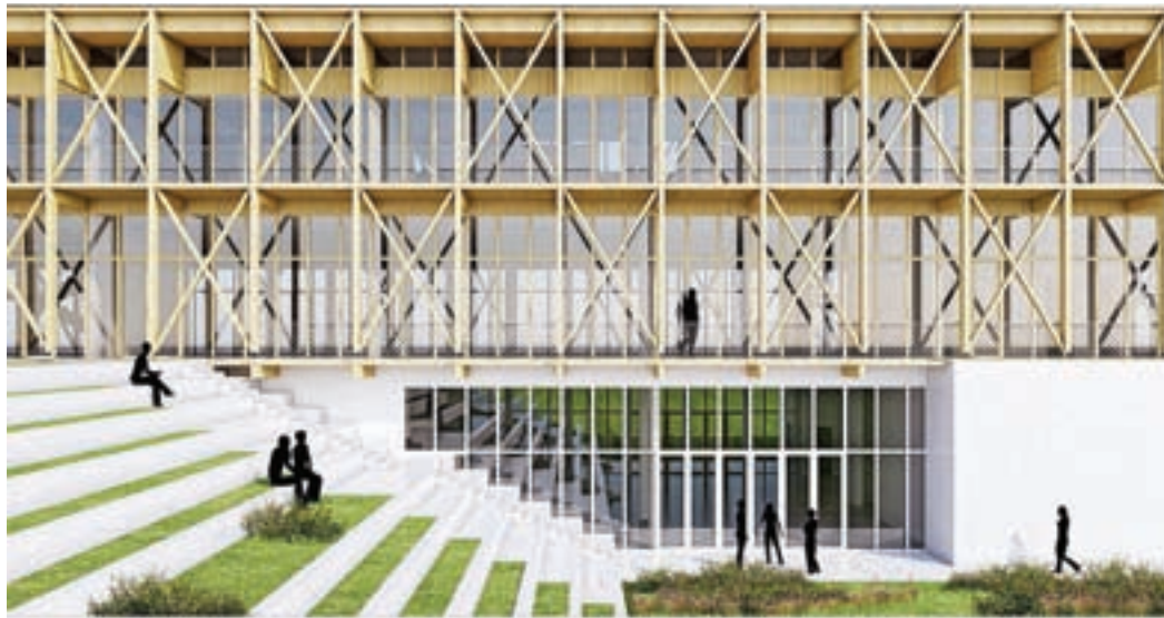
Vizualizacija nove Osnovne šole Preska

Drugi del predstavitve je bil namenjen razpravi, v kateri sta bila največkrat omenjena prometna ureditev in morebitno poslabšanje bivalnih pogojev bodočih najbližjih sosedov. Večkrat je bilo podano