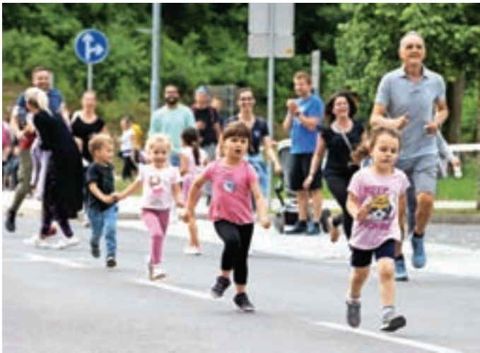
Tekli so tudi otroci.

utrujen, glede na to, da je dopoldan že tekel na Ratitovec, torej v zahteven vzpon. Lahko sem mu hvaležen. On je naredil lep trening, jaz pa dobro tekmo. Prvič sem v Medvodah. Kolegi tekači so mi svetovali udeležbo in mi ni žal. Res so se potrudili, vzdušje je super. Ta zmaga mi veliko pomeni,« je v cilju pojasnil novi zmagovalec.