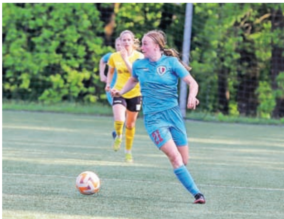
Je napadalka, z dvajsetimi zadetki šesta strelka lige.

Po srednji šoli, obiskovala sem Škofijsko klasično gimnazijo, sem se vpisala na študij slovenistike na Filozofski fakulteti v Ljubljani, kjer obiskujem drugi letnik. Po prvem letniku sem se vpisala še na Fakulteto za šport. Včasih je malo