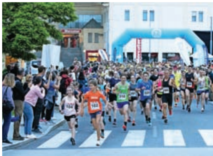
Vrhunec je bil 6. Nočni tek Medvode s tekom na pet in deset kilometrov.