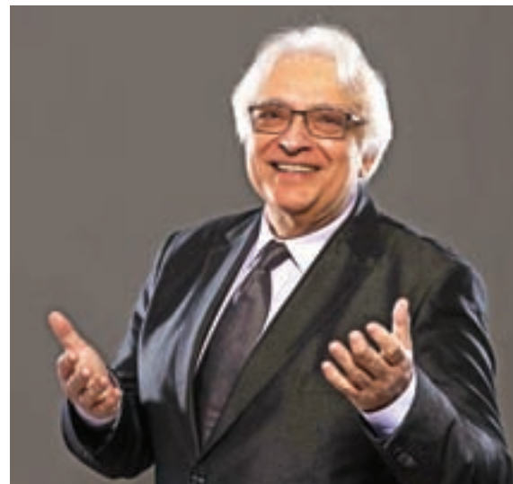
Na Večeru slovenske popevke z Godbo Medvode in gosti bo kot solist nastopil tudi Oto Pestner.

Večeru slovenske popevke bodo sledili Fast X kino na tržnici (24. junija), Karavana okusov (8. julija na tržnici), koncert Nine Pušlar z odprtjem kolesarske brvi (8. julija na tržnici), zato bo vstop prost, film Indiana Jones in artefakt usode (22. julija na tržnici), klapski večer Šufit in Solaris (23. julija na tržnici), festival Wild West Fest ob Zbiljskem je-