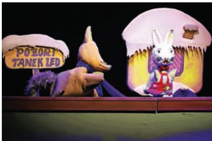
Ogledali so si predstavo Zajček Didldajček.