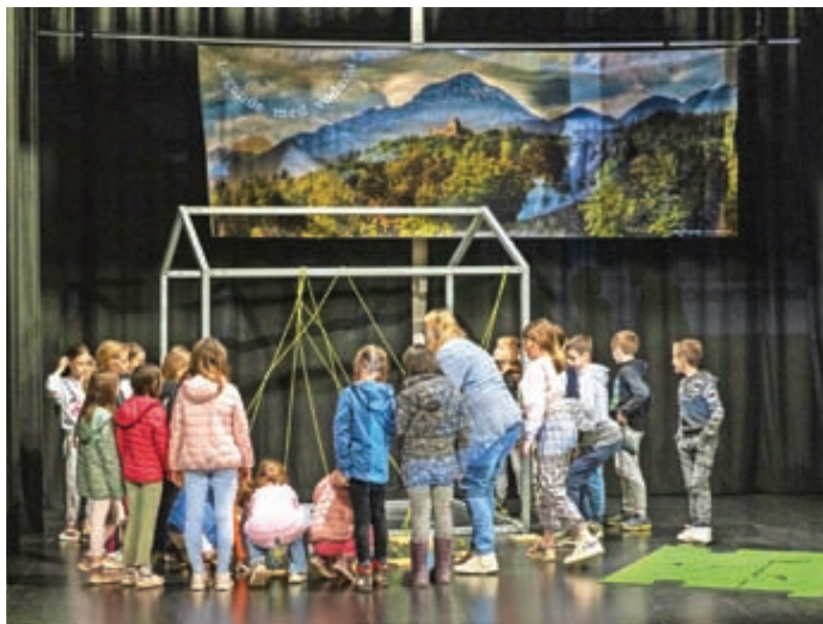
Potujočo ustvarjalnico je skupaj z ogledom zaključne predstave obiskalo okrog petsto otrok.