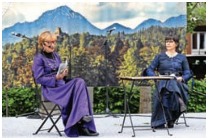
Na odru so pripovedovali tudi legende. / Foto: Peter Košenina

Organizatorji napovedujejo, da bo festival ostal tradicija in da bo potekal tudi prihodnje leto.