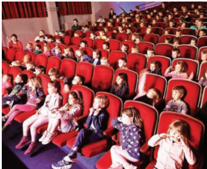
Zaključna prireditev bralne značke za predšolske otroke Medvodko bere je tudi tokrat potekala v KUD Pirniče.

Zaključil se je tudi projekt Beremo na sotočju, bralna značka Knjižnice Medvode, ki spodbuja branje med odraslimi. »Potekala je že desetič, in sicer od 3. oktobra do 29. aprila. Skozi leto so sodelujoči brali gradivo s seznama, ki je obsegal 80 naslovov; za opravljeno bralno značko je bilo treba prebrati pet knjig. Seznam literature smo oblikovali v Knjižnici Medvode. Ob zaključku projekta smo za sodelujoče pripravili majhno pozornost. Veseli nas, da se je njihovo število v primerjavi z