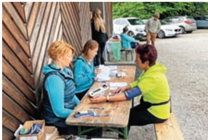
Udeleženci so imeli možnost opraviti tudi meritve krvnega tlaka in holesterola.

Udeleženci so lahko preverili svojo srčno-žilno zmogljivost, krvni tlak in holesterol ter ponovili temeljne postopke oživljanja z AED. Spoznavali so tudi tehnike sproščanja. »Dogodka se je udeležilo trideset oseb. Povprečna starost je bila 56 let. Test srčno-žilne zmogljivosti je opravilo 24 oseb, od tega jih je bilo telesno zmogljivih nad povprečjem sedem, povprečno prav tako sedem, pri devetih pa je bila telesna zmogljivost pod povprečjem za njihovo starost in spol. Meritev celokupnega holesterola s kapilarne krvi se je udeležilo trideset oseb, od tega jih je osem imelo vrednosti celokupnega holesterola v mejah referenčnih vrednosti (do 5,1), 22 je imelo vrednosti povišane, od tega šest močno povišane (celokupni holesterol nad 7,1 mmol/l). Ugotovljamo, da bo treba še dodatno pozornost nameniti ozaveščanju prebivalcev o zdravem življenjskem slogu in aktivnostih za krepitev zdravja, ki jih izvajamo v Zdravstvenovzgojnem centru Medvode,« je pojasnila vodja centra Keti Simonska.