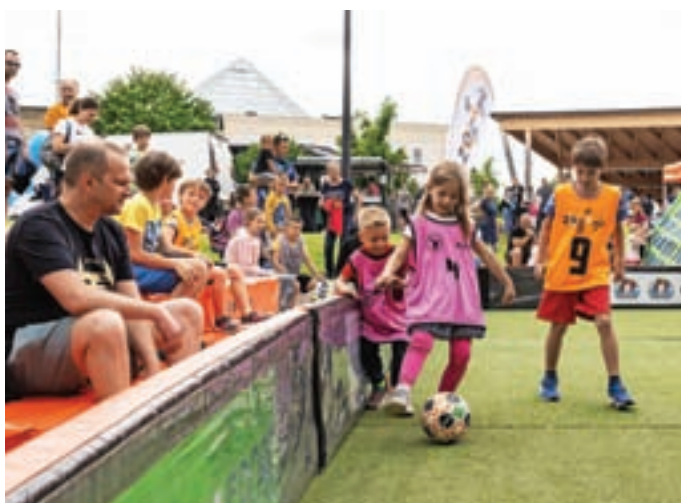
Del festivala Medvode v gibanju je bila tudi Žogarija s 145 udeleženci.