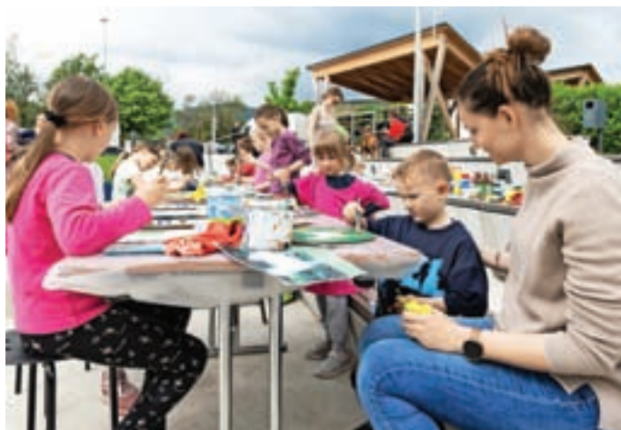
Veliko je bilo priložnosti za ustvarjanje.