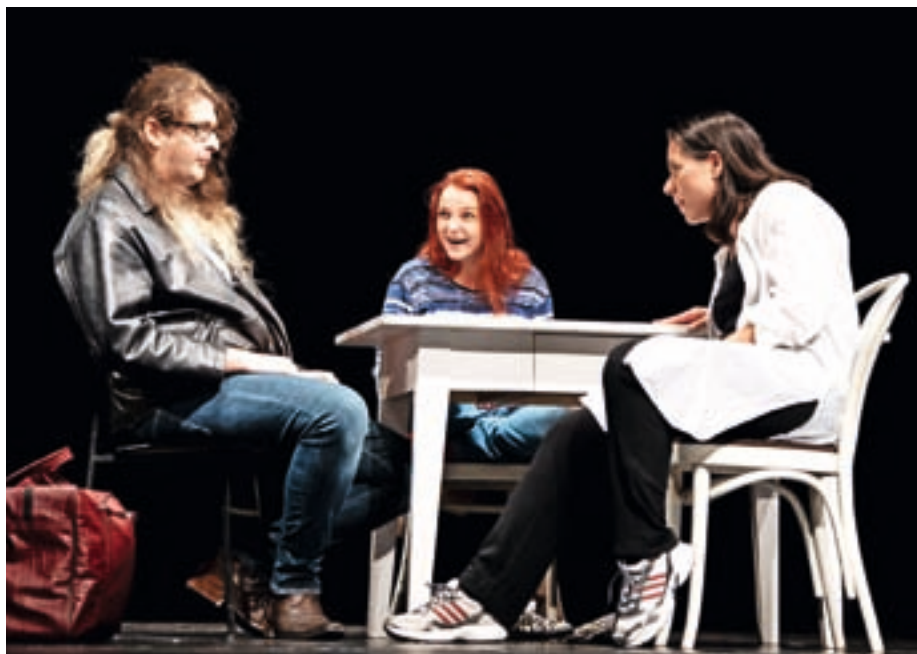
Matiček za kolektivno igro, KUD Fofité, Kri in voda

Producent za gledališko dejavnost pri JSKD in vodja festivala Linhartovo srečanje Jan Pirnat je ob odprtju povedal, da se rez, ki ga je prineslo pandemično