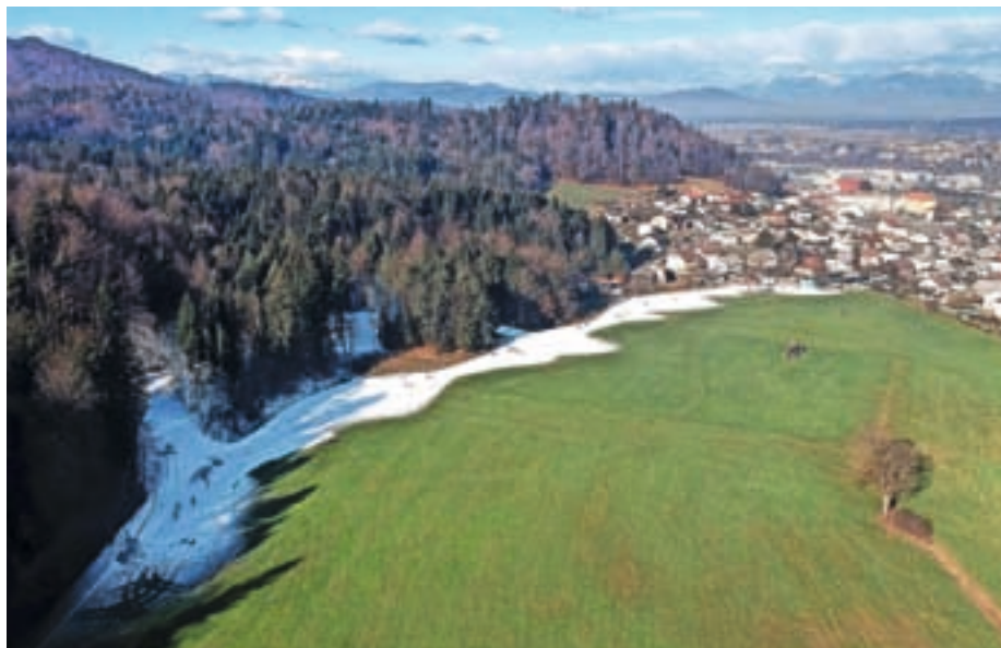
Pripravljene imajo izračune, vezane na stroške zasneževanja Nordijskega centra Bonovec, kjer bodo letos še toliko bolj odvisni od naravnih vremenskih pogojev.

V objektih v upravljanju javnega zavoda Sotočje Medvode še niso začeli kurilne sezone. »Ta se običajno začne, ko temperatura ob 21. uri tri dni zapored pade pod 12 stopinj Celzija,« pojasni. Bodo letos sprejeli kakšne ukrepe, bodo temperature v javnih objektih nižje? »Vlada je sicer sprejela nekatere ukrepe in priporočila za učinkovito rabo energije v stavbah javnega sektorja s ciljem 10-odstotnega znižanja porabe energije. Seveda pa je izvajanje ukrepov v praksi na koncu odvisno od vsakega upravljavca objektov posebej. Tako smo na primer v Športni dvorani Medvode, ki ima samodejni sistem regulacije temperature zraka, nastavitve prilagodili tako, da se dvorana v kurilni sezoni za športne dejavnosti ogreva na 18 stopinj Celzija