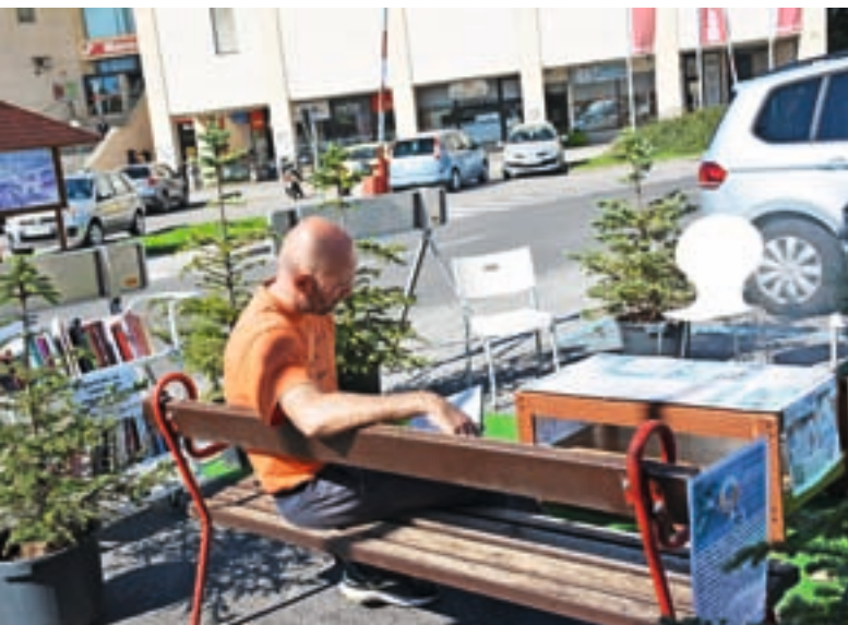
Dnevna soba sredi parkirišča