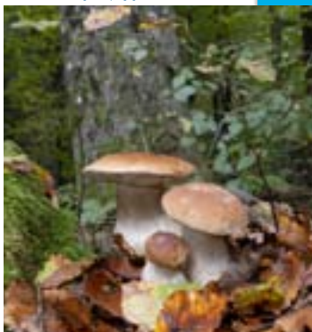
Na naslovnici: Jesen