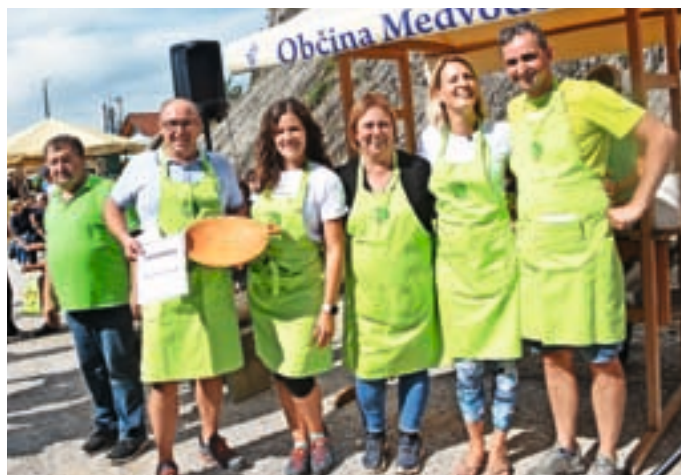
Člani Turističnega društva Hraše so po oceni obiskovalcev skuhalo najboljši grajski lonec.

Za Turistično društvo Smlednik in za pohodnike je to nova velika pridobitev. Društvo ima že več kot šestdesetletno zgodovino delovanja, ki se od samega začetka vrti okrog razvalin in z nji-