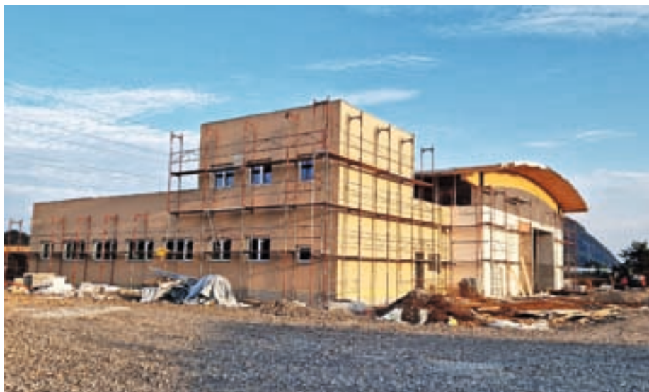
Gradnja gasilskega doma naj bi bila končana do konca letošnjega leta.