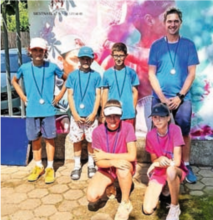
TK Spin Medvode ima tudi zelo dobro generacijo deklic in dečkov do 12 let.

Člani Teniškega kluba Spin Medvode še naprej nastopajo zelo uspešno. Leto 2021 so na klubski lestvici najboljših klubov v Sloveniji končali na odličnem četrtem mestu in še izboljšali peto mesto iz leta 2020, zelo dobro pa jim kaže tudi letos.