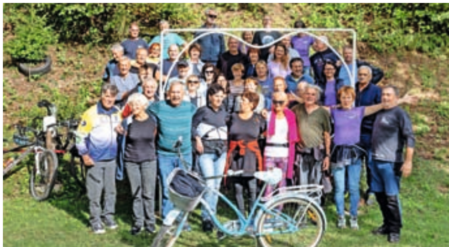
Člani Kolesarskega kluba Medvode so se sredi septembra zbrali na pikniku. Čeprav kolesarske sezone še ni konec, so se z veseljem spomnili na vse letos prevožene kilometre in dogodivščine, ki so jih v tem času doživeli. P. K. / Foto: Peter Košenina