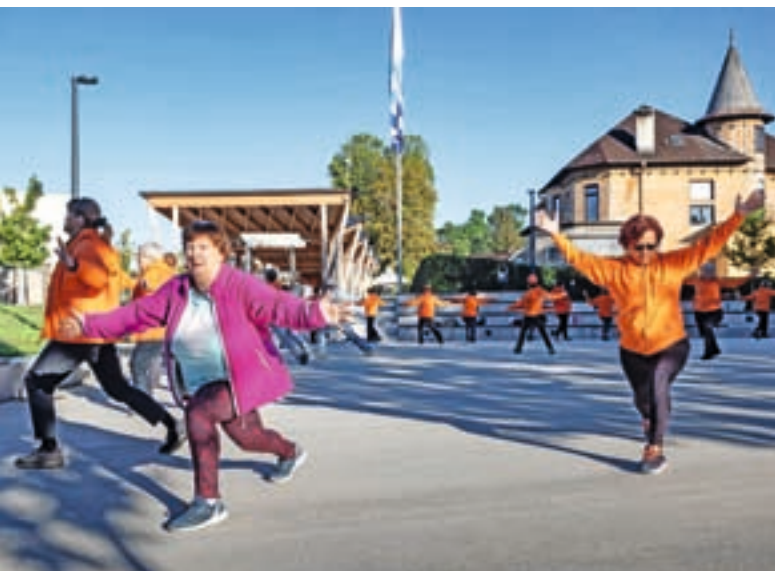
V novo jutro s telovadbo

jekt v dolžini skoraj 7 kilometrov z novo brvjo pri nogometnem igrišču in ureditvijo podhoda v Preski je v pripravi. Kjer se le da, projekt umikamo z glavne ceste. Žal pa načrtovana trasa pod osnovno šolo v Sori na predstavitvi lastnikom zemljišč ni dobila podpore. Omenil bi tudi rekonstrukcijo krožišča pr' Štefanc v Spodnjih Pirničah. Veliko je bilo prošenj krajanov, da se uredi za najranjlivejše skupine. Edina možna rešitev je bila zoženje ceste, tako da na obeh straneh dobimo pločnik in prehod za