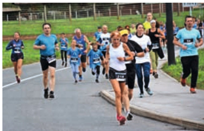
Medvoškega teka so se udeležili številni rekreativci različnih generacij. Skoraj tristo jih je krožilo po Medvodah.