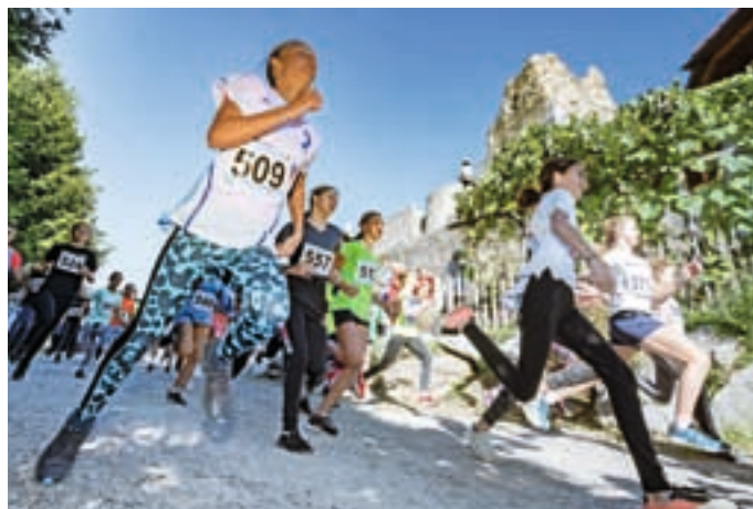
Učenci in dijaki so se na Starem gradu pomerili za naslove državnih prvakov v gorskem teku.