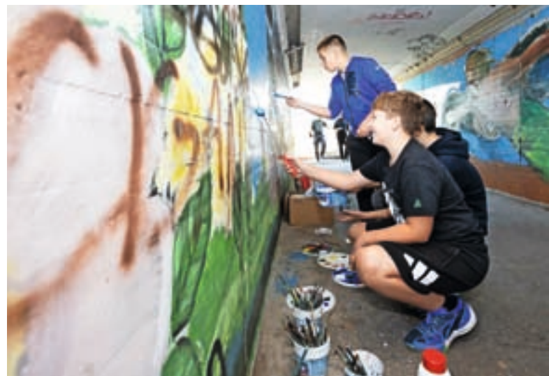
Nadaljeval se je projekt Grafitarnica med vodami – poslikava podhoda pod železniško postajo. Letos so se vključili tudi osnovnošolci.

pešce. Ob izvedbi projekta pa so bili odzivi ljudi tudi negativni, zakaj prostor jemljemo avtomobilom. Radi bi osvetlili obstoječi prehod za pešce na Zbiljski cesti pri Gostilni Gustl. Po enem letu smo od Direkcije RS za infrastrukturo dobili soglasje za izvedbo, ponudba pa je za več kot 63 tisoč evrov. Trenutne razmere v gradbeništvu nam zagotovo niso naklonjene. Omenil bi še projekt, odprt v prihodnost. Pripravili smo idejno ureditev Ceste komandanta Staneta. Prednost daje varnosti pešcem in kolesarjem, omejuje in nadzoruje parkiranje. Investicija se bo izvedla v sklopu načrtovane stanovanjske gradnje. Veseli smo, da imamo še vedno tri linije javnega potniškega prometa, in spodbujam občane, da jih uporabljajo. Dobro živi tudi Prostofer, primer medgeneracijske pomoči. Sam evropski projekt se zaključuje, odločili pa smo se, da ga bomo peljali naprej. Potreb za prevoze je med starejšimi kar veliko, medtem ko je število prostovoljcev velik izziv, da se ohrani projekt in opravijo vsi prevozi.«