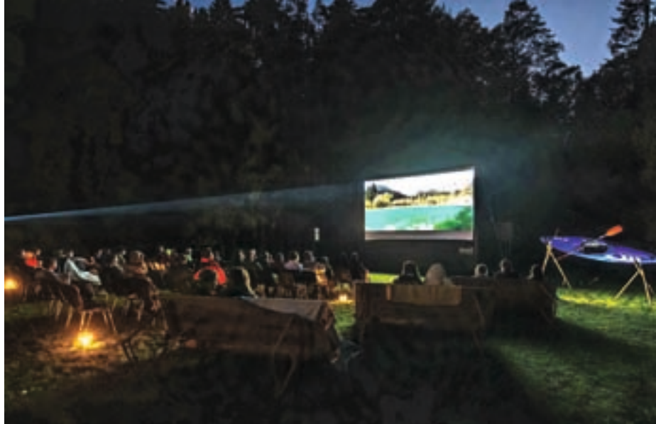
Projekcija dokumentarnega filma Zgodba Save v Preski je bila dobro obiskana.

Večina ljudi nas o reki Savi ve to, kar se je naučila v šoli. Da je najdaljša reka v Sloveniji, da njen dolinski del izvira v Zelencih, bohinjski pa v Bohinju. Vemo, da je na njej več hidroelektrarn, ena od njih tudi v Medvodah. Če smo iskreni, reke ne poznamo. Da bi njeno zgodbo ljudem približali, je kajakaško gibanje Balkan River Defence (zaščita balkanskih rek) posnelo film Zgodba Save. Gibanje se bori za zadnje prosto tekoče reke v Evropi, ki so žal le še na Balkanu. V šestih letih delovanja so pomagali domačinom v Albaniji, Črni gori, BiH in drugod, zmanjkalo pa jim je časa za delo v domači Sloveniji. »Ravno ko smo se pogovarjali, da je čas, da tudi doma kaj naredimo, so se pojavili načrti za