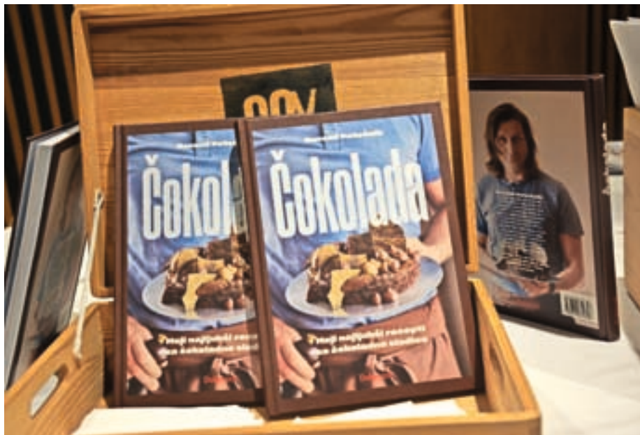
V knjigi z naslovom Čokolada je štirideset receptov za čokoladne slaščice iz vseh vrst čokolade in za vse okuse ter ravni znanja – od otročje lahkih sladkosti do mojstrov, ki so izziv za domače slaščičarske mojstre.

Narediš ga iz zelo osnovnih sestavin. Vajeni smo ga delati iz vrečke, kjer pa je samo škrob, kakav, potem dodaš sladkor in mleko. Sem pristaš pudinga iz pol mleka, pol mlečne smetane, malo rjavega ali kokosovega sladkorja, nežno vmešaš čokolado, ne kakav, počakaš, da se strdi, in uživaš. Ljudje so morda še vedno premalo izobraženi v tej smeri, da bi šli korak nazaj in razmislili, kaj