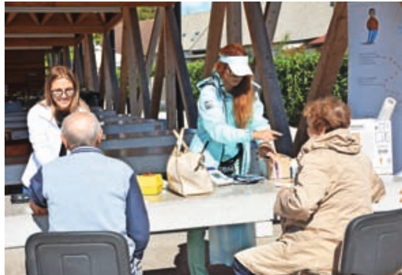
V Evropski teden mobilnosti se je vključil tudi Zdravstvenovzgojni center Zdravstvenega doma Medvode. Obiskovalcem so brezplačno izmerili holesterol in krvni tlak, potekal je tudi test hoje.