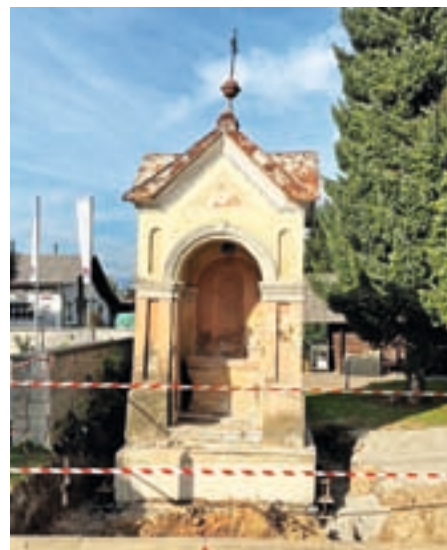
Razlog za prestavitev je zagotavljanje boljše varnosti v prometu.

Zakaj so kapelico prestavili, so pojasnili na Občini Medvode. »Kapelico premikamo v sodelovanju z župnijo Preska, razlog za prestavitev pa je zagotavljanje boljše varnosti v prometu. Prestavitev kapelice bo omogočila postavitve avtobusnega postajališča na tem mestu. Hkrati se bo izboljšala tudi preglednost, predvsem pri vključevanju iz stranskih ulic na glavno cesto. Izvajalec del, podjetje Kalgrad, je predhodno izvedel gradbena dela za varen premik. Izveden je bil izkop okoli kapelice, vgradili so se jekleni profili, zabetoniral se je nov temelj. Izveden je bil tudi nov izkop