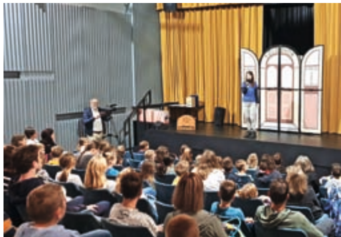
Zaključna prireditev je bila v Kulturnem domu Medvode.

»Zgodba s počitniškim branjem se je začela pred šestimi leti, ko smo se pridružili Mestni knjižnici Ljubljana, ki je nosilka projekta Poletavci/Najpoletavci. Veseli smo, da smo del velike družine bralcev, in hkrati ponosni na to, da je veliko otrok sodelovalo pri bralnem projektu. Knjižničarji si želimo, da bi otroci in mladi čim več brali in tako razvijali besedni zaklad, domišljijo ter vedenje, in to ne samo med šolskim letom, temveč tudi med poletnimi počitnicami. S tem, ko so veliko brali, so si pridobili super navado, to je branje, in super nagrade: majico, priznanje, balon oziroma broško Poletavci,