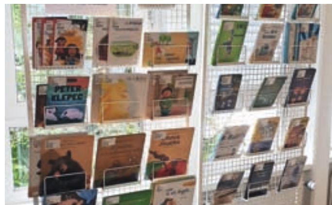
Razstava knjig, primernih za dislektike

V času od 4. do 10. oktobra je v organizaciji Evropske zveze za disleksijo potekal Evropski teden ozaveščanja javnosti o disleksiji in drugih specifičnih učnih težavah. Disleksija ali legastenija je specifična bralno-napisovalna motnja, za katero so značilni primanjkljaji na področju slušno-vidnih procesov. Povzročajo številne dolgotrajne težave in je po pojavnosti najbolj razširjena specifična bralno-napisovalna motnja. Pojavlja se pri približno desetih odstotkih svetovnega prebivalstva. Čim bolj zgodaj je odkrita in čim hitrejša je obravnava, tem boljši so rezultati, zato je pomembno poznavanje ključnih značilnosti disleksije. V Knjižnici Medvode so pripravili razstavo knjig, primernih za dislektike, kot tudi priporočilni seznam knjig na to temo. M. B.