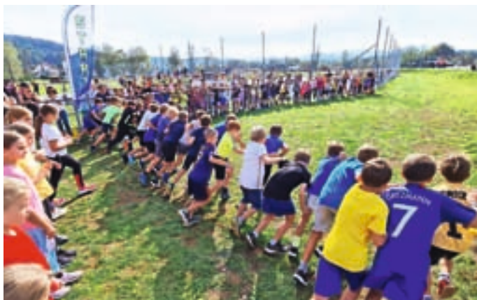
Na občinskem prvenstvu v krosu je bila tudi letos dobra udeležba.

Osnovnošolci so se v Smledniku pomerili na občinskem prvenstvu v krosu. Potekal je v organizaciji Javnega zavoda Sotočje in Osnovne šole (OŠ) Simona Jenka Smlednik.