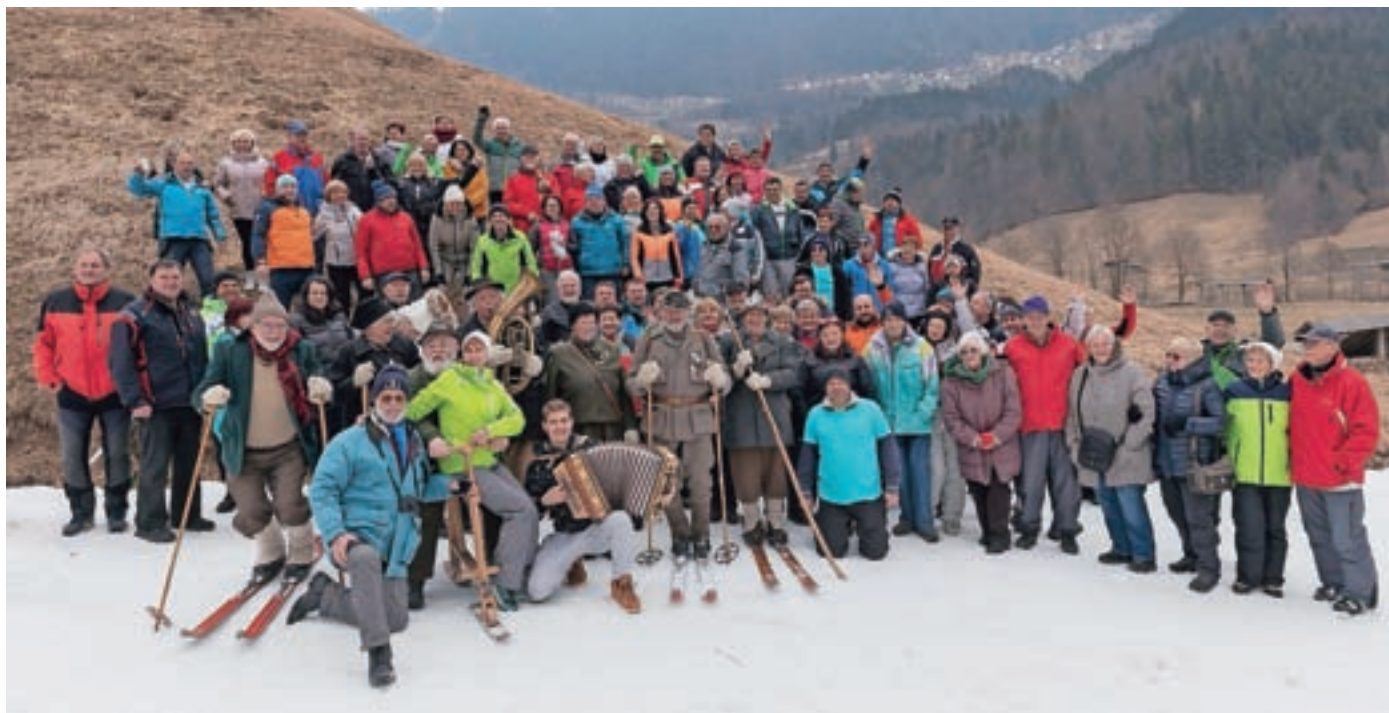
Udeleženci jubilejnih, petdesetih Veteranskih tekem