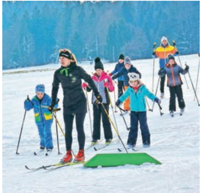
Veliko zanimanja je bilo za tečaje teka na smučeh. Termini so bili hitro polni.