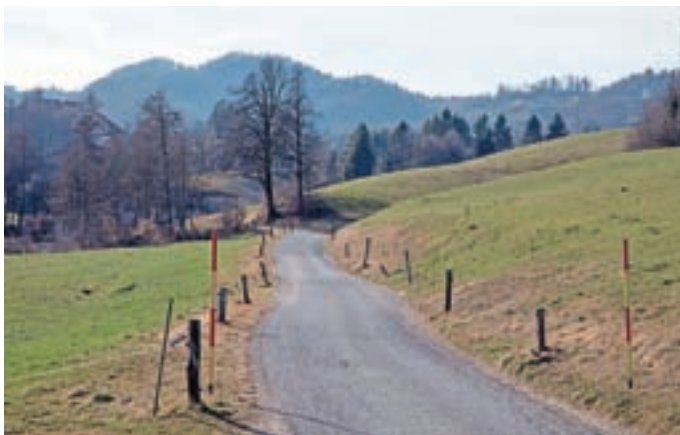
Po rekonstrukciji bo imela cesta v Žlebe dva vozna pasova v skupni širini pet metrov in pol metra bankine, pločnik pa bo širok 1,2 metra.