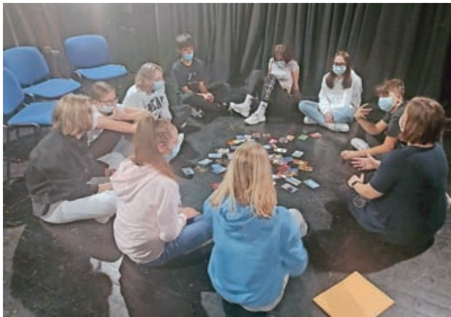
Mladi se poleg matične enote dnevnega centra Bivak v Klubu Jedro (na sliki) od jeseni srečujejo tudi v dislocirani enoti v Smledniku.