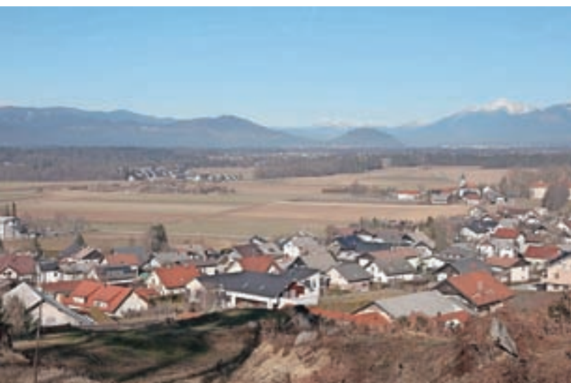
Del komasacijskega območja – pogled s poti, ki vodi na Stari grad nad Smlednikom

Komasacija bo predvidoma končana do sredine leta 2024, agromelioracijska dela pa leto kasneje.