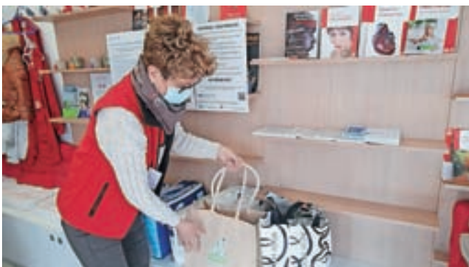
Pomoč že zbirajo tudi v Medvodah in ena izmed lokacij je Krajevna organizacija Rdečega križa (na sliki).

"Verjamemo, da bo naša skupnost tako kot že večkrat doslej znala stopiti skupaj in pokazala solidarnost. Vsem občanom in prostovoljcem se zahvaljujemo za vso pomoč," poudarjajo na Občini Medvode.