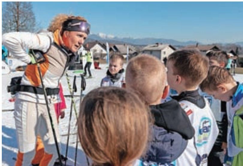
Tretješolce iz OŠ Simona Jenka Smlednik je na Bonovcu obiskala nosilka olimpijske medalje Petra Majdič.

Smučarska zveza Slovenije, Zavod za šport Republike Slovenije in Policija so z alpsko akcijo Šolar na smučih začeli pred sedmimi leti, letos pa so prvič izvedli tudi akcijo učenja teka na smučeh. Hoja na smučeh je bila pred stoletji prva hitrejša oblika gibanja po zasneženi pokrajini, zdaj pa s pomočjo te akcije otroci lahko brezplačno naredijo prve korake na tekaških smučeh. "Namen akcije je otrokom predstaviti smučarski šport, velik poudarek dajemo varnosti, zato v projektu sodeluje tudi slovenska policija. Pri alpskem delu opazamo, da dobra polovica otrok ob udeležbi v akciji prvič stopi na alpske smučiče, ta odstotek pa je pri smučarskem teku še večji. Naš namen je otroke pripeljati na sneg, učenje je brezplačno, pogoj pa je, da se akcije udeležijo vsaj 90 odstotkov otrok iz razreda, torej ne le tisti, ki so že od prej večji smučanja. Po nasmehih na obrazih vidimo, da jih ta aktivnost zabava. Čeprav se jih je veliko s smučarskim tekom srečalo prvič, verjamem, da