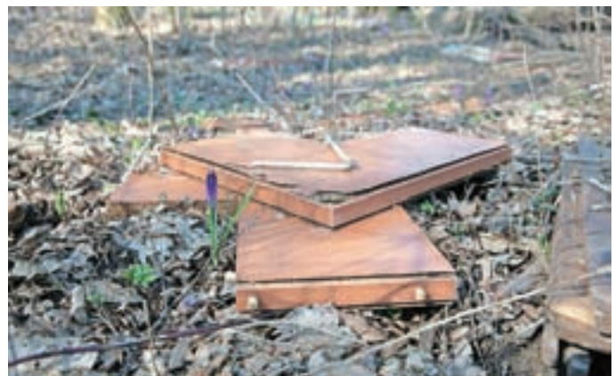
Podobo narave marsikje kazijo odvrženi odpadki.

"Namen spomladanske akcije je urediti okolje, da bo privlačno tako za prebivalce kot za obiskovalce Medvod, prispevati k ozaveščanju in s tem tudi h kakovosti življenja. Dejavnosti so usmerjene v urejanje bivalnega okolja, nabrežij potokov, jezera, rek, gozdnega prostora, okolice prometnih poti ... Mnoge države, med njimi tudi članice Evropske unije, že vrsto let