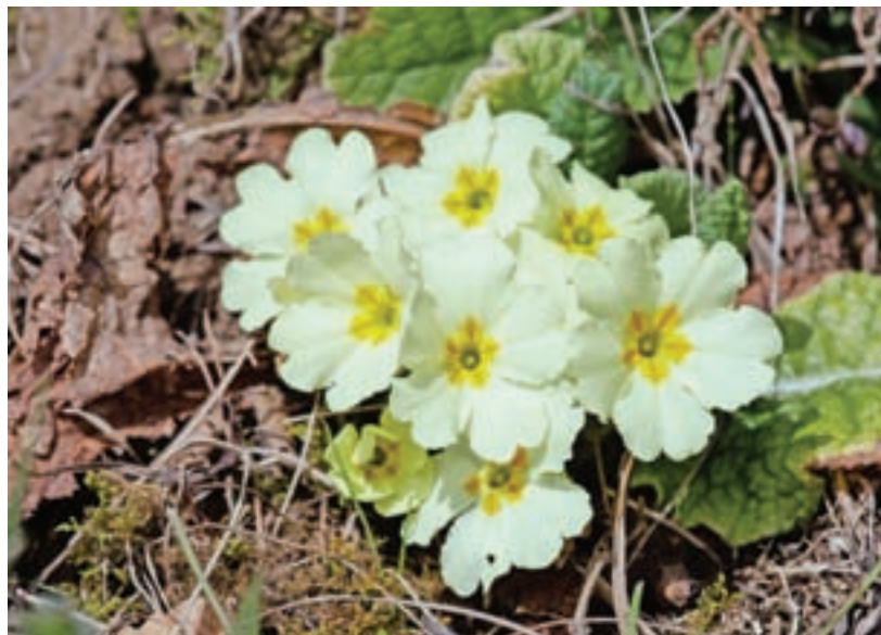
Prve znanilke pomladi, ki so uporabne tudi v čajnih mešanicah, že cvetijo. / Foto: Peter Košenina

Z možem se nama na najinem vrtu že veliko dogaja. V rastlinjaku ni več motovilca in radiča, pred sajenjem paradižnika konec aprila sva ta prostor izkoristila in posejala ter posadila solato, presadila por, jagode so tudi že posajene in solata, ki je prezimila, raste, odkar je toliko toplo, da jo mož redno zaliva. Raste tudi že rdeča redkev in vse to bo moralo v predelavo do konca aprila. V visokih gredah, ki so pokrite s polivinilom, je nova plast domačega gnoja in nove sveže prsti. Posejala sem korenje, peteršilj in za poizkus presadila še nekaj pora, da vidim, kako bo rasel. V naslednjih dneh bom nakupila še nekaj zgodnjega zelja in cvetače. Na okenski polici pa pričakujem, da ozelenita paprika in paradižnik, ki sem ju posejala. Vsako leto sem tako dolgo čakala na primerno velikost sadik, da se je mož že naveličal in šel kupit nove v vrtnarijo. Vse skupaj je en sam užitek gledati in pričakovati, da začne vse zeleneti in rasti, sploh pa je največji užitek, ko v trgovini peljem z vozičkom mimo polic in hladilnika z zelenjavo. Ker ponoči temperatura še ni dovolj visoka, bodo ostale visoke grede počakale, da se bo