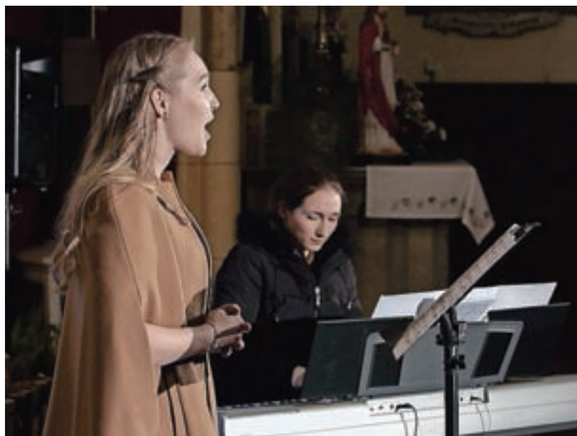
Decembra se je predstavila s svojim prvim samostojnim koncertom v župnijski cerkvi v Smledniku.

▣ Ali je po vašem mnenju slovenski prostor naklonjen mladim glasbenim ustvarjalcem?