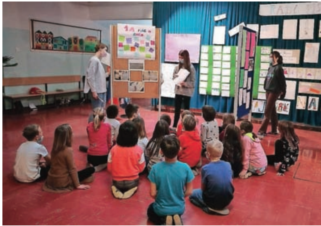
Razstavo so si pod vodstvom novinarskega krožka ogledali tudi učenci od 1. do 5. razreda.

Potekale so številne dejavnosti, ki so jih pripravili učitelji – večina jih je bila kar za celotne razrede, na nekatere pa so se učenci prijavili ali jih celo predlagali. Osrednja tema je bila Pišem z roko, ker ... Kot poudarjajo, pisanje z roko izboljšuje spomin, pisci zmorejo ustvariti več idej, imajo dolgotrajnejšo pozornost, njihovi možgani celovitejše delujejo,