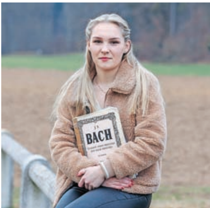
Glasba je pomemben del Mančinega umetniškega in čustvenega izražanja.

Poslušam skoraj vse zvrsti glasbe, je pa izbira zvočne kulise odvisna tudi od razpoloženja. Najraje pojem operne arije Mozarta, Rosinija in Verdija, rada imam tudi Rahmaninova in slovenski samospjev. Brez glasbe si življenja ne predstavljam. Je pomemben del mojega ne le umetniškega, ampak tudi čustvenega izražanja. Kot poustvarjalka se zavedam, da glasba, ki jo ustvarjam, ni le zame, temveč je tudi za druge. Ob koncu nastopa mi je ključnega pomena, da občinstvu nekaj dam, da odidejo napolnjeni z lepim, ljubeznijo in navdihom. Želim si, da glasba vsakega nagovori s tistim, kar potrebuje v danem trenutku.