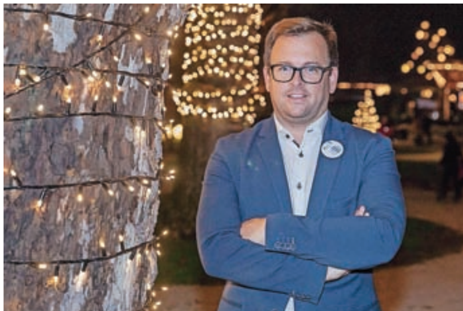
Župan Nejc Smole v praznično okrašenih Medvodah

Vsak projekt je po svoje zanimiv in za določeno skupino občanov pomemben. Če bi bilo treba izbrati, pa bi omenil projekt participativnega proračuna, ki je bil letos pri nas izveden prvič. Zelo pa sem vesel, da smo letos odlično črpali vsa dodatna sredstva, ki jih je država namenila na raznoterih področjih – od družbenih do komunalnih projektov.