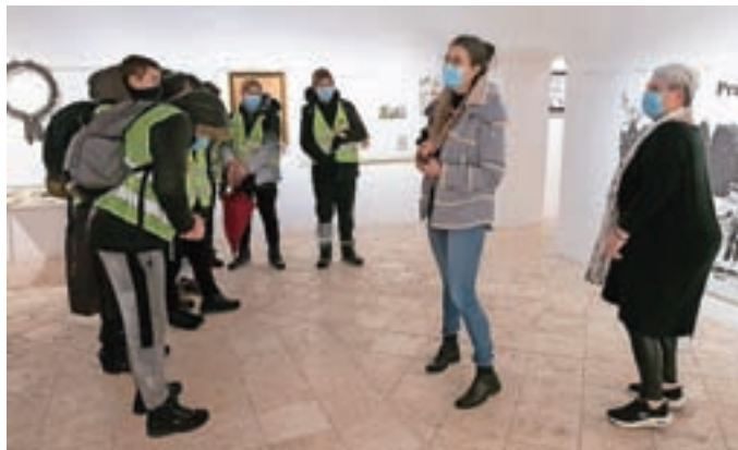
V Kranju so si ogledali Prešernov spominski muzej.