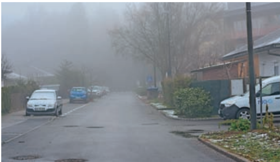
Občina Medvode je letos pristopila k dokončni ureditvi cest v Zbiljskem gaju.

Kot so pojasnili na Občini Medvode, so v stečajnem postopku podjetja Gradis skupina G prijavili izločitveno pravico na cestnem zemljišču v naselju Zbiljski gaj, ki pa je bila zavržena, saj bi jo morala občina uveljavljati že v postopku stečaja Meblesa. "Občina in Mebles sta namreč ob začetku gradnje naselja sklenila pogodbo o opremljanju, na podlagi katere bi se vsa novozgrajena infrastruktura morala prenesti na občino, saj se je Meblesu na ta račun znižal komunalni prispevek. Družba Gradis skupina G nikoli ni prevzela obveznosti iz pogodbe o opremljanju. Med stečajnim postopkom podjetja Gradis skupina G je bil stečajni upravitelj zainteresiran za prenos cest v last Občine Medvode, pa sklenjene prodajne pogodbe ni potrdilo sodišče, saj za tak prenos ni bilo zakonske podlage. V stečajnem postopku je ceste prevzela hipotekarna upnica DUTB. Občina Medvode je nepremičnine