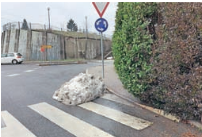
Še kar nekaj prostora je za izboljšave.

Vselej je dobro imeti v mislih, da je infrastruktura, ki je načrtovana in prilagojena ranljivim skupinam, primerna za nas vse.