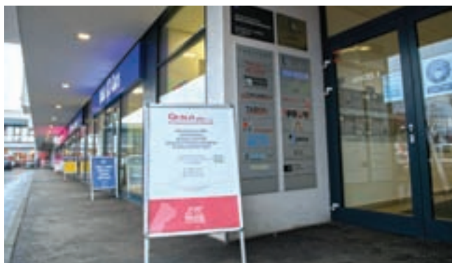
Vhod v poslovne prostore podjetja v trgovsko-poslovnem centru Spar v središču Medvod

ve v regiji ni bilo enostavno, vendar jim je uspelo. "Kot edini nosilec dejavnosti v občini Medvode s širšo okolico predstavljamo pomembno dodano vrednost, razbremenili smo Krajevni urad, saj poslujemo tudi v sedaj že dolgem obdobju epidemije, seveda ob doslednem upoštevanju vseh preventivnih ukrepov. Pri nas čakalnih vrst ni, stranke pozivamo, naj le izkoristijo to možnost in vse postopke, povezane z registracijo, prenosi lastništva, izdajo tablic in prometnih dovoljenj, uredijo v naši enoti. Veseli bomo, če informacijo o naših storitvah ter lokaciji po-