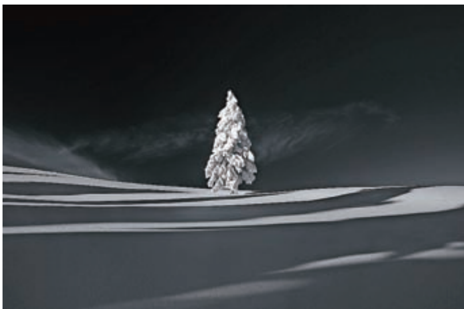
Fotografija Samotno drevo je bila razglašena za najboljšo na aktualni razstavi Pokrajina 2021.

"Sicer v glavnem fotografiram za svoj arhiv in doslej razen na kakšno društveno razstavo fotografij nisem pošiljal na različne natečaje. To sta tudi prvi nagradi na tem nivoju," med drugim še doda avtor letošnje najboljše pokrajine in razkrije, da je obe nagrajeni fotografiji posnel 9. januarja letos na Veliki planini.