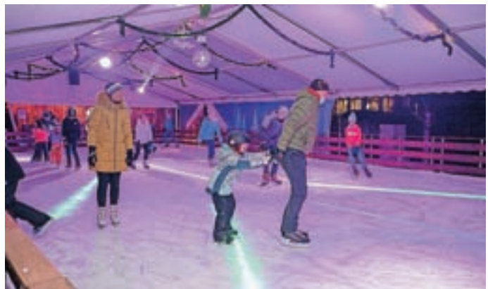
Drsališče bo, če bodo razmere to dopuščale, odprto do konca januarja.

mask. Število obiskovalcev so omejili na šestdeset, in sicer dvajset v gostinskem lokalu, dvajset na drsališču in dvajset ob drsališču. Med tednom je drsališče odprto od 15. do 21. ure, ob koncih tedna pa od 9. do 21. ure. Možna je tudi izposoja drsalk in drsalnih pingvinov.