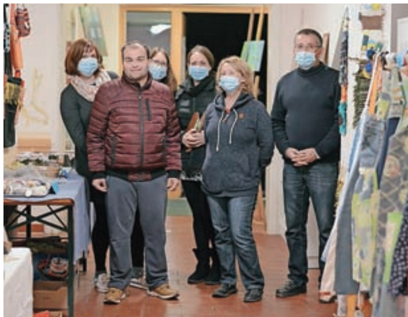
Sejem je priložnost, da pokažejo, kaj so delali čez leto.

"Tokrat je na voljo vse, kar smo letos izdelovali, kar pomeni različne slike, leseni izdelki (pručke, lesene smrečice, lesene kravate, metuljčki, okraski, kot so ribe, ptički ..., deske za rezanje, lesena masažna mila, leseni obeski), izdelki iz filca (od obeskov do igračk in podstavkov za topel čaj), torbice, predpasniki, na voljo so tudi čaji in druga zelišča, posušena na naših sušilnicah, ki jih je prav tako moč kupiti. Tu so še voščilnice, svečke in še marsikaj. Vsak izdelek je unikatnen. Vem, koliko truda je bilo vložena vanj, koliko sreče je prinesel, ko je