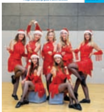
Na naslovnici: Plesna skupina Dance Ladies