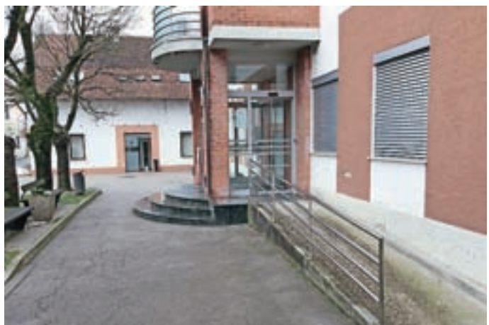
Urbani prostor okoli občine je vzorno urejen.