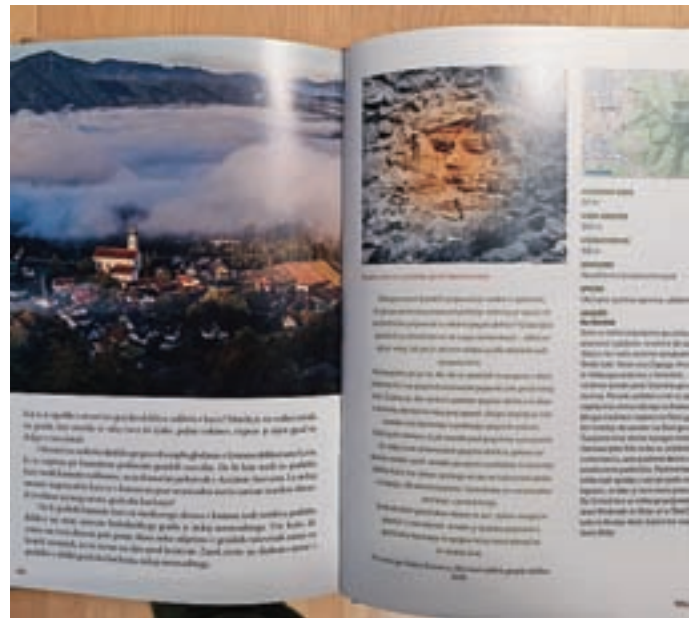
Izmed stoterih pripovedi, ki jih hrani gorenjska ljudska zakladnica, jih vodnik obuja trideset. Ena izmed teh je tudi Smledniški grad in zakleta deklica.

Izmed stoterih pripovedi, ki jih hrani gorenjska ljudska zakladnica, jih vodnik obuja trideset ter opisuje poti in cilje, po katerih jim sledimo po dolini reke Save. Začnemo na njenem desnem bregu iz Ljubljane z Ljubljanskim gradom, nadaljujemo z Jeterbenkom, Lubnikom, Dolino Triglavskih jezer in krnico Za Akom. Potovanje na tej strani Save zaključimo z dolino Tamar in tremi sestrskimi rekami Dravo, Savo in Sočo, zavijemo navzdol po levem bregu Save, obiščemo Dovško Babo, gremo mimo Krvavca ter zaključimo s smledniškim Starim gradom in Šmarno goro. Vodnik je v prvi vrsti namenjen družinam.