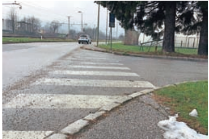
Infrastruktura, ki je načrtovana in prilagojena ranljivim skupinam, je primerna za vse.