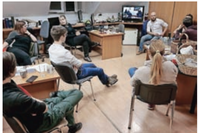
Ekipe Televizije Medvode je že trideseto leto zapored v sklopu Tedna Karitas predvajala oddajo Klic dobrote, v kateri vsako leto zbirajo tudi sredstva za tiste, ki jih potrebujejo. Tako je bilo tudi letos. M. B.