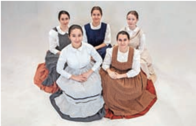
Folklorniki in folklornice KUD Oton Župančič iz Sore so pretekli konec tedna pozirali pred fotografskim objektivom z namenom dokumentiranja oblek, v katerih nastopajo. Pravijo jim Finžgarjeva noša, ker so take, kot so jih v naših krajih nosili pred nekaj več kot sto leti. P. K.