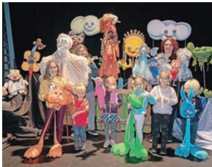
Po predstavi so si otroci lahko ogledali razstavo lutk iz bogatega arhiva društva in se z njimi poigrali.