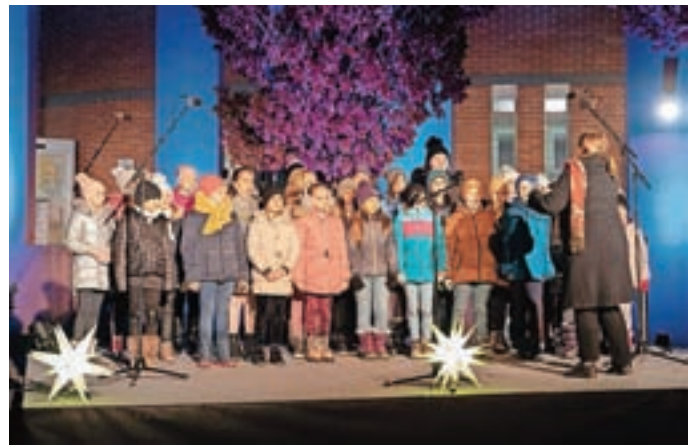
Prireditev Prižig prazničnih luči je s pesmijo obogatil tudi otroški pevski zbor OŠ Medvode.