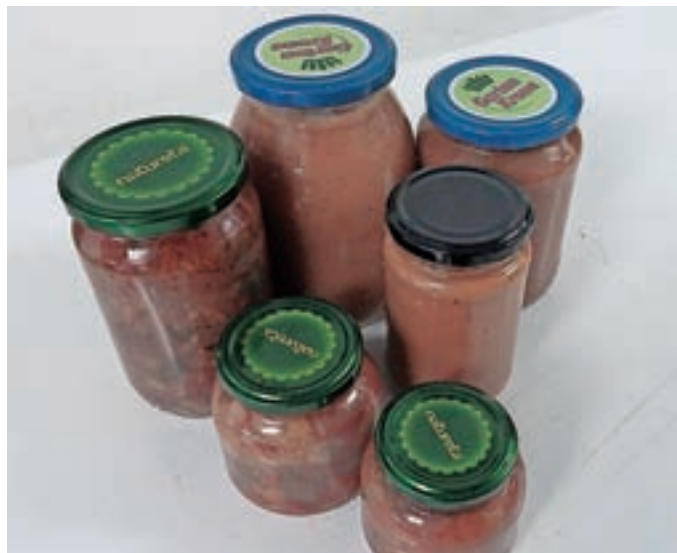
Omaka iz paradižnika in druge zelenjave

Vse sestavine operemo in jih narežemo (paradižnik na rezine, bučke očistimo pešk in narežemo na kocke, jajčevce na kocke, zeleno na kocke, čebulo čim bolj na drobno). V veliko posodo damo olje in seseklano čebulo, ki jo popražimo, dodamo por, paradižnik in vse, kar ste pripravili. Baziliko narezano dodajamo proti koncu dušenja. Vse sestavine morajo biti dušene do mehkega, solimo in mešamo zelo pogosto, da se nam ne prime na dno. Pri soli ni treba pretiravati, dodate je toliko, da je jed okusna. Posodo odstavimo in s paličnim mešalnikom pretlačimo vse sestavine, tako da ni nobenega celega koščka več. Posodo ponovno postavimo na štedilnik in na najmanjši možni temperaturi kuhamo še približno 30 minut.