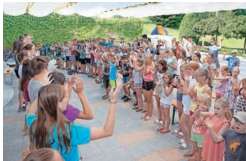
Oratorija v Sori se je udeležilo 97 otrok in petdeset animatorjev.

Za uspešno izvedbo oratorija je potrebno veliko rok in različnih talentov. Med animatorji morajo biti glasbeniki, igralci, vzgojitelji in zabavljači. "Animatorjev ne iščemo, po navadi