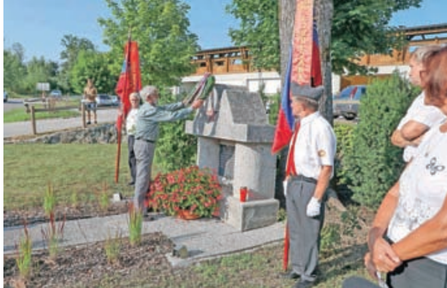
Žrtvam nacističnega okupatorja so se poklonili s polaganjem vencev.