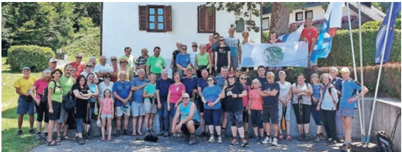
S petim pohodom od Jakoba do Jakoba se je 10. julija zaključilo letošnje praznovanje občinskega praznika občine Medvode. Nekaj čez petdeset pohodnikov ga je zaključilo pred rojstno hišo Jakoba Aljaža v Zavrhu. M. B.