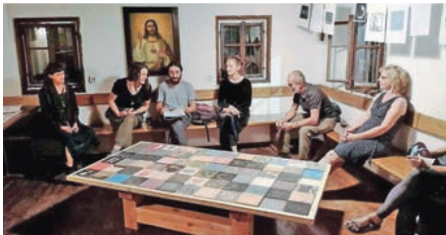
Razstava je zasnovana tako, da se dela umetnikov med seboj prepletajo. Glavni eksponat je MI:ZA.

Odprtju razstave so sledili že novi dogodki. Na Sv. Marjeti je bila 28. avgusta otroška delavnica ustvarjanja grafik, 4. septembra delavnica ustvarjanja grafik za odrasle in pogovor o življenju z umetnostjo (kaj pozitivnega prinaša sodobna umetnost v današnjem času). Prihodnji mesec bo sledila še predstavitev razstave na Domačiji pr' Lenart. Projekt poteka na treh lokacijah sredi Polhograjskega hribovja: Žlebe – Sv. Marjeta, kjer je glavni razstavni prostor, Belo – Domačija pr' Lenart, Topol – Sv. Katarina in Trzin (v poslovnih prostorih podjetja BB BIO.Si).