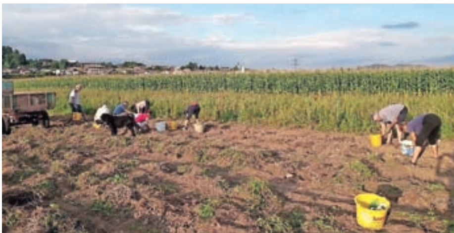
Krompir so pobirali na tradicionalen način. Letos ga je manj in je bolj droben.