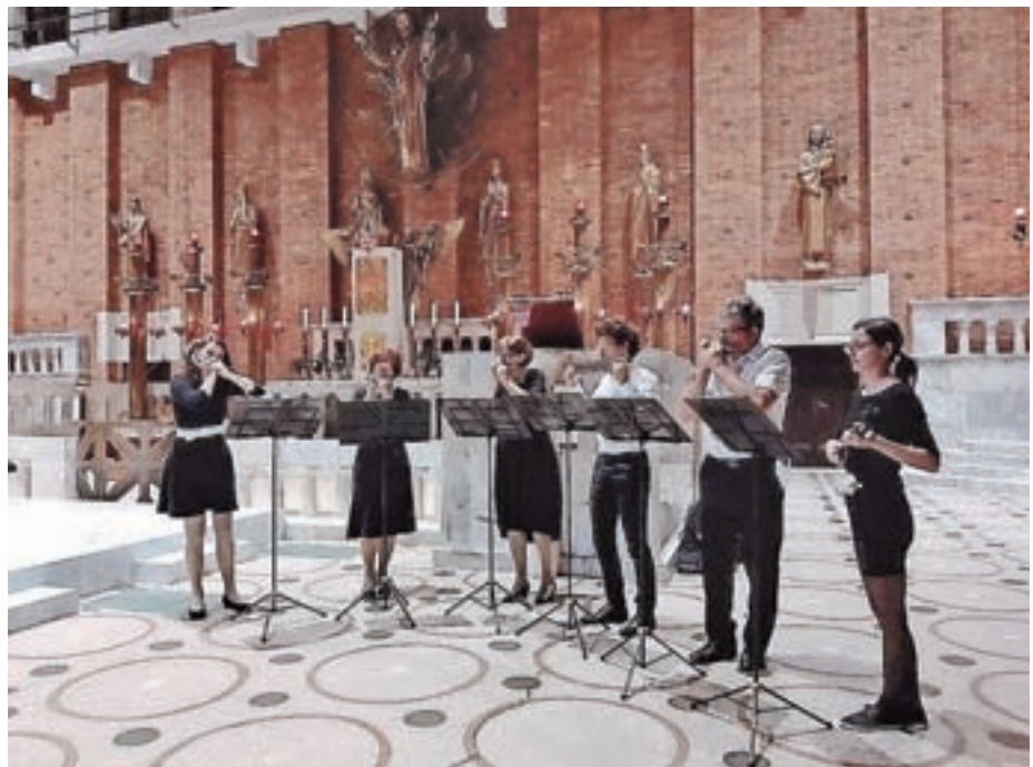
Sorški orgličarji med nastopom v cerkvi Srca Jezusovega v Pragi, kjer je bila osrednja prireditev festivala