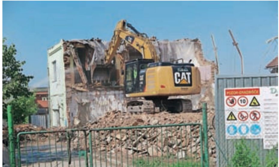
Poleti so porušili stari vrtec v Valburgi, stavbo, ki je bila stara skoraj sto deset let.

V Valburgi je v avgustu potekala rušitev starega vrtca, ki je že zaključena. Stavba je bila zgrajena leta 1912. Prvotno je bila v njej gostilna s kegljiščem. Enota vrtca se je tam odprla v marcu 1979. Zaradi prostorske stiske v Vrtcu Medvode je Občina Medvode leta 2012 zgradila nov sodoben nizkoenergijski leseni vrtec v neposredni bližini starega. Ustreza vsem normativom in je bil zgrajen kot nadomestek staremu vrtcu. "Stara stavba bi morala biti po izgradnji novega vrtca porušena, vendar pa se je število otrok, vključenih v Vrtec Medvode, naglo povečevalo in je stari vrtec ostal v uporabi tudi po odprtju novega, saj so bile polno zasedene vse enote Vrtca Medvode in v nasprotnem primeru treh oddelkov otrok ne bi mogli sprejeti. Stari vrtec v Valburgi ni več ustrezal sodobnim standardom, bil je tudi energetsko potraten, po vsakem inšpekcijskem pregledu pa je bilo treba odpraviti več pomanjkljivosti, da je sploh še lahko ostal odprt. Inšpekcijska odločba iz leta 2019 je naložila zaprtje vrtca do letošnjega poletja, saj zaradi dotrajanosti objekta sanacija ni bila smiselna. V vmesnem času smo z Vrtcem Medvode pregledali vse možno-