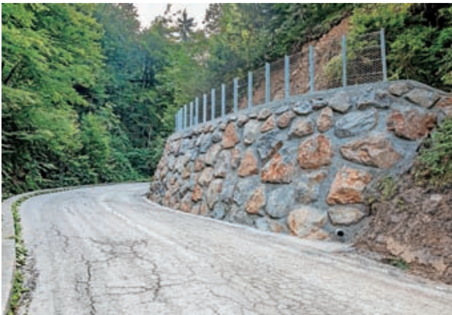
Plaz ob cesti Trnovec-Topol je saniran.

Dela je izvajalo podjetje HNG, njihova vrednost pa je dobrih 26 tisoč evrov.