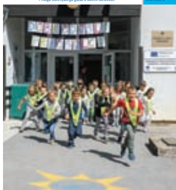
Prvi šolski dan na Osnovni šoli Medvode