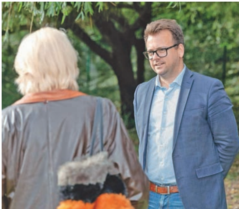
Župan Nejc Smole na enem izmed dogodkov

Predaja gasilskega vozila 16/15 Prosto-vojnemu gasilskemu društvu Preska - Medvode je najprej pomembno zato, ker gre za vozilo, ki so ga naši operativni gasilci nujno potrebovali. Z njim zvišujemo tehnično opremljenost za posredovanje v najzahtevnejših intervencijah. Hkrati pa je bil nov krog nakupa vozil pomemben tudi zato, da se pred začetkom dogovori način nakupov gasilskih vozil. Pred več kot dvajsetimi leti se je začel prvi krog in tedaj so bili dogovori jasni. Nato pa so iz nakupa v nakup bolj bledela določila in merila. To ne le, da ni pošteno do vseh gasilskih društev, meče čudno luč na celotno področje zaščite in reševanja. Zato sem toliko bolj vesel, da smo našli skupni jezik z Gasilsko zvezo Medvode in sklenili nov dogovor, ki so ga podpisala vsa društva, zveza in Občina Medvode. Ver-