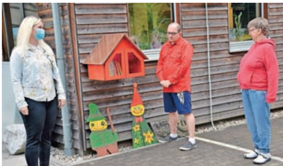
Prvo knjižno hišico v sklopu projekta Medvode: Povezana skupnost bralcev so postavili in odprli na stavbi delavnic društva Barka.