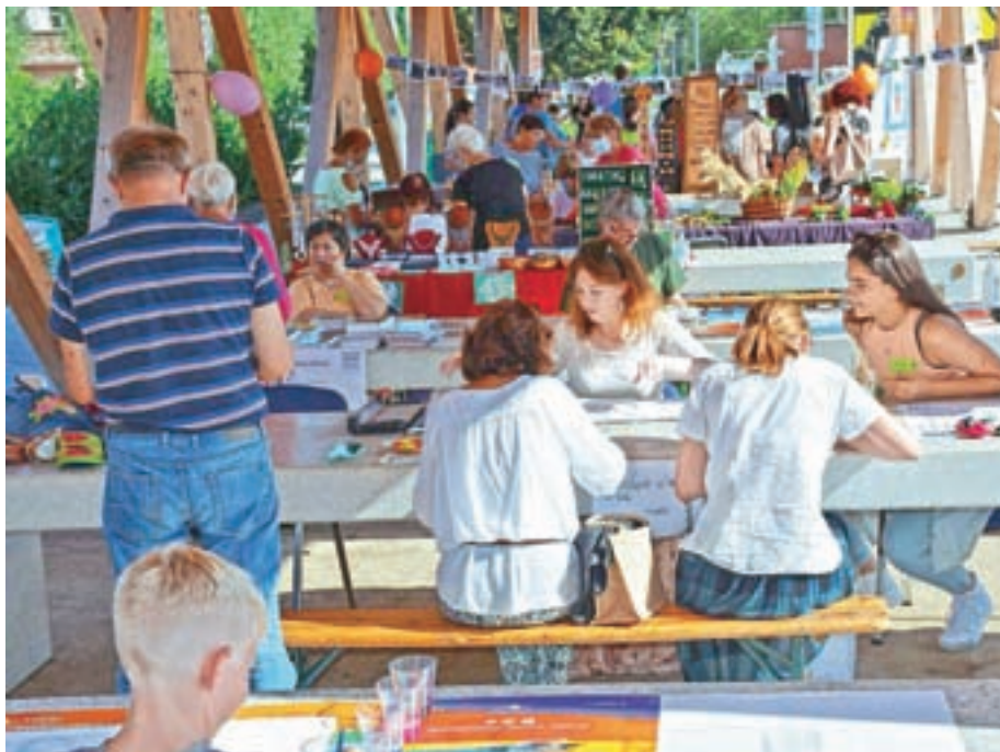
Tržnica znanj je v Medvode privabila številne obiskovalce, ki so bili željni novih znanj, veščin, informacij ...

To je bil osrednji dogodek na območju krajev ob Sori in Savi, za izvedbo katerega je poskrbel območni koordinator Kulturno društvo Sejalec umetnosti. "Vesela sem, da nam je Tržnico znanj uspelo organizirati tudi letos. Zbralo se je več kot štirideset različnih posameznikov in organizacij, ki širijo svoja znanja in veščine. Več kot devetdeset odstotkov članov naše mreže iz krajev ob Sori in Savi se je odzvalo in so danes tukaj. Znanje predajajo številnim obiskovalcem, ki se lahko seznanijo z različnimi metodami učenja, priložnostmi, ki jim jih znanje lahko ponudi. Ti se lahko ustavijo na več kot dvajsetih različnih stojnicah, na katerih se predstavljajo šole, vrtec, različni ustvarjalci, tudi upokoenci ... Skratka, kar brni od vse volje do delitve znanja in veščin. Marsikdo bo danes domov odšel bogatejši in se ponovno vračal vsaj h kakšnemu posamezniku, ki ga bo tukaj srečal. Vse skupaj je povezano med generacijami, med podjetji, vzpostavljen je tudi medkulturni dialog. V Tednih vseživljenjskega učenja bomo širili znanja in veščine od 4. septembra pa vse do 9. oktobra malo bolj naglas, sicer pa tudi vse leto – in se prihodnje