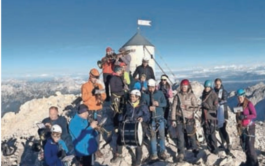
Godba Medvode se je na Triglav prvič odpravila leta 1959 ob 30-letnici delovanja društva, nato pa vsakih dvajset let. Letos so bili tako na vrhu Slovenije četrtič in tam zaigrali nekaj skladb.