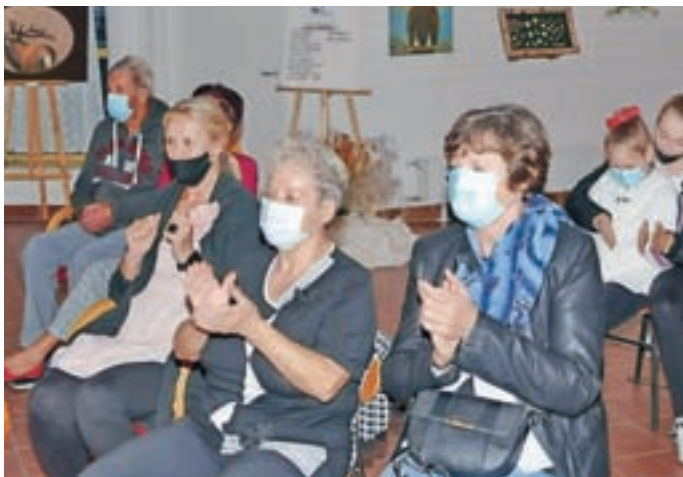
Utrinek z odprtja razstave Svet živali

Člani likovne sekcije KUD Pirniče so za načrtovano razstavo ob materinskem dnevu pripravili nova dela. Zaradi epidemije covid-19 dogodka ob odprtju razstave ni bilo, dela pa so kljub vsemu postavili na ogled. Avlo doma krajanov v Pirničah so krasila do 25. septembra.