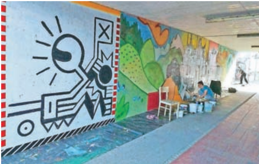
Potekalo je grafitiranje še drugega zidu v podhodu krožišča na Gorenjski cesti.