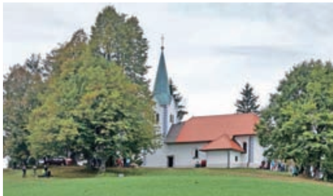
Z obnovo fasade se je zaključila obnova cerkve sv. Mohorja in Fortunata na Osolniku.