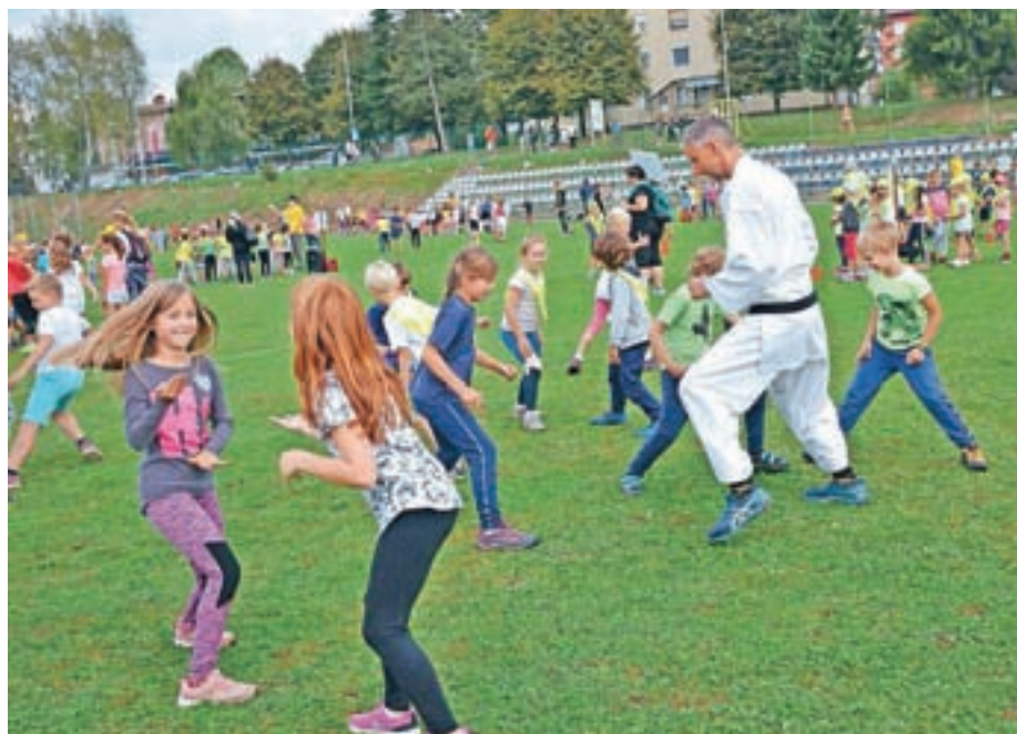
Mini olimpijci so na gibalnih izzivih spoznavali različne športe.