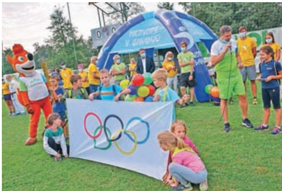
Dogodek se je začel z olimpijskim protokolom.