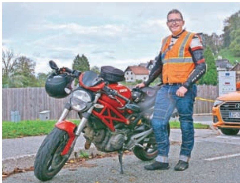
Ko ima čas, rad sede na motor. Kot prostovoljec motorist se udeležuje tudi kolesarskih dirk, kakršna je bila v nedeljo v Škofji Loki.

Mislím, da se izboljšuje in da k temu vsako leto veliko prispeva prav mesec požarne varnosti z aktivnostmi društev, še posebej dnevi odprtih vrat, ki so bila vsa leta dobro obiskana. Prodalo se je veliko gasilnikov, občani so jih prinašali na servis ... Vsaka preventivna dejavnost, ki pride do ljudi, ki se je zavedajo, je zagotovo zelo dober ukrep zato, da imamo gasilci potem na samih intervencijah manj dela. To, da je oktober mesec požarne varnosti, je že kar prišlo v zavest občanov.