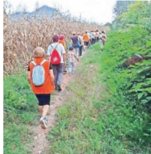
V tednu mobilnosti so bili organizirani tudi pohodi.

Namesto motornih vozil so center Medvod zavzele gare. Obiskovalci so si lahko na razstavi ogledali ta leseni, enosni ročni voziček, ki je bil v osnovi namenjen za pomoč pri kmečkih opravilih. Na potujoči razstavi KUD Fran Saleški Finžgar Senica in njegove sekcije Društva ljubiteljev starin Gare je več vrst gar in podobnih vozičkov. Na Senici so po dolgih letih oživili zanimivo tradicijo. Seničani so namreč gare uporabljali tudi za zabavo. Prirejali so dirke, kjer so mladi fantje z garami tekmovali za zmago, predvsem pa za dekletovo pozornost. Danes je Dirka z garami za VN Senice postala tradicionalna prireditev.