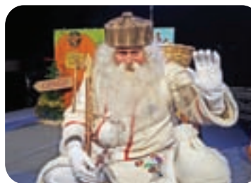
PREDSTAVA NAGAJIVA SNEŽINKA in OBISK DEDKA MRAZA - 27. 12.