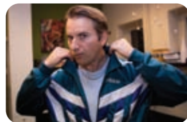
MONOKOMEDIJA SLABA DRUŽBA - 14. 12.