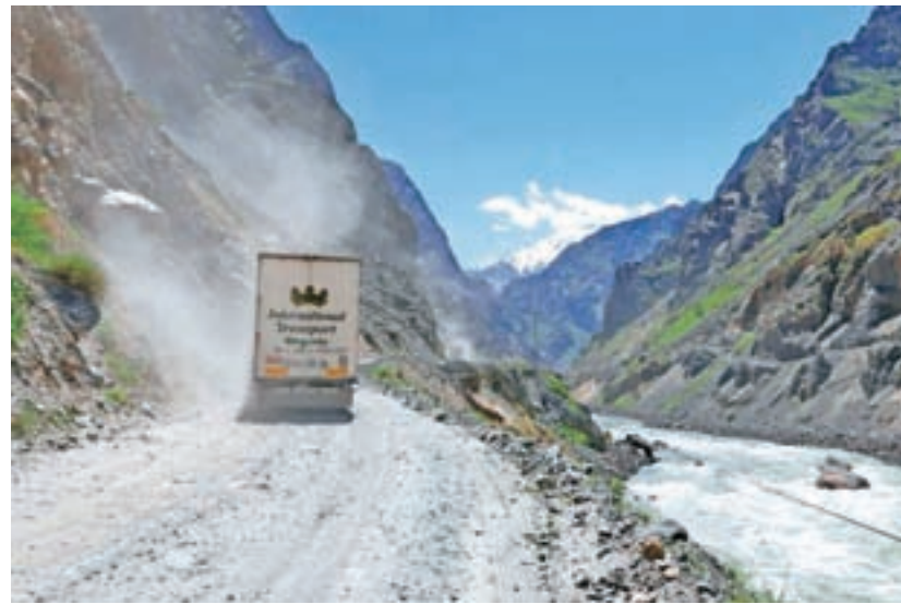
Na levi strani reke je Tadžikistan, na desni Afganistan. Ceste so slabe.

Sledilo je gorovje Pamir. Za vstop vanj je potreben vizum, ki ga preverjajo na več točkah. Pot je bila vse prej kot lahka. "Proti Pamirju blatna cesta, prijemalo se je za sandale, da sem bil včasih višji, pa spet nižji. Gledati moraš pod noge, ker je polno lukenj, jam. Ta stalna koncentracija te ubija še bolj kot kilome-