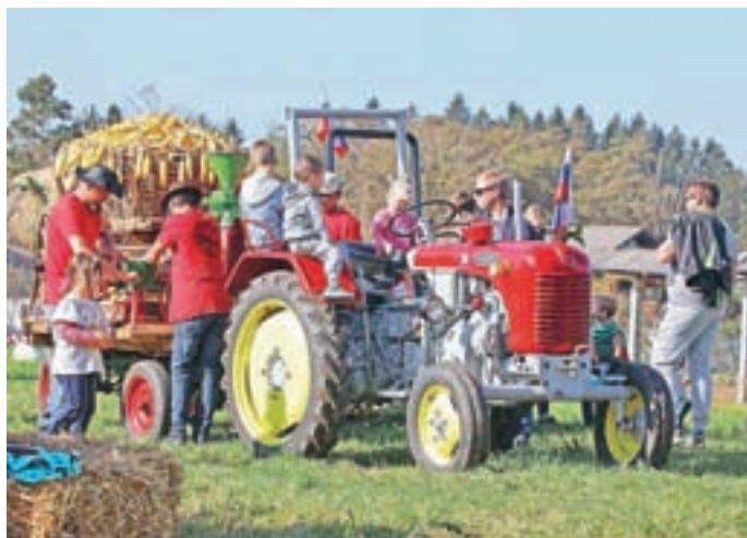
Traktoristi iz Voklega so predstavili kmetijsko mehanizacijo.