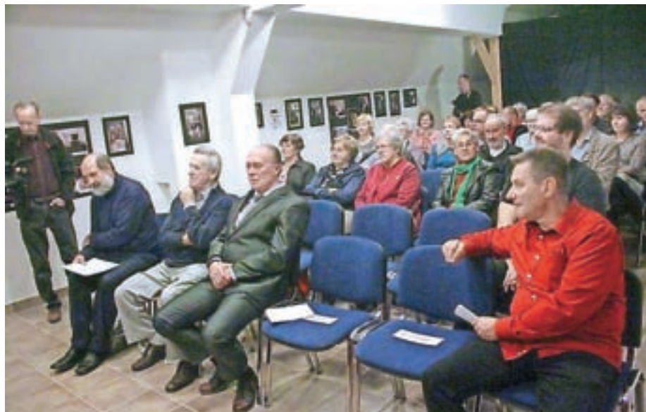
Utrinek z odprtja razstave