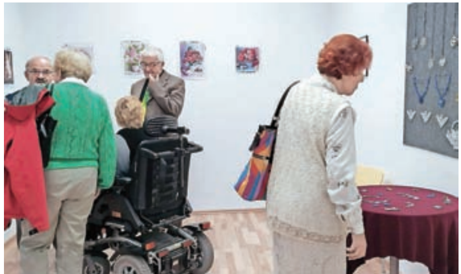
Utrinek s prvega srečanja, na katerem so odprli razstavo ročnih del, čipk in slik