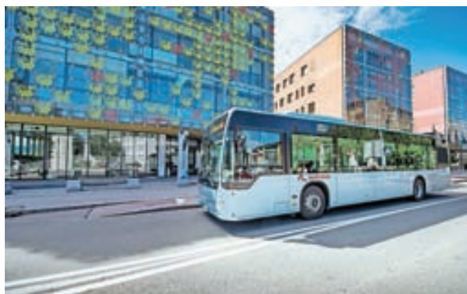
Brezplačno z javnim prevozom po celi Sloveniji

Z izboljšavami zakona o prevozih v cestnem prometu želijo na ministrstvu za infrastrukturo doseči povečanje števila potnikov javnega potniškega prometa in tako posredno zmanjšati vplive prometa na okolje. Medkrajevne povezave država že danes financira oziroma sofinancira, ne glede na to, ali so avtobusi in vlaki na pol prazni ali pa čisto prazni. Zapolnitev teh praznih mest na avtobusih z upokojenecem, ki za prevoze ne