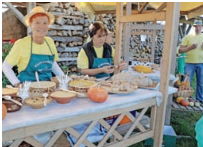
Domačinke so pripravile tradicionalne lokalne jedi.