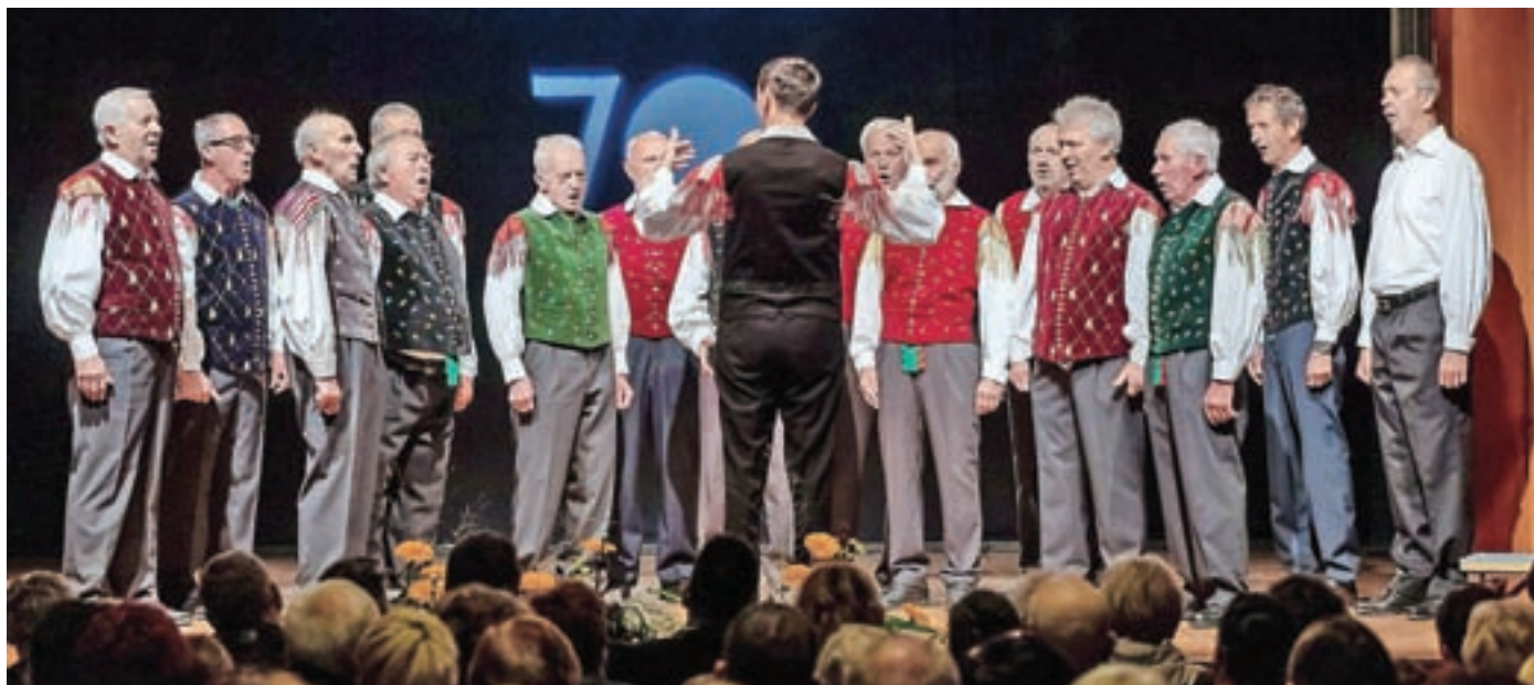
V programu ob jubileju so predstavili, s čim vse se v društvu ukvarjajo. Pevci imajo dolgo tradicijo.

naš današnji jubilej. Upam si trditi, da organizirano sorško ljubiteljsko kulturno snovanje sega globoko v 19. stoletje, o čemer pričajo tudi stari zapisi. Ohranjanje tradicije ter ljudskega izročila je nedvomno med drugim naša dolžnost in poslanstvo. Nekoč še pred drugo vojno in nekaj časa po njej, ko denimo miklavževanje še ni bilo tako uveljavljeno v slovenskem prostoru, je bil to v Sori že uveljavljen dogodek, ki so ga občudovali tudi zunaj naših krajev. Sorčani so že takrat z domiselnim, za današnje čase tehnično nerodnim prikazovanjem pekla in s kurjenjem pod odrom starega kulturnega doma pričarali za tiste čase podobo, ki je navduševala. Tradicijo miklavževanja nadaljujemo še danes. Zasluge za razvoj ljubiteljske kulture imajo številni Sorčani in ljudje, ki so