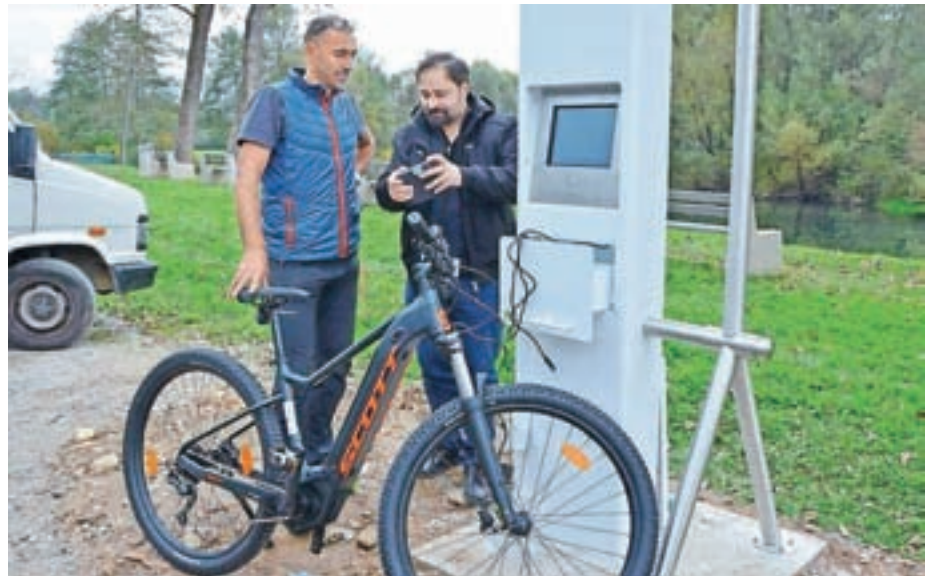
Na Kopaljšču Sora v Goričanah je postavljena solarna polnilnica.

V uporabo so predali polnilnice za električna kolesa, ki so v Medvodah, Zbiljah, Goričanah in na Topolu.