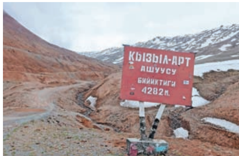
Na poti je premagal kar nekaj visokih prelazov.

tri, ki jih prehodiš. Zadnji del je bil visoki Pamir s pogledom na vrhove, visoke več kot sedem tisoč metrov. Bližal sem se meji s Kirgizijo, užival ob pogledu na Karakulsko jezero, čakal me je še 4655 visok prelaz Bantal. Opozarjali so me na nevarnost volkov in medvedov, a se nisem dal. Ni pa bilo ravno prijetno, ko sem nekaj sto metrov stran zagledal trop volkov in odtise medvedjih tac. Vremenske razmere so bile izjemno slabe. Pihal je močan nasprotni veter, da sem povsem izgubil občutek za vodoravni položaj. Začelo je še močno snežiti. Oblekel sem vse, kar sem imel s seboj, pa me je še vedno zelo zeblo. Lahko rečem, da sem prvič v življenju v takšnem smislu zares garal, da sem prišel do meje s Kirgizistanom. Tam sem se lahko vsaj malo pogrel in se odločil, da se do mesta, do katerega je bilo še trideset kilometrov, odpeljem s prvim, ki me bo lahko peljal. Moj načrt je bil od tam pešačiti še do Oša in naprej do Biškeka. Naredil sem pet kilometrov, a ni šlo več. Pot se je zaključila okrog osemsto kilometrov pred načrtovanim ciljem. Nadaljeval sem jo v avtomobilu, nato do prestolnice Biškeka in nazaj k domačim," je slikovito ponazoril razmere. Domači so ob njegovih za večino nenavadnih popotniških avanturah razumljivo v skrbeh. "Signal je bil skorajda povsod in razen nekaj dni sem lahko vsak dan poslal sporočilo, da sem dobro," je pojasnil še eno podrobnost s sicer zanimive svilne poti, po kateri se namerava naprej proti Kitajski podati že prihodnje leto.