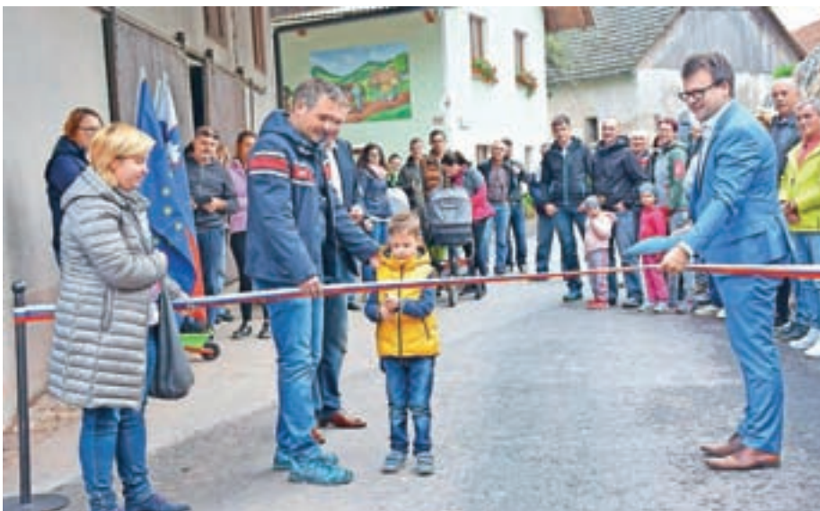
Odprtju ceste je sledilo srečanje vaščanov.

In dosežki prejšnjega mandata? Mrak je poudaril urejanje vodotokov, obnovljena sta bila dva vodohrana. Nadaljevali so aktivnosti za preplastitev omenjenega odseka ceste, za kar je bilo potrebnega veliko usklajevanja in projektiranja, saj poteka po ozemlju štirih različnih lastnikov. Začeli so urejati tudi ekološki otok.