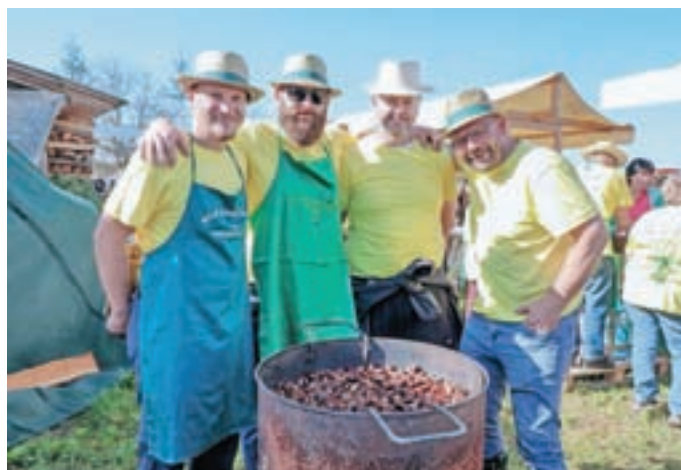
Člani TD Dragočjana - Moše so skrbeli za peko kostanja.