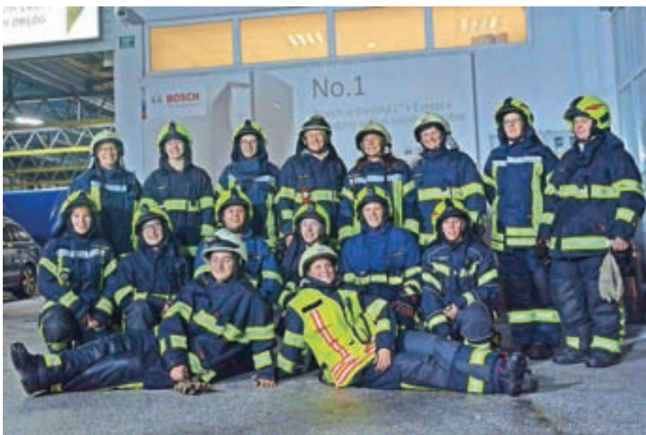
Gasilke na vaji v organizaciji Komisije za članice Gasilske zveze Medvode