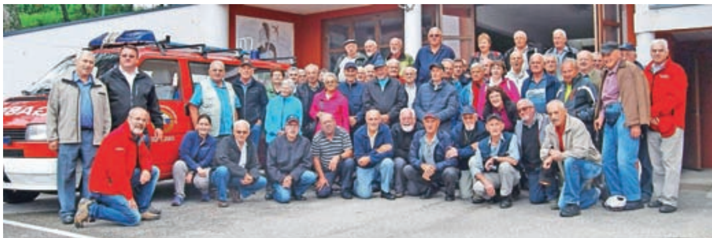
Gasilski veterani in predstavniki vodstva Gasilske zveze Medvode na letošnjem izletu