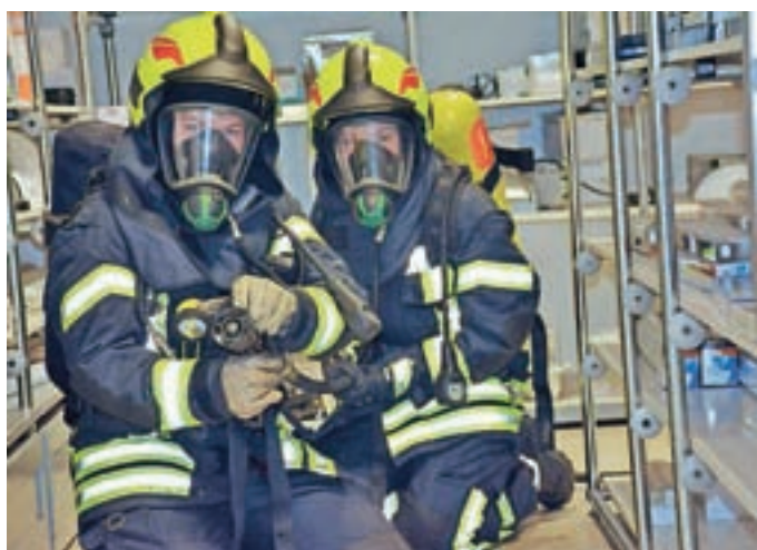
Gasilke so izvedle tudi dva notranja napada.

motivacija, da gre še kakšna več na tečaj, da bi se morda v večji meri udeleževale intervencij. Udeležujemo se jih že sedaj, naše naloge pa so od zavarovanja cest do prve pomoči, sestave vode do trojaka, medtem ko notranjih napadov načeloma ne izvajamo." Vaja članic ni vsako leto, na zadnje je bila pred dvema letoma v Sori. Potekala je pod budnim očesom vodstva Gasilske zveze Medvode. Le nekaj dni kasneje je potekala vaja delovanja sistema zaščite in reševanja na lokaciji podjetja Helios – obrat Color Preska, pred trgovskim centrom Spar pa je Komisija za preventivo Gasilske zveze Medvode pripravila Preventivni dan. V Knjižnici Medvode je potekalo tudi predavanje na temo požarne varnosti v večstanovanjskih objektih, vodil pa ga je Boštjan Gortnar iz PGD Preska - Medvode.