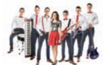
ANSAMBEL KERLCI - 31. 12.