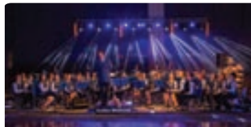
90 LET GODBE MEDVODE - 22. 12.