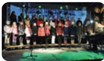
PRIŽIG PRAZNIČNIH LUČI - 6. 12.