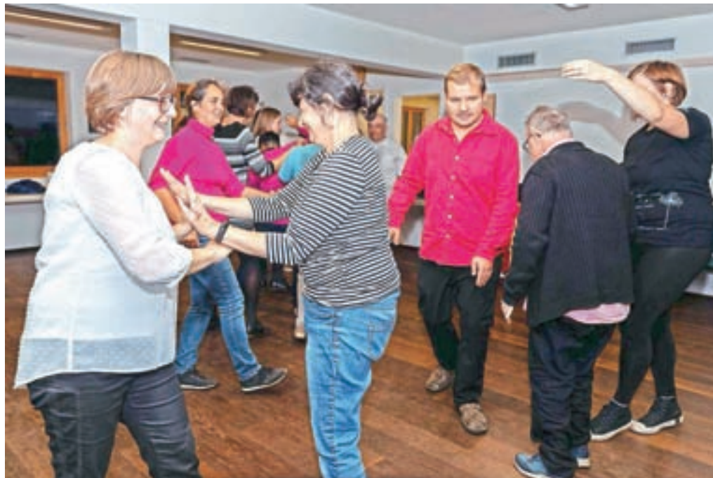
Na gibalnih delavnicah raziskujejo gib in snujejo projekte.