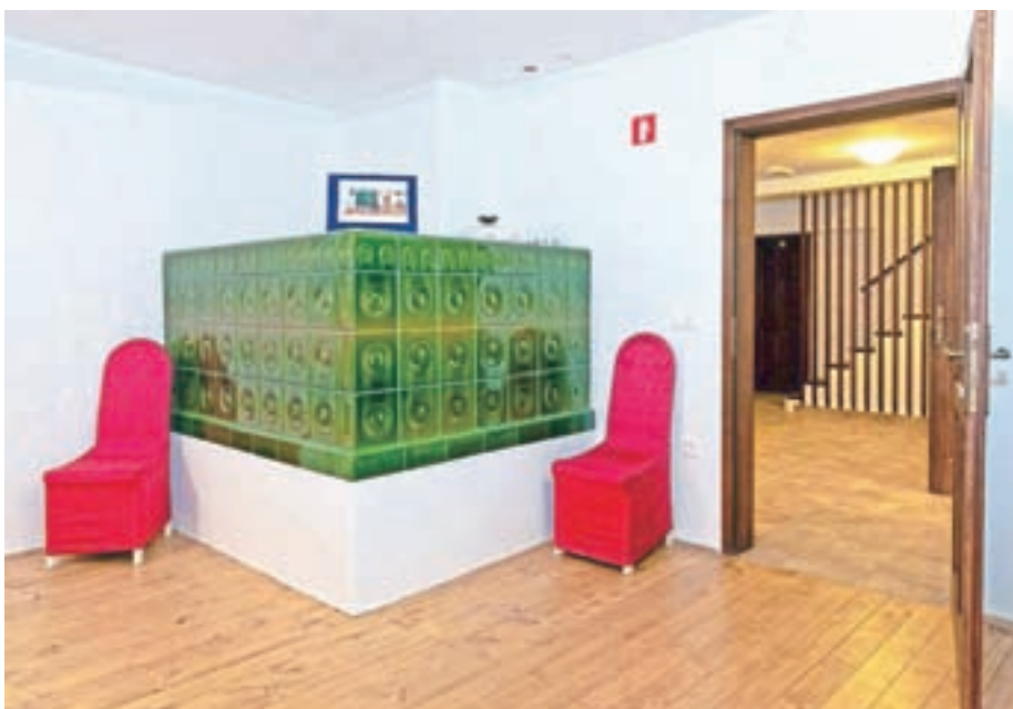
V sklopu zadnje prenovitve je bila v hiši zgrajena krušna peč.

V rojstni hiši Jakoba Aljaža sicer zadnja leta potekajo številni dogodki v organizaciji KUD JaReM, ki je najemnik hiše. Pogodba je podpisana z Javnim zavodom Sotočje.