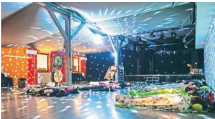
Zvočna kopel z gongi je meditacijsko-sprostitvena tehnika, ki pomaga pri umirjanju uma in sproščanju telesa.

prav tako tudi naši organi, celice, DNK. Gongi delujejo direktno na celotno telo, saj so instrument z največjim razponom tonov in vibracij. Gongi proizvajajo tudi zvoke izven našega slušnega polja. Zvok je fraktalen, pravijo mu tudi zvok veselja. Poznamo kar nekaj vrst starodavnih gongov, sam pri zvočni kopeli uporabljam vetrni gong in Planetarni gong." Vizek še zaupa, da zvok gonga uravnava delovanje obeh možganskih polobel. "Naše telo nekaj zvoka odbije, nekaj ga absorbira, nekaj pa ga spusti skozi. Frekvence gonga so harmonične, zato na telo in um delujejo pozitivno. Večino zvoka zaznavamo s pomočjo čutila za sluh, nekaj pa tudi s čutili za tip. Ko se prostor, kjer se igra gong, napolni z zvokom, nastane zvočni 'bazen', čemur pravimo kopanje v zvoku ali zvočna kopel. Še nekaj časa po kopeli je naše telo uglaseno na naravno frekvenco," je dejal Vizek in sklenil: "Med samo gong meditacijo se spusti valovanje možganov na frekvenco, podobno tisti, preden zaspijo, tudi pod štiri herce. To pomeni, da se naša zavest umika in vstopamo v podzavest. Ko vstopimo v to stanje, lahko prenesemo svoje zavestne odločitve v podzavestne. Tako se nam cilji hitreje uresničujejo. V tem stanju budnega sanjanja se osvobajamo strahov, negativnih vzorcev ter blokad in zastalih energij."