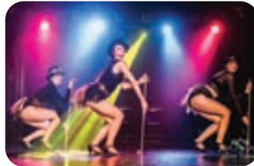
BOŽIČNI KABARE - 15. 12.