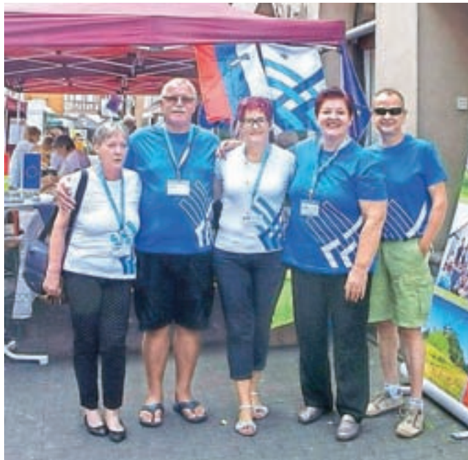
Medvoška ekipa pri pripravi stojnice na Festivalu kulture v Niddi

Na ulicah okoli mestnega trga so prebivalci Nidde iz drugih držav postavili stojnice, na katerih so ponujali svoje tradicionalne jedi. Stojnice, namenjene promociji svojih krajev, smo imeli tudi predstavniki iz pobratenih in prijateljskih mest. Tudi Medvoščani smo mimoidočim v sliki in besedi predstavili domačo občino.