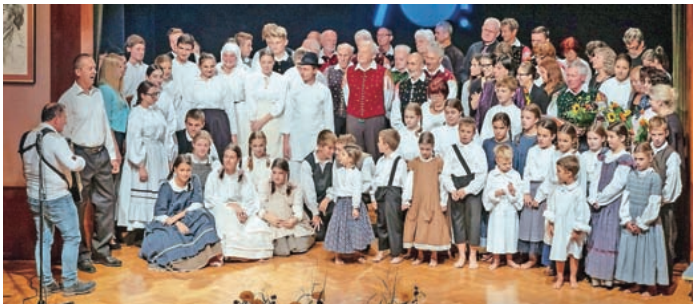
Družina, ki je praznovala sedemdeset let društva