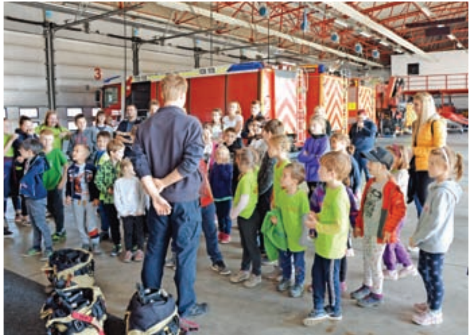
Izleta se je udeležilo nekaj več kot 160 otrok in mentorjev iz vseh šestih prostovoljnih gasilskih društev. Ogledali so si tudi Gasilsko reševalno službo Kranj.

Ideja je bila pozitivno sprejeta med vsemi medvoškimi prostovoljnimi gasilskimi društvi, saj se je izleta udeležilo nekaj več kot 160 otrok in mentorjev iz vseh šestih društev. Otroci so si skupaj z mentorji ogledali Gasilsko reševalno službo Kranj, kjer so jim poklicni gasilci predstavili svoje delo in opremo. V drugem delu izleta so se v skupinah pomerili v bowlingu, na koncu pa so se vsi skupaj zbrali na malici in druženju pod kozolcem PGD Spodnje Pirniče - Vikrče - Zavrh. Mentorji mladine upajo, da bodo takšni izleti postali tradicionalni, saj spodbujajo povezovanje med otroki in s tem tudi sodelovanje med društvi.