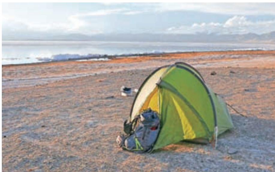
Njegov "hotel" – vsak dan na drugi lokaciji

Njegova pot se je začela v Samarkandu, enem izmed najstarejših mest na svetu in najbolj znanem mestu sodobnega Uzbekistana. V spominu so mu ostala svetišča, lepe ceste in tudi dogodek na meji s Tadžikistanom. "Rekli so mi, da mi vizum velja šele od naslednjega dne in da moram počakati. Postavil sem šo-