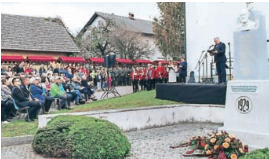
Osrednji vsakoletni poklon Simonu Jenku je bil ob spomeniku na Podreči.

Številne prireditve v spomin pesniku Simonu Jenku ob stopetdeseti obletnici njegove smrti.